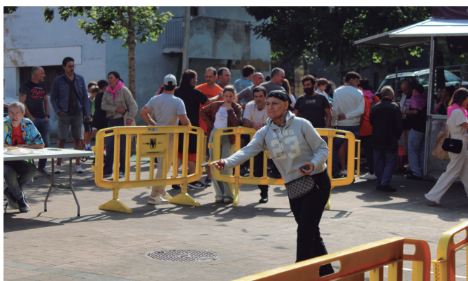
Txantxa gutxi izan zen toka txapelketako lehiakideen artean.