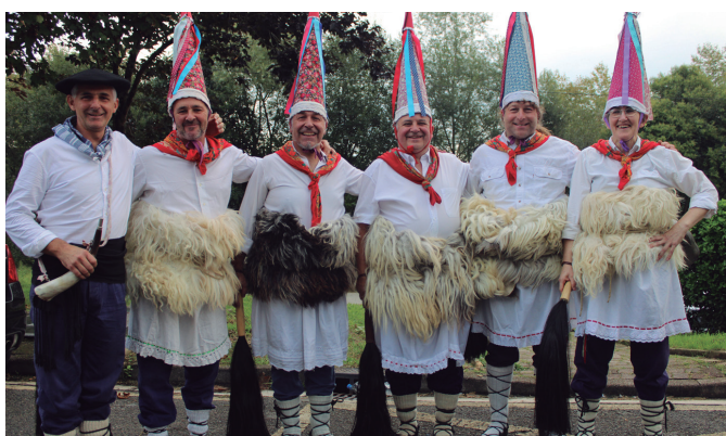
Usurbilgo joaldunak kide berri batekin, Santuenea girotzera abiatu aurretik.