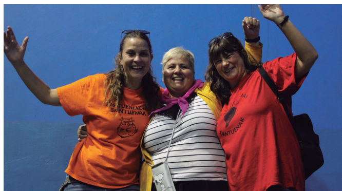
Santuenea K.E.-ren logo lehiaketako lau finalistetako hiru.