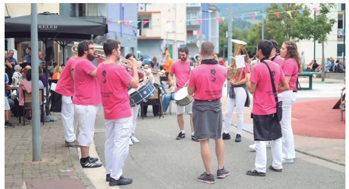
Burrumbazale txarangak kalejiran hedatu zuen festa giroa auzoan barrena.