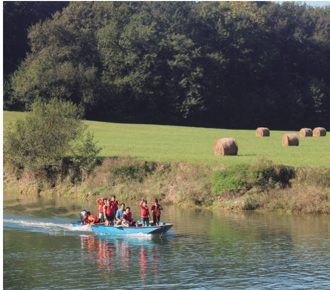
'Gozatu errioz' ekimenari esker, piraguan, alan edota arraunean ibiltzeko aukera izango da urriaren 12an.