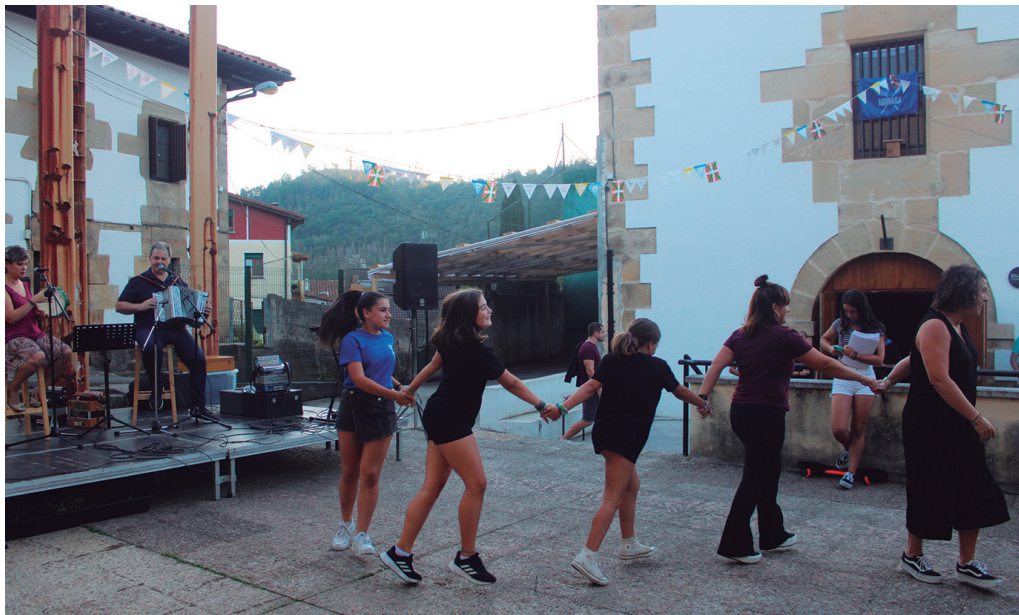
Dantzan aritzeko aukera izango da Aginaga partean. Hiru erromeria saio topatu ditugu jai egitarauan.