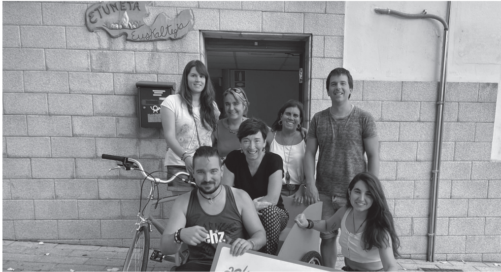
Maila guztietako ikastaroak eskainiko dituzte Etumeta AEK euskaltegian.