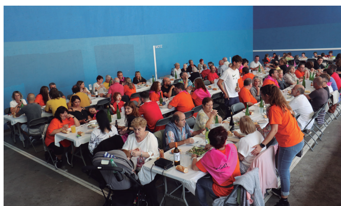
Auzotarren elkargunea izan zen jaietako azken eguneko bazkaria.