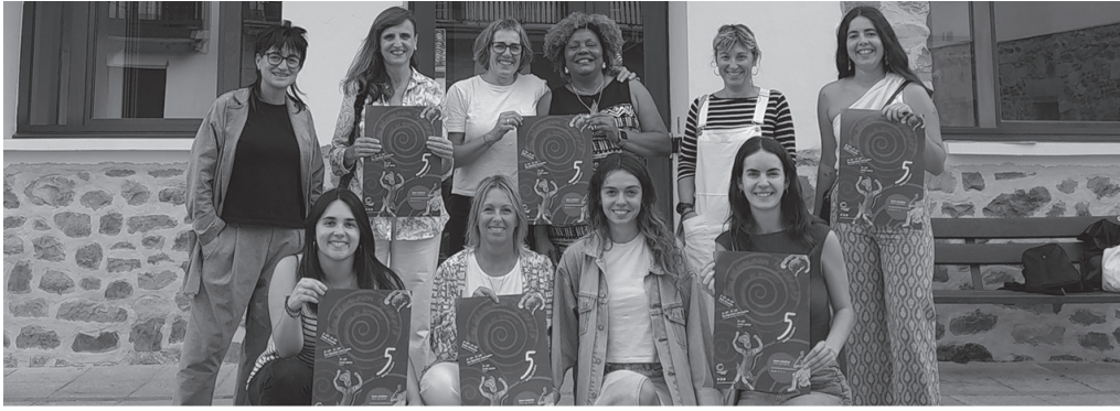
Udal-gobernuak, Emakumeon Etxeko talde sustatzailleak eta Kafe Tertuliak sustatu dute urriaren 5eko topaketa.