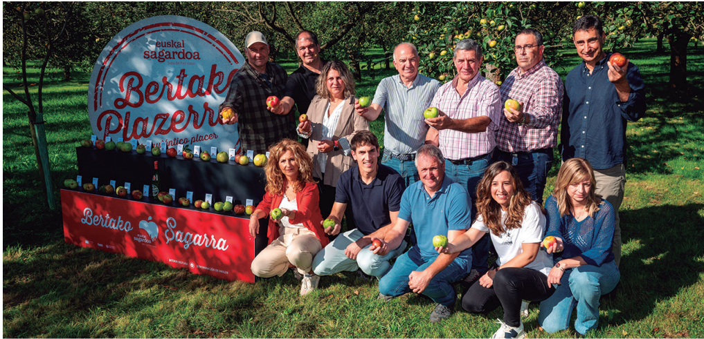
"lazko uzta handia izaki, aurtengoa txikia izatea aurreikusi zitekeen eta uzta halakoa izan da".