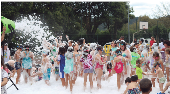
Apar festak freskatu zuen uda giroko larunbata.