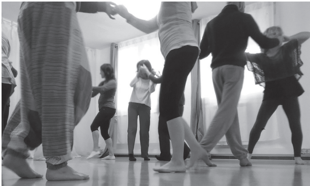
Emakumeen Etxean, besteak beste, biodantza ikastaroa iragarri dute. Urriaren 1ean hasiko da. ESPAICREATIUVIC.COM