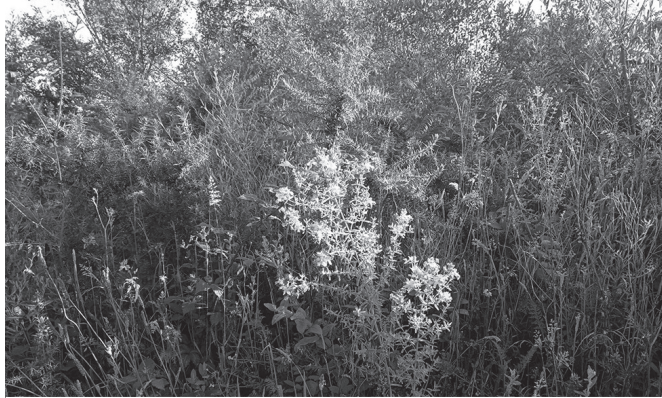
"Etxean, sendabelarren inguruan erreferentzia apur batzuk jaso izan ditut".

Etxean, sendabelarren inguruan erreferentzia apur batzuk jaso izan ditut. Baina gai askorekin gertatu ohi den bezalaxe, nahi baino gutxiago izan dira.