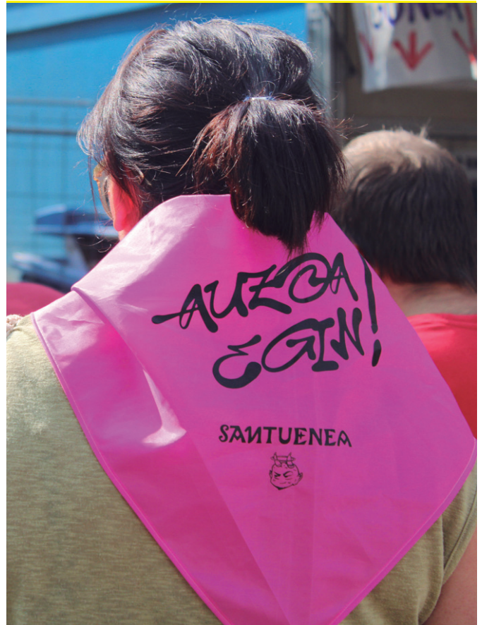
"Auzoa egin!" lelopean, hainbatek lepoaren bueltan jaietan jantzitako zapia.

diak... Helduentzat toka edota mus txapelketak. Gazte mordoak erakarri zituen DJ gauak. Bisitarien nahiz auzotarren bilgune izan dira jaiok. Argi utzi zuen, besteak beste, Santueneko belaunaldi ezberdinak erakarri zituen bazkariak. Belaunaldien arteko topaketa etengabekoa izan da jai hauek hainbat uneetan; elikagai ezberdinen dastaketan esaterako edota adin tarte ezberdinei zuzenduriko ekitaldiek jaietako plaza partekatu izan dutenean. Denen artean, auzoa egiten dihardutenaren seinale.