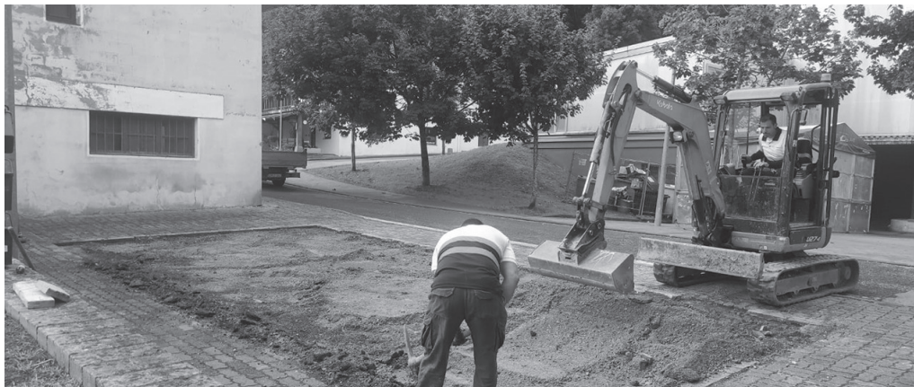
Astelehenean, jaien biharamunean, udal brigadako langileak izan ziren zarata egiten aritu zirenak.