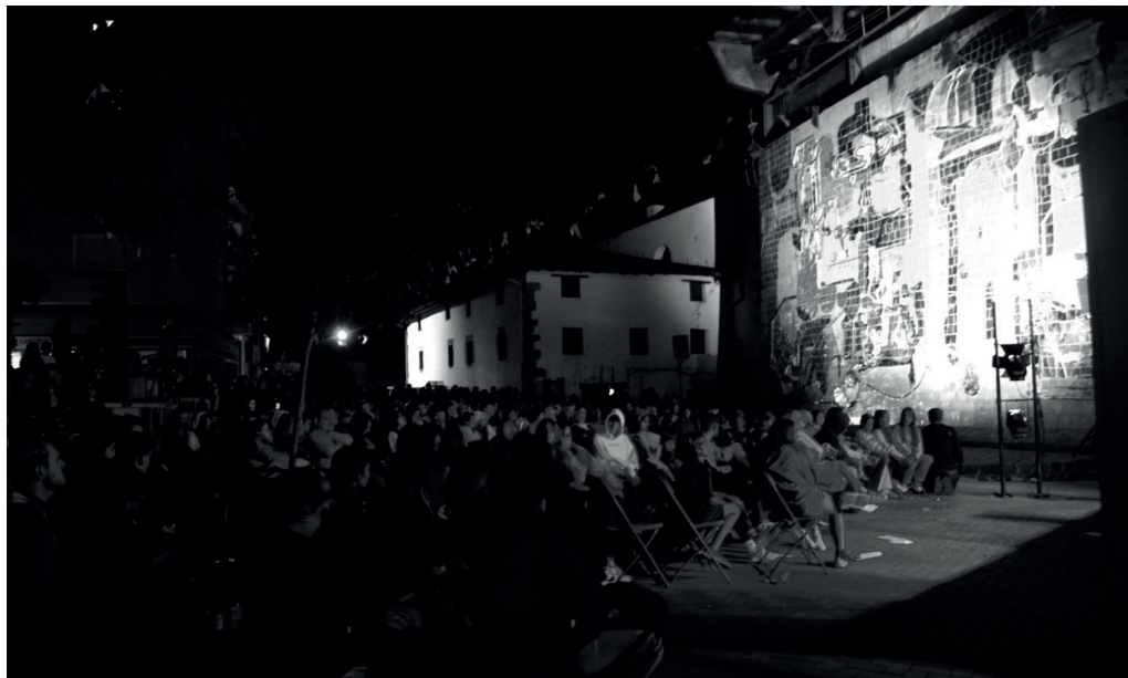
lazko "Xumetik" herri jaialdia oroitu du Kulturgunek ostiral gauean Sutegin, bideo proiektzio bidez.

Hasieratik erronka oso handia zen, ahalegin handia eskatu