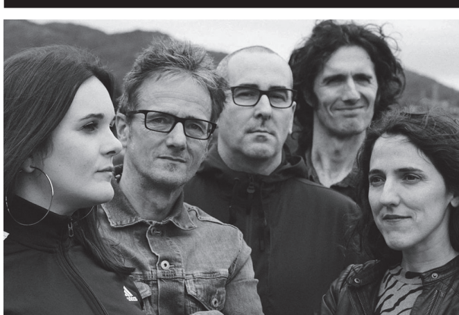
Igande honetan, Tenporak 'Ama' izeneko diskoa aurkeztuko du Sutegin.