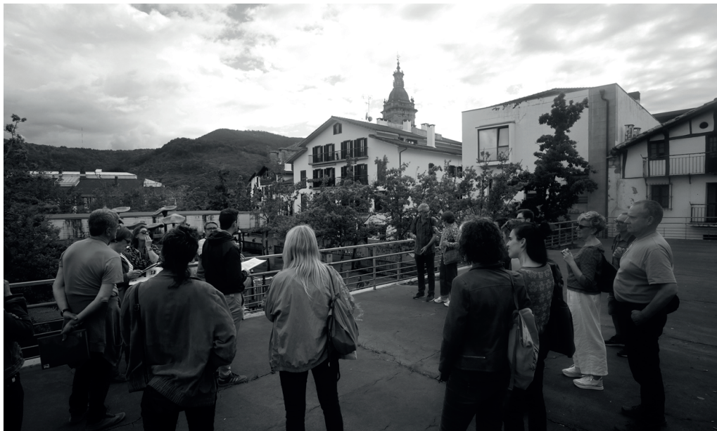
Ekaineko Jakin Jardunaldiko partaideekin egin zuten estreinakoz oroimenaren ibilaldia herrian barrena.