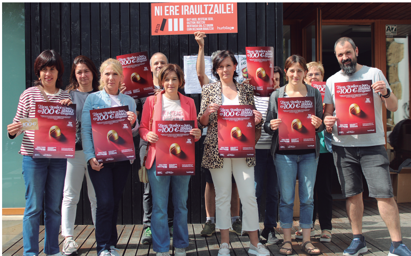
Urrezko bonboia egokitzen bazaizu, hona hemen Hurbilagokoen oharra. "Ez jan bonboia, gorde eta dendan erakutsi zure txekoa jaso ahal izateko".