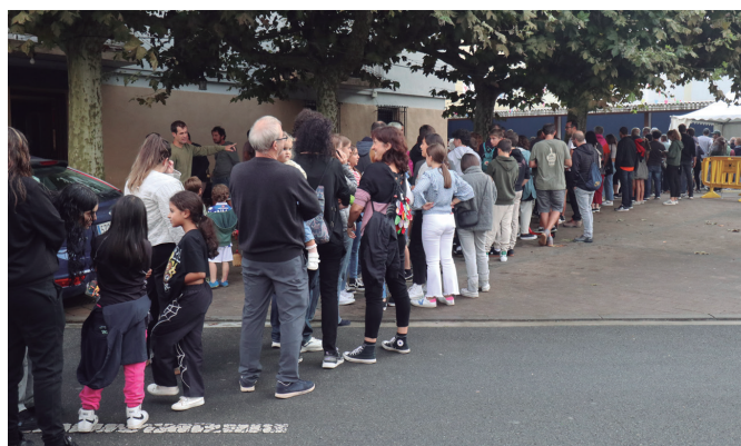
Ilara amaigabea, piperrak dastatzeko irrikitan.