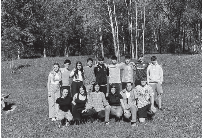
Azaroaren 8an hasiko da ikastaroa baina matrikulazioa urriaren 25ean itxiko da.