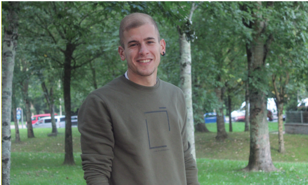
"Azkeneko bi urteetan batez ere, gizartearen interesa oso handia dela ikusten ari gara", adierazi digu Enekok.

Suizidioari buruzko hitzaldi batera datorren pertsona bat da, hein handi batean, errealitate hau gertutik bizitzea