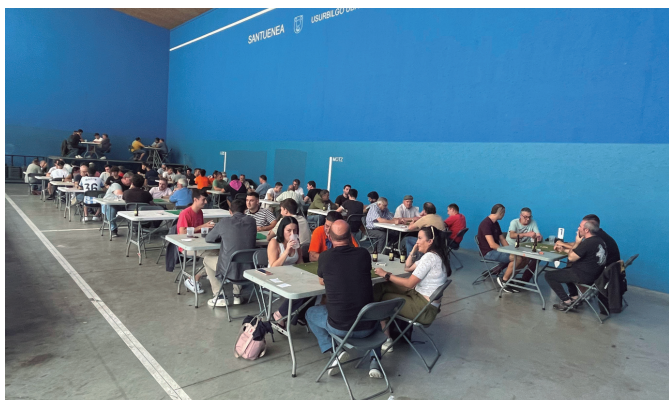
Mus txapelketak duen arrakastaren irudia. Lehiakideek frontoia bete zuten.