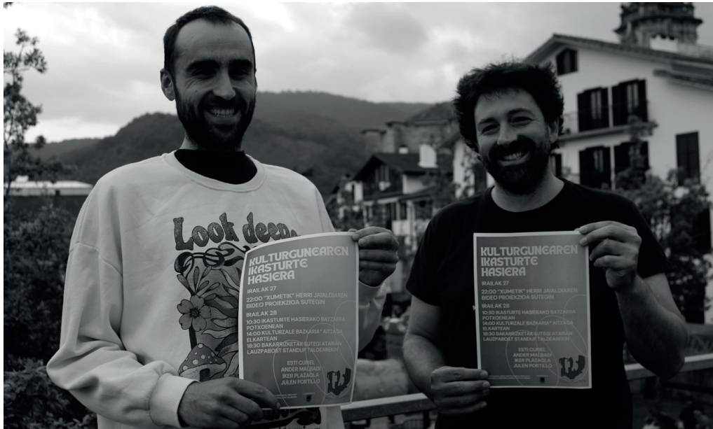
Usurbilgo Kulturguneko kideak, asteburuko ekintzen kartela eskuartean dutela.