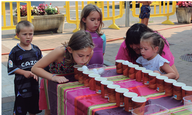
Ur jolasetarako giro ederra zegoen ostiral arratsaldean.