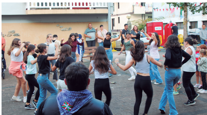
Etxebarria aita-emeek dantzalekuan bilakatu zuten Santueneko plaza.