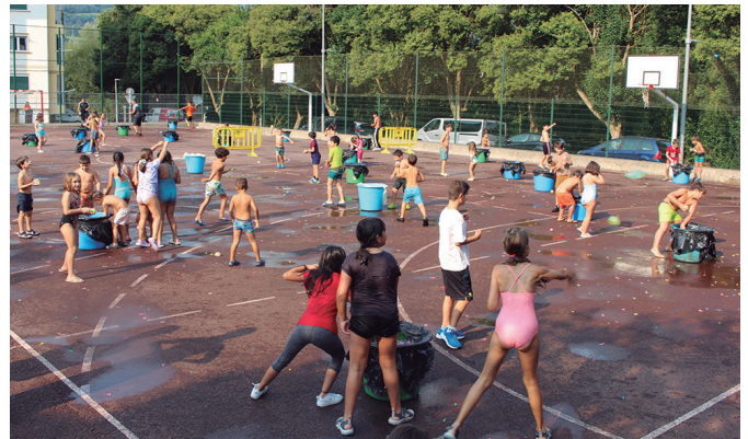
Txupinazoarekin batera hasi zen globo-gerra.