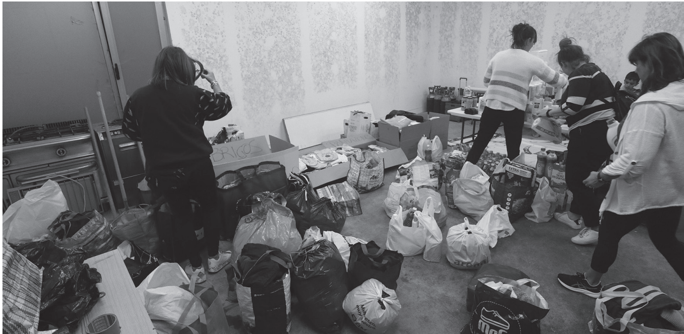
Santueneko frontoi ondoko lokalean batu zuten jasotako guztia. Janaria, arropa eta garbikariak, nagusiki.