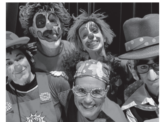
Abenduaren 1ean, Oiardon.

ostirala! Jantzi sudur gorria eta zatoz gurekin".