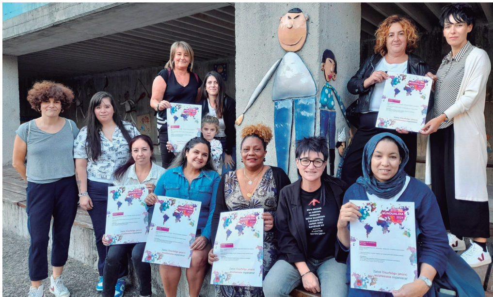
Mundualdia ekimenaren sustatzaileak, kartelak eskuartean dituztela.