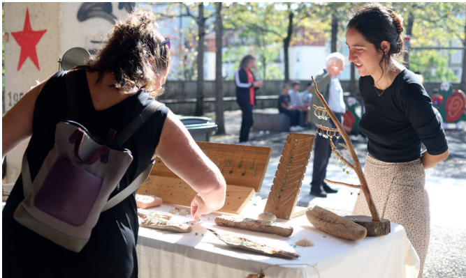
Herritarrak produktuez galdezka Askatasuna plazan.