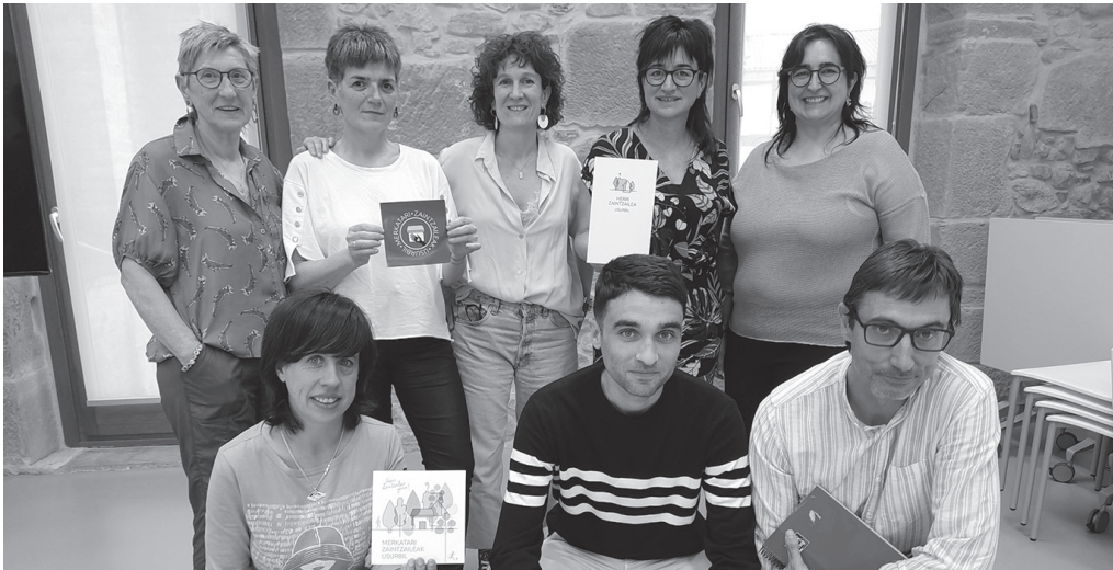
Merkatari zaintzaileen sarea aurkeztu zuten ekainean. Sare honi lotutako bi egitasmo iragarri dituzte.