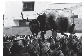
Egun ezitsuen gerturatsen ari da.