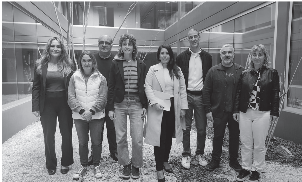
Mugikortasuneko, Turismoko eta Lurralde Antolaketako foru diputatua eskualdeko udal ordezkariekin batu zen aurreko astean.