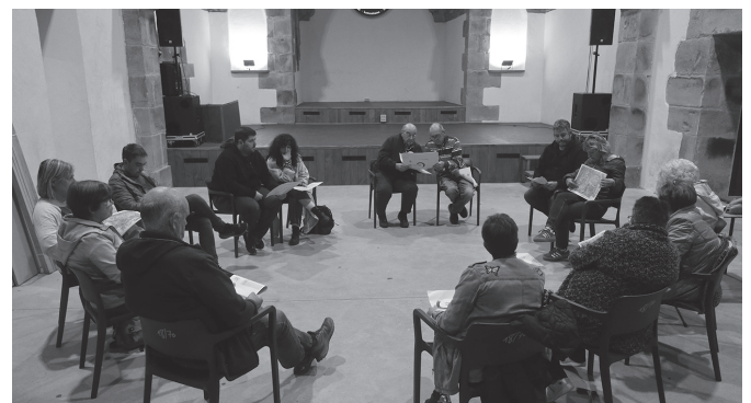
Lehen bilkurak Aginagan (argazkian) eta Kalezarren egin zituzten.

18:00 Herri erdiguneko bilera Potxoenean egingo da.