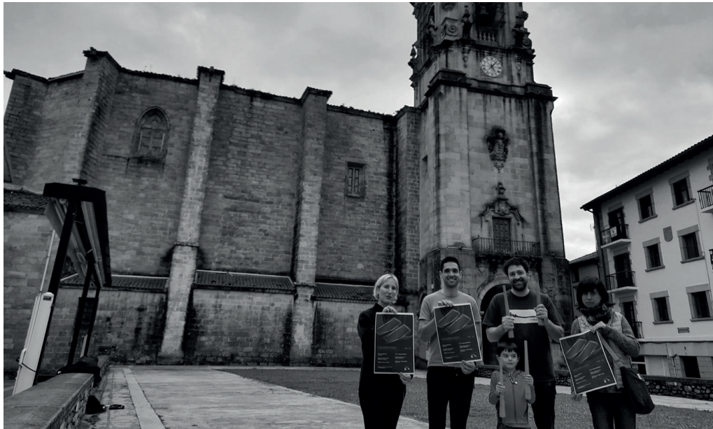
Txalaparta Festaren sustatzaileak, azaroaren 9ko jaialdia abiatuko den gunean bertan.