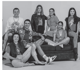
Bi proiektio egingo dira. 18:00etan lehen, 19:30ean bigarrena.

Usurbilgo Udalaren, UEMAren eta EITBren eskutik programaturiko emanaldietarako gonbidapenak hilaren 8tik aurrera eskuratu ahalko dira usurbilkultura.eus plataforman.