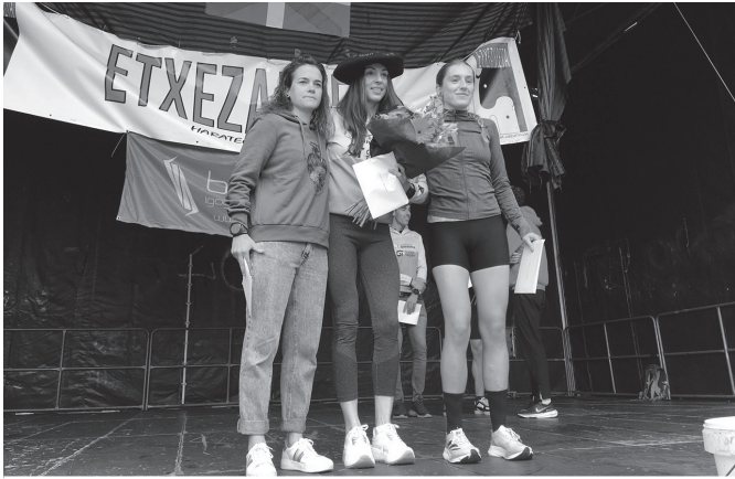
Sari gisa, txapela eta Aterpea dendari elkartearen bonua eskuratu zituen.