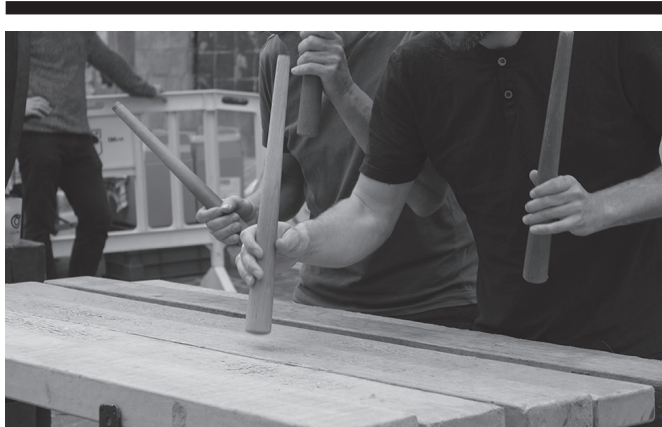
'Kanpaiak jotzea' ekitaldiarekin hasiko da eguna.

Euskarazko film proiektzioa haurrentzat. Sarrera: 3,20 eurotan eskuratu ahalko da usurbilkultura.eus plataforman. Antolatzaileak: Udala, Ziortza. 17:00 Sutegin.