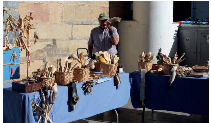
Egurarekin eta adarrekin egindako etxetresnak ere salgai egon ziren.