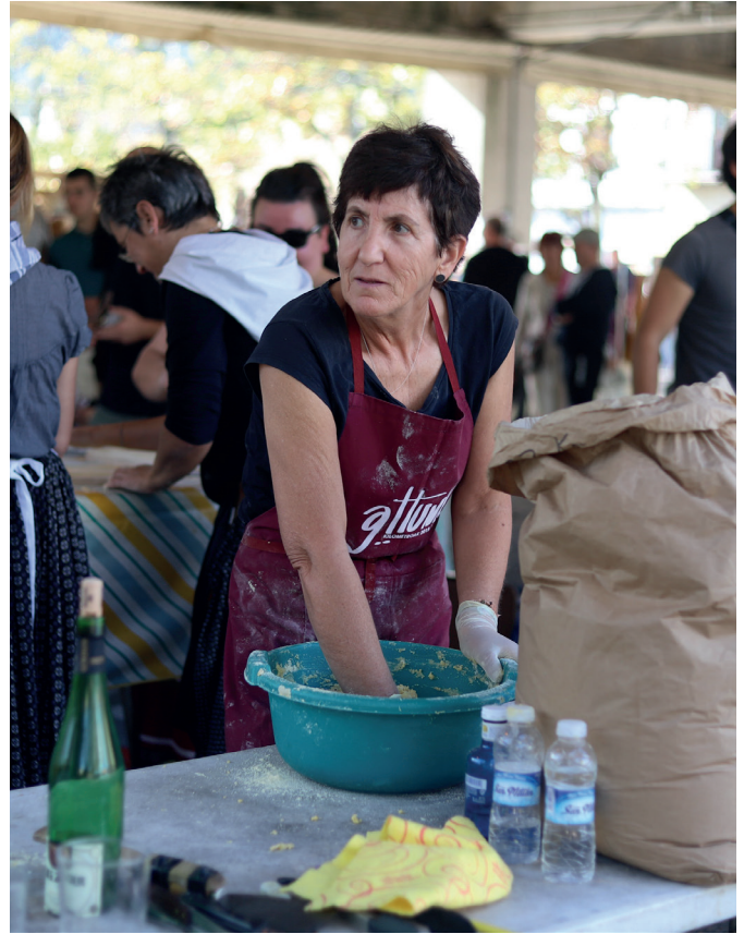
Herritar bat taloak egiteko orea prestatzen.