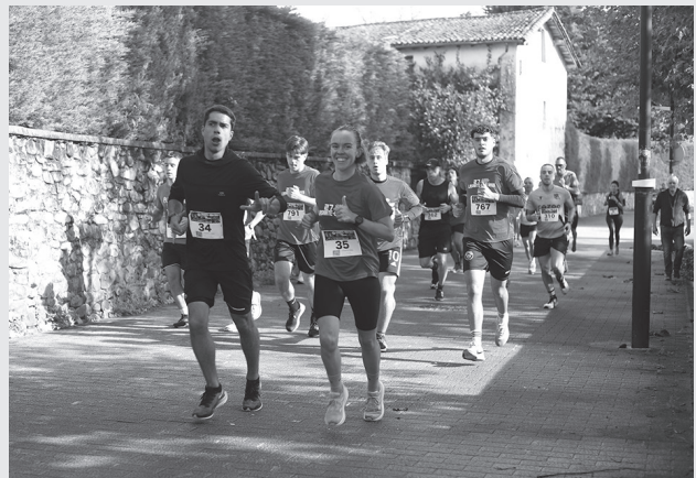
Lasarte-Oria Bai! lasterketak Zubieta igaro zuen.