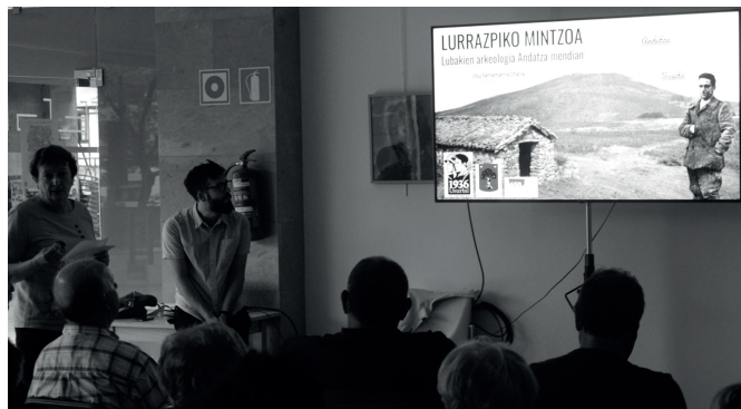
Usurbil 1936 elkarteak Sutegin antolaturiko hitzaldia.

QR kode eta panelen bidez osa dezakezue Andatzako ibilbide hau, baita berriki prestatu duten herri erdiguneko ere, 650 Usurbil Bizi