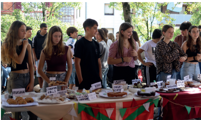
Udarregi Ikastolako DBH4ko ikasleak gozoak saltzen Askatasuna plazan.