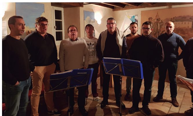
Larunbat eguerdian kalejiran ibiliko dira eta arratsaldean Sutegin arituko dira.