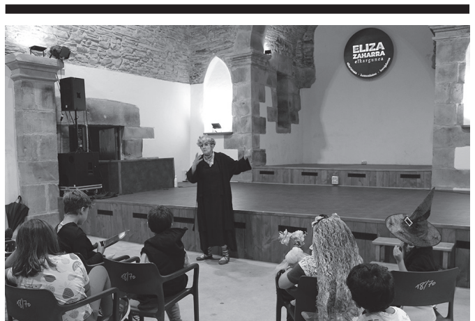
Ikusle gehienak mozorrotuta hurbildu ziren Eliza Zaharrera.

aste hasieran. Azaroa amaiera arte, astero ekitaldi bat programatua du udal liburutegiak. Xehetasunak Agendan (22. or).