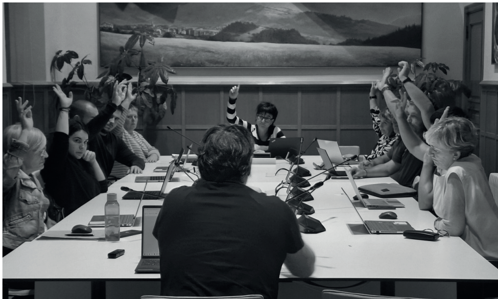
Urriaren 31n egindako udalbatzaren osoko bilkura.