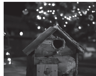
Hilaren 14an piztuko dituzte argiak.

• 11:00-13:00 Iristaketa ikastaroa frontoian eta eskubaloi pistan. Beharrezko materiala: kaskoa, babesgarriak (esku-mutur eta ukalondoetarako eta betaurrekoak) eta patinak.