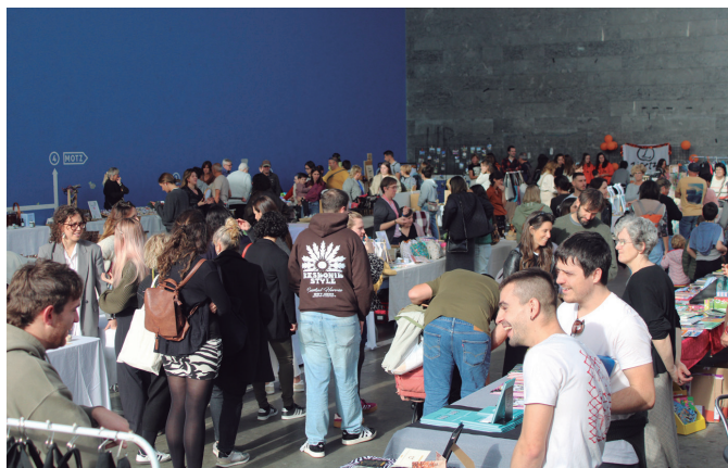
Eguerdie partean, jende ugari ibili zen postuz postu.

kontzentrazio maila altuan aritu ziren eskulan hauetan. Azoka, gainera, trukerako eremu izan zen. Hain zuzen, erosketaren bat egitearen truke, bertako sagardoa eta gaztainak doan dasta zitezkeen. Ohiko herritar kuadrilak presaturiko jakiok eguerdi partearako agortu egin ziren.