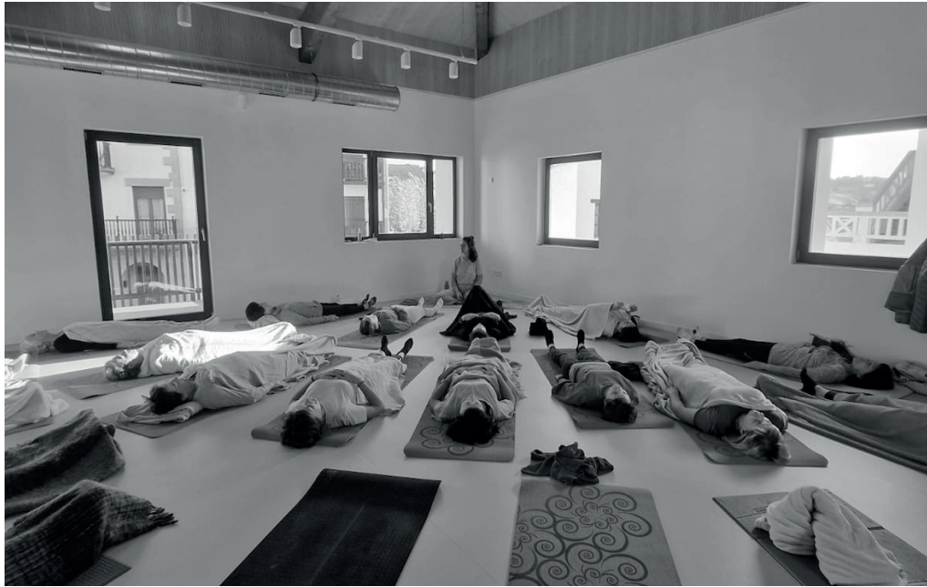
Azaroan egindako yoga saioan hainbat auzotar Pelaiouena eraikineko bigarren solairuan erlaxatzen.

→ Helburua da auzotarrentzat interesgarriak diren ekintzak elkarlanean antolatzea eta gazte zein helduak elkar-tzea. Ekintza batzuk epe ertainekoak izaten dira, batez ere, hainbat saio behar direnak ekintza horiek hasi eta amaitzeko. Aldiz, beste batzuk egun puntualetara mugatzen dira. Batzuetan, auzotarron artean; beste batzuetan, kanpoko profesional batek gidatuta.