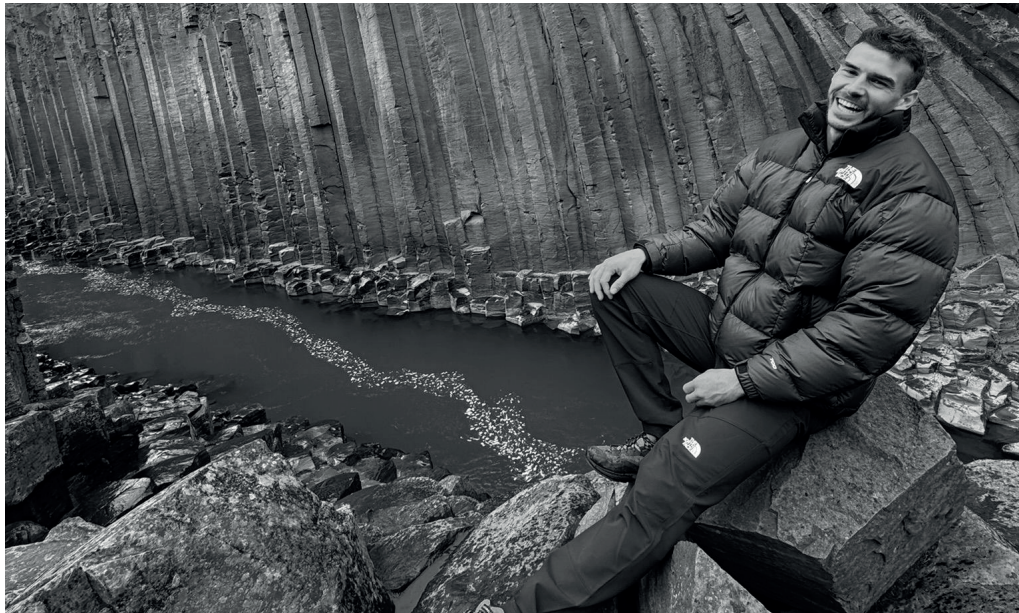
Islandiako futbol ligan jokatu du aurtan. Argazkian, fiordo baten goikaldean, turismo pixka bat egiten.