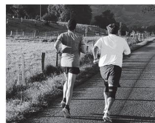
100 lagunentzako tokia egongo da.

Gogoan izan, 100 lagunentzako lekua egongo da "Ibai-Ondo Backyard" izeneko erronka girotuan. Mezu horretan, norberaren izena eta bi abizenak, helbidea, udal-lerria, posta kodea, probintzia, telefono zenbakia eta posta elektronikoko helbidea zehaztu beharko dira. Antolakuntzak parte hartzaileen aldetik jasotako emailen hurrenkeraren arabera erabakiko dira nortzuk izango diren parte hartzaileak eta haiei jakinaraziko diete nortzuk izan diren onartuak, nortzukez, ordaintzeko modua