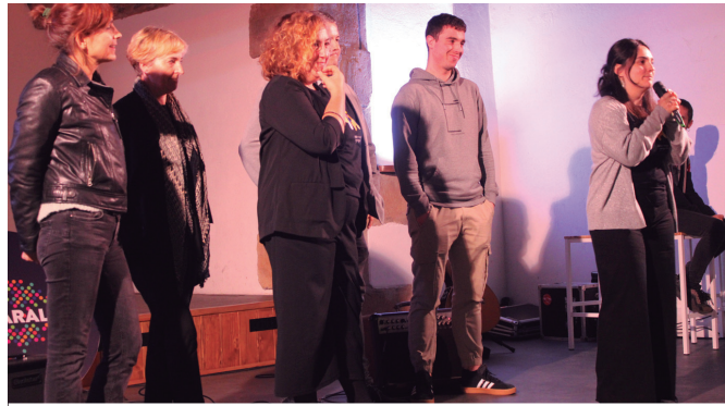
Euskaraldiko herri batzordeko kideak, Eliza Zaharreko oholtzan.