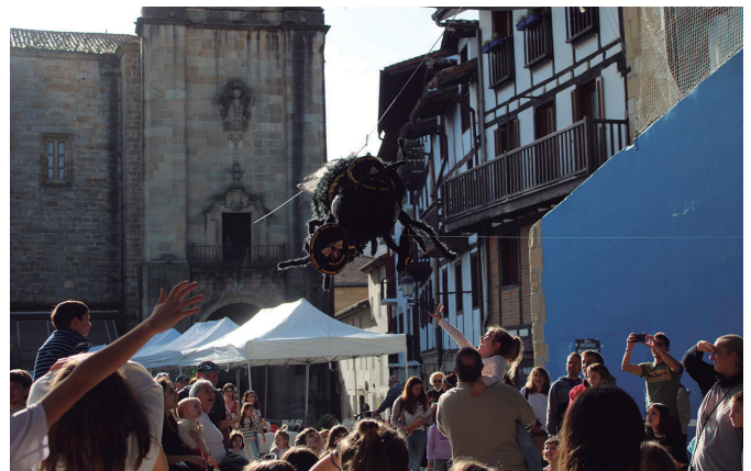
Ikusmin handieneko unea; erlea sariak ekartzen frontoirantz.