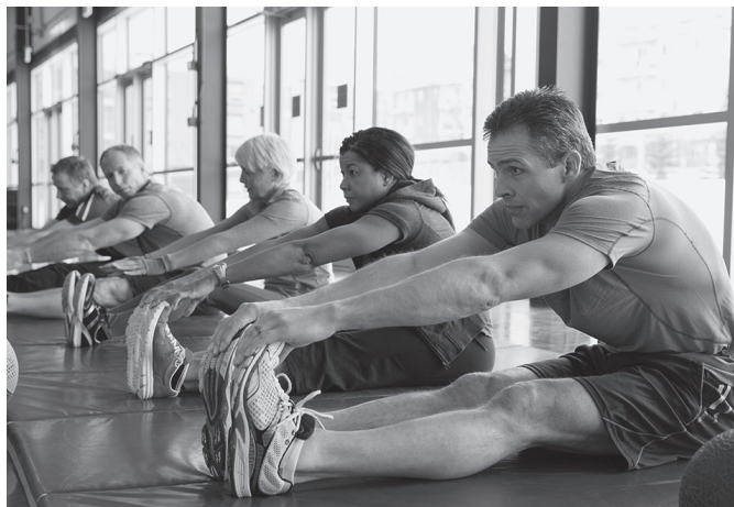
“Heldu zaharrenak, adintsuak izan arren ez dira zaharrak sentitzen eta autonomoak dira”.

Beste bat erosahalmena dutela. 2008ko krisiak ez zien hainbeste eragin eta austeritate politikek eta enplegu gailerak ere ez ditu harrapatu. 30