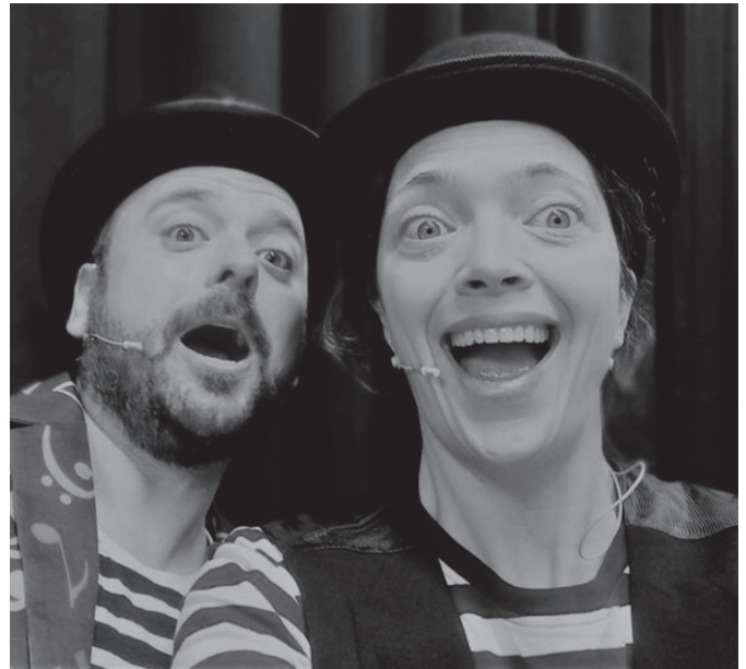
Perlik eta Koxkolo 'Abentura zirraragarria' saioa eskainiko dute hilaren 11n.

horiek guztiak ez dira txoriburu gorabeherak besterik. Sorginak! Puaf! Kontu aldrebesagorik! Bada, sentitzen dugu esan beharra, baina egon badaude. Irakurri besterik ez duzu, bestela, Roald Dahl-en liburu hunkigarri hau: berehala pasatuko zara zure irribarre ironiko horretatik sorpresara, eta sorpresatik gorputz guztia dardarizoka jarriko dizun tranze urdurira. Sorginengan ez duzula sinesten? Bada, bel-