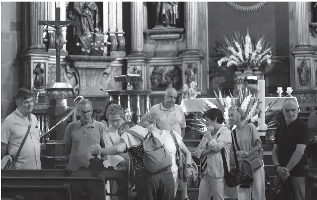
Larunbat honetako bisitan, Salbatore elizaren ondarea ezagutzeko aukera izango da.