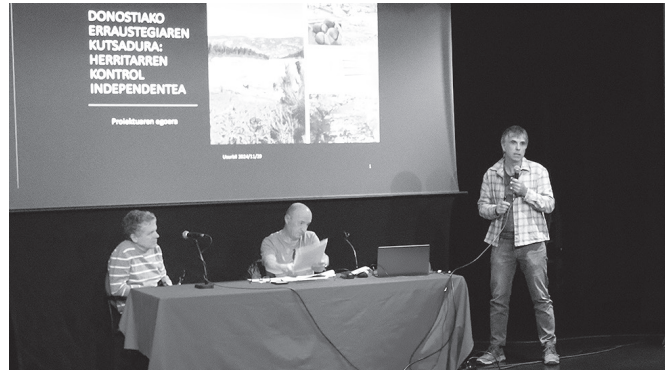
"Arazo handia dugu", eta zerbait egin beharra dagoela diote.

Erraustegiaren kontrol faltasalatu zuten. "Kontrolatzen ez diren substantzien isurketa" salatu zuten.