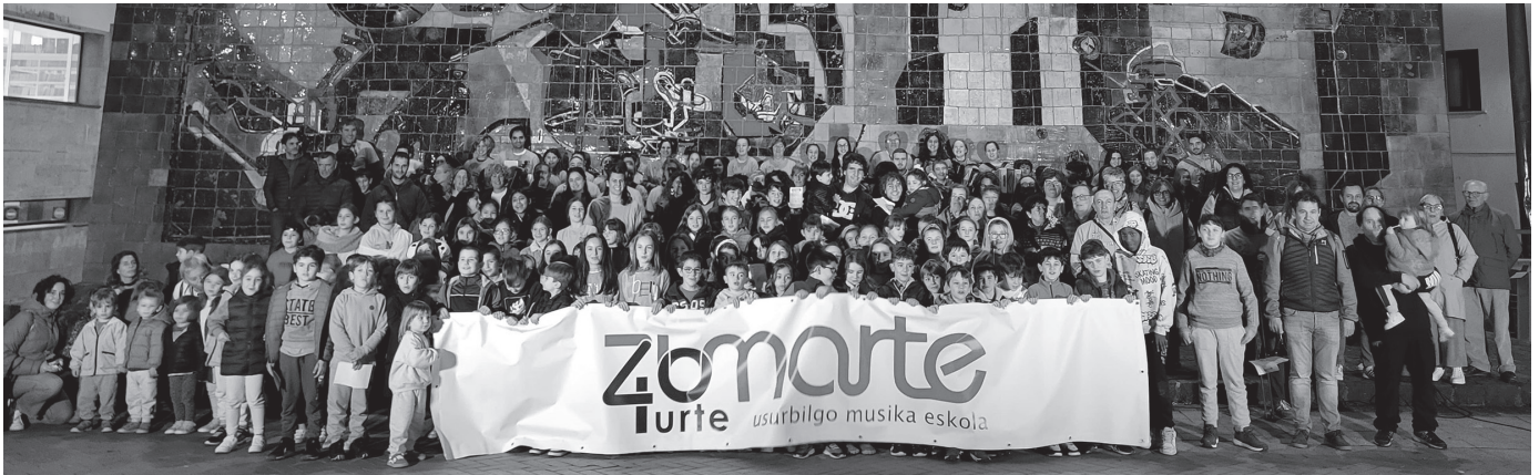
Zumarte Musika Eskolak 40 urte bete ditu eta lehen ospakizuna aurreko astean egin zuten.