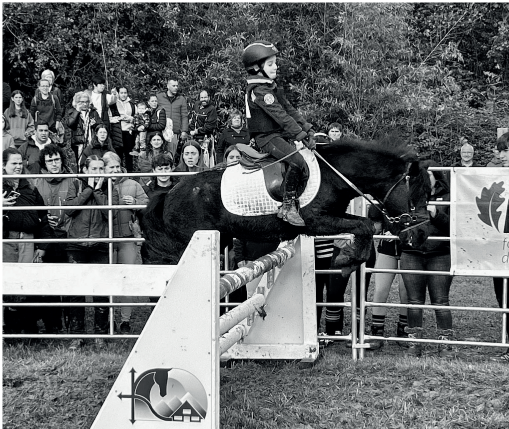
Haur bat pottoka batekin, hipika erakustaldia eskaintzen.

→ eta hala, badakigu pottoka bakoitzaren arbasoak zein izan ziren; liburu genetikiko bat daukate. Egun, arraza asko ere homogeenagoa da prozesu horren ondorioz.