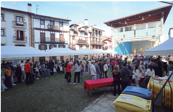
Urteko azoka gozoenak hartu zuen plaza.