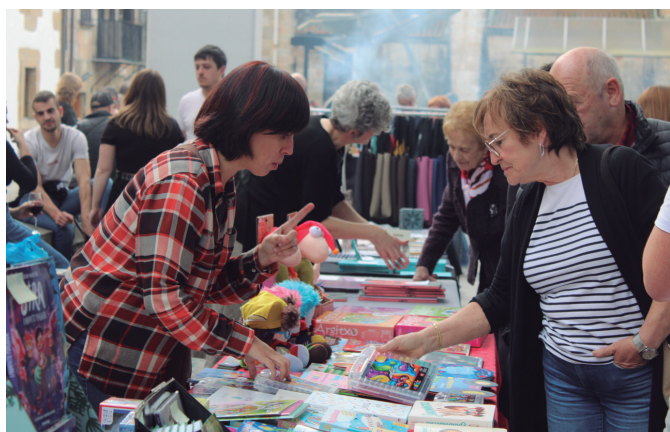
Usurbilgo dendarien eta sortzaileen parte hartzea erakarri zuen azokak.