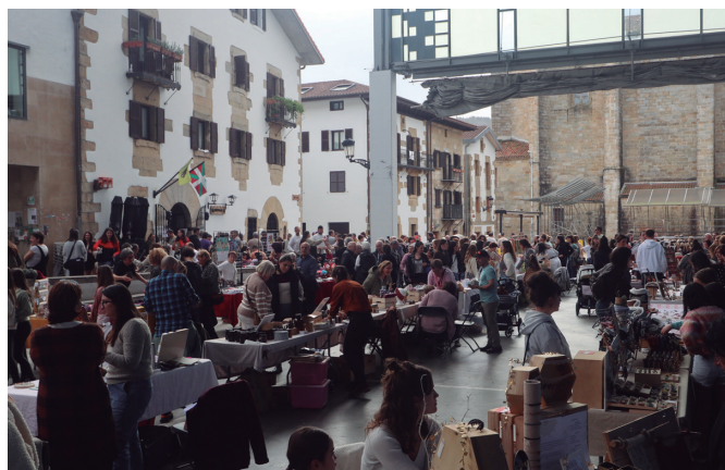
Dendariak eta artisauak hartu zuten frontoia abenduaren 1ean.

Herri ordezkaritza zabala erakarri zuen hitzorduak. Lizardi liburudenda, Sleepy Mimosa,