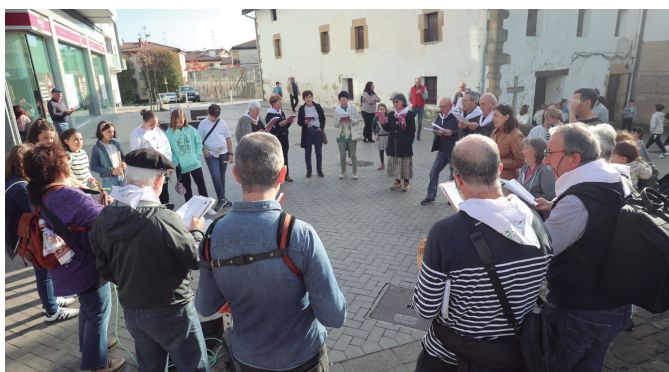
Kantu Taldea urteko azken ohiko kantu-jiran.

Euskararen Egunaren aurreko larunbat gauetz ospatu ohi den gaualdian musikak, bakarrizketek, antzezlanak, parodiak tartea izan zuten. Baina 2025eko Euskaraldiari ere toki egin zioten. Izan ere, herri batzordeak ekimenaren dinamizazio lanetan parte hartzeko gonbita egin zuen. Abenduaren 10ean, 18:00etan Po-txoenean biltzeko deia egin dute berriz. Maiatzean egingo da laugarren Euskaraldia.