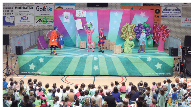
"Ostirala iritsi da!" ikuskizuneko une bat.

abenduaren 15ean 13:30ean Artzabal jatetxean. Bankako Menditarrak taldea gonbidatu dute hitzordura. Abenduaren 10a baino lehen eman behar da izena Artzabalen.