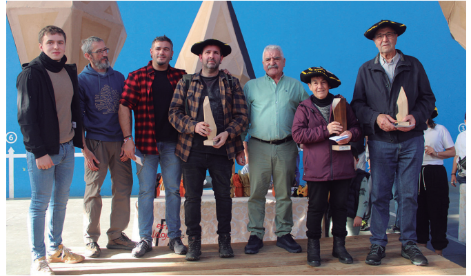
Euskal Herriko Ezti Txapelketako aurtengo sarituak.

dako txapelketen sariak banatu zituzten. Erlea inspirazio iturri zuten Sutegin ikusgai jarri zituzten Udarregi ikastolako, Aginaga zein Zubietako eskoletako 0-12 urte artekoen marrazkiak. Haietatik sei saritu zituzten. Sariak ikaste-txeetara helaraziko dituzte. Bestalde, Euskal Herriko Ezti Txapelketa ere jokatu zen. 51 ezti-poto lehiatu ziren. Sarituen berri duzue segidan: