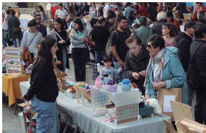
Frontoia artisau eta bisitarien topagune izan zen.