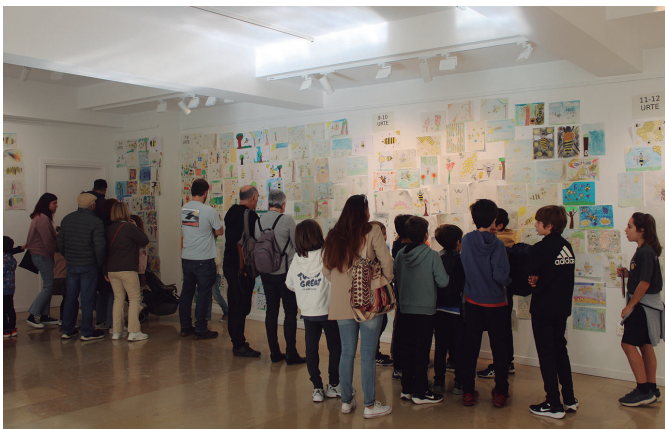
Erlea inspirazio iturri, Sutegin ikusgai izan ziren gaztetzkoen marrazkietan.