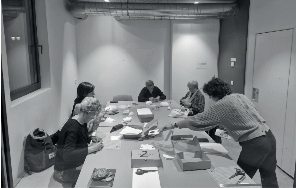
Neguko zein gabonetako apaingarriak prestatzen jo eta su dabilta Belmonte Auzo Elkarteko kideak.