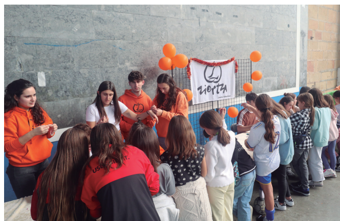
Ziortza gazte elkarteak eskumuturrekoak egiteko tailerra eskaini zuen.