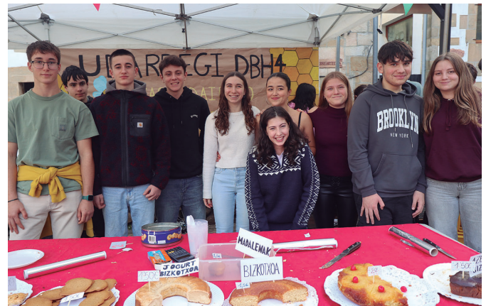
Gozogintzako postuan gogotik aritu ziren lanean Udarregiko DBH4ko ikasleak.