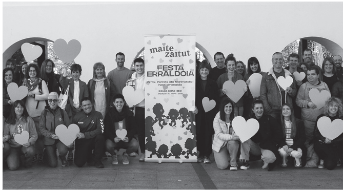
Diziplina ezberdineko artistek parte hartuko dute herri omenaldian.