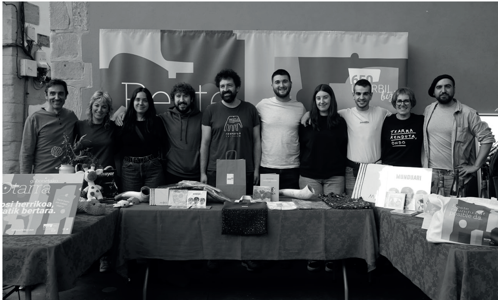
650 Usurbil Bizi Otarra Hurbilagoren Udazkeneko Azokan aurkeztu zuten.