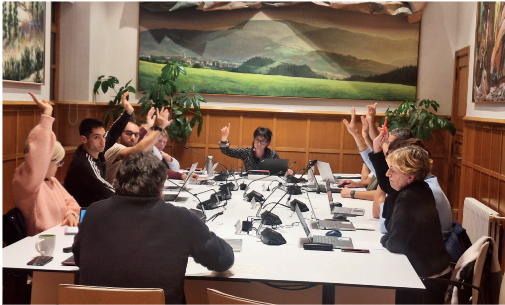
Alkateari eta udaleko gizarte langileei babesa adierazteko erakunde adierazpena aho batez onartu zuten unea.