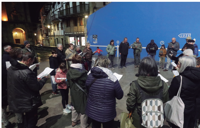
Usurbilgo Euskal Kantu Taldekoek ere bat egin zuten Euskararen Egunarekin.