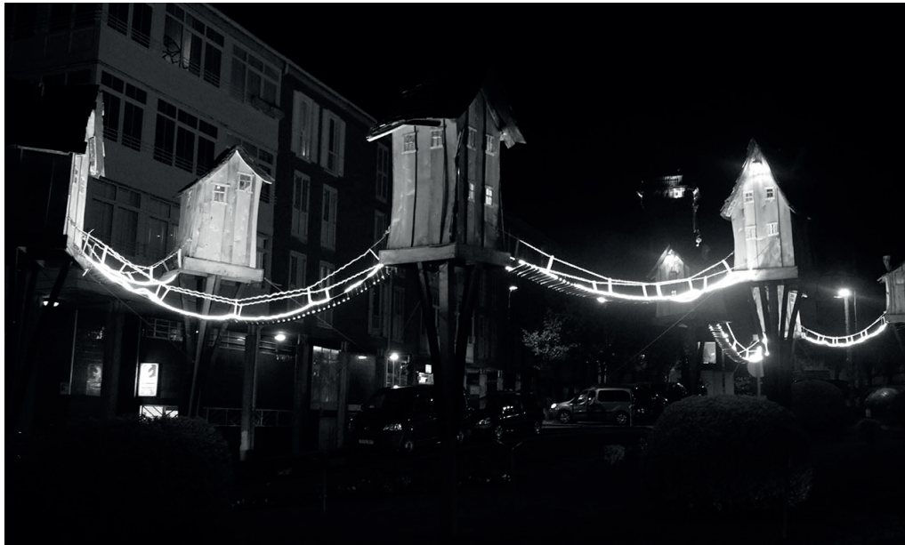
Hurbilagoren gabonetako etxolek herria argitu zuten iaz.