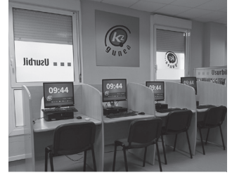
Urtarrilean goizez zabalduko dute.