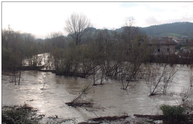
Oria ibaiak hedadura hau zuen aste hasieran, Txikiardi eta Zubieta artean.