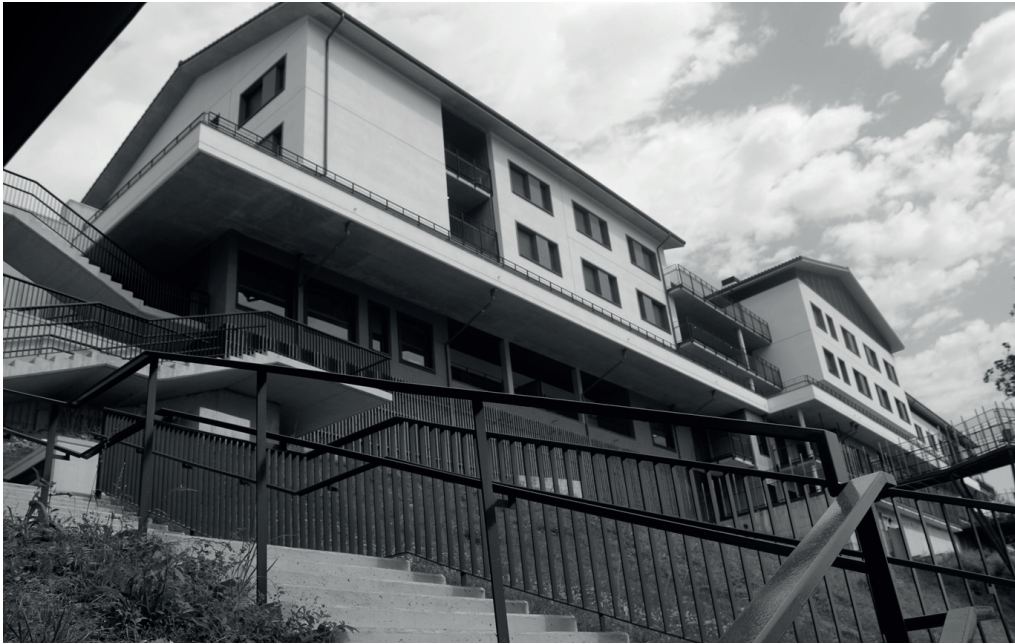
Zaintza ekosistemaren garapenari lotutako hiru egitasmo abiaraziko dituzte 2025ean.

→ udala arazketagatik ko-bratzen, eta aurreko %20ko igoera izango du: guztira, 521.000 euro jasotzea aurreikusten da. Etxebizitza hutsei %150eko errenergia ezarriko zaie OHZ Ondasun Higiezinaren gaineko Zergan, alokairura ateratzea bultzatzeko neurri gisa: iaz 25.000 euro jasotzea aurreikusitzen, eta 2025ean, errenergia handituta, 82.000 euro". Zergan igoera orokorraren aurrean, hobariaren sistemak indarrean segiko du. "Duela bizpahiru urte, hobariak eskuratzeko irizpideak zabaldu zituzten, eta gaur egun 200 familia inguru dira hobaridunak".