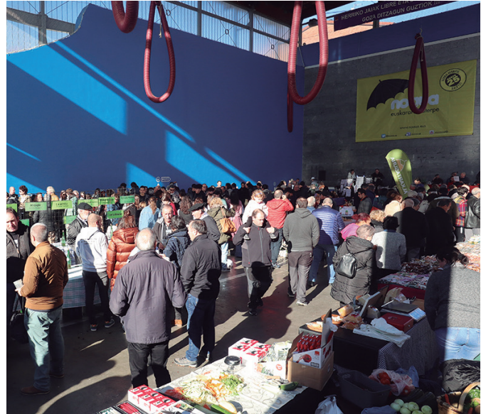
Babarrun zein sagardo lehiaketetan parte hartzeko epea asteartean amaitu zen.

Animatzen zaretenok, kultur elkarte honek eskertuko luke "lanak banatu eta ondo antolatu ahal izateko" laguntza etor zaitezketela ziurtatzea aurrez, abenduaren 12a baino