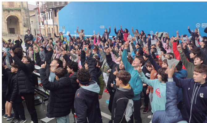
Euskarari kantuan gogo biziz, Udarregi ikastolako LH-ko ikasleak.

tik iluntzera. Eguneko lehen orduetan, eguneroko dinamikatik atera ziren Udarregi ikastolako LH ziklokoak plazara irten ziren jolastu eta abestera. HH eta DBH-koek ikastetxe barruan hainbat dinamika egiten ari ziren artean, 6-12 urte artekoak herri erdiguneko plazak hartu zituzten talde jolas hainbatetan parte hartzeko. Eguerdian euskara aldarrikatu eta hizkuntza be-