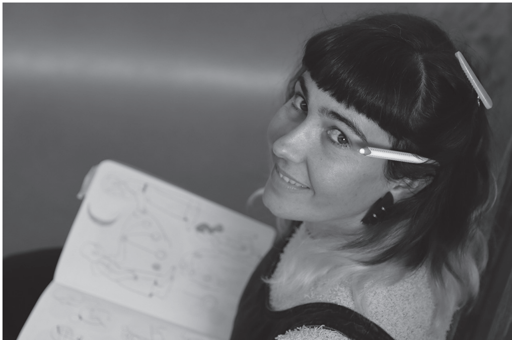
"Helduekin batera irakurtzen diren ipuinak asko gustatzen zaizkie ume txikiei". 'Xurde' da ipuin horietako bat.