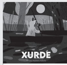
'Xurde' ipuinaren azala.

Zer gertatuko da orain Axarko, Azkonar eta Xurderekin? Datorren urtean, beste egile bat izango baita ipuinaren ardura bere gain hartuko duena. "Nahiko nuke beraiekin lanean segi", azaldu digu. "Ez ditut ahaztu nahi eta ari naiz zerbaitetan baina horrek zer nolako emaitza ekarriko duen, ez dago soilik nire esku. Baina poz handia emango lida-ke".