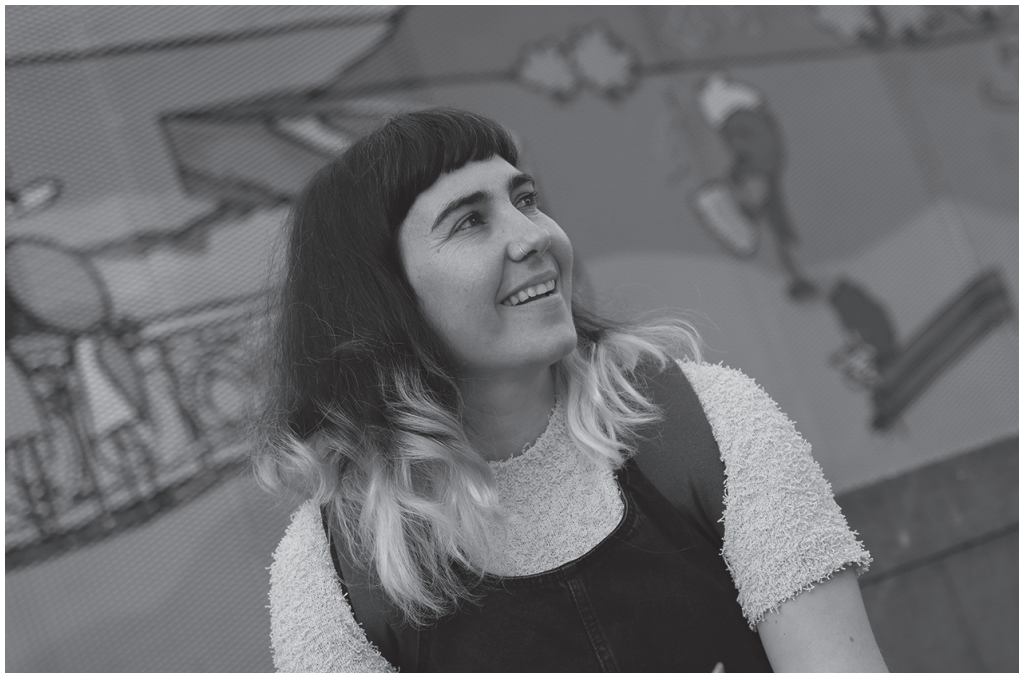
"Gure basoetan eta errioetan, ikusten ez dugun hori guztia hor dagoela pentsatzeak zirrara sortzen dit".

→ Garai bateko jendearekin hitz egiten baduzu, dena dago lotuta: lanbideak, lan-tresnak, natura, euskara... Dena oso modu zehatzean esana zegoen eta dena zen mundu ikuskera baten parte. Hizkuntza, biologia, errealitate soziala... Den-denaren isla.