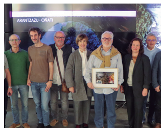
644 argazki aurkeztu ziren egutegira.

Foru Aldundiak berak eta Gipuzkoako Argazki Elkarteak sustaturiko lehiaketara aurkezturiko irudiekin osatu dute hurrengo urteko egutegia. "272 parte-hartzailek guztira 644 argazki aurkeztu zituzten, Gipuzkoako txoko eta leku ezberdinen esentzia harra-