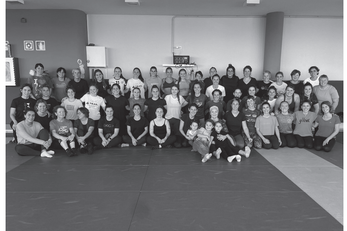
'Elkarrekin Egunean' ekimenarekin bat egin zuten herritarrak.

Nutrizionistak azalpenak eta gomendioak eman zizkien emakumeen bizitzako etapa bakoitzean ulertzeko zeri eman behar dioten garrantzia. Nerabezaroan zein hilekoaren zikloaren barnean zeri erreparatu eta sintomatologia hobetzeko aholkuak jaso zituzten, bai eta haurdunaldi zein edoskitzean ere. Jakina, menopausia ere hizpide izan zuten.