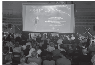
Irudian, Orioko proiektzioa. Hilaren 22an eskainiko dute Aginagan.