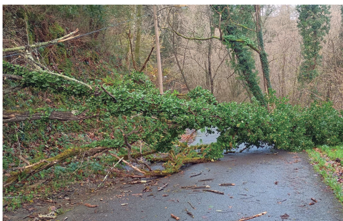
Urdaiaga eta Txokoalde artean erori zen zuhaitz hau.

jaso genuen. Usurbildik gertuen, Euskalmet meteorologia agentziak Lasarte-Orian duen estazioan bildutako datuen arabera, asteburuan maila horia gainditu zuen Oriak. Astelehen goizaldean maila laranja heldzean izan zen zenbait uneetan, baina iristear zela ur-emia gutxitzen hasi zen pixkanaka. Beste batzuetan gertatu izan ez den moduan, oraingoan bai; asteburuko euri-jasei bere ohiko bidetik eutsi die Oriak.