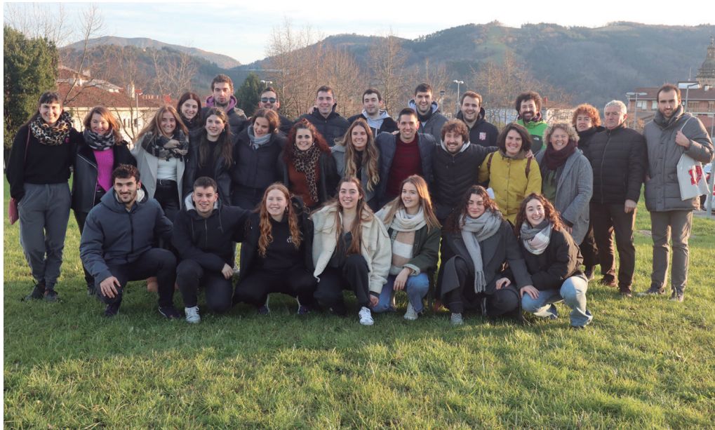
Elkargunea anbulatorio ondoko zelaian kokatuko dela berri emateko, Elkargunekoen urte hasierako agerraldia.