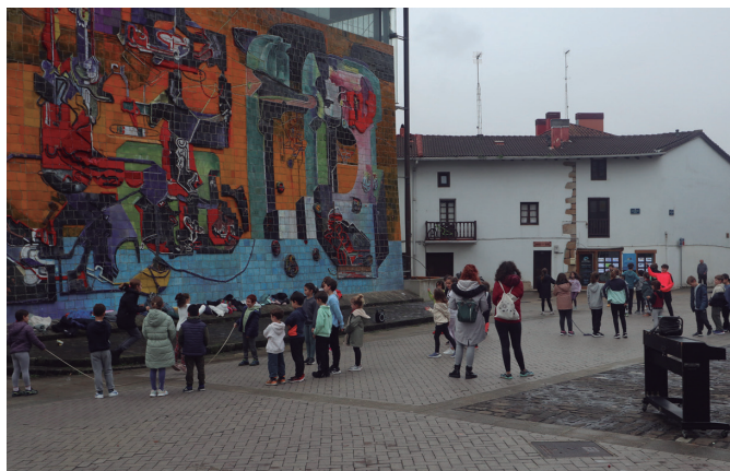
Jolasean igaro zuten Euskararen Eguneko goiza Udarregiko LH-ko ikasleak.