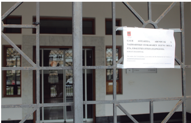
Usurbilgo udal zerbitzuentzat jaieguna izan zen Euskararen Eguna.