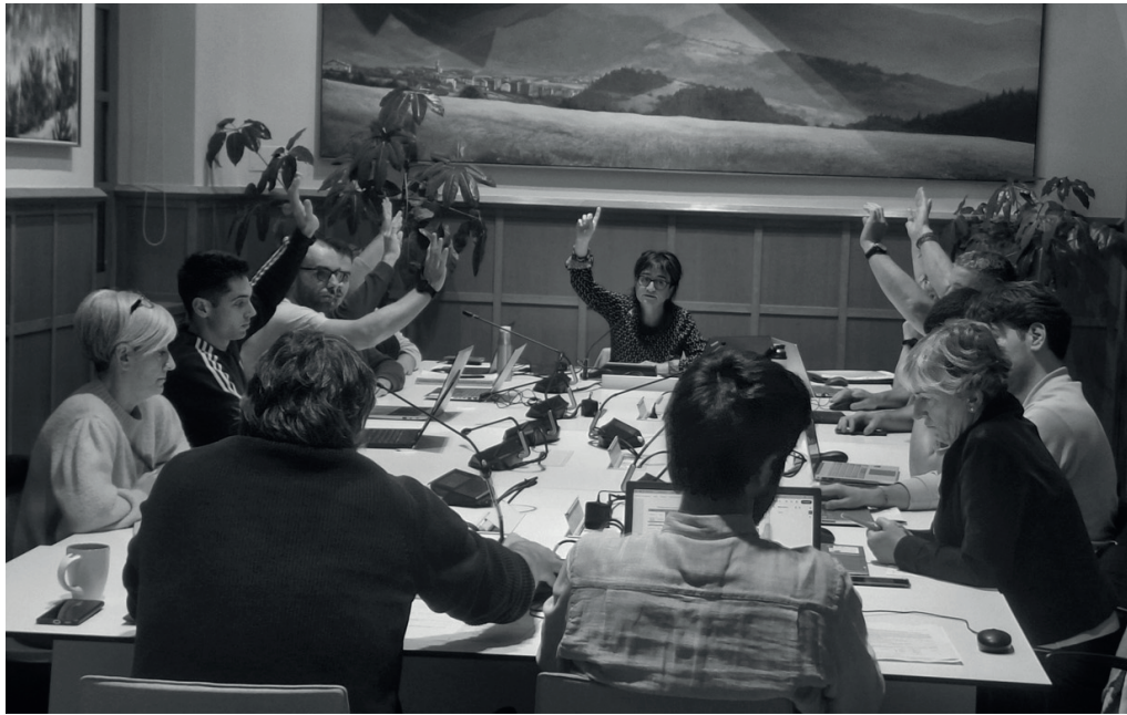
2025eko udal aurrekontuak azaroaren 28ko osoko bilkuran hasieraz bozkatu zituzten unea.