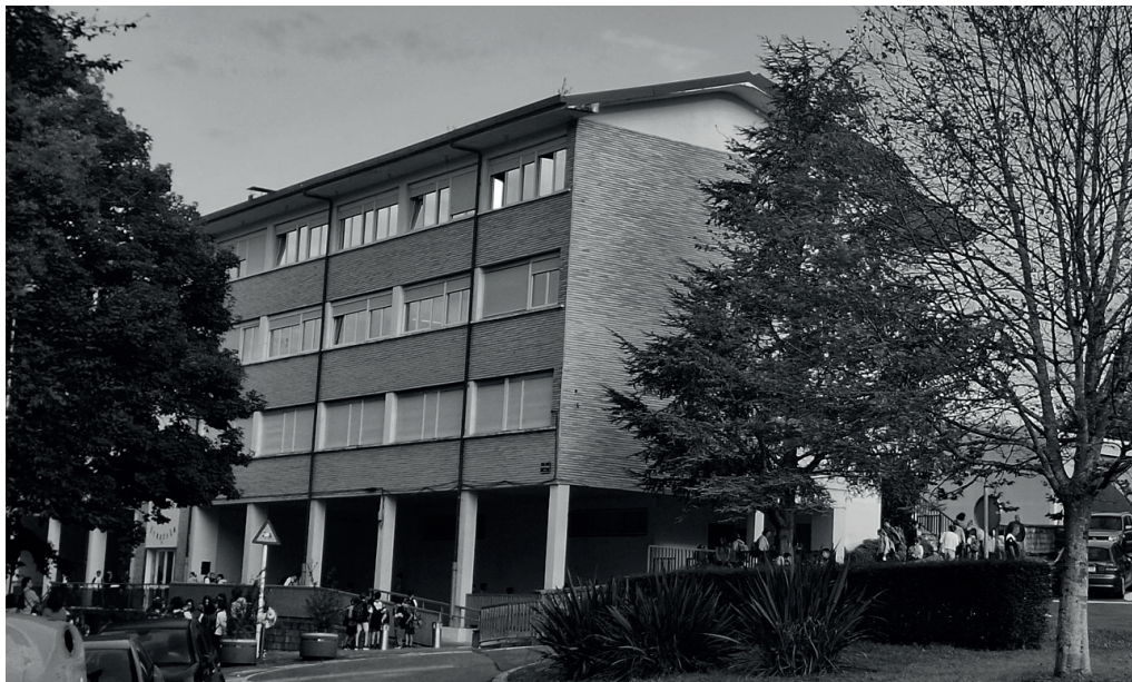
Agerialdeko teilatuan kokatuko dute sorkuntza fotovoltaikorako instalakuntza.