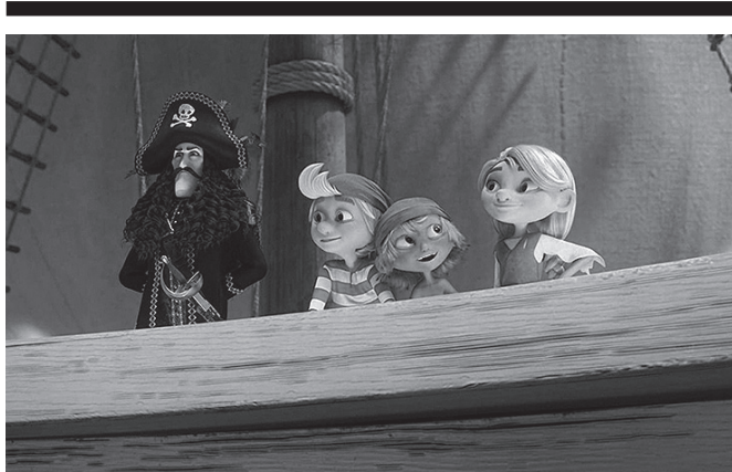
Igande honetan, 'Sabelhorts kapitaina eta diamante magikoa' Sutegin ikusgai.