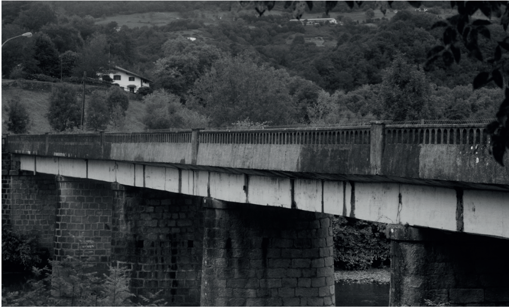
Txokoaldeko zubia birgaitzeko uztailean hartutako erabakia berretsi zuen udalbatzak azken osoko bilkuran.