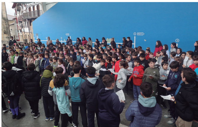
Euskaratik eta euskaraz abestu zuten Udarregiko ikasleak.

zikloa. Kantu taldea aipatuta, gogoan izan, amaitzeaz duen ikasturtea agurtzeko kantubazkaria antolatua duela iganderako, abenduaren 15erako 13:30etan Artzabalén. Bankako Menditarrak taldekoak gonbidatu dituzte hitzordu honetara. Otordurako izena abenduaren 10a baino lehen eman beharra zegoen.