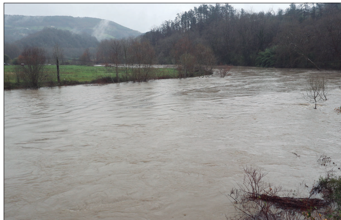
Urak handi astelehen goizean. Txokoalde parean.