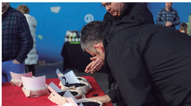
Babarrun lehiaketako epaimahaia, indabak aztertzen.