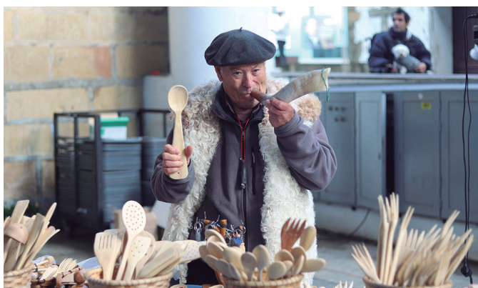
Egurrez egindako etxetresnak saltzen dituen gizona, adarra jotzen.