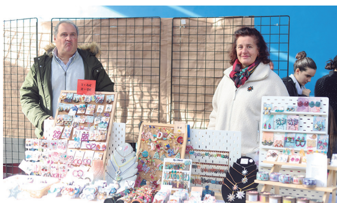
Bitxiak saldu zituen bikotea, postua jarri berritan.