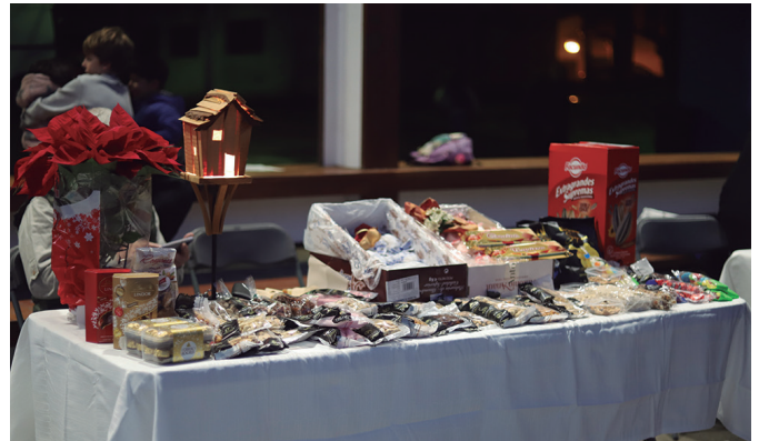
Gabonetan mahaia gozoz betetzeko aukera.