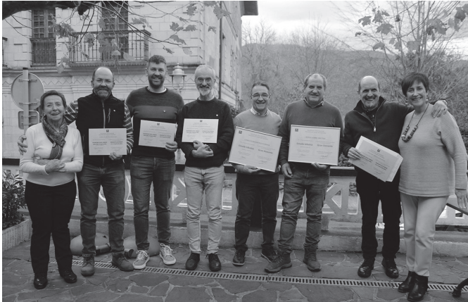
Argazkian, iazkoan omendu zituzten odol-emaileak.