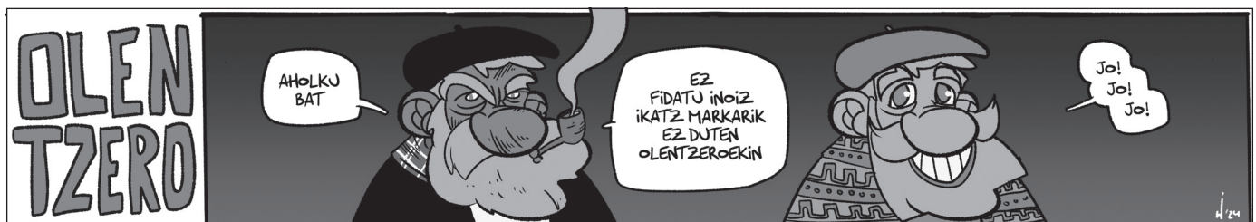
Unai Gaztelumendiren komiki-tira, TOKIKOMeko hainbat hedabideren eskutik.