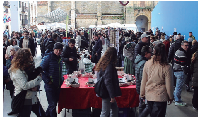
San Tomas azokan bazen zer ikusi, zer dastatu eta zer erosi.

Hala ere, sagardo zein babarrun ekoizleak izaten dira San Tomas azokako protagonista