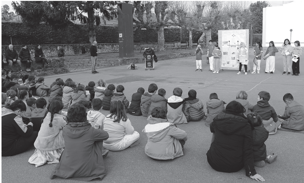
Abenduaren 13an, errebote jokoari buruzko informazio-panel bat aurkeztu zuten Zubietan.