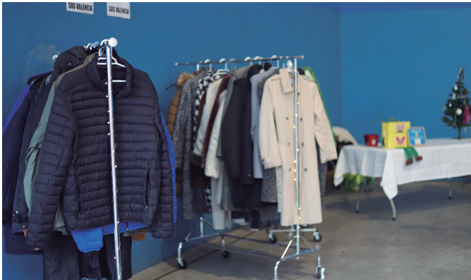
Valentziara laguntza bidaltzeko postu berezia jarri zuten auzotarrek.

Antolatzailea: Santuenea Kultur Elkarte.