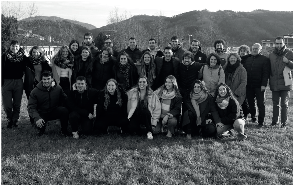
Elkarguneko kideek, egitasmoaren kokalekua aurkezteko urte hasieran eginiko agerraldia.

→ Dinamika batzuk egin eta gero, denok batera musikaz eta txistorra pintxoekin gozatu dugu. Abenduaren 23an, Usurbil 1936 memoria elkarteak egindako lan izugarria gazteriarengana helarazi asmo dugu, bisita gidatu batekin. Arratsaldean, Aztarririk izango dugu. Iaz, hasi zen antolatzen gazte asanblada gabonetako kontsumo ereduaz zalan-tzan jartzeko. Iazko gazte topaketak logika horretan etorri ziren. Aurten, arropa eta liburuak bildu nahi ditugu bereziki. Azoka egunean, iaz bezala, utzi ahalko da hartu gabe, hartu ahalko da utzi gabe, bigarren bizitza ematea da helburua.