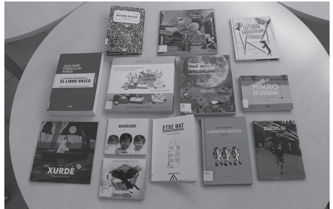
Argazkian duzue 2024ko uzta. Delirium Tremensen azken CDA falta da.