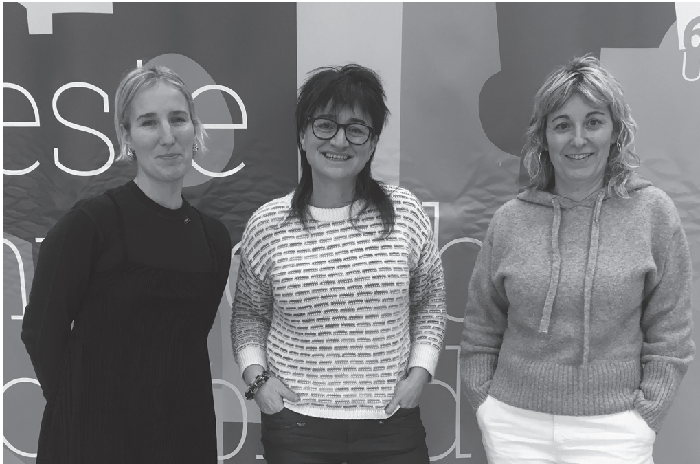
Udalak eta NOAUA!k, 650 Usurbil Bizi proiektuaren bultzatzaileek, 2024 urteko balantzearen berri eman zuten aurreko astean.