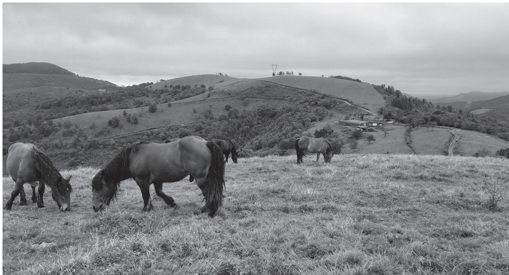
Ezkeltzuko zati bat Usurbilgo lurretan da. Eusko Jaurlaritzaren ebazpen batek bertan behera utzi du egitasmoa. AIURRI.