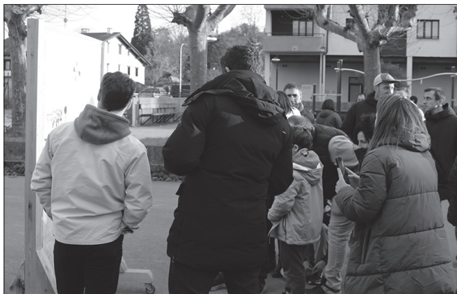
Aurkezpenaren amaieran, jende ugari hurbildu zen panel informatibora.

Aurreko asteko aurkezpen ekitaldian erakutsi zutena eredu modukoa izango da, eta eredu horri segika eraiki-koto dute panel definitiboa.