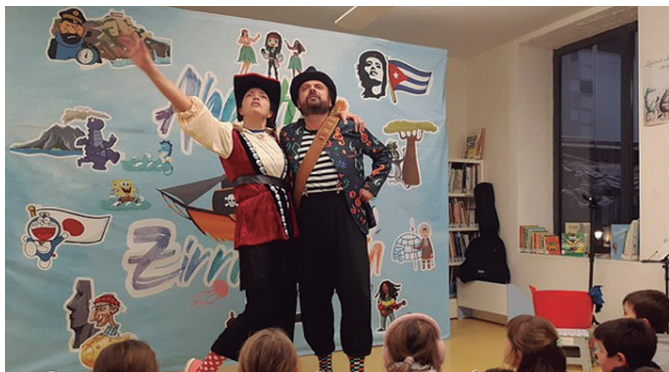
Perli eta Koxkolo udal liburutegian izan ziren aurreko astean. UDAL LIBURUTEGIA.