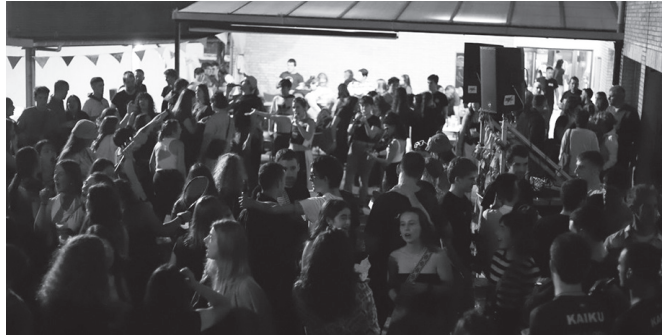
"Onerako zein txarrerako, gizarteari begiratzeko erakusleihu apartak dira festak".

Aurtengoan adibidez, Orion, Gazteen Ahotsa izeneko talde bat sortu omen da. Ustez, azkenaldiko festen egitarau edo kutsuarekin bat ez datozen, eta aniztasun gehiago aldarrikatzen duten gaztetxoak batu dira. Talde berri honen sorrera pozgarria da hein batean, gazte berriak antolatu eta euren proposamenak herriratze-