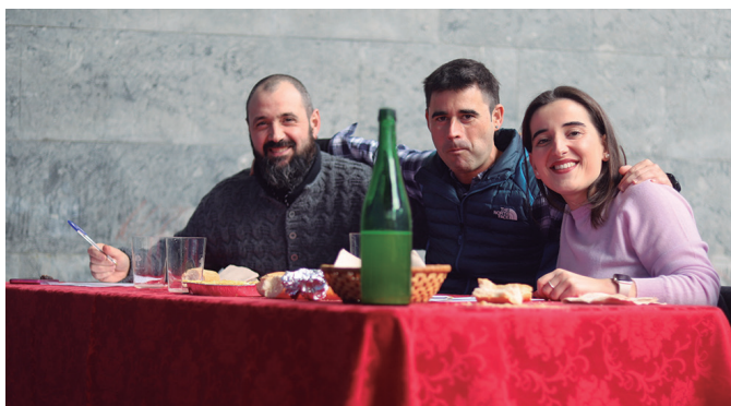
Epaimahaiko kideak sagardoa dastatzen.