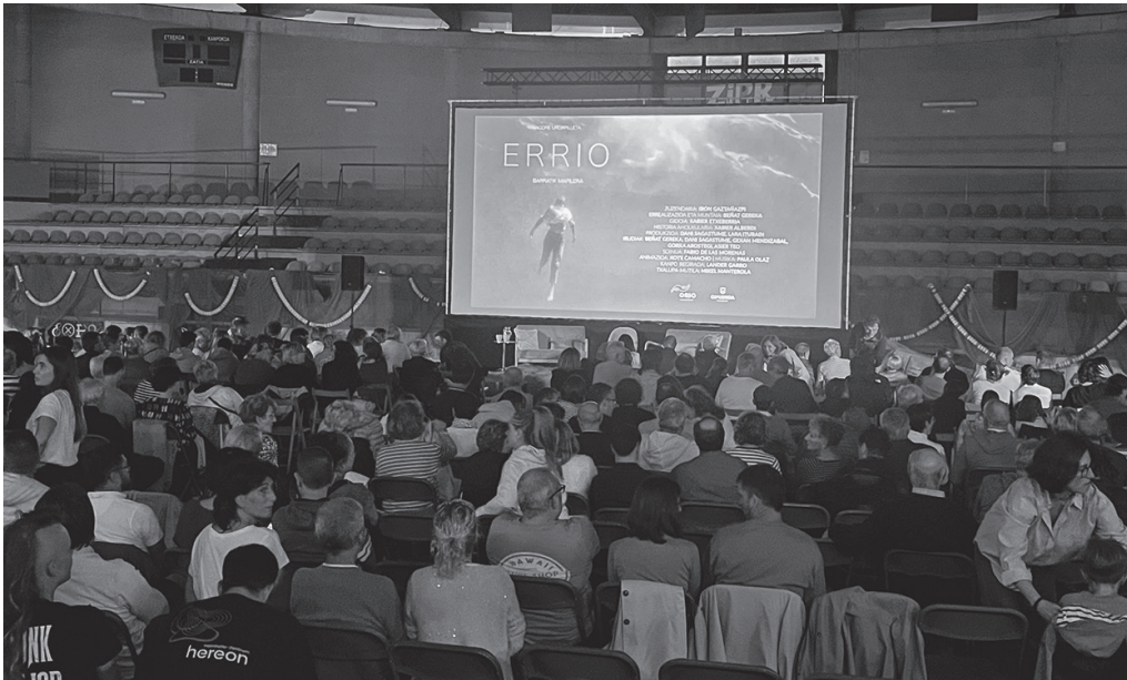
'Errio' dokumentala Aginagan eskainiko dute abenduaren 22an, 17:30ean, Eliza Zaharrean.

eta toponimia hori hor dago. Marrota Orioko marea errota izenetik dator. Ontzien hilerri bat ere bada, baina jakin egin behar non dagoen. Ortzaiak hori nondik dator? Ostrak egiten zirelako garai batean. Itzao baserria, XVII. mendean, gariaren iraultza etorri zenean, errioiari irabazitako lur horietan Ameriketatik ekarritako artoa landatzen zuten. Ikusgai daude horiek denak, baina ikusten jakin behar da eta historia pixka bat ezagutu. Andatzako basoan ere haritzekin ontziak egiten zituzten, eta hori ikus daiteke, baina azalpena behar du. Hori egiten saiatu gara.