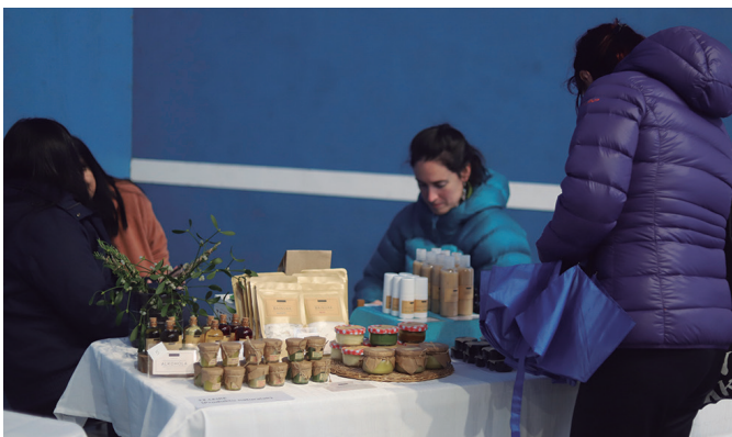
Etxean egindako artisauro produktuak jarri zituzten azoka sarreran.