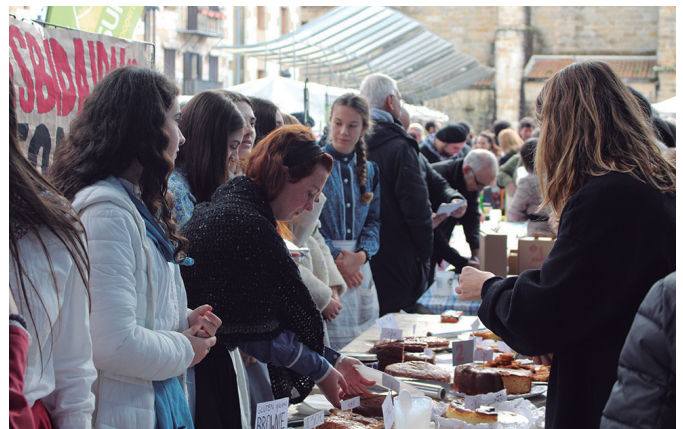
Jende asko pilatu zen Udarregiko ikasleen postuaren alde banatan.