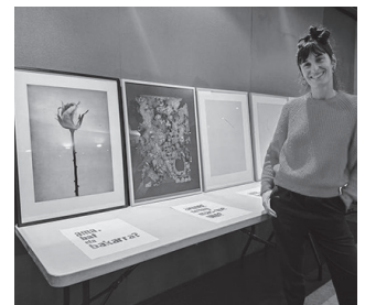
'Ama ta Asunak' erakusketa Emakumeon Etxean topatuko duzue.