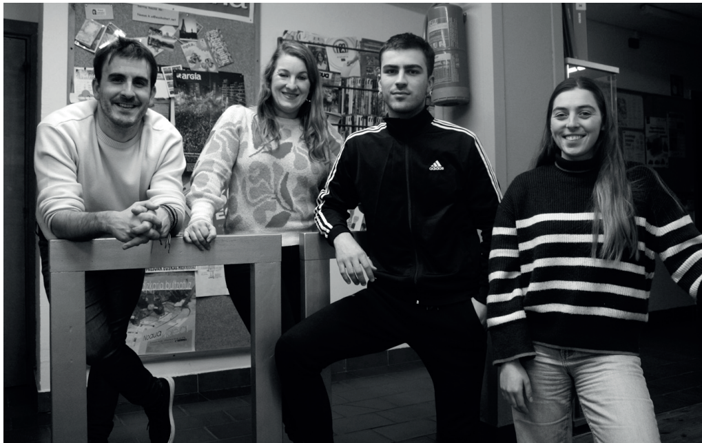
Elkarguneko eragileetako ordezkariak, NOAUA!ri eskaintako elkarrizketa uanean.