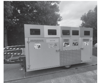
Garbigune mugikorra martxan izango da egunotan.

Atalluko Garbigunera joan ezin dutenei zerbitzu hau ger-