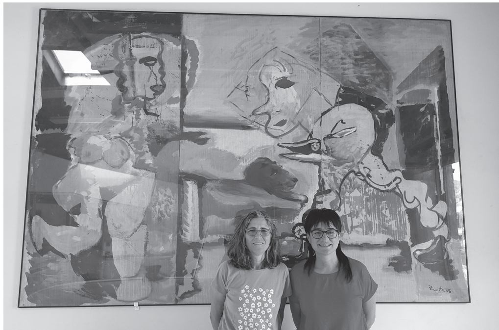
Udalak uztailean erosi zuen Zumetaren 'Usurbilgo Lehoia'. Bisita gidatuen katalogora batuko da.