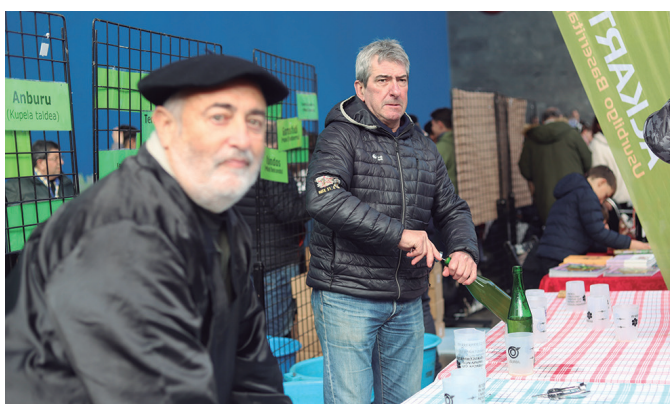
Lehiara aurkeztutako sagardoa dastatzeko aukera egon zen.