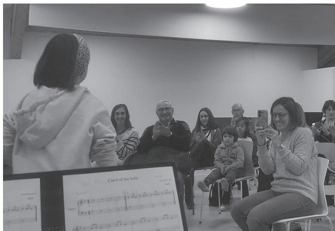
Piano ikasleak kontzertua eskaini zuten Zumarteko ganbaran.

Lan hauek eskuragarri dituzue Laurok eta Lizardi liburudendetan, Aitzagan edota Sutegi udal liburutegian.