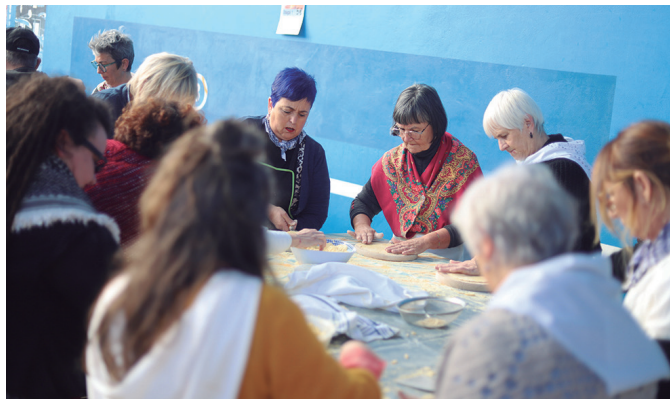
Usurbilgo talogileak goizean goizetik hasi ziren lanean.