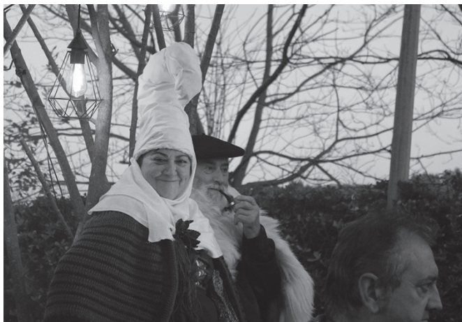
Olentzero eta Mari Domingi gure artean izango dira datorren astean.

Ibon Gaztañazpi eta Nagore Urdapilletaren dokumentala. 17:30 Eliza Zaharrear.