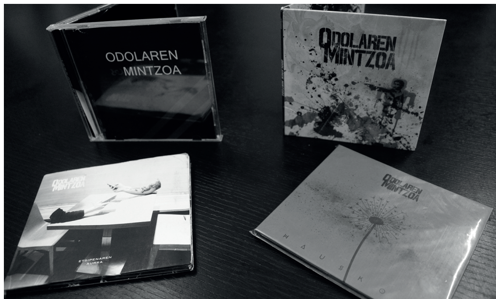
Odolaren Mintzoak hemezortzi urteko ibilbidean kaleraturiko sortze lanak.

Odolaren Mintzoaren kasuan soilik ez, orohar, kultur sorkuntza beti dago garaian garaiko testuinguru sozialari lotua. Betiko bi inspirazio iturri ditugu: pertsonen arteko maitasuna eta herriarekikoa. Bi gai horiek landu ditu Odolaren Mintzoak. Gai lokalak ere bai, erraustegiaren borrokan genbiltzan garaian, Minabizi abestiarekin egin bezala. "Hauskor" azken lanean, gai orokorrakoak, barrura begirakoak ere txertatu genituen. Hor dago, "Dos pueblos una voz" herrien arteko elkar-