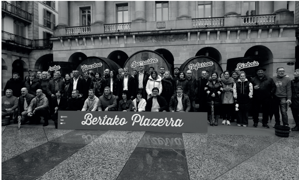
"Bertako plazerra" aldarripean aurkeztu zuten urtarilaren 9an Donostian txotx bolada berria.