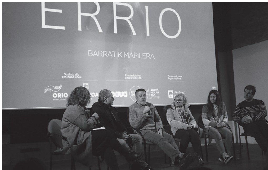
'Errio' filmaren ondorengo proiektzioan esan zenez, "orain da unea, itsas eta errio kultura berpiztekoa".

→ Aginagaren kasuan, nola bat egin zuten errio barruko jarduerak, landa eremuarekin. "Itsasoa-baserria lotura" hori solasaldian zehar aipatu zuten sarritan, eta hor, tartean, sagardogintzakedota basogintzak