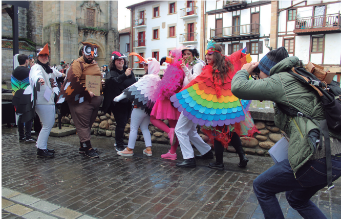
"Fauna", hori izan zen iazkoan proposatu zen tematika. NOAUA