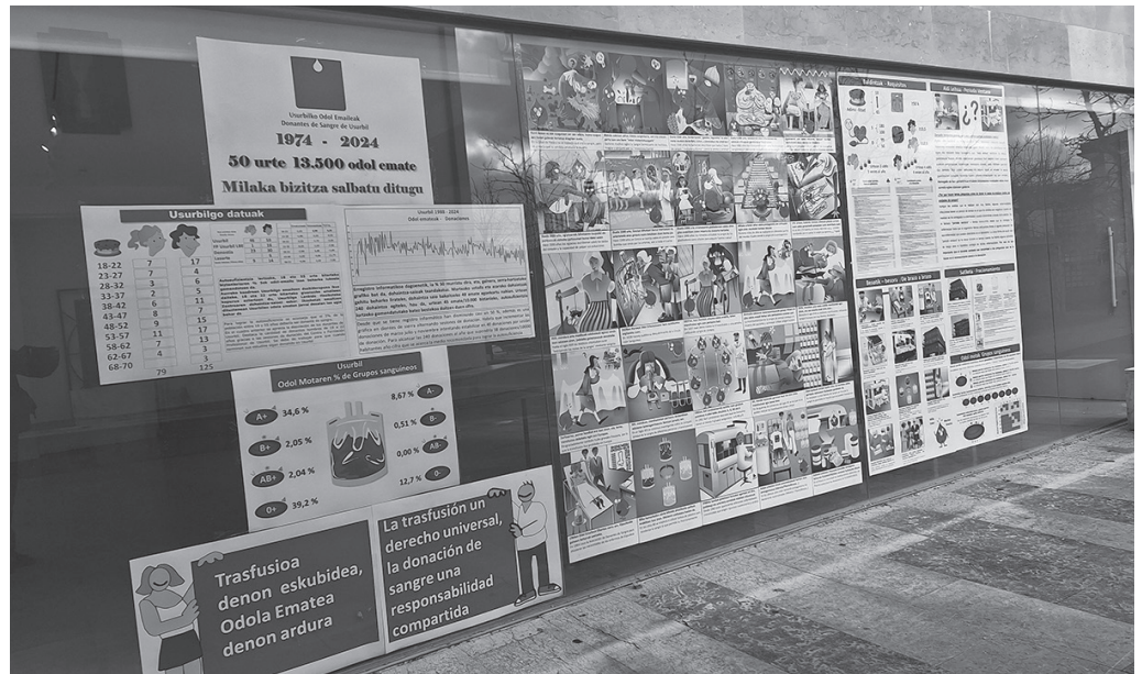
Odola ematearen beharraz ohartarazi nahi digute erakusketa honen bidez.

Urteurren borobila eguntan ospatuko dute, hamabostaldi honetan bertan. Erakusketa dagoeneko zabaldu dute. Bi hilean behin egiten duten moduan, astelehen honetako, urtarrilaren 13ko odol-emaitearekin batera albiste honi atxikia duzuen argazkian ikus dezakezuen moduan, zenbait panel kokatu dituzte Sutegiko erakuslehoan.