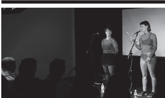
Mejillon Tigre kolektiboa larunbat honetan arituko da, arratsaldeko 19:00etan.

Sarrerak eskuragarri: Aitzagan eta Txirrista tabernan nahiz usurbilkultura.eus web orrialdean. Egun osoko jarduna.