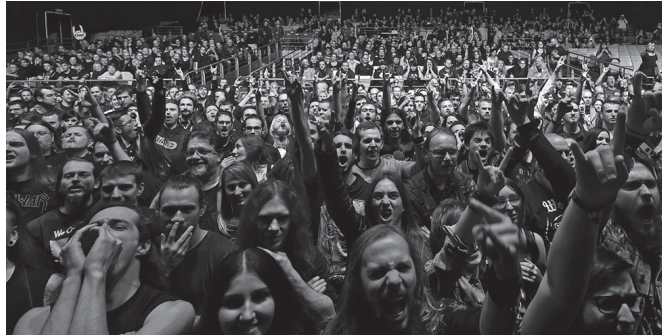
"Jende guztia han eta ni ez? Ezta pentsatu ere. Nik ere han egon behar dut".