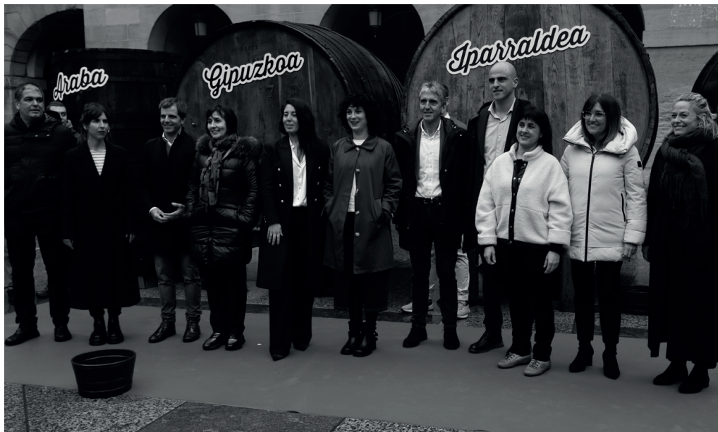
Euskal Sagardoa jatorri deituraren baitan lankidetzan diharduten erakundeetako ordezkariak.

—> dartuko duela ziurtatu zuen; "erreferentean bilakatuko gaitu". Izan ere, "mundu mailako mugaz gaindiko lehen jatorri deitura izango da". Horrekin batera, urrats honek "ekoizpen gaitasuna indartuko du".