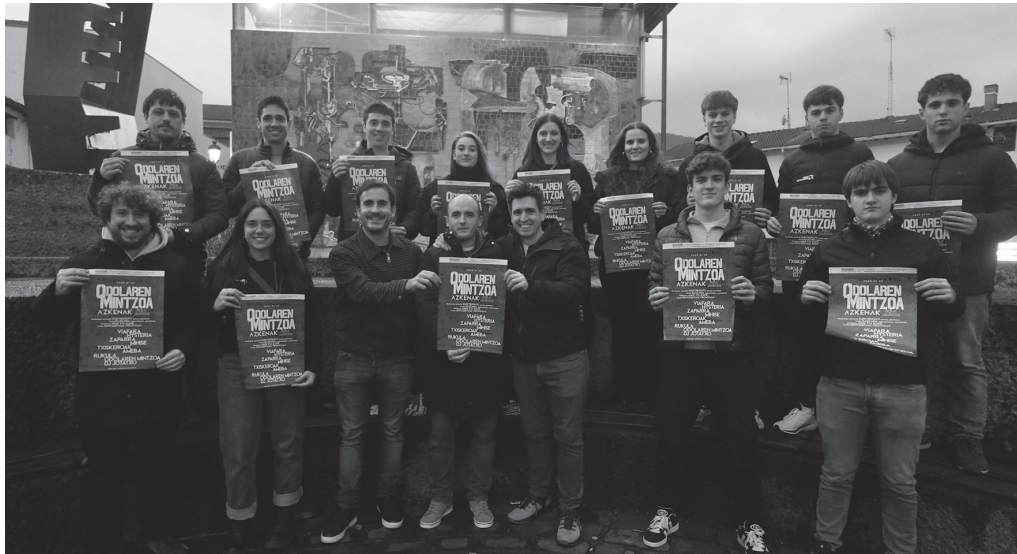
Odolaren Mintzoa taldeko kideak, bere agurrean bidelagun izango dituzten herriko musikariek.