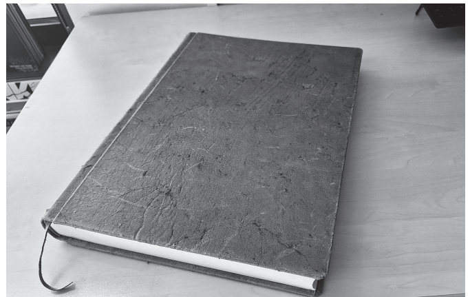
Udal liburutegian, erregistro liburu hau jarri dute herritarren esku.