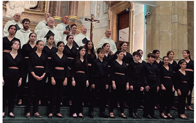
Easo abesbatzako kantariak Salbatore elizan arituko dira datorren astean.

• Antolatzailea: Usurbilgo Odol-Emaileen Elkarteak.