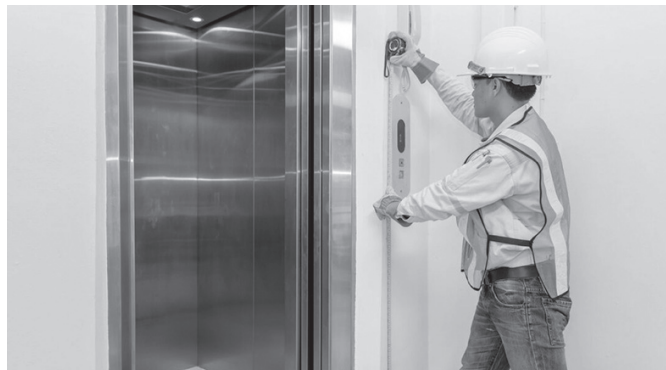
Igogailua instalatzeko udal dirulaguntza deialdira 40 eskabide aurkeztu ziren.

Deialdi honen baitan, eskabideak aurkezteko bi epealdi finkatzen ditu Udalak. 2024ko