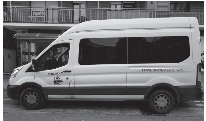
Bidez Bide landa eremuko bizilagunentzako garraio zerbitzua da.

Bigarren aldaketa: "eremu horretako etxe edo baserrietatik kaxkora jaisteko, erabiltzaileek alde aurretik eskatu beharko dute zerbitzua, gutxienez egun bat lehenago, betiere ohiko ordutegien barruan (07:30, 10:30, 13:30, 15:30 eta 19:00). Bidez Bide zerbitzura telefonoz deitu beharko dute horretarako: 630 643 596".