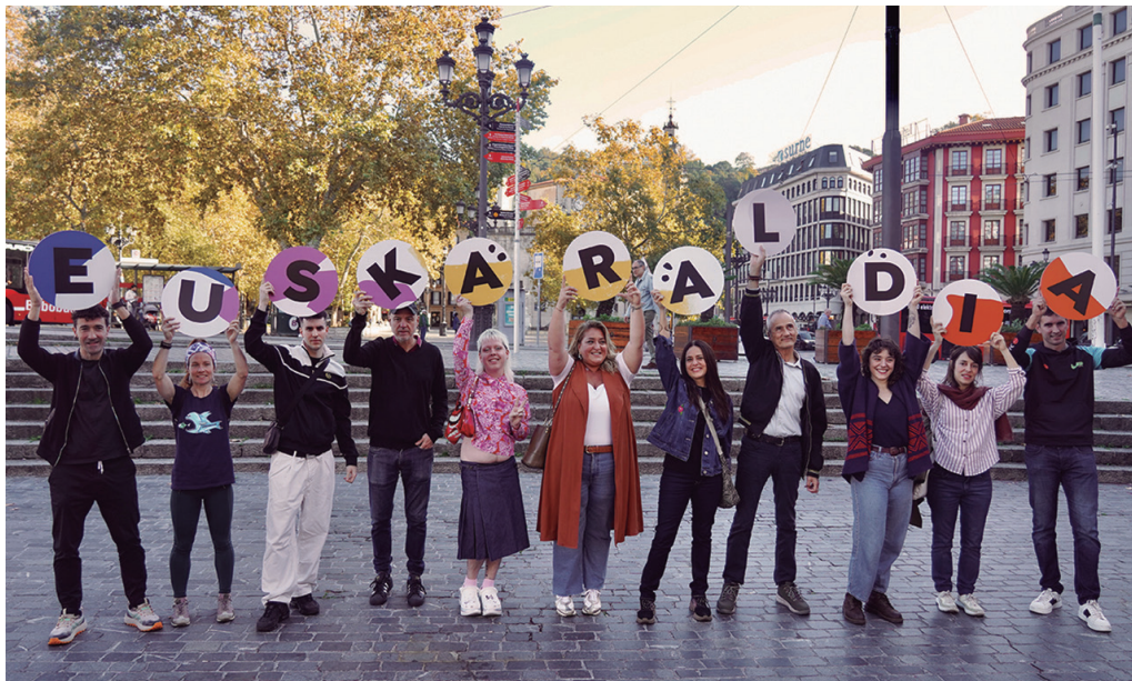
Euskaraldia maiatzaren 15ean hasi eta 25ean amaituko da.