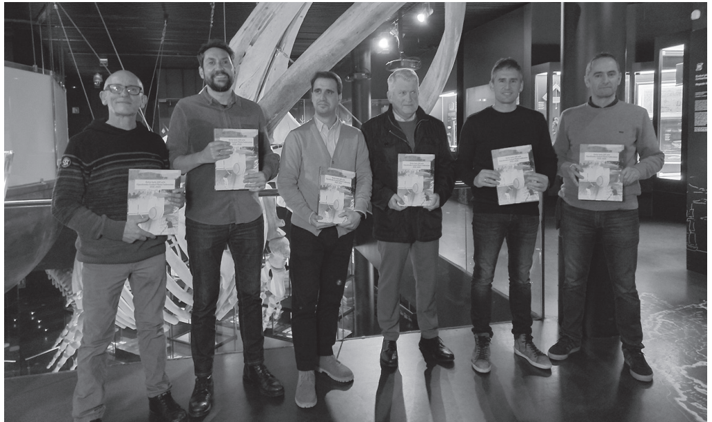
Gipuzkoako Euskal Pilota Federazioak plazaratu du 'Botez bote 100 urte' liburua, hainbat instituzioen laguntzarekin.

Ez dut uste herri guztiek pilota kluba dutenik. Batzuk desagertu egin dira, eta sortzaile horietako asko jada ez daude, eta beste batzuk mantendu dira, Añorga adibidez.