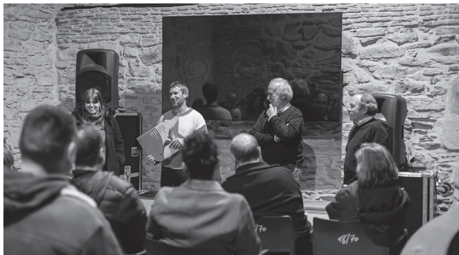
Martxoaren 27an eskaini zuten ikusentzunezkoa Eliza Zaharrean.