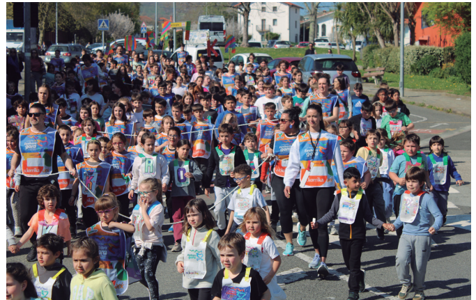
Euskararen aldeko aldarriak nagusitu ziren Udarregikoan Korrika Txikian.

Kilometroaren eresketa finantzatu eta AEK laguntzeko elkartasun proiektua bideratu dute maila horretako ikasleek azkenaldian. Azoka solidarioa egin zuten Agerialdeko patioan astebetez. "LH6ko ikasleok kilometro bat erosi eta herrian korrika egiteko aukera izan dugu, eta hori posible izan da zuen laguntzari esker. Azokan, Korrikako petoak, belarritakoak, bizkotxoak... saldu genituen, eta egunero guraso