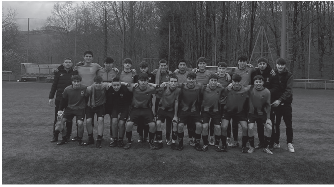
Argazkian, Usurbil Futbol Taldeko ohorezko jubenil taldea. USURBIL FUTBOL TALDEA