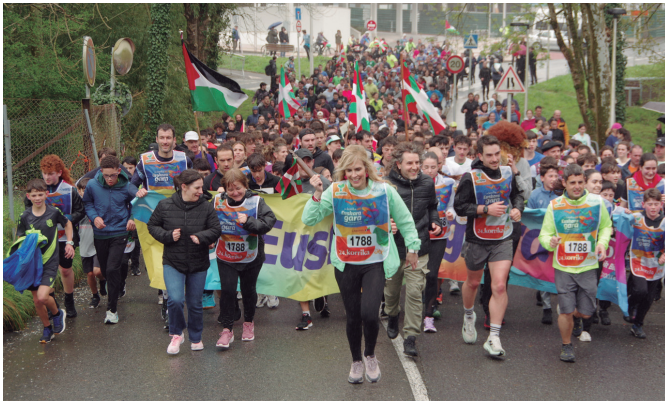
24. Korrikaren lekukoa Udarregi ikastolakoen esku.