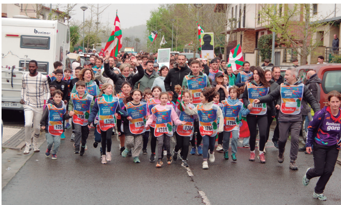
Zubietako eskolako belaunaldi gazteenak lekukoa hartutako uena.