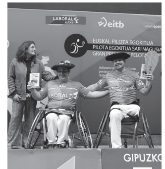
Zumarragan jokatu ziren finalak.