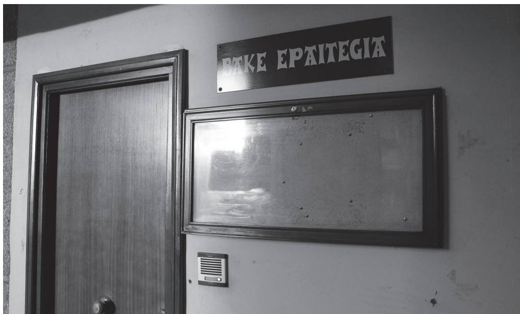
Bake epaile ordezkia hautatzeko deialdia abiaraztea onartu zuen udalbatzak martxoaren 26ko osoko bilkuran.

Hutsik dago Usurbilgo bake epaile ordezkioaren lanpostua. Hura betetzeko iragan udazkenean udalbatzak eginiko deialdira ez zen inor aurkeztu. Horregatik, orain deialdi hori onartu eta abiarazi du udal organu berak. Martxoaren 26ko osoko bilkuran udalbatzak aho batez onartu zuen, "hilabete bateko epea finkatzea iragarkia Gipuzkoako Aldizkari Ofizialean argitaratzen den biharamunetik kontatzen hasita, Usurbilgo Bake Epaile ordezkia izateko interesa dutenek eskaerak aurkeztu di-