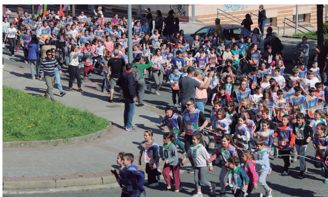
Euskararen alde lasterketa jendetsua egin zuten Udarregikoek.