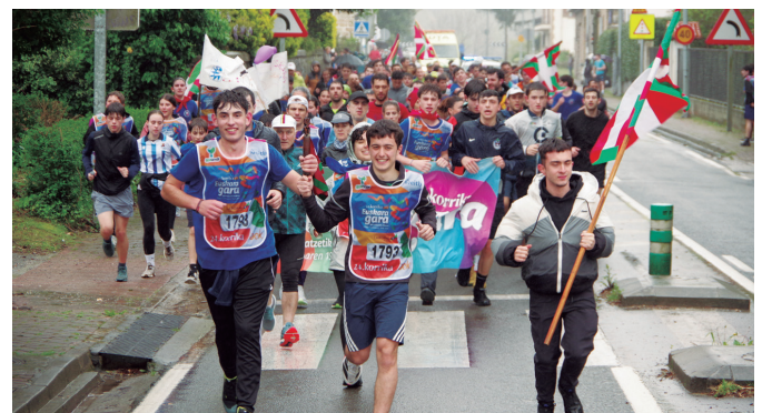
Aginagako jai batzordea lekuko eramaileetako bat azken metroetan.