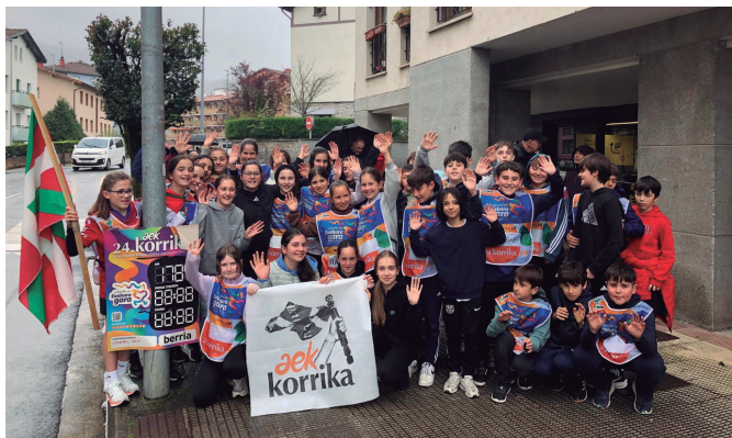
Korrika eta AEK laguntzeko elkartasun proiektua sustaturiko taldea.

"ZUEN BABESAREKIN, EUSKARAREN ALDE KORRIKA EGITEN SEGITZEN DUGU!"