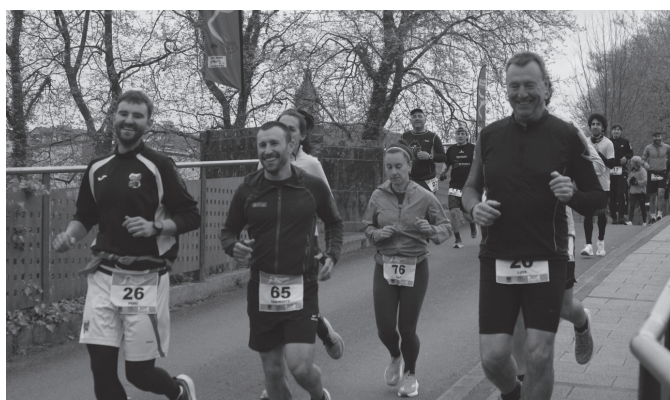
Herri ordezkariarik ez da falta izan bigarren edizio honetan ere.

"GOGO ASKOREKIN GAUDE, ILUSIOZ BETETA ETA HIRUGARREN EDIZIO BAT EGITEKO PREST"