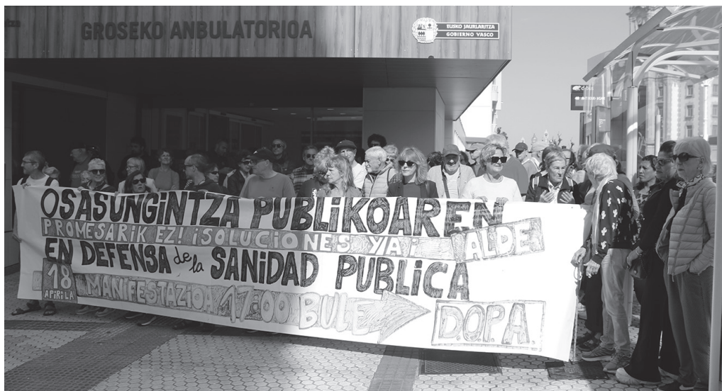
Profesional eta baliabide falta salatu zuten apirilaren 9an, Groseko anbulatorio atariko elkarretaratzetik.