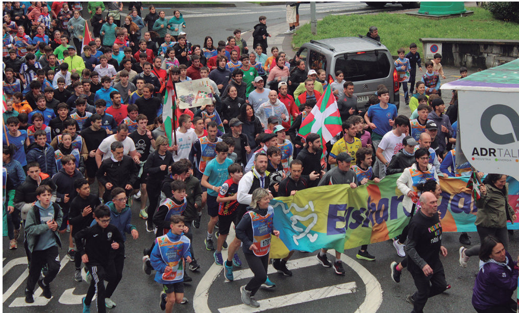
24. Korrika martxoaren 25eko eguerdian herri erdigunera heldutako unea, lekukoa udal langileek eskuartean zutela.