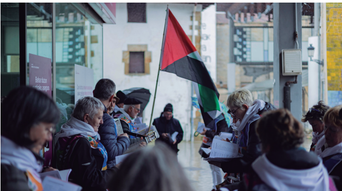
Korrikari eskainitako kantu-jiran plazaratu ziren martxoaren 28an.