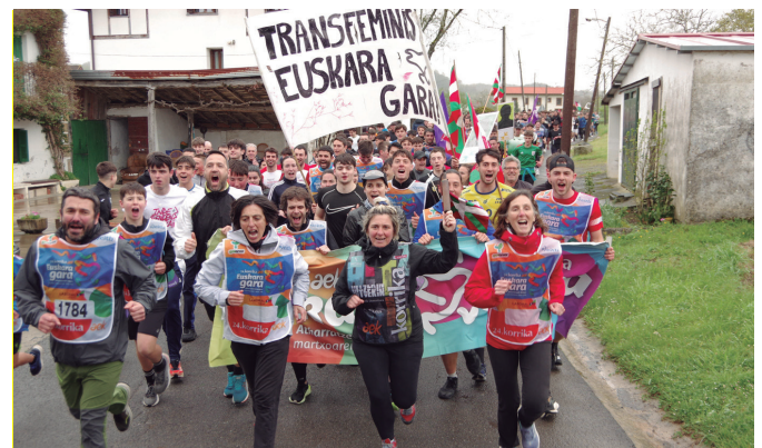
Zubietako Herri Batzarreko kideak, 24. Korrikaren buru.