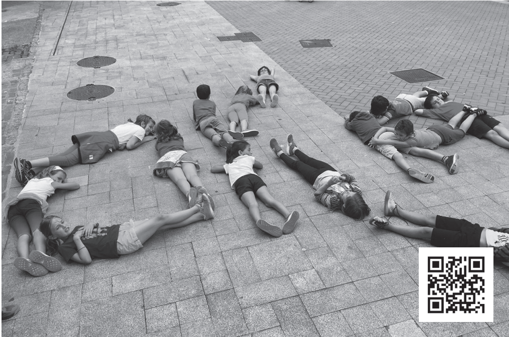
Udajolas uztailaren 6tik 30era egongo da martxan. Izen-ematea ordea, egunotan egin beharra