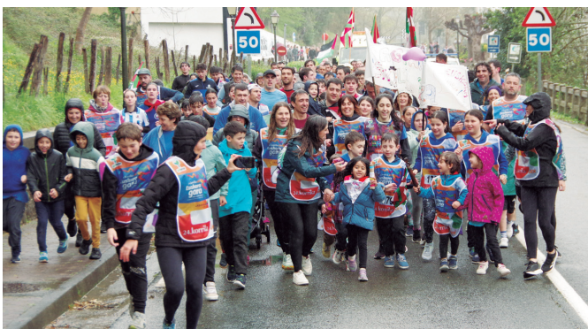
Eskolakoen eskutik heldu zen 24. Korrika Aginagara.