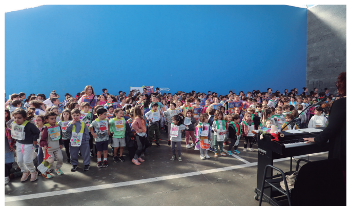
Euskarari kantuan amaitu zuten Korrika Txikia, HH eta LH-koek.