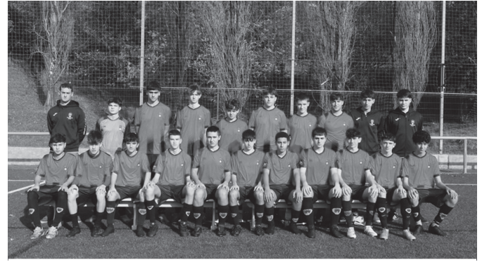
Usurbil Futbol Taldeko 1. Mailako jubenil taldea. USURBIL FUTBOL TALDEA