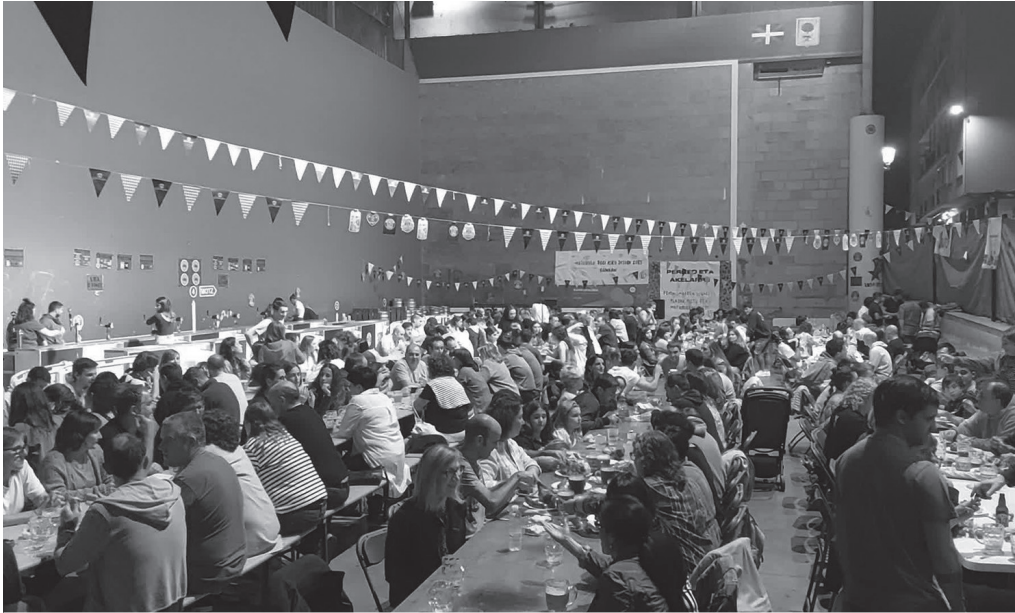
2022ko urrian, Usurbil K.E.-k eta Usurbil F.T.-k elkarrekin antolatutako Garagardo Azokan eginikoa da argazkia. NOAUA