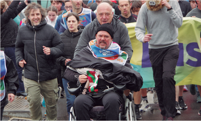
Kalezarko zaintzadun etxebizitzan auzuneko lekuko hartzea.