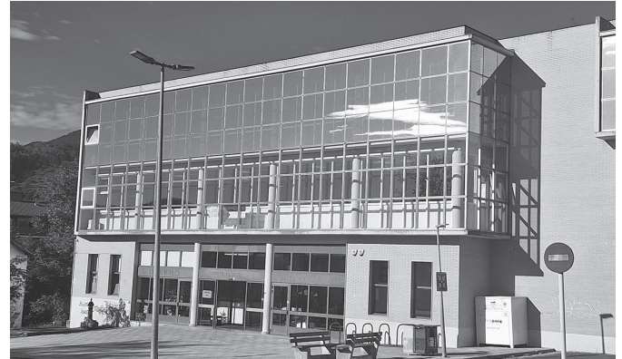
Aurreikusitako baina gehiago luzatu da lanak esleitzeko prozesua.

Udazkenerako ireki nahi da Udalak 641.000 euroan baloratu zituen kalteak. Obrak egin ahal izateko prozedura ahalik eta gehien azkartzeko, eta horretarako gaitasun ekonomikoa zeukalako, 641.000 euroko kreditu aldaketa onartu zen urriko osoko bilkuran. Udalak aditzera eman duenez, "aseguru etxeak oraindik ez du ofizialki jakinarazi sutearen kalteak zenbateraino estaliko dituen".