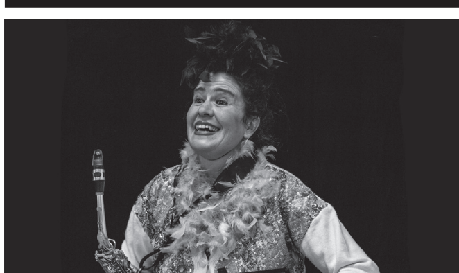
Larunbat honetan, 19:00etan, Emakumeen Etxean.