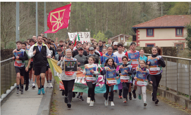
Auzoan ere euskaraz bizi nahi dutela aldarrikatu zuen Santuenea K.E.-k.