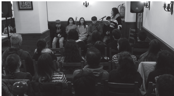
14-18 urte bitarteko kanporaketan ez zen usurbildarrik izan.

konpontzera". Egingo dituzten lanei dagokienez, Udalak zehaztu duenez, "Urkamendi eta larbe arteko bideko asfalto altxa, eta hormigoizko bide berria egingo da". Udaletik gaineratu dutenez, lanak amaitu eta hurrengo hiru asteetan, partzialki itxita segiko du ibilgailu astunentzat bide horrek.