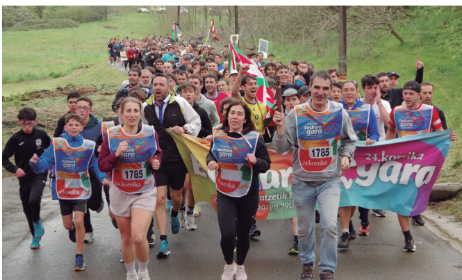
Akaba eta Fagor Ederlan lantegiek eraman zuten lekukoa Zubietan barrena.