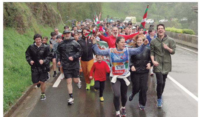
Ta Puntu kooperatibako kideak gogotsu lasterka lekukoarekin.