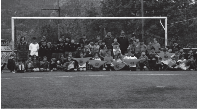
Usurbil Cup txapelketa berreskuratu zuten apirilaren 10ean.