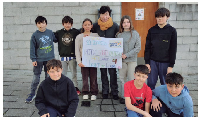
LH6-koek bildutako laguntza Etumeta AEK euskaltegiari helarazitako unea.