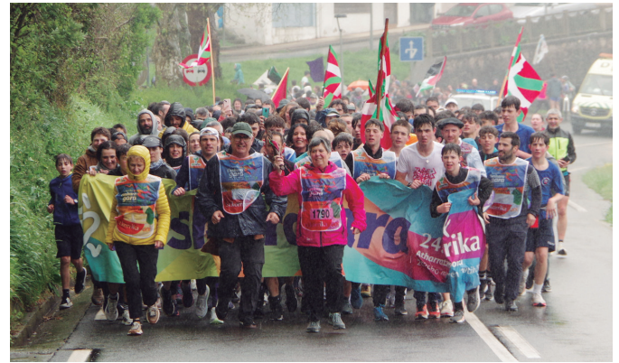
Elhuyarreko beteranoak euskararen alde lasterka Aginagarantz.