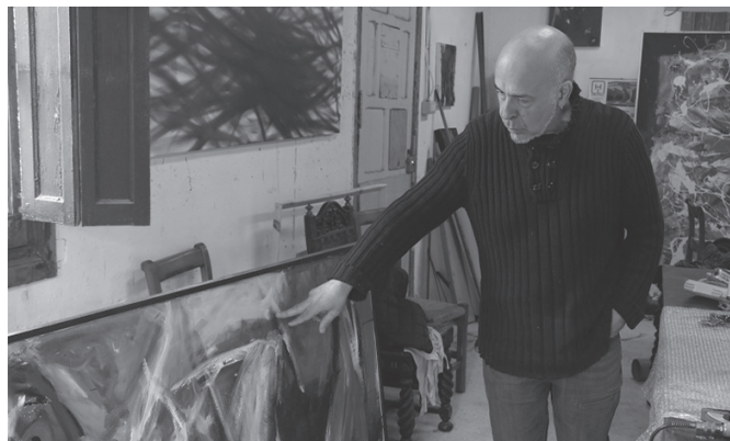
Apirilaren 17an, 'Polen' erakusketa hobeto ezagutzeko aukera izango da.