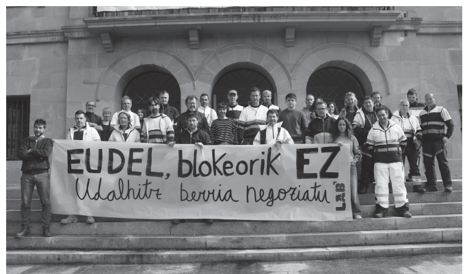
LAB-ek deituta, udal langileek martxoaren 26an eginiko informazio bilkura.

langileak. Apirilaren 17an elkarretaratze bateratuak deitu dituzte, hilaren 23an bi orduko lanuzteak 11:00-13:00 artean eta maiatzaren 14an eta ekainaren 4an egun osoko greba. "EUDELi eta EAJ, EH Bildu eta PSE-EE alderdi politikoei exijituko diete Udalhitzeko eta udaletako mahaietan lan-baldintzak hobetzea hemen eta orain negoziatuz". Gutxieneko aldarrikapenen zerrenda adostu dute; besteak beste, urteotan galdutako erosahalmena berreskuratzea, 1.500