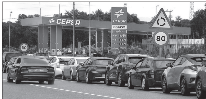
Gasolioak 1,94 euroko prezioa eduki du egun batzuetan eta orain 1,90 eurotan dago.

Prezio horietan, petrolio gordinaren edo Brent upelaren