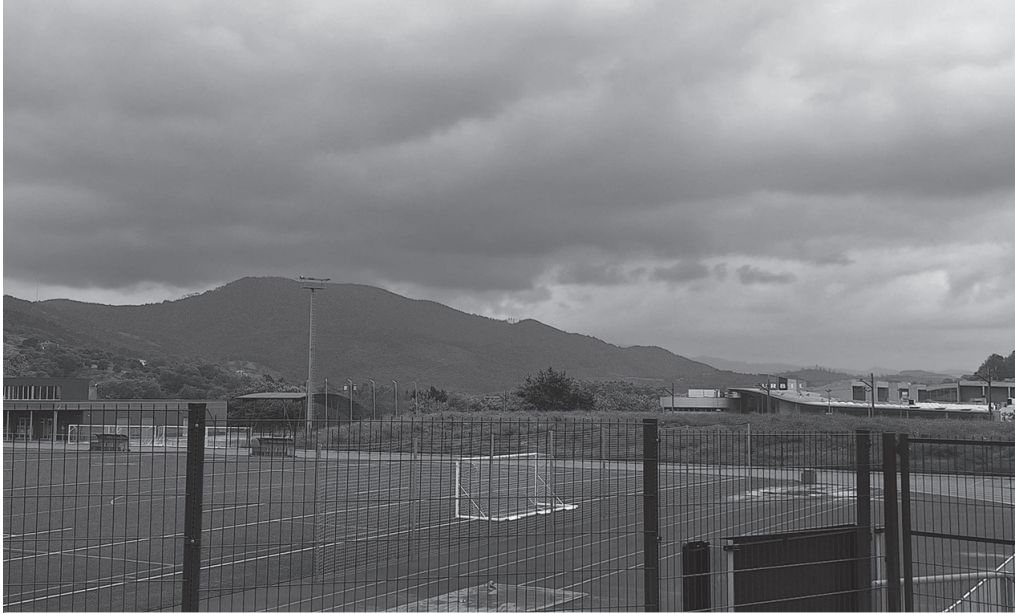
Atsobakar eremuko partzela desafektatzea onartu zuen aho batez udalbatzak martxoaren 26ko osoko bilkuran.