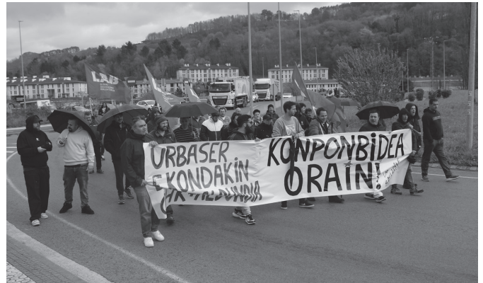
Martxoaren 26an Bugatitik barrena eginiko mobilizazioa.

kin batera. Benetako toxikotasuna ez dietela aitortzen salatu zuten. Hilaren 24an zuten bilera enpresako zuzendaritzarekin. "Eskaintza bat jaso dugu, aurrekoarekin alderatuta" atzerapausotzat jo zutena. Bileran hitz egindakoa eskatu zioten enpresari langileen batzordetik adierazi zuten, baina "guk jasotakoa guztiz aldatua izan da, mahaian hitz egindakorekin alderatuta". Horrekin batera, enpresatik bileran adierazi zieten, "arazo