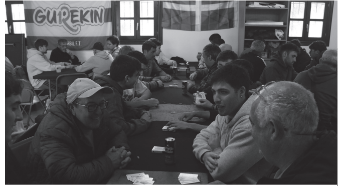
Mus txapelketa jendetsua jokatu zuten iragan larunbatean.