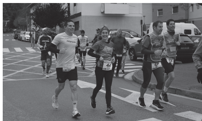
120 partaide baino gehiago erakarri ditu aurtengo edizioak.