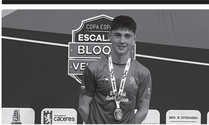
Martxoko azken astebukaeran, blokeko kategorian nagusitu zen.