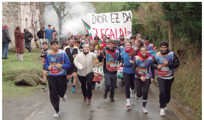
Aztarrikak eta Kolore Guztiak Elkarteak lekuko hartzea partekatu zuten.