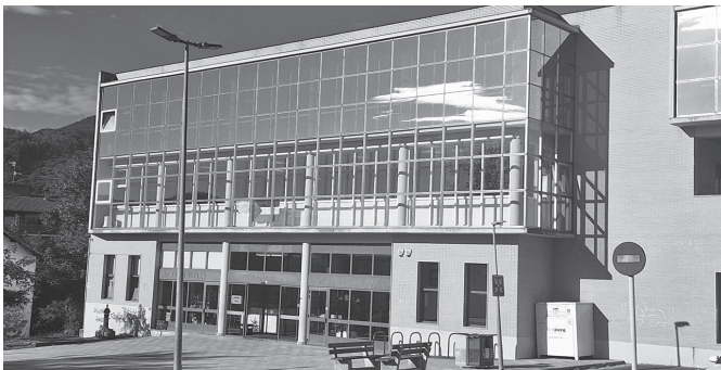
Aretoko ikastaroen eskaintza nagusituko da uztaila honetan.

ez dira 50. urtemugaren hari- ra Usurbil F.T.-k antolaturiko bakarrak. Izan ere, tartean, herri bazkaria iragarri dute ekainaren 27ko jaialdian. Otor- durako aurrez izena eman ahalko da maiatzaren 3ra arte, Usurbil F.T.-ren sare soziale- tan. Hala egiten dutenek, gero, lehen tasuna izango dute izen-emate ofizialean.