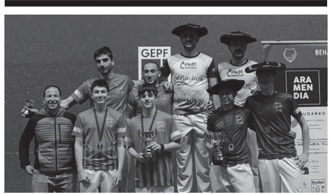
Joko garbiko jokalariek gazteak eta helduak albiste izan dira azken asteotan.