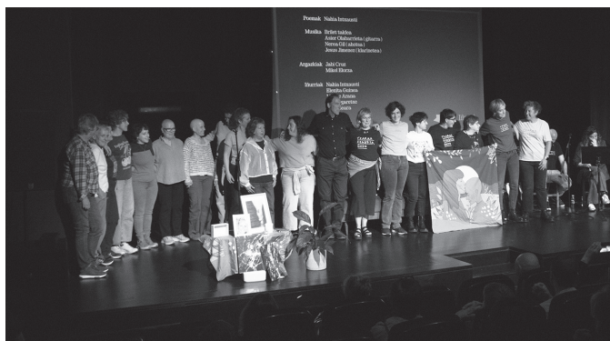
Iñurriek Sutegiko oholta hartu zuten uea.