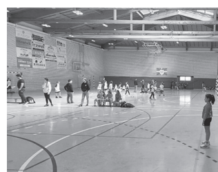
Ekainaren 22tik 26ra egingo da.

Ekimen horren aurtengo edizioa ekainaren 22tik 26ra izango dela iragarri du Usurbil Kirol Elkartek, 09:30-12:30 artean. Lehen Hezkuntzako eta DBH 1-2 mailetakoei zuzendua egongo da. "Jarduera fisikoa eta eskubaloia modu ludiko eta dibertigarrian ezagutaraztea izango da" helburua. Antolatzaileen esanetan, "parte-hartzaileek kirol honen oinarriak landuko dituzte jolas, dinamika eta jardueraren bitartez, giro atsegin eta hezitzaile batean". Ekimenak iraungo duen egun