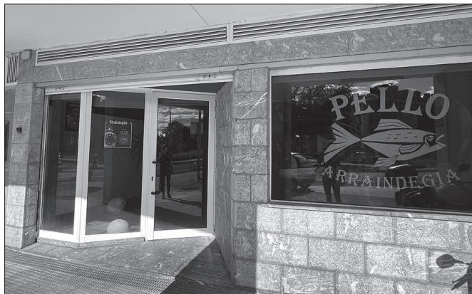
"Herriko denda asko ixten ari dira, jarraipena zalantzan dagoelarik".

Baina herriarentzat ez da "eta kito" hutsa. Herriarrontzat ondorio batzuk ditu: Usurbilen ez da arrandegirik eta burdindegirik egongo. Beraz, beste herri batera edo zentro komertzial handi batera joan beharko dugu arrain freskoa erostera. Ez da "hur-bilago" egongo, eta kilometroen distantziaz gain, harremanaren eta tratuaeren distantzia ere pairatu beharko ditugu. Ez baitira herriko