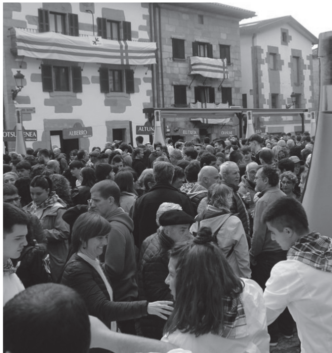
Astebete bakarrik falta da sagardo festarako.