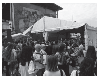
Egun osorako egitaraua prestatu dute.

Mikel Laboa plazan kokatuko du aurtengoan ere, Usurbil Ernai gazte antolakundeak karpagunea. Dagoeneko, bertan izango diren ekimenen egitaraua plazaratu du. Segidan duzue. Goizetik gauera, egun osoan zehar, hainbat ekimen izango dira.