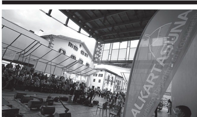
Frontoian eta Dema plazan egingo dira ospakizunak.