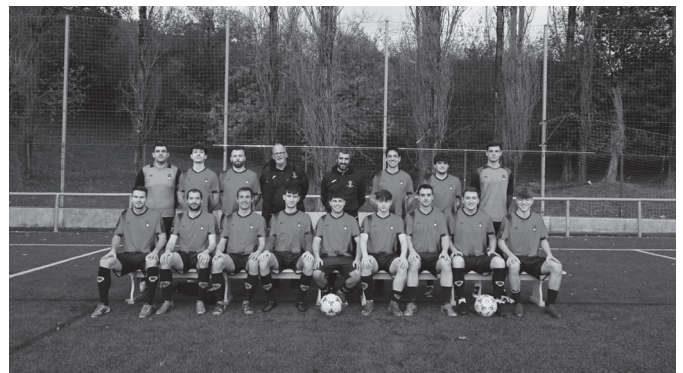
Argazkian, Usurbil Futbol Taldeko senior mutilen taldeko partaideak.