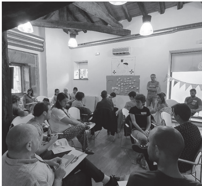
Matrikulatzeko epealdia dagoeneko zabalik da ueu.eus web orrialdean.

Euskararen eta euskaldunen adierazkortasuna mintzagai nagusi izango duen aurtengo Jakin Jardunaldia baliatu nahi dute antolatzaileek "pentsatzeko, gaur egungo Euskal Herriaren luze-zabalean eta kulturaren koadrante guztietan, zeintzuk diren euskara adierazkorra(k) lantzeko apustuen norabideak: nola probestu hortik eta hemendik-tradizioetik bezala randomkiro sortutako lagunarteetatik edo ahalduzko linguistiko-politikoetatik-jasotzea baliabideak eta esperientziak; nola lortu hiztunak baliabide horietan tre-