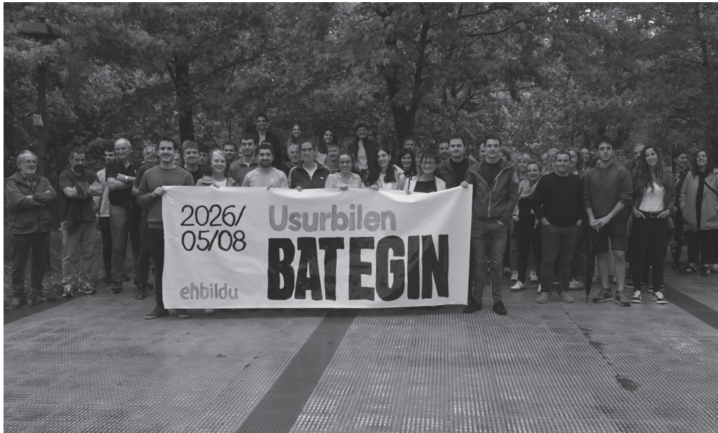
Maiatzaren 8ko "Bat Egin Eguna" ekimenaren harira, Usurbilgo EH Bilduren ekitaldira joandakoek ateratako argazkia.