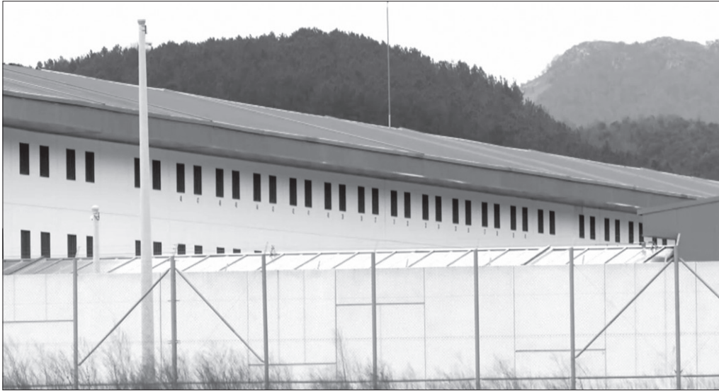
Eskuzaitzetako espetxeak Martutenekoa ordezkatzeko du.