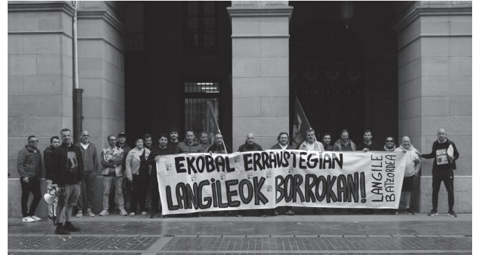
Maiatzaren 12an, 19an eta 26an deitu dituzte greba egunak.

izan, urtebeteko etengabeko bileren eta lau hilabeteko mobilizazioen ostean deitu dituzte hiru greba egunok, "Ekobal eta Ekondakin enpresek langileen lan-baldintzak arautu eta hobetu beharko dituen enpresa-hitzarmen baterantz aurrerapausoak emateko borrodatzerik ez dutela jakinda eta GHKren eta Gipuzkoako Aldundiaren etengabeko arduragabekeria ikusita".