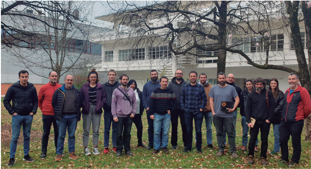
IZT kooperatibak IKT zerbitzuak eskaintzen ditu eta Beterri-Saretuz kooperatiben bilgunean hartzen du parte.