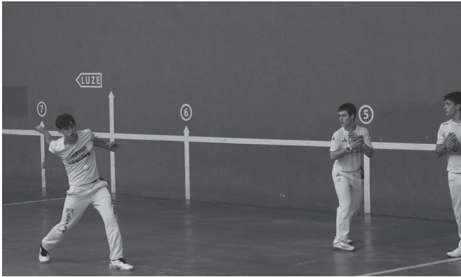
Larunbat honetan hasiko dira final zortzirenak.