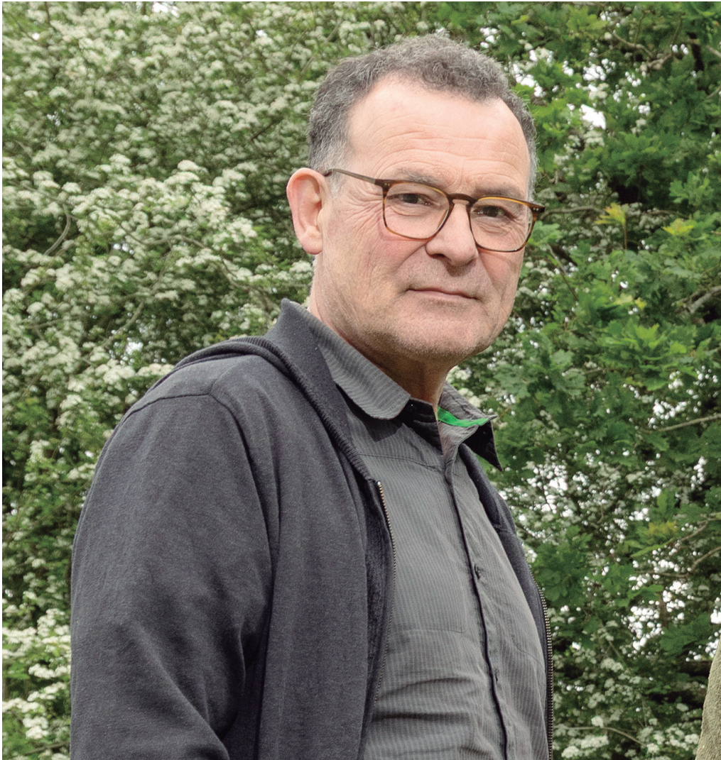
"Udarregik, alfabetatu gabeko pertsona batek, alfabeto bat asmatu zuen. Hau da gako inportanteena".