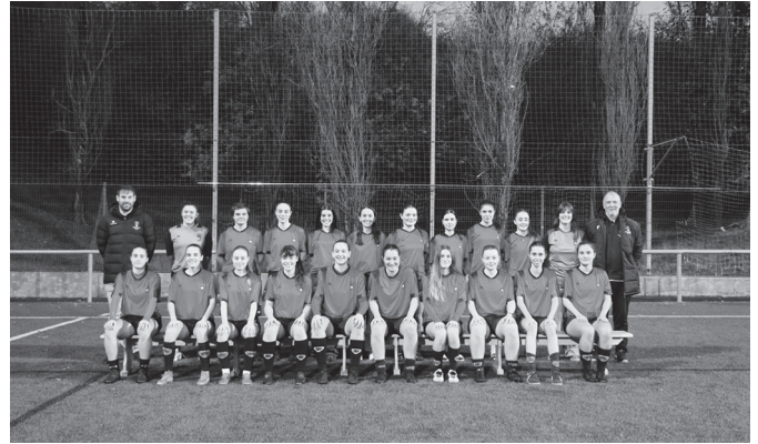
Senior mailako nesken taldea.

M.M.: Jubenil mailatik salto egiten dutenek aukera izan de-