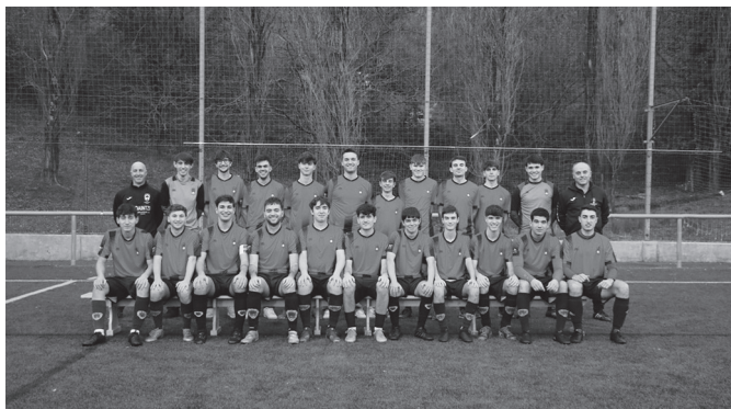
Preferente mailan jolasten duen mutilen taldea.