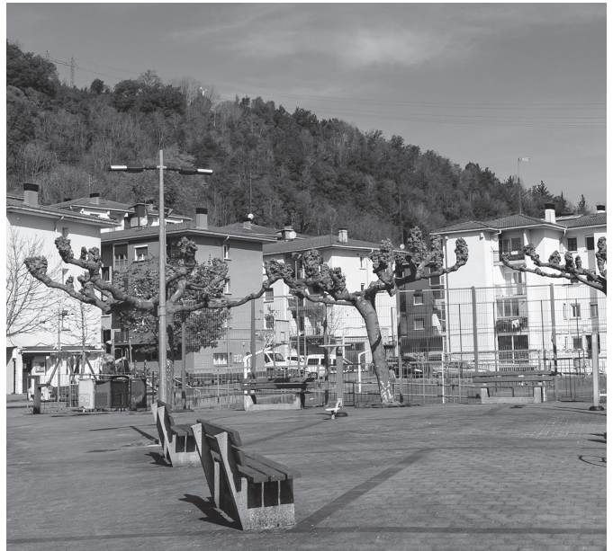
Gure Elkartea taberna eraberritzeko aurreproiektua idatzi berri du Udalak.

Proiektua abenduan abiartzeko arren, gerora behin-behinean gelditu egiten behar izan