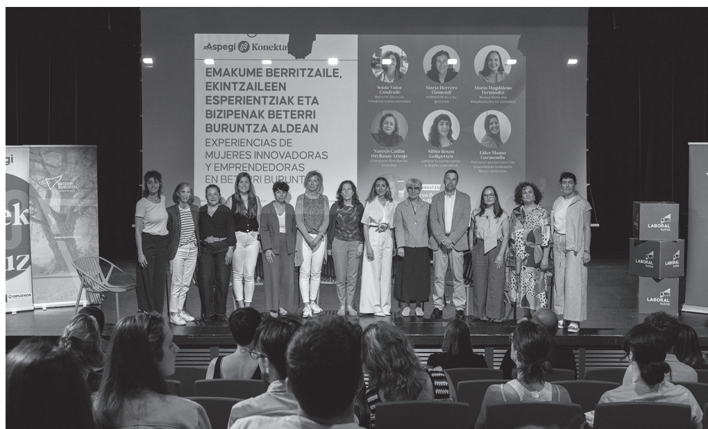
Eskualdean erreferentziazkoak diren emakume batzuk batu zituzten mahainguru batean. BETERRIBURUNTZA.EUS