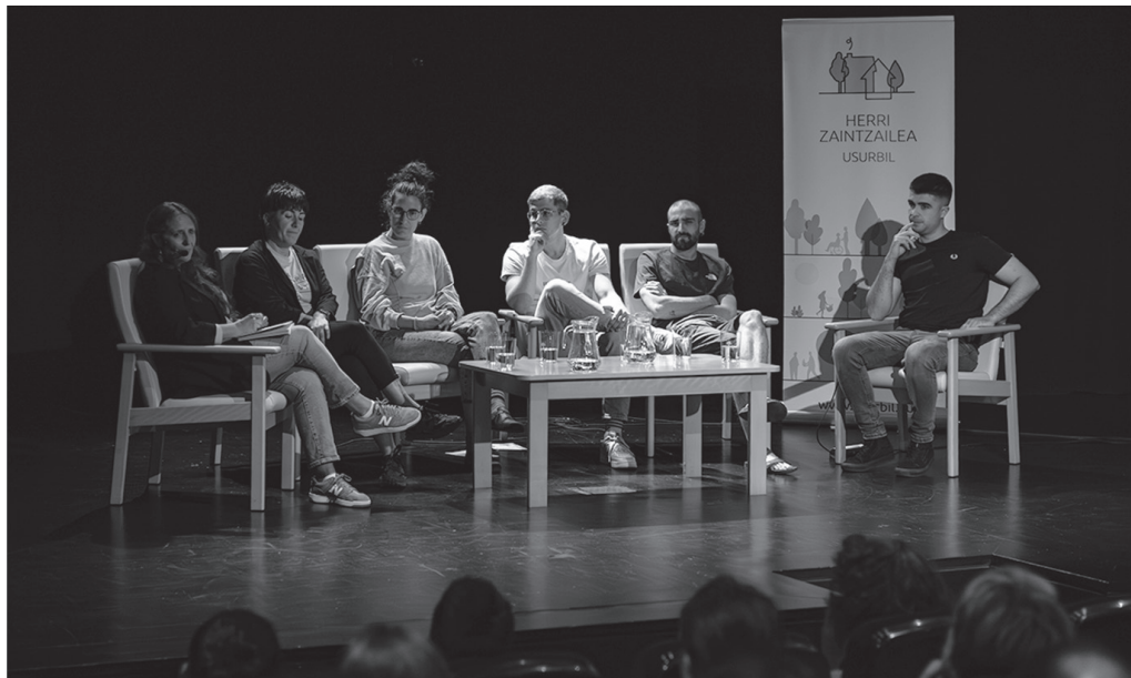
Maiatzaren 7ko solasaldia ikusgai duzue osorik, Usurbilgo Udalaren Youtubeko @usurbiludala4589 helbideko kanalean.

Hori hala dela ziurtatu zuten hizlariek. Anaiak uzitako era-