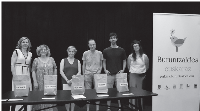
Aurreko astean egin zen zozketa Andoaingo Basteron.