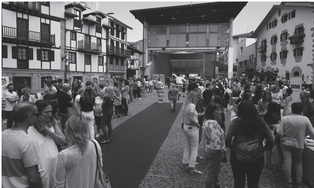
2022ko ekainean eginiko lehen Kultur Azoka. Ekainaren 7koak elkargunearen proiektua plazaratuko du.