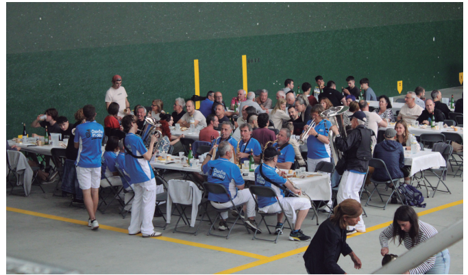
Bazkari baten bueltan ospatu zuten mende erdiko ibilbidea.

ikasle ohiek eta langileek. Gogoan izan, Aginaga izan zuen abiapuntu eskolak, parrokiaren lokaletan hasi ziren jardunean. Gerora, lekuz aldatu ziren egungo Zubietako instalakuntzetara, nahiz gaurkoarekin antzekotasun handirik izan ez. Zubietan hazten jarraitu baitu ikastetxeak gaur arte; hazten eta garatzen, bai instalakuntzen tamainaren ikuspegitik, baita, noski, marxan jarritako proiektu eta zerbitzuen ikuspuntutik ere. Sorreratik proiektu horren