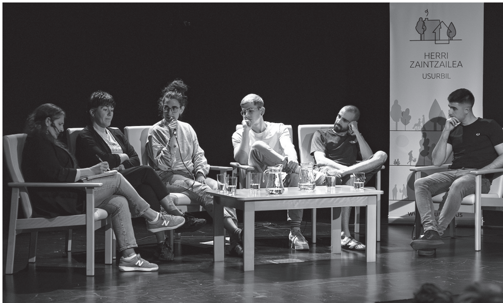
Herrikideek hartu zuten hitza, "Heriotzak gaztetasuna kolpatzen duenean" solasaldian.