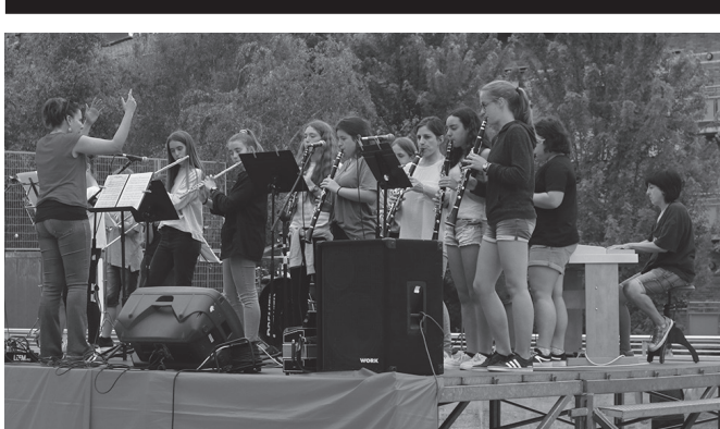
Azken kontzertuak Sutegin, Zumarten, frontoian eta Artzabalen egingo dira.