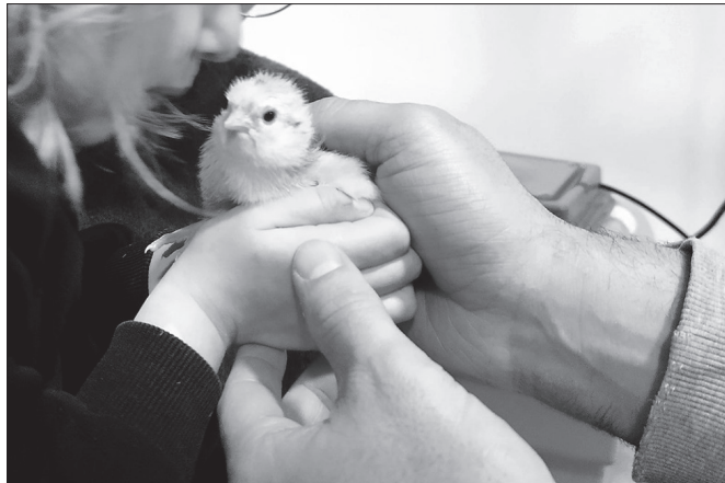
"Moko txiki bat eta pio bakanak sumatzen hasi ziren arrautzetatik".

Batek daki. Kontua da, irten da ere, plastikozko kaxa heze eta bero batean topatuko zutela euren burua. Eta eurekin batera egon ziren gainerako arrautzak ikusiko zituzten, oraindik gainditzeko beste proba bat zutelarik.