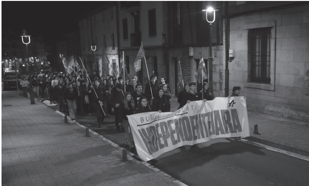
Instagram bidez jaso dezakezue Ernai Usurbilen berri; @ernaiusurbil helbidean, hain zuzen.