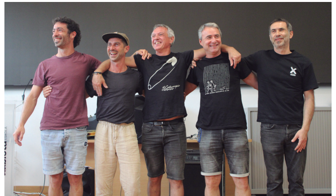
50. urtemugako ikus-entzunezkoa musikaturiko irakasle taldea.