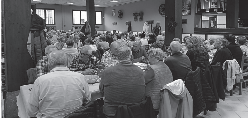
Azpeitia, Azkoitia eta Zestoako jubilatuen elkarteetako kideak, Aginaga sagardotegian.

Urola aldeko jubilatuen kuadrilla handi bat Aginaga sagardotegian batu zen duela egun batzuk. Azkoitia, Azpeitia eta Zestoako jubilatuen elkarteetako kideek egunpasa ederra egin zuten. Lehenbizi, Orion izan ziren. Meza eta gero, Aginagara hurbildu ziren eta bertan bazkaldu zuten, sagardotegian. Giro ederrean joan zen eguna.