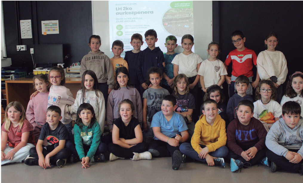
Hondakinen kudeaketari buruz eginiko ikerlanaren egileak; Udarregi ikastolako LH2. mailako ikasleak.