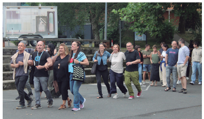
Lanbide Eskolatik Zubieta erdigunera kalejiran joan ziren.