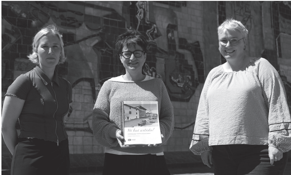
650 Usurbil Bizi herri egitasmotik eratorritako "Hi bai artista!" proiektu pedagogikoaren sustatzaileak.