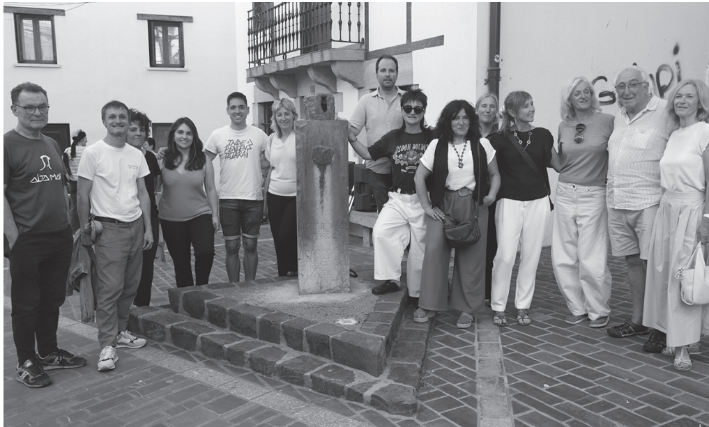
Udarregiren omeneko eskulturaren bueltan, maiatzaren 22ko ospakizunen sustatzaileak eta omenduen senideak.