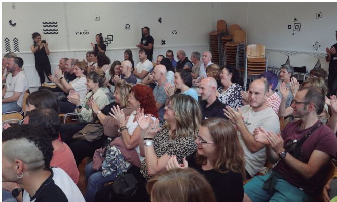
Urtemugako proiektio musikatuaren amaierako txaloak.

"IKASTETXEAK 50 URTEOTAN IZANDAKO GARAPENA MARRAZTU ZUTEN"