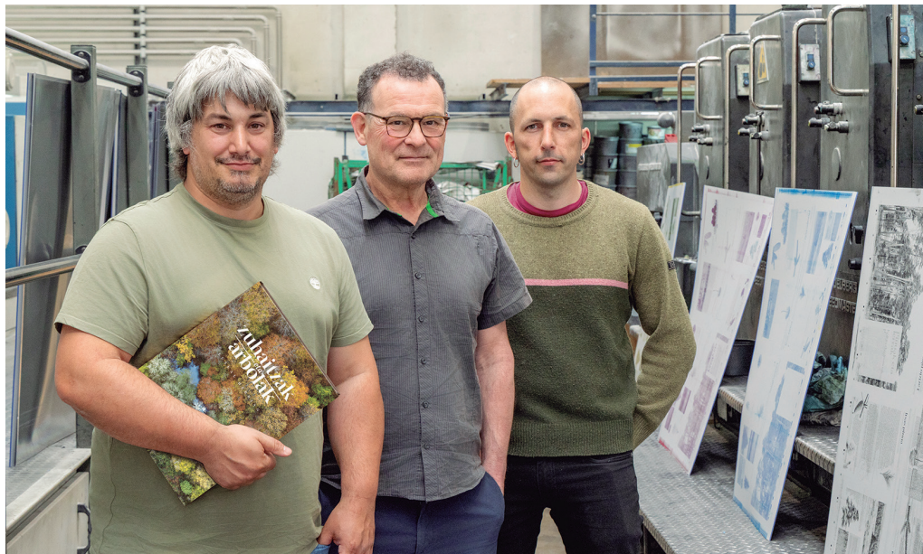
Liburuaren aurre-salmenta duela aste batzuk ireki zen. Ekainaren 8an hasiko dira banatzen.

Eta zaintzak, eta inausketak, eta landaketak... Lehen esaten nuena, liburu bideak irekitzeko era bat da. Liburuak egin daitezke 'nik dakitena' azaltzeko. Eta horietakoak asko ditugu. Ez ditugu horrelako gehiago behar.