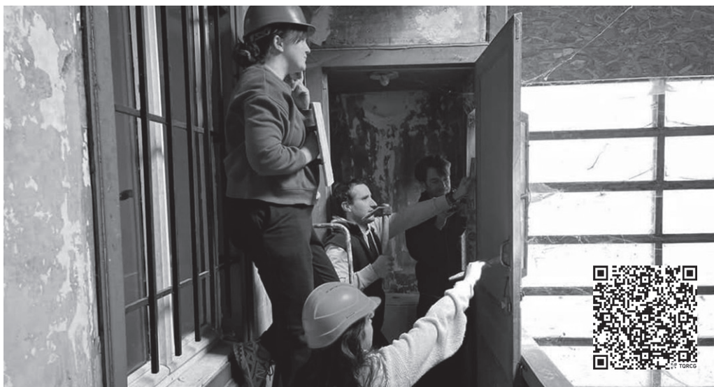
Xiberoko Botzak irratiko langileak, diru bilketaren berri ematen. QR kodearekin crowdfunding-eko esteka eskura daiteke.