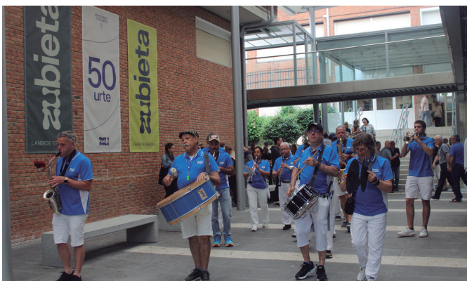
"Oaintxe in deu" txarangarekin hedatu zuten festa giroa Zubieta erdigunera.