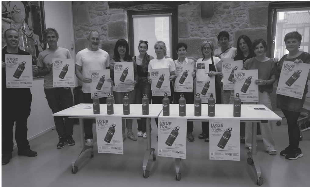
Hurbilago elkarteko kideak, kantinploren kanpainaren aurkezpenean.