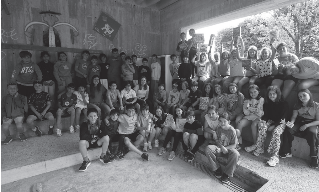
Udarregi ikastolako LH 4. mailako ikasleak, haiek garatutako Askatasuna plazako bolatokiko proiektuaren ondoan.