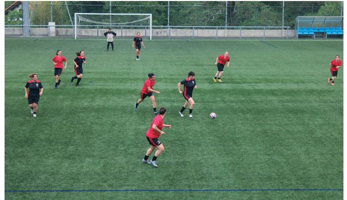
Lagunarteko lehia bizia izan zen emakumezko usurbildarren artean.