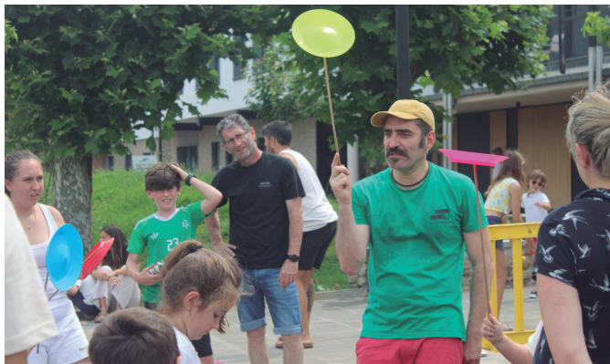
Zirkuolak girotu zuen Egurtzegi ataria, ekainaren 20an.