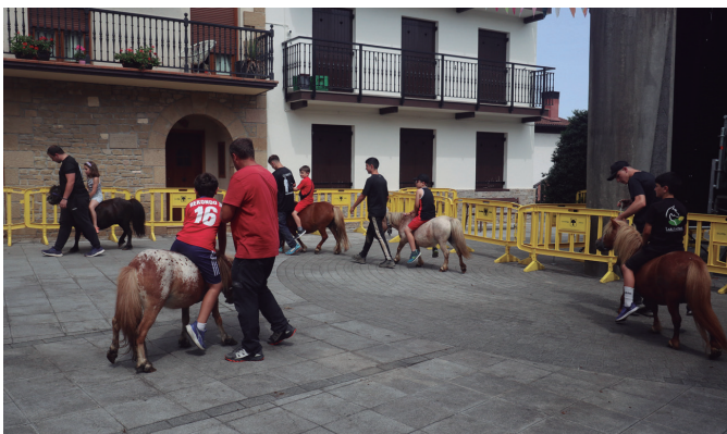
Osteratxoa egiteko aukera izan zuten, Gorritiren animalien gainean.