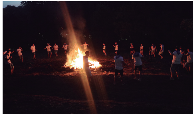
Beroaldiगतिक, segurtasun neurri zorrotzen artean piztu zuten jaietako sua.