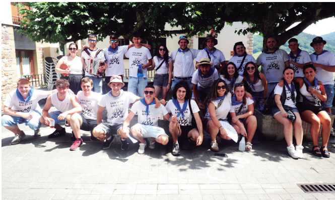
Ekainaren 23ko eskean ateratako gazte kuadrilla.