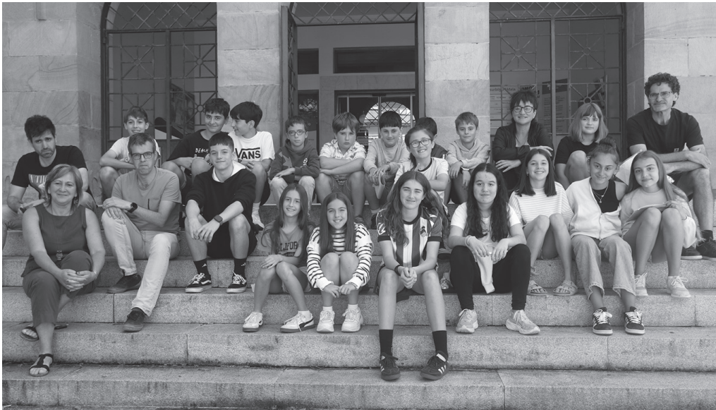
Eskola Agenda 2030 programako parte hartzaileak Usurbilgo alkateari eginiko aurkezpen egunean ateratako argazkian.