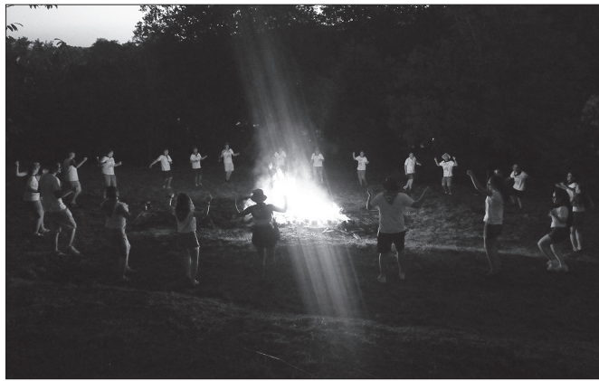
Ohi baino segurtasun neurri handiagoen artean piztu zuten sua Kalezarren.

Hala ere, familiako whatsapp taldean, galdezka hasita zeuden ea aurten ere baserrira igo eta afari-mokadua egingo ote genuen elkarrekin. Sua piztea ezinezkoa izango bazen ere, igotzeko gogoa gailentzen zen. Eta planak aurrera egin zuen, bakoitzak otu zitzaion