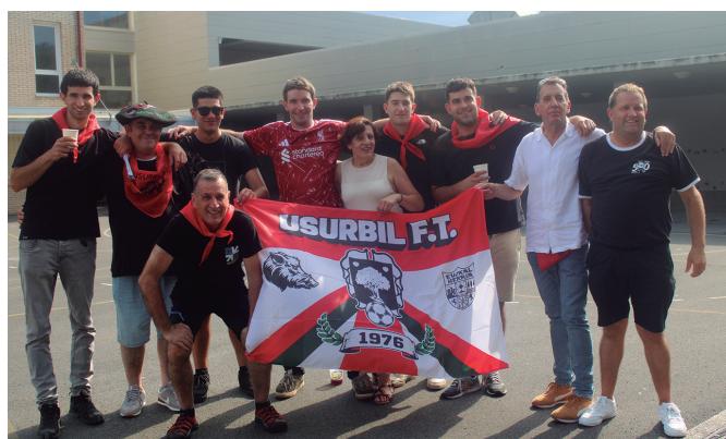
Urteotan Usurbil F.T.-rekin lotura izandako Uribetarrak.