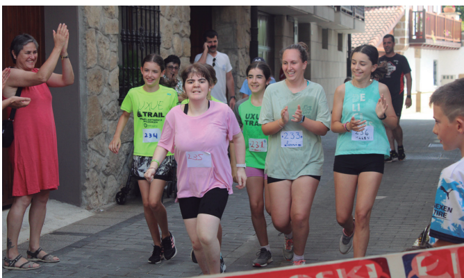
Laguntasuna txapeldun, Umeen Eguneko krosean.