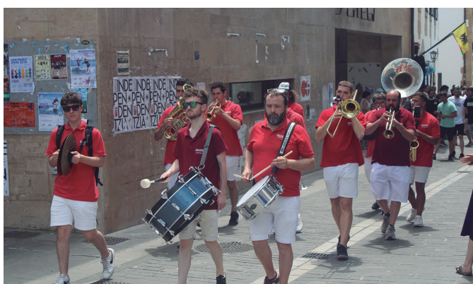
Gauerdiko txarangak girotu zuen 50. urtemuga festa.