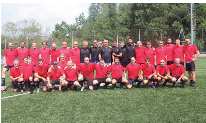
Usurbil F.T.-ren beteterano gizonezkoak.