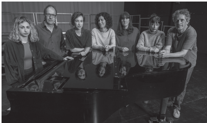
650 Usurbil Bizi herri egitasmoarekin elkarlanean antolatuta da ikuskizuna.