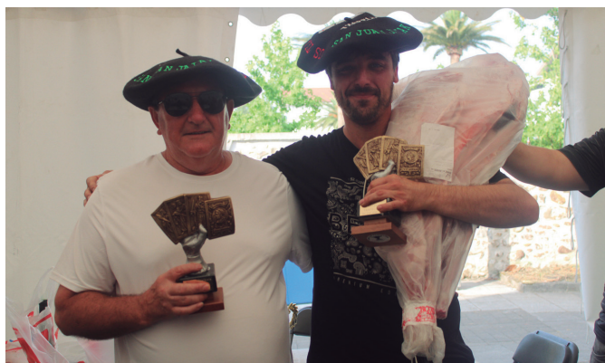
22 bikoteen artean, mus txapelketako irabazleak.