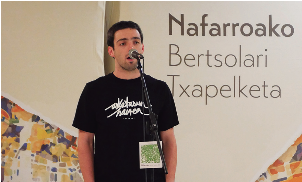
Bertsolari leitzarrak Nafarroako Bertsolari Txapelketa irabazi zuen iaz. ERRAN.EUS