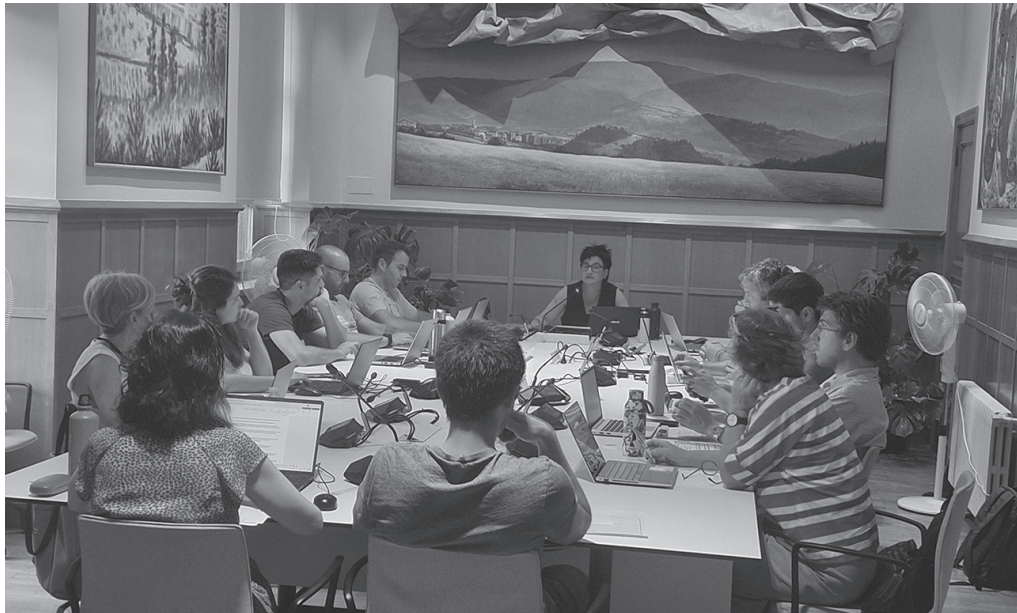
Anbulatorioko pediatria zerbitzuen gabezien harira, EAJk mozioa aurkeztu zuen eta EHBilduk osoko zuzenketa.