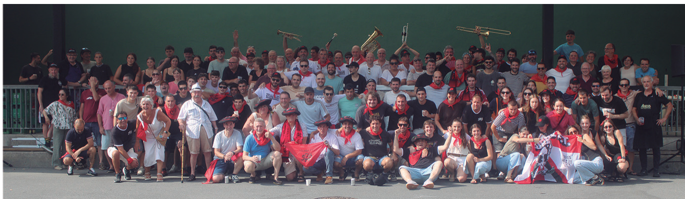
Usurbil F.T.-ko 50. urtemugako bazkariaren amaieran ateratako argazki jendetsua. Giro ederrean ospatu zuten mende erdiko jaialdia.