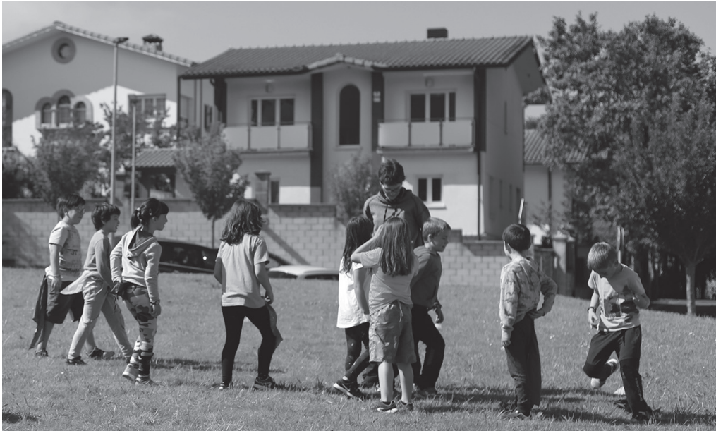
Ostegunetan txangoak egingo dituzte (uztailaren 30ean izan ezik). Hilaren 16an Hernaniko igerilekura joango dira.