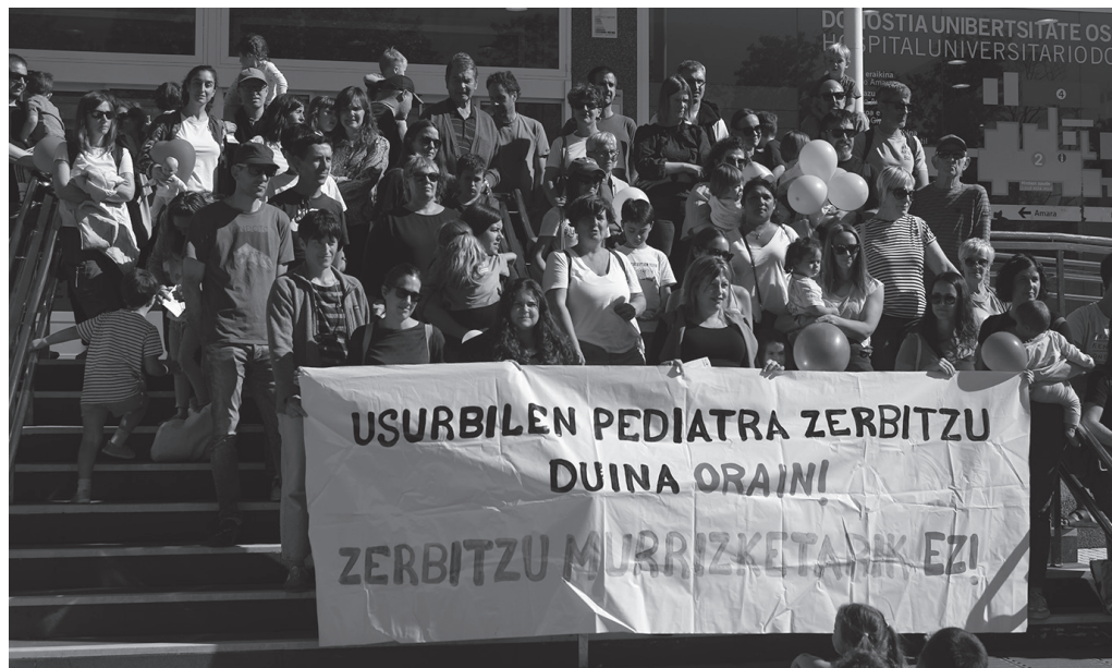
Pediatria zerbitzu duina aldarrikatzeko, ekaina hasieran Donostia ospitalearen atarian eginiko herritarren mobilizazioa.

Udal gobernu taldeari galdetu zion, "ahal duzuen guztia egingo duzuen arazoari konponbide bat emateko". EHBilduren osoko zuzenketan aipaturiko Donostialdeko