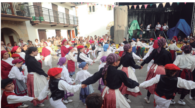
Orbeldi dantza taldeak udako bira abiatu zuen Kalezarko jaietan.