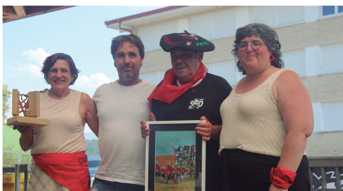
Belaunaldi ezberdinetako Usurbil F.T.-ren jokalaria gizezkoak.