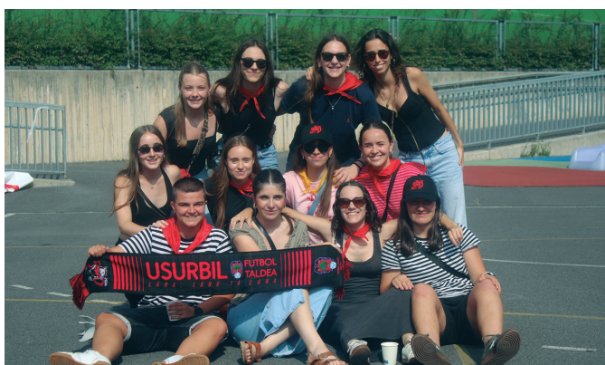
Usurbilgo emakumezkoen futbol jokalarien taldeetako bat.