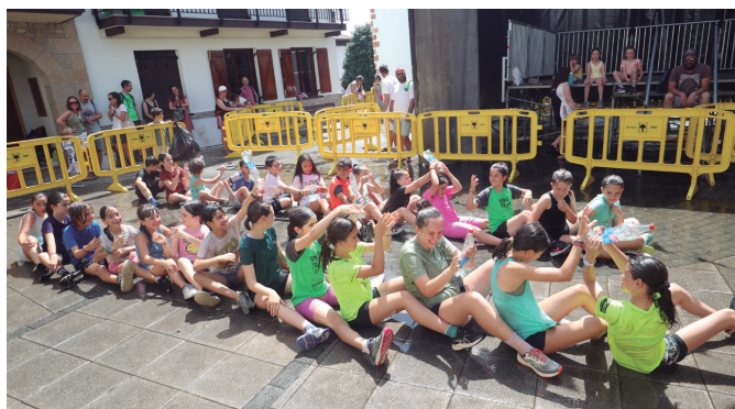
Beroaldi betean sartzeaz ginela, blai amaitu zuten Haurren Eguneko jolasetan.