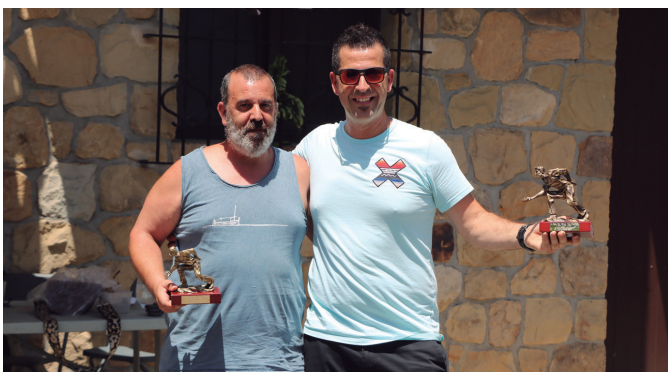
Kalezartarren jai egun nagusiko toka txapelketa irabazi zutenak.