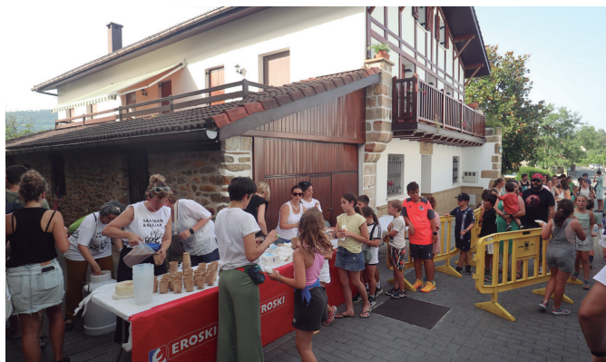
Bero itzela egin arren, ez zioten txokolate gozoa dastatzeari muzin egin.