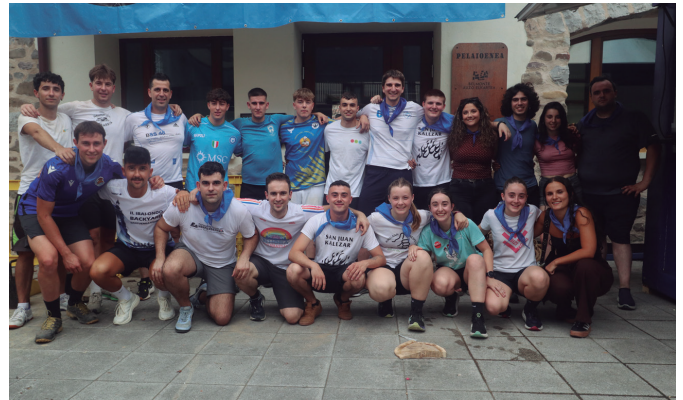
Auzotarren arteko jolasekin abiarazi zituzten jaiak.

Horrez gain, auzokideak herri kirolean neurtu ziren, haiekin murgilarazi zuten Kalezar festa giro betean. Lehia bizi eta estua izan zen, lagunartea txapeldun izandakoa.