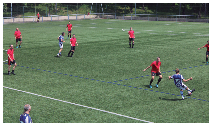
Realeko beteteranoekin lehiatu ziren gizonezko usurbildarrak.