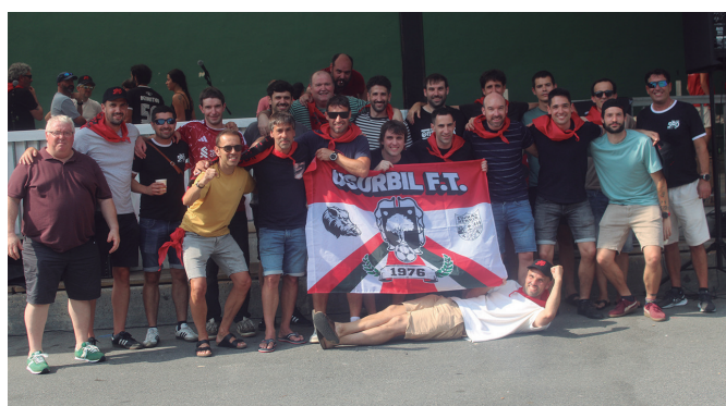
Usurbil F.T.-ren belaunaldi ezberdinetako gizezko jokaria.