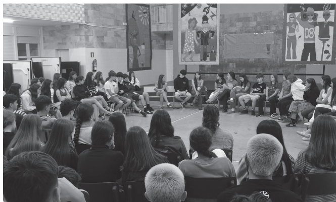
Oporren aurretik, Bernat Etxepare Lizeoko ikasleekin izandako solasaldia.

Baxoa aurten ere euskaraz egiteko hartutako erabakiaz mintzatu ziren, agian ez zitzaizkiela probak zuzenduko eta horrek haien aurrera begirako ikasketen prozesua zaildu zezakeela jakin arren. Baxoa egin bezperatan izan ziren Udarregin, hartutako erabakiari tinko eusten ziotela argi uzten. Jasotzen ari diren babes eta sostengu zabala nabarmendu eta eskertu zuten.