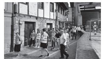
Ekainaren 30erako iragarrita dago.

Beroaldia tarteko, Udalak aurreko asteko ibilaldi osasuntsua bertan behera utzi ostean, astearte honetarako, ekainaren 30erako dago iragarria hurrengo "Goazen Kalera" dinamika-ri lotutako paseoa, 10:30ean frontoi ondotik. Uda honetan paseo labur bat eta kafetxo bat hartzeko aukera izango da herri erdigunean barrena.