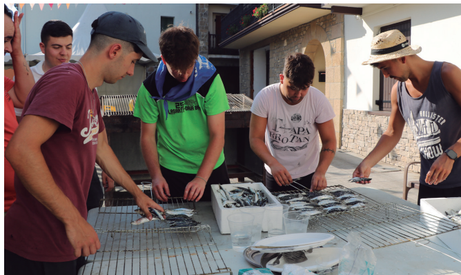
Sagardo eta sardina dastaketa goxoak borobildu zituen Kalezarko jaiak.