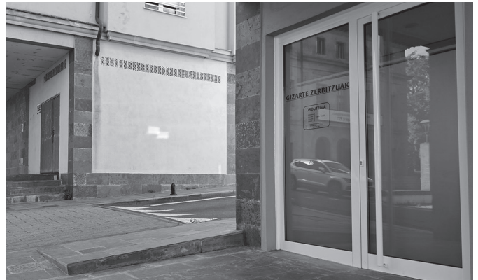
Astelehenetik ostiralera, 9:00etatik 14:00ak arte zabalik, asteazkenetan izan ezik.

Orain arte bezala, aurrerantzean ere, ohiko ordutegian artatzen segiko dute Gizarte Zerbitzuen egoitza berrian; astelehenetik ostiralera, 09:00-