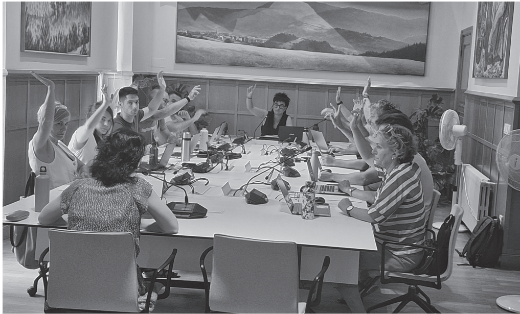
Aho batez onartu zuen udalbatzak Udarregi ikastolarekin sinatutako kontratua eteteko negoziatioari ekitea.