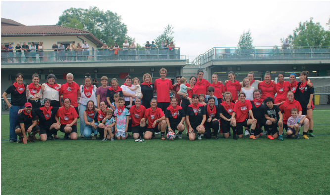
Usurbil F.T.-ren beteterano emakumezkoak.

"HAIETAKO BAKOITZA GABE, IBILBIDE HAU EZ ZEN POSIBLE IZANGO"