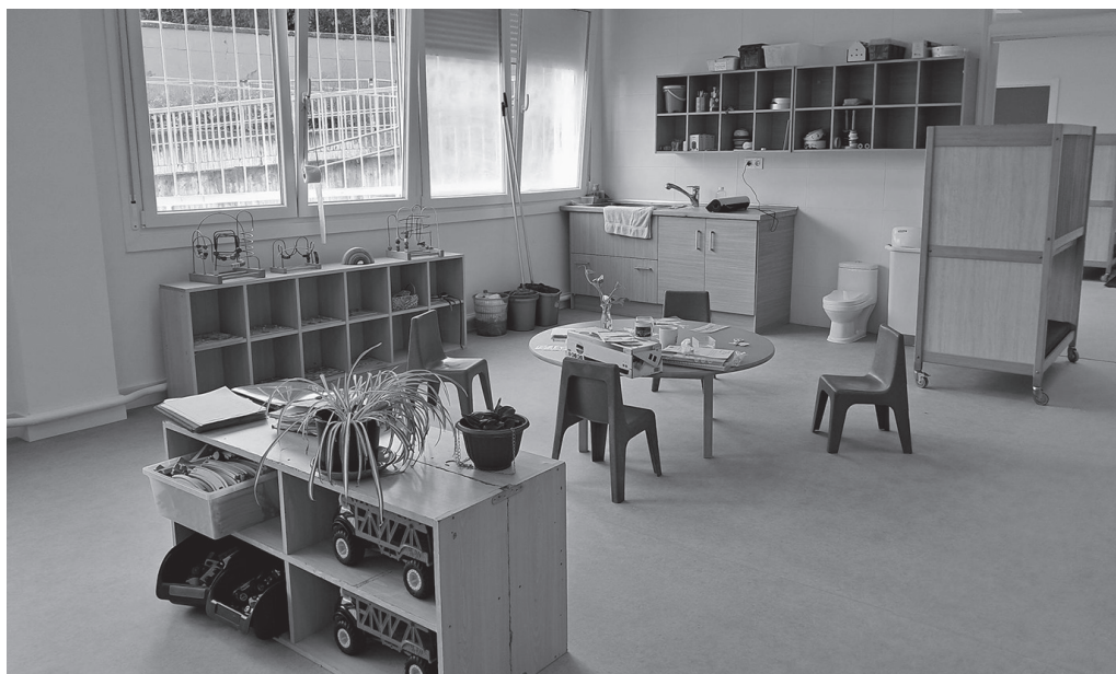
Haur Eskolaren 0-2 tartearen Partzuergoaren baitan eskaini eta 0-3 tartearen Udarregi ikastolak kudeatzen segiko du.

Udal gobernu taldetik osteguneko saioan iragarri zuten, hurrengo osoko bilkuran, uztailekoan, "udalaren eta Partzuergoaren arteko integrazio