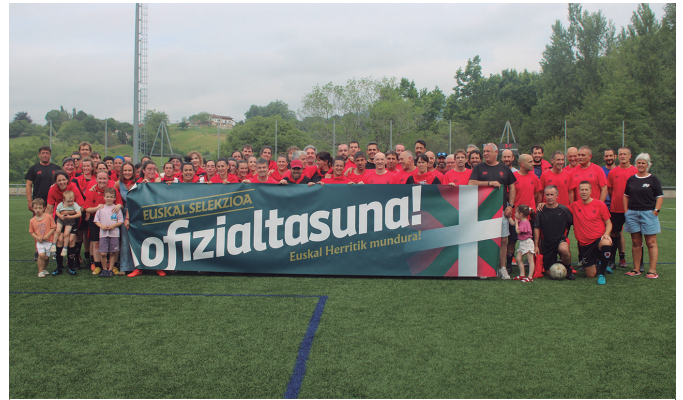
Euskal selekzioaren ofizialtasunarekin bat egin zuten beteteranoen neurketetan.

Gauerdia txarangak, The Hastelen s herriko taldeak nahiz dj-ak musikaturiko jaialdiak hitzordu nagusi bat izan zuen; Agerialdeko frontoian eginiko bazkaria. 50 urteotako futbol taldeen bilgunearen lagun mordoak elkartu zituen. Eskertzarako eta oroimenerako tartea hartu zuten. Kluba zuzenduriko hainbat lagun omendu zituzten, oroigarri eta txa-