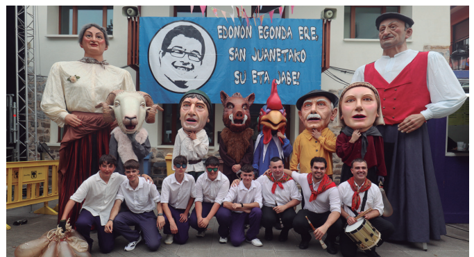
Lauburu Erraldoi eta Buruhandien konpartsa irten zen estreinakoz aurtengoan.