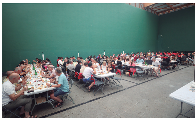
Mende erdi honetako bidelagun mordoia elkartu zuen urtemugako bazkariak.