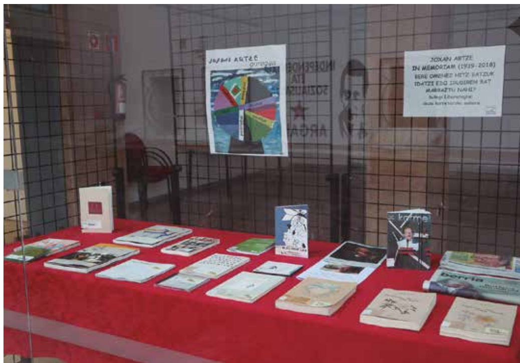
Artzeren sormen lanen bilduma zabala ikusgai ipini dute Sutegiko erakusketa aretoan.

Bere heriotzaren lehen urtemuga egun honen harira, Joxan Artze omentzeko tartea hartuko da egunotan. Batetik, Gipuzkoako Foru Aldundia,