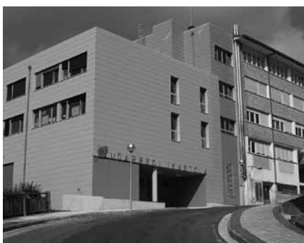
Urtarrilaren 26an egingo da Ate Irekien Eguna Udarregi Ikastolan.

2019-2020 urterako matrikulazio epea, urtarrilaren 28an zabalduko dute eta o-