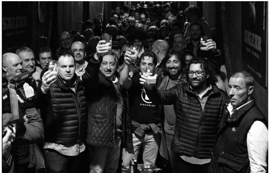
"Hau da Usurbilgo Saizar sagardo berria" oihukatzearekin batera zabaldu zuten lehen kupela.

"Hau da Usurbilgo Saizar sagardo berria!" hitzak ahoskatuz, eta sagardotegiko kupeletik bete berri zituzten edalontziak eskutan, Ketamak izan zuen txotx bolada berriko Saizarreko lehen tragoa hartzeko aukera. Ekitaldiak jakinmin handia piztu zuen. Euskal Herriko nahiz Espainiako telebista kate ezberdinetako kamerariak eta kazetariak hurbildu ziren.