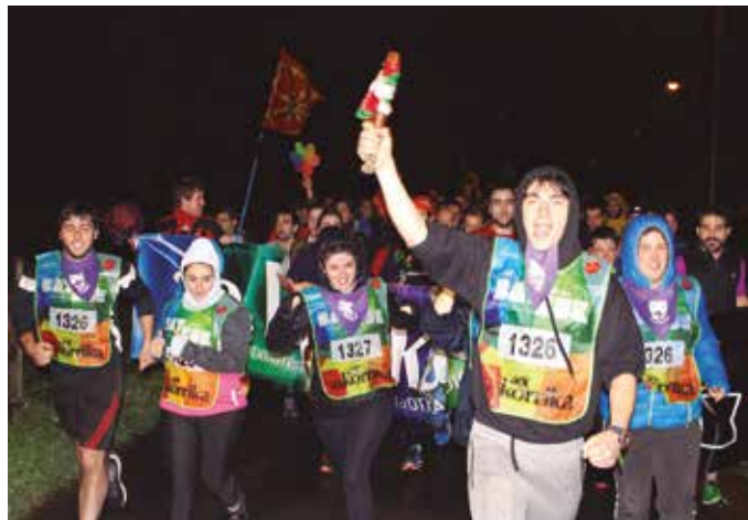
Ohi bezala, Aginaga, Usurbil eta Zubietako kilometroen kudeaketa Etumeta AEK euskaltegiak egingo du.

Euskal Herria alderik alde zeharkatuko duen 11 eguneko lasterketa, apirilaren 12an igaroko da gure ingurutik. Oraingoan, ostiralez eta arratsaldeko lehen orduan, 14:24 aldera. Noranzkoa aldatuko da edizio berri honetan. Duela bi urte, Lasarte-Oria aldetik sartu zen 20. Korrika Zubietara, gauez. Hiru hilabete barru, ostiral eguerdiz helduko da euskararen aldeko martxa, 14:24 aldera Oriotik! N-634 errepide-tik barrena helduko da Aginagara. Errepide beretik, Aginagatik Usurbila. Usurbilen ohi