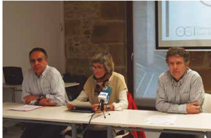
Ondorio kezka-garriak plazaratu ditu OEIT elkarteak.

Adibide gisa jartzen dute, iaz Herbeheretako azken belau-naldiko edo batzuk errauskailu “moderno” deitzen dioten horietako baten inguruan eginiko ikerketa batek zioena. “Honek dio isurketak modu jarraian monitorizatuz gero neurturiko dioxinen isurketa zifrak ofizial-