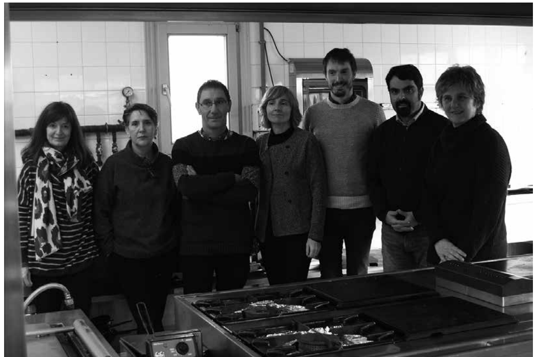
Andoain, Astigarraga, Hernani, Urnieta eta Usurbilgo Udalen gizarte zerbitzuen eta enplegu sailen arteko elkarlanetik jaio da egitasmoa.

Martxoan abiatu nahi duten programa honen lehen edizioak bi atal izango ditu. “Batetik, lau hilabetez luzatuko den formazio ibilbidea: parte hartzaileek, oinarriko gozogintzan gaitzeko 330 orduko formazio profesionala, 80 orduko lan-praktikak, gaitasun sozio-pertsonalak lantzeko saioak eta jarraipen pertsonalizatua jasoko dituzte. Formazio fasea bukatzerakoan, bigarren atalaren helburua parte hartzaileak enpresa pribatu