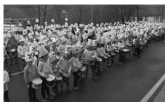
Urtarrilaren 18ra aurreratu dituzte danborradak Usurbilgo ikastetxeetan.

burura joan etorria egiteko garrario zerbitzu publikoak indartu ohi dituzte. Informazio gehiago: lurren.debus.eus / euskotren.eus