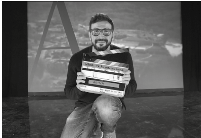
Igande honetan eskainiko dute Aginagan grabaturiko “Herri Txiki, Infernu Handi” programa.

Abian da 11. Euskal Herriko Mus Txapelketa. Herrietako saioak jokatzen ari dira asteo-