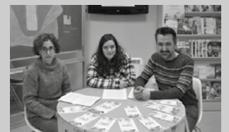
Buruntzaldeko gazteei zuzenduta dago lehiaketa.