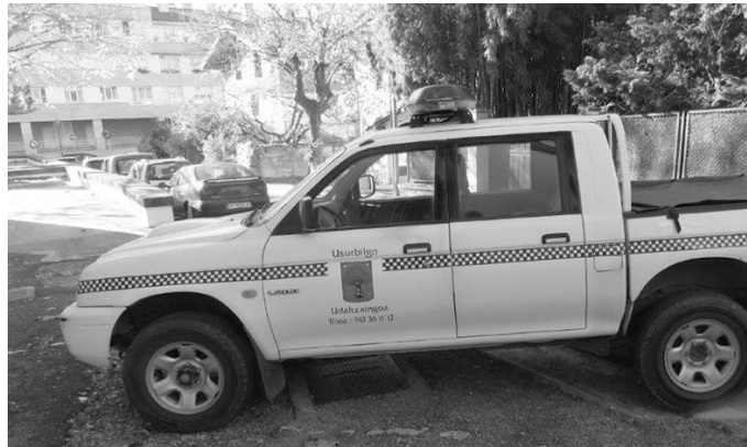
Udaltzainen zerbitzuan urteko 32 larunbat arratsaldeetan udaltzain bat gehiago izango da, bi guztira.