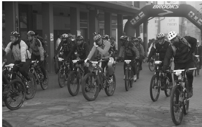
Urtarrilaren 25era arte egin ahalko dira inskripzioak kirolprobak.com atarian.

Bestela, baita proba egunean bertan, urtarrilaren 27an 8:45 arte Mikel Laboa plazan. 1940ko urtarrilak 31-2003ko urtarrilak 26 artean jaio zirenei dago zuzendua hitzordua, nahiz 13-16 urte arteko txirrindulariek ere parte hartu ahalko duten. Beti ere, "baldin