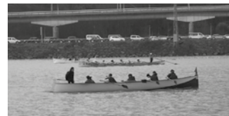
Errioko arraun denboraldia larunbat honetan hasiko da.

Eguna finkatua dute jada. Mende laurdena bete eta Aginagatik abiatu ohi den Oriako 25. Traineru Jaitsiera martxoaren 9an ospatuko da. Orio Arraunketa Elkarteak antolaturiko hitzorduaren baitan urtero moduan, bi distantzia ezber-