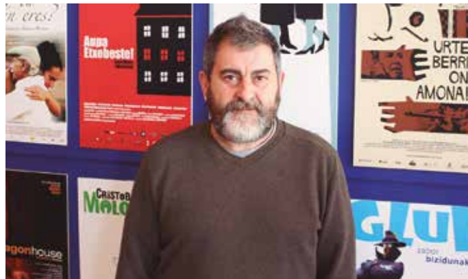
Telmo Esnalek zuzendu du Dantza filma. Urtarrilaren 27an Sutegin ikus ahal izango dugu. Sarrerak Lizardin eta NOAUAIn dituzue eskuragarri.

Filman jaso duzun istorioa unitertsala dela esan izan duzu. Dударik ez dut horretan. Ez-