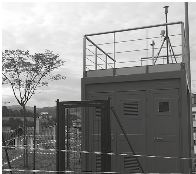
Udalak aditzera eman duenez, “hurrengo asteetan jarriko dute eskatutako baldintzen araberrako kabina”. Udarregi Ikastolaren ondoan ipiniko dute.

2017ko irailean jaso zuen Udalak erraustegia eraikitzeko lehen faseko obren esleipendun Ekohondakinek kabina instalatzeko baimen eskaera. Baina Udalaren esanetan, “kabina horiek ez dute erraustegitik isurtzen dena zuzenean neur-