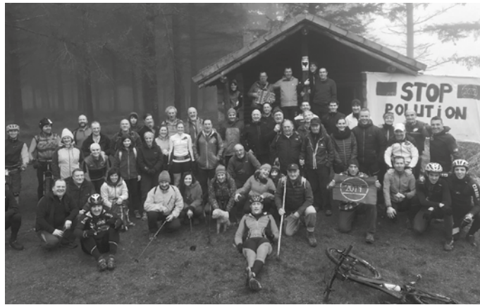
Urteberri egunez, Andatza gainean bildu zen ondoko koadrila.

G.A.: Belaunaldi ezberdinetako jendea gaude. Denetik pixka bat dakigu. Kirol jarduera ezberdinak egiten ditugun kideak gaude; bizikletan ibiltzen direnak, mendian korrika, mendian oinez lasai ibiltzea gustuko dutenak, beste batzuk mendia azkar igo, eta jaisten dutenak, buelta luzekoak... Denetarik dugu. Profil horretako jendea izanda, ekintza