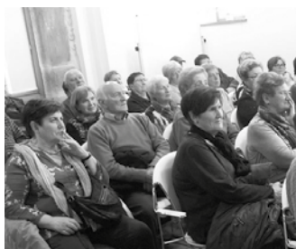
Artzabalen batuko dira ostiral honetan.

Otsailean ospatuko den Jubilatutako Astearen aurretik izango da bilera hau. Hitzaldi, bazkari, ibilaldi, kantu eta antzezlan saioekin hornituriko Jubilatutako Astea eta bazkideen arteko txapelketak iragarri ditu Gure Pakeak, otsailaren 4tik 13ra. Egitarau zehatza datorren astekean plazaratuko dugun arren, Kantu Taldearen Agate Deunaren bezperako saioarekin abiatuko dute Jubilatutako Astea otsailaren 4an 18:00etan. Hitzaldi bana programatu dute