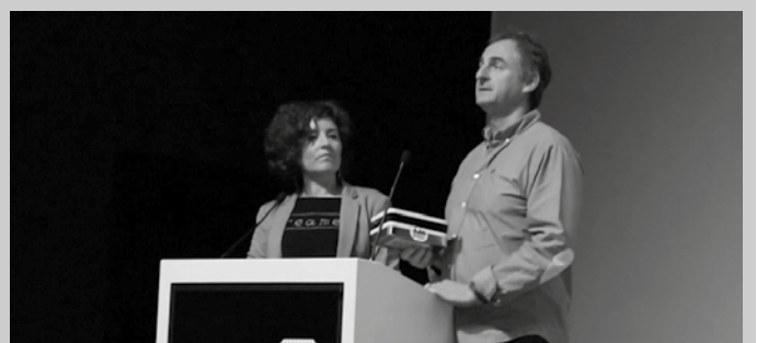
Xehetasunak larunbat honetan eskainiko dituzte.

laren 26an emango dituzte iragarpen honi buruzko xehetasun gehiago. Gogoan izan, otsaila amaierarako manifestazioa iragarria dutela Donostian.