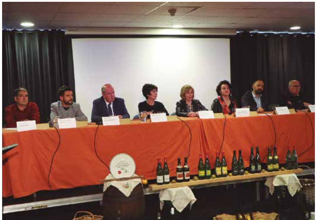
Datuak erakusten dutenez, “bertako sagarraren alde eginiko apustua finkatzen ari da”.

Sagardo gutxiago ekoitzi arren, “bertako sagarrarekin eginiko apustua ondo funtzionatzen ari da”, azpimarratu zuen Eusko Jaurlaritzako nekazaritza,