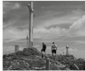
Otsailaren 10ean Usurbil-Ernio-Alkiza ibilaldia osatuko dute.

Oiardo Kiroldegitik aterata, Usurbil-Ernio-Alkiza ibilaldia.