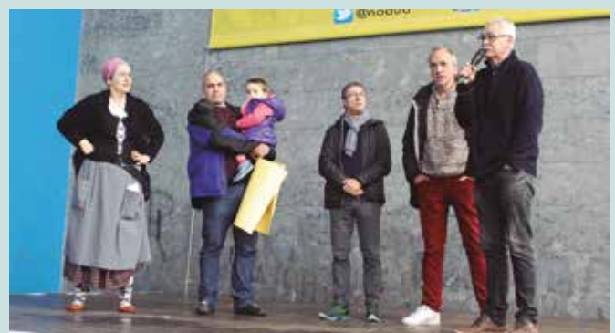
Nafartarrak taldeak eskerrak luzatu dizkiete kanpainen parte hartu zutenei.

Gogoan izan, bi saski mota zeuden aukeran; guztira 114 Ahuski eta 245 Irati otarre eskatu ziren Usurbilen. Guztira 16.000 euro inguru bildu ziren! Nafartarrak taldetik eskerrak luzatu dizkiete kanpaina honetan parte hartu duten guztiei.