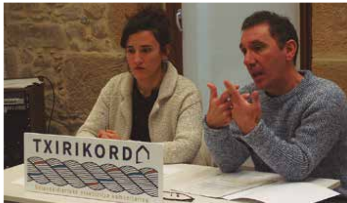
Hiritik At kooperatibak gidatuko du parte hartze prozesua.

Proiektu hau martxan jarrita, eremu honetan ere Usurbil