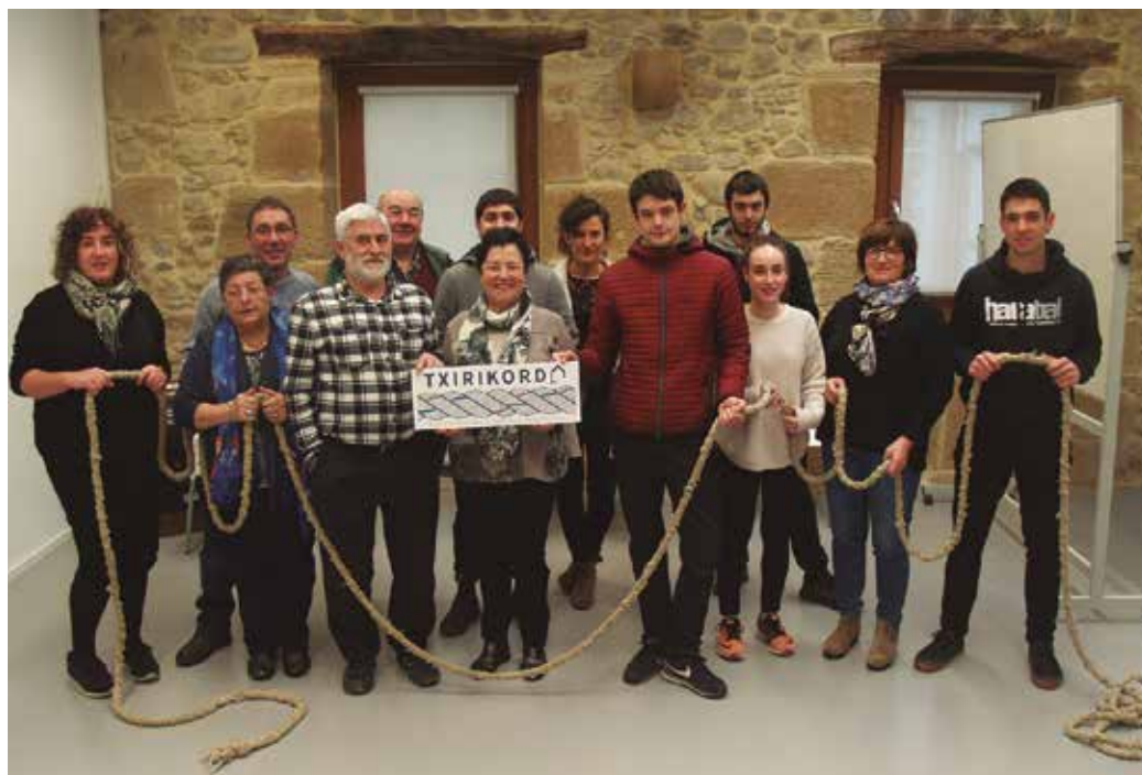
‘Txirikorda’ proiektu aitzindaria izango da Euskal Herrian; gazteak eta adinekoak bildu, haien beharrei erantzun eta bi belaunaldiak modu kolektiboan ahaldu nahi dituen.

Batetik, gazteen emantzipazioa. “Arrazoi desberdinak tar-