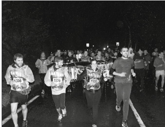
Kilometroak erosteko epea zabalik duzue Etumeta AEK euskaltegian.

Lekukoa eramateko kilometroak erosteko epea zabalik