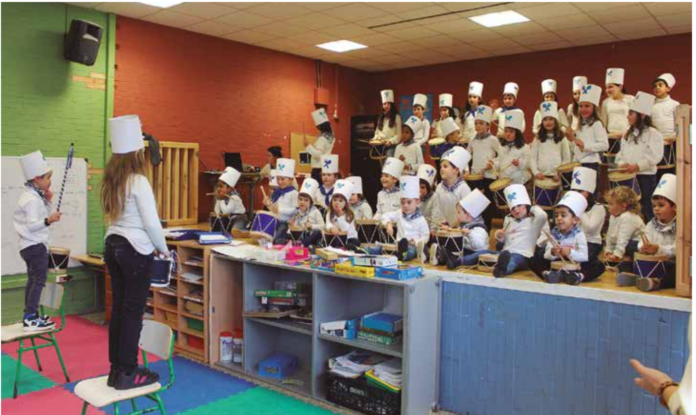
Aginagako ikasleak eskola barruan jo zituzten Donostia Eguneako doinuak. Parez pare zituzten gurasoak eta senideak.