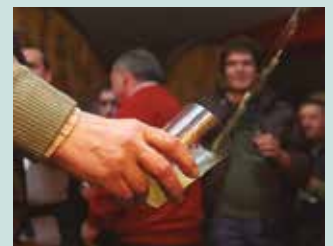
100 urte lankidetzan ari den sektorea eskertu nahi izan zuen Gipuzkoako Foru Aldundiak.

Bertako sagarrondoak sustatzeko legegaldi hasieran abiatutako proiektuaren emaitzak aurkeztu zituen. “85 hektarea berri landatzea ekarri du. Ia milioi bat euro bideratu dugu sagarrondo horiek landatu eta bertan makinaria aproposa erabiltzera”. Sagardoaren %100a bertako sagarrarekin ekoizteko orain-