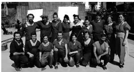
Filmazioan Orbeldi Dantza Taldeko kideek hartu zuten parte.