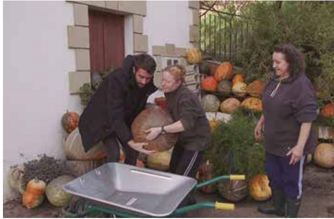
Arrakastatsua izan zen saioa. Audientziari dagokionez, denboraldiko markarik onena urratu zuten Aginagari eskainitako programarekin.