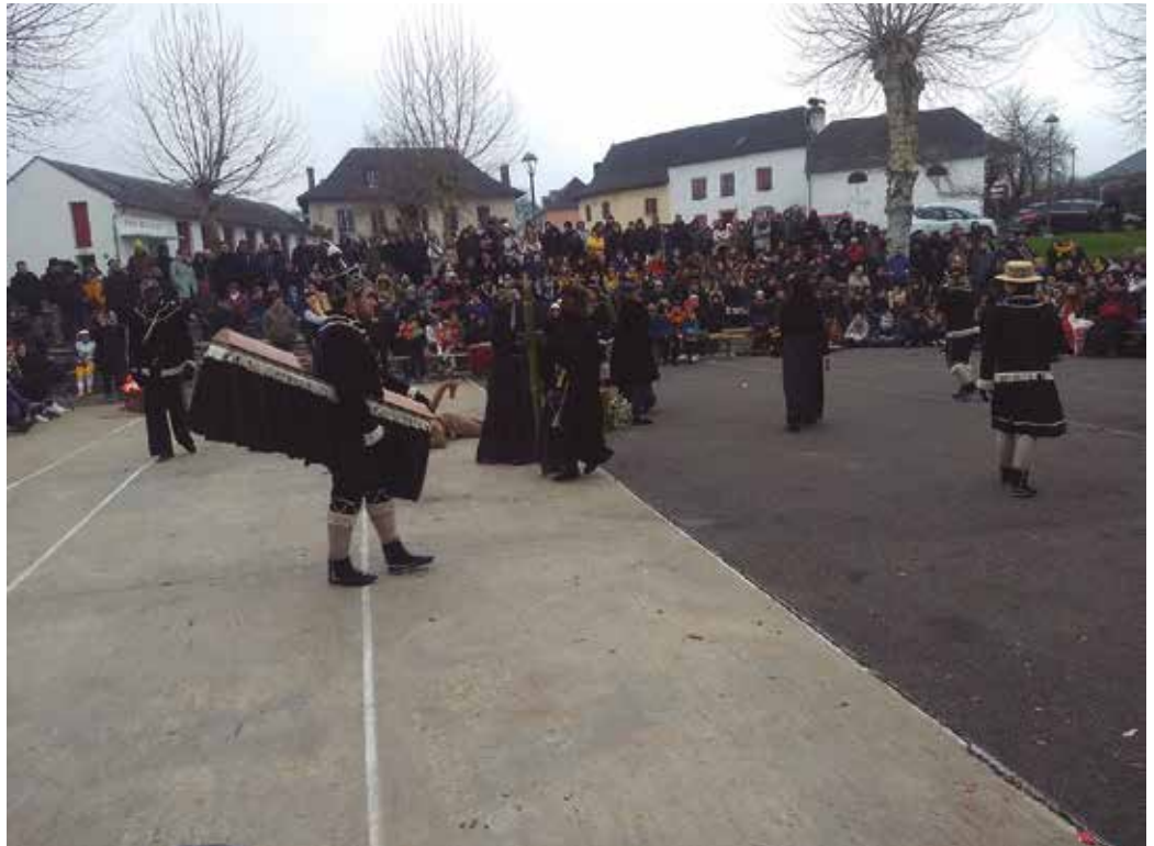
Otsailaren 17an Zuberoara irteera antolatu du Orbeldi Dantza Taldeak.