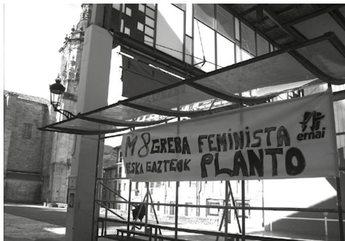
Asanbladetan antolatzen hasiak direla adierazi dute, bai herri, eskualde eta maila nazionalen.

Grebaren bidez eskaerok plazaratuko dituzte. “Bizitza sostengatzeko ardura kolektiboa eskatzen dugu. Horretarako,