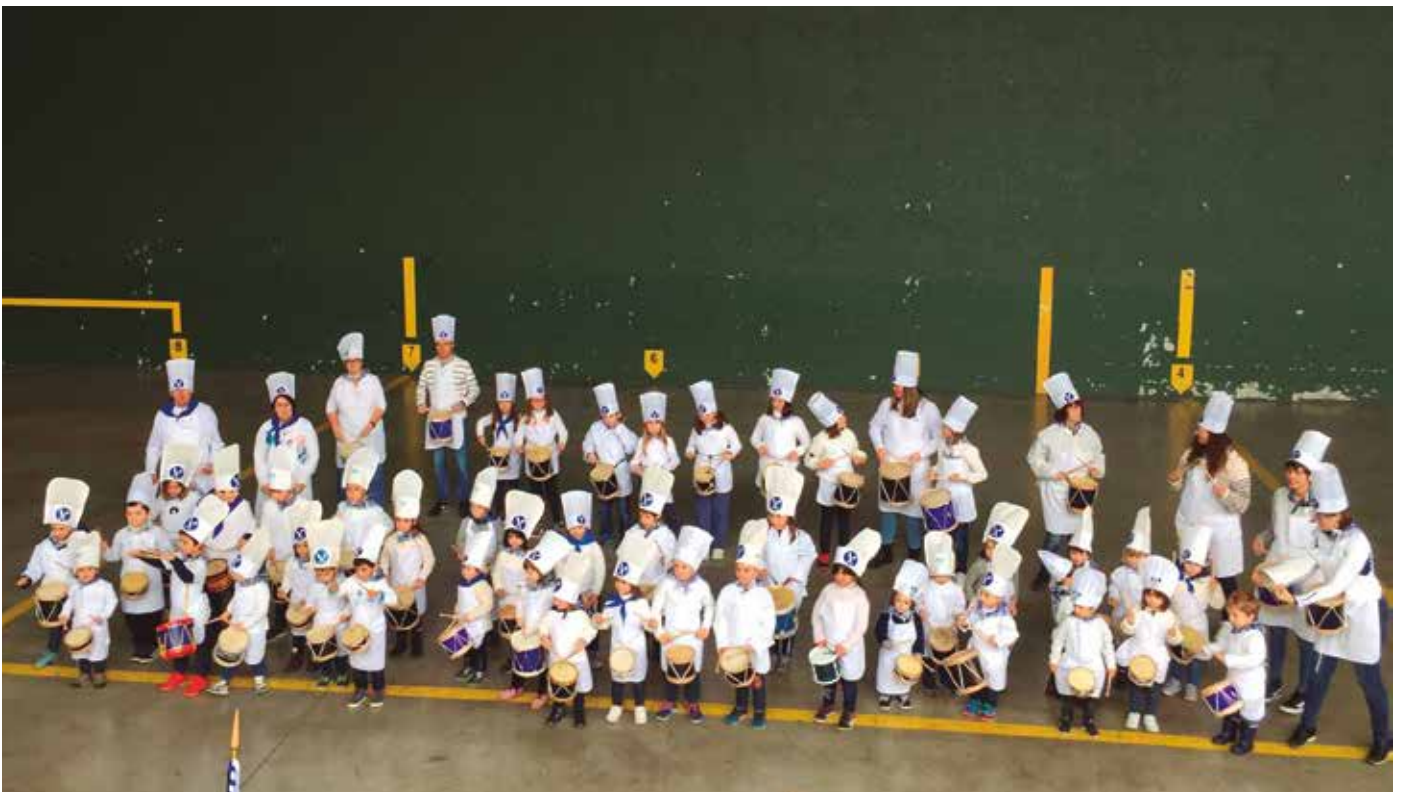
Zubietako Eskolako ikasleak eta irakasleak Zubietako frontoian aritu ziren. Harmailetako berotasuna jaso zuten abesti bakoitzaren amaieran.