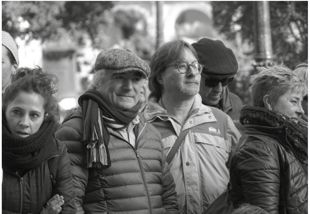
EHBildu Gipuzkoako ordezkariak, GuraSOsek Hitzartu plana Diputazioan erregistratu zuen egunean.