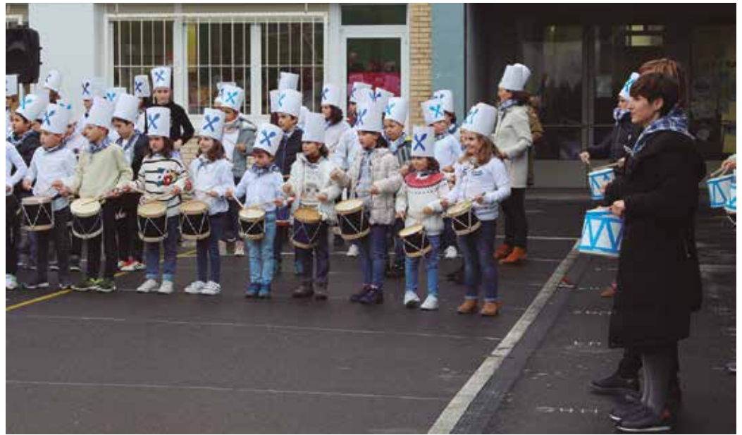
Udarregi Ikastolako HH eta LH mailetako ikasleek emanaldi bateratua eskaini zuten Agerialdeko patioan.

D anbor hotsak nagusi izan ziren urtarrilaren 18ko arratsaldean. Aurtent Donostia Eguna asteburuan egokitu denez, bi egunez aurreratu zen danborrada. Udarregi Ikastolako HH eta LH mailetako ikasleek emanaldi bateratua eskaini zuten Agerialdeko patioan. Zubietako Eskolako ikasleak eta irakasleak Zubietako frontoian aritu ziren. Aginagako ikasleak aldiz, eskola barruan. Argazki eta bideo irudi bidez jaso genituen hiru saioak.