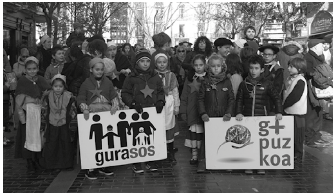
“Apuntatu otsailak 23 zuen egutegian!”, adierazi du GuraSOSeK sare sozialen bidez. Xehetasun gehiago larunbat honetan eskainiko dituzte.

Ondorioz, auzitegia GuraSOSeK Ingurumen Baimen Bateratua nulu deklaratu izateko aurkezturiko demandaren aurrean adierazi beharko da, baita CSIC-eko bi zientzialariek eginitako proba perizialaren aurrean ere. GuraSOSeK gogorarazi duenez, proba horretan