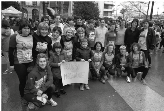
Izen ematea otsailaren 26an irekiko da edo dortsalak amaitu arte egongo da zabalik. Argazkian, duela bi urteko Lilatoian parte hartu zuten lasterkari batzuk.

Donostian ospatuko da ohi bezala, baina aurten martxoaren 10ean. Izen ematea online bidez egin beharko da otsailaren 26a edo dortsalak agortu baino lehen, www.lilaton.es atarian.