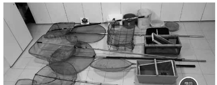
120 gramo eta arrantzarako tresneria konfiskatu ditu Ertzaintzak.

polizia operazioa burutu du egunotan Aginagan. Lau espediente zabaldu, 120 gramo eta arrantzarako tresneria konfiskatu omen ditu.