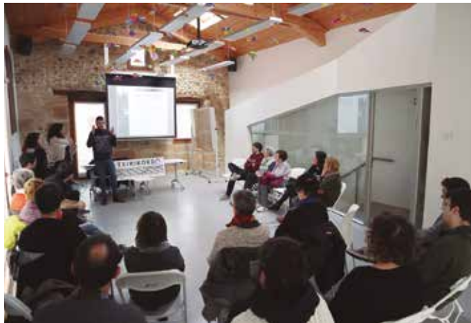
Belaunaldi arteko etxebizitza komunitarioa definitzen hasi ziren joan den larunbatean, Potxoenean.

Bigarren saioa larunbat honetan (otsailak 2), 10:30-12:30 artean Potxoenean. "Biztanleak eta sarrera baldintzak" izango dituzte hizpide. Guztira bost saio aurreikusi dituzte. Gaikako saio bakoitzean, dinamika ezberdinen bidez,