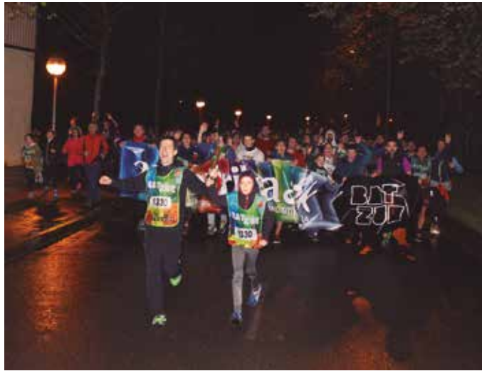
“Jendeak oso harrera ona egiten dio beti Korrikari”.