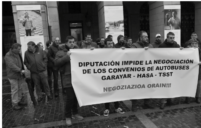
Buruntzaldean autobus zerbitzuak eskaintzen dituzten enpresei bere hitzarmenak negoziatu ahal izatea ez dietela baimentzen salatu zuten.

Hitzarmenak negoziatzen ez uzteak eragin nabarmena du enpresa hauetan; bi urte darमतate enpresetako hitzarmenak negoziatzeko arazoekin. LAB eta UGT sindikatuen esanetan, "enpresek argudiatzen dutena da etorkizuneko emakida arautzen duten pliegoetan oinarri bezala amaituta dauden hitzarmenak kontuan hartzen