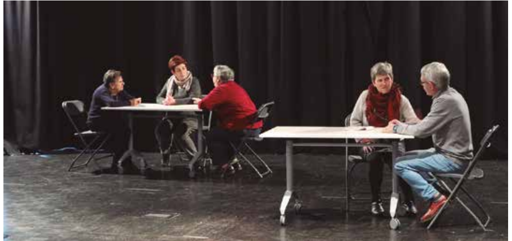
Antzezlan hau prestatzeko lehen urratsak Gure Pakea Elkartearen egoitzan bertan, Artzabalen eman zituzten. Otsailaren 8ko emanaldia prestatzeko, Sutegin ari dira entseatzeko azken egunotan.

Antzezlan hau prestatzeko lehen urratsak Gure Pakea Elkartearen egoitzan bertan, Artzabalen eman zituzten. Baina estreinaldi eguna gerturatu ahala antzezlan eskaini behar zuten eskenatokira lekuz aldatu behar izan zuten, “behar den bezala entseatzeko”. Sutegin, “hobeto kokatzen gara”, Kattalinen esanetan. “Lekua handiagoa da eta gure