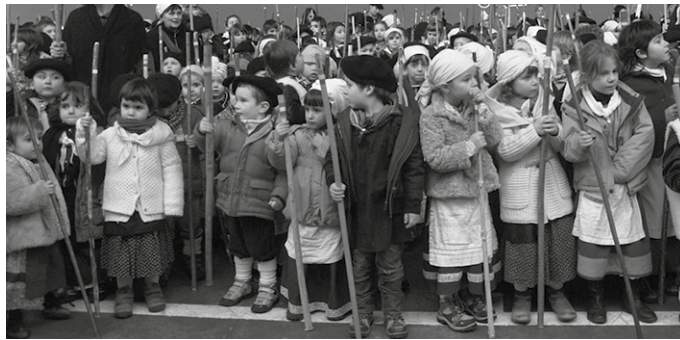
Agate Deuna bezperako kantaldia astelehenarekin egokitu da aurten.

■ 14:45ak aldera, koplak abes- tera irtengo dira ikasleak. "Ga- bonetan egindako ibilbide bera jarraituko dute. LHkoek amaie- ra frontoian emango dute. Ber- tsolariak LH5 eta LH6. mailako ikasleak".