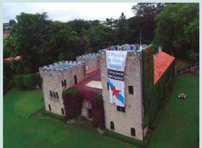
“2017ko abuztuaren 30ean Meirasko pazoan bi pankarta zabaldu zituzten botere publikoen eskuartzea eskatzeko helburuarekin”.

Xehetasun gehiago ostiralean erdaraz egingo den solasaldian. Sarrera doan.