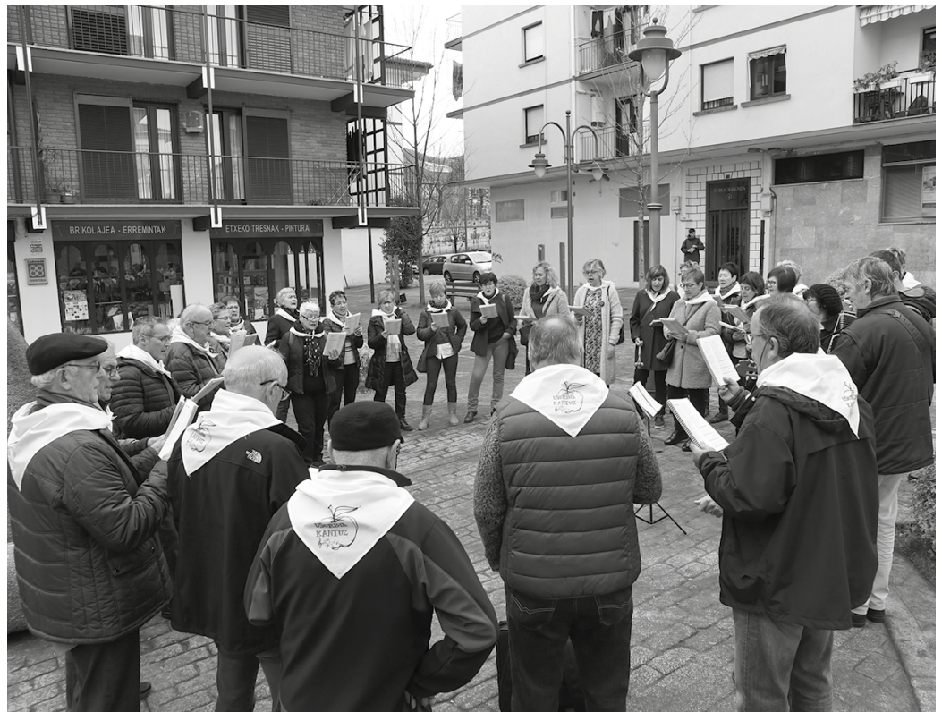
Martxoaren 30ean ospatuko dute taldearen 10. urtemuga.

■ 18:00-19:00 Ikastaroko entsegu saioak Agerialdeko musika gelan.