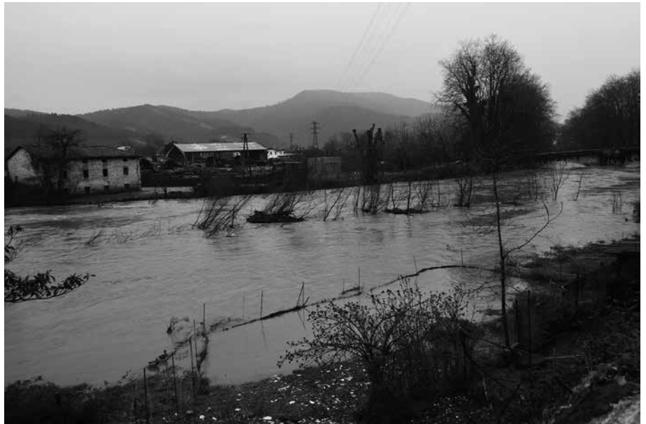
Ohiko puntuetan, ertzetatik erriberetan barneratu zen zertzobait errioa urtarrilaren 24an.

G ipuzkoa goi aldetik zetorren ura irentsi ezinik ikusi genuen errioa pasa den astean. Euri-jasak direla eta alerta larangan izan ginen 24 orduz urtarrilaren 23tik 24ra. Maila horia gaindituta, maila laranjara helztear izan zen Oria urtarrilaren 24ko goizaldean. Ohiko puntuetan, ertzetatik erriberetan barneratu zen zertzobait errioa, Zubietan edo Txokoalde inguruan esaterako. Aparteko arazorik ordea ez zuen eragin.