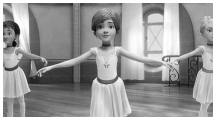
17:00etan hasiko da filma. Sarrerak egunean bertan jarriko dituzte salgai Sutegin.

"Felicia neskatila umezurtz bat da, ausarta eta amets bakarrarekin: dantzari bilakatzea. Ametsa egi bihurtzeko bidean bere lagun min den Victorren laguntza izango du. Gazte asmatzaile honekin Feliciak abentura zirrargarriak biziko ditu