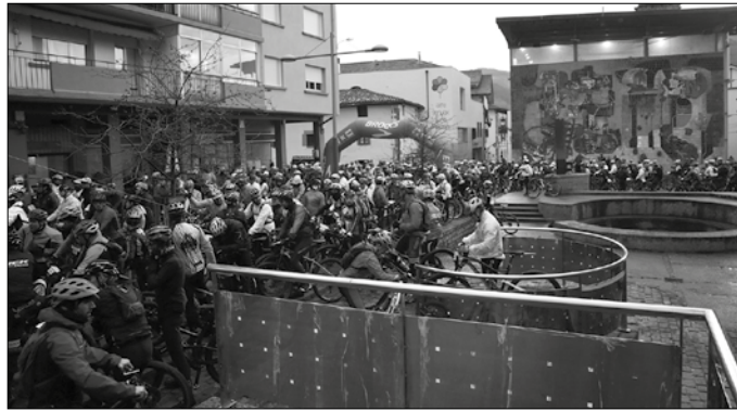
“Eguna bikain joan zen”, antolatzaileek aditzera eman digutenez.

Ia 600 lagunek eman dute izena aurtengo ediziorako. Inskripzio kanpainak izandako arrakastak islada argia izan zuen urtarileko igande goiza izateko, urtarilaren 27an ezo-