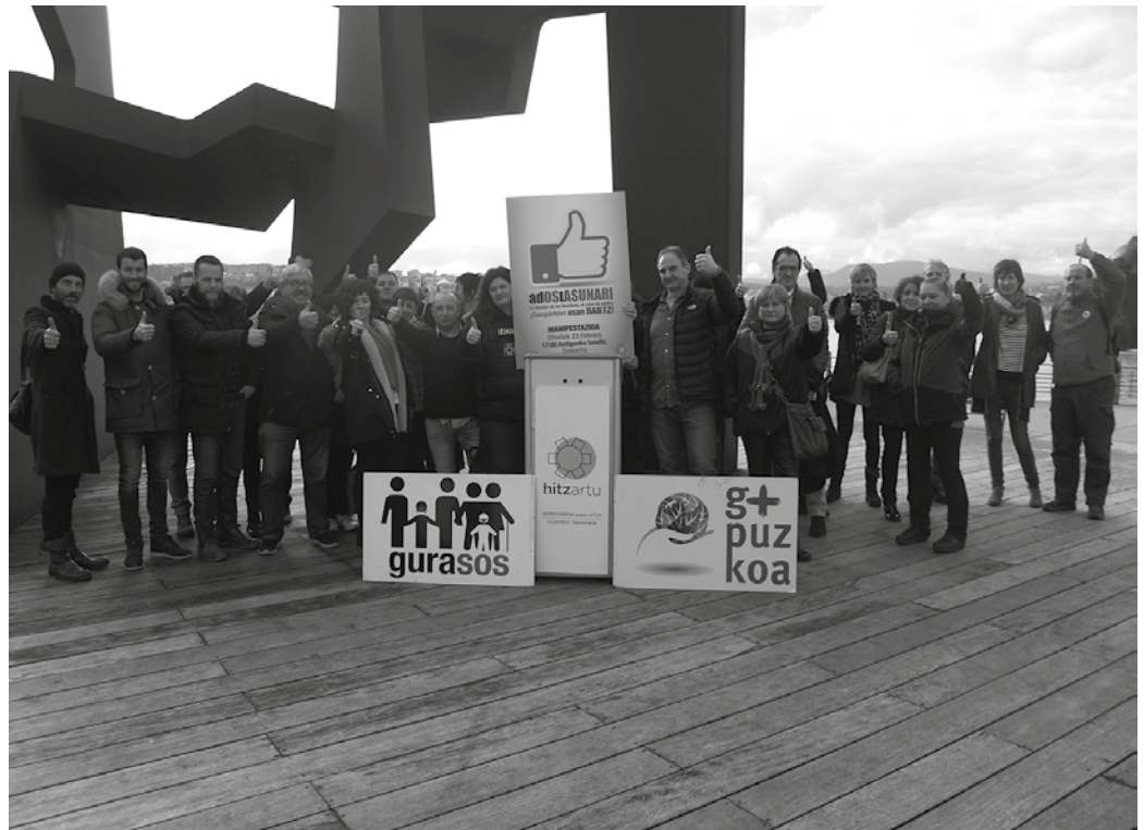
Manifestu baten bidez, ahalik eta sektore gehien eta anitzenen atxikimenduak biltzeko kanpaina abiatu dute.

Adostasunaren keinu hori egitera animatzen gaitu GuraSOsek datorren hilabete honetan zehar. Urtarrilaren 26ko agerraldian parte hartu zuten Gipuzkoako sektore ezberdinetako ordezkariak manifestu hau hezkuntza, osasuna, ekonomia, kultura, kirola, ekologia, eta oro har, gizarte eragileen artean zabaltzeko konpromisoa erdietsi dute. Gizarteak oro har kanpaina honetan parte hartzeko aukera ere izango du. Lantokietan, familian, lagun artean bildu, banakako nahiz taldeko argazkiak atera eta GuraSOsen web orrialdera helaraztea proposatu dute. Bil dutako atxikimendu guztiokina erraldoi bat osatuko dute gero, manifestazio handia iragartzeko.