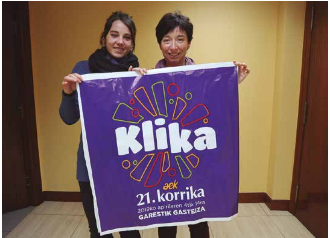
Korrika Batzordeak lehen bilera irekia deitu du ostiral honetarako. 18:30ean Etumeta AEK euskaltegian.