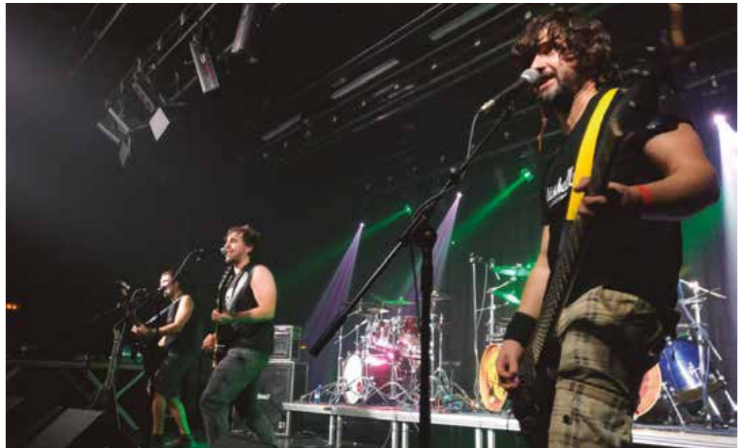
Mendeku Itxua (argazkian), Rukula, Desegin, Izeberg, Eskean Kristo, Hotzikara eta Odolaren Mintzoa taldeak arituko dira Haraneko aparkalekuan.

■ 12:30 Herri kirolak: Inaxio Perurena harri jasotzailea eta