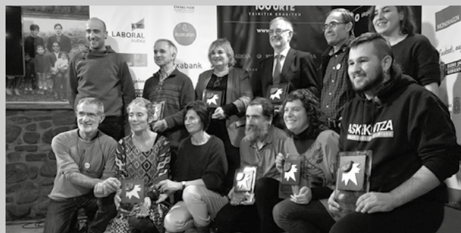
Atxega Jauregian egin zen sari banaketa.

ria, migrazioaren errealitatea ikusarazteko argitaraturiko lanengatik.