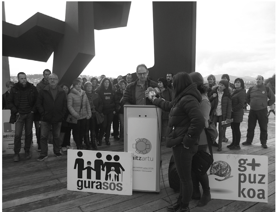
“Hondakinen kudeaketa eredu baina askoz gehiago dugu jokoan otsailaren 23an. Gizarte eredu baina askoz gehiago dugu jokoan, demokraziaren kalitatea, duintasuna eta gizarte bezala dugun etorkizuna”, GuraSOsek aditzera eman zuenez.