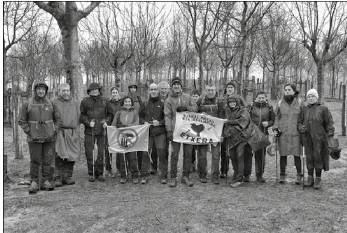
Otsailaren 11n egin zuten Usurbil, Ernio eta Alkiza lotu zituen irteera.

Otsailaren 16an, Erlo-Xoxote “Euskal Herriko mendiak eza-