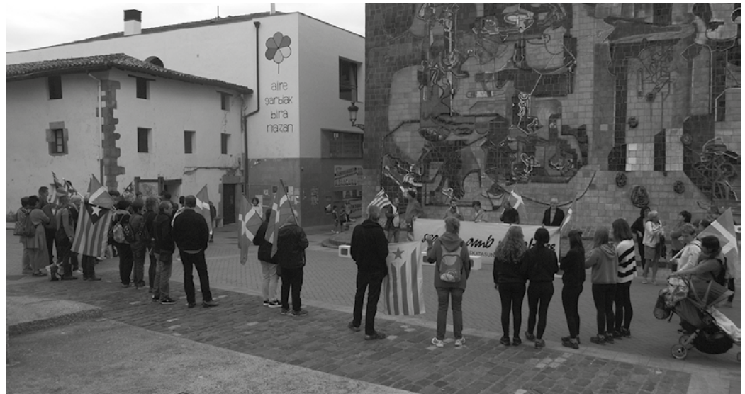
Mobilizazioetan demokraziaren aurkako epaiketa izango dena salatuko da.

Testuinguru honetan kalera irteteko ordua dela azpimarratzen dute Gure Esku Dago mugimendutik. Epaiketa hastekoa zen astearterako elkarretartzea deitua zuen Mikel Laboa plazan, "Elkartasuna aterpe. Konponbidea. Democrazia.