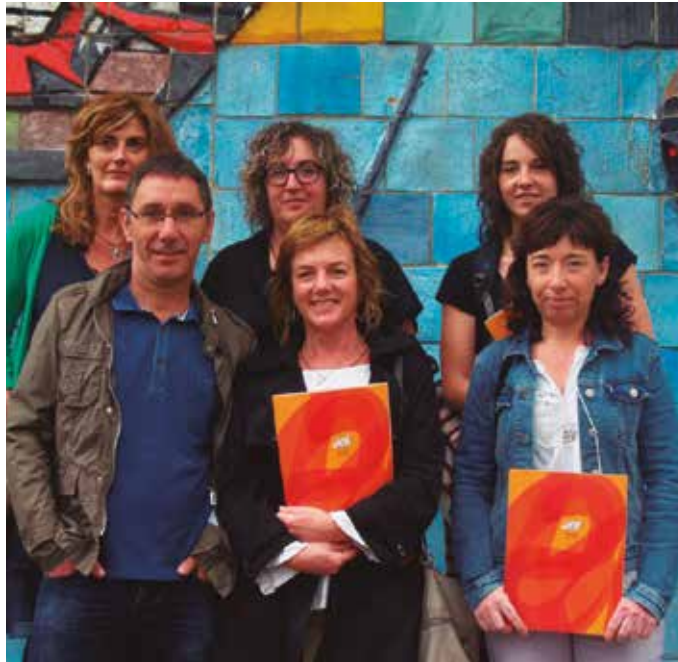
Jada bederatzi urte bete ditu Mintzalagun ekimenak.

Asteroko saioekin batera, Mintzalaguneko kide guztiak batu eta herri osoari zabaltzen zaion ekintzarik egiten dute urtero. Iaz esaterako, Txokoaldeko Txalaparta Txokoa bisitatzen izan ziren. “Irteerari esker asko ikasi zuten eta oso ondo baloratu zuten. Oso arrakastatsua izan zen”.