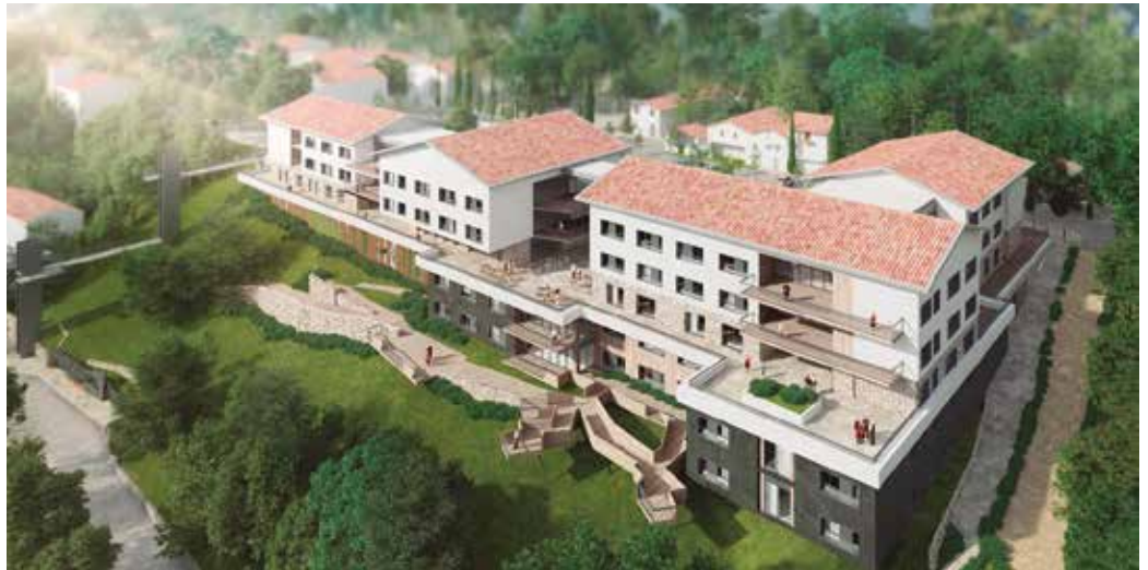
Udalak gogorarazi duenez, legealdi hasieran proiektu honi berriz heltzeko aukera suertatu zenetik gobernu-taldearen agendan eta gobernu-programan presente egon den proiektua izan da.

Horrekin batera, 70 urte edo gehiago izan eta bakarrik bizi diren 180 herritarren artean inkesta bat egitekoa da Udala hurrengo asteotan, kolektibo honen beharrak identifikatu