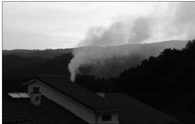
"UCIN S.A. enpresak ez ditu obra baimenaren baldintzak bete".

laren eskumenekoa denez, udalarekin hitz egitea erabaki genuen. Jakin genuenez, Udalak, 2018ko uztailean UCIN S.A. enpresari obra gauzatzeko baimena eman zion, bestean artean baldintza hauetan: lehenik, estalki berriak ITXIAK izango zirela (larriz idatzita), eta bigarrenik, obrak amaitu ostean eta jarduera berriro hasi aurretik obraren bukaeraren txostena aurkeztu behar zuela.