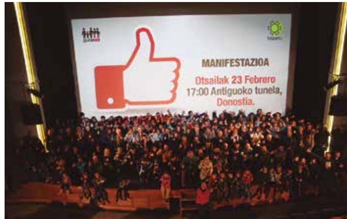
Otsailaren 23rako adostasunaren aldeko manifestazioa deitu du GuraSOSeK. Donostiako Antiguoko tuneletik abiatuko da, arratsaldeko 17:00etan.

Aipatu moduan, igandeko Lasarteko ekitaldian, erraustegiaren kontratuaren gaineko xehetasunak argitara eman zituen GuraSOSeK. Kontratu honen