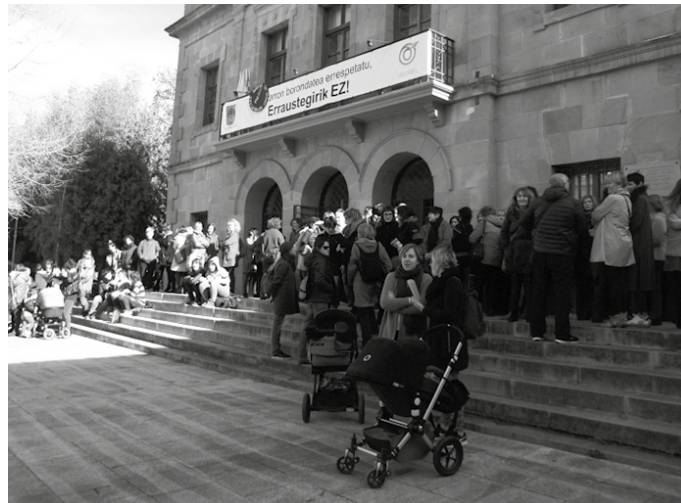
Usurbil mailako lehen bilera deitu du emakume talde batek, ostegunerako (otsailak 14) 18:30etan Potxoenean.

“Greba feminista egungo sistema zalantzan jartzeko egu-