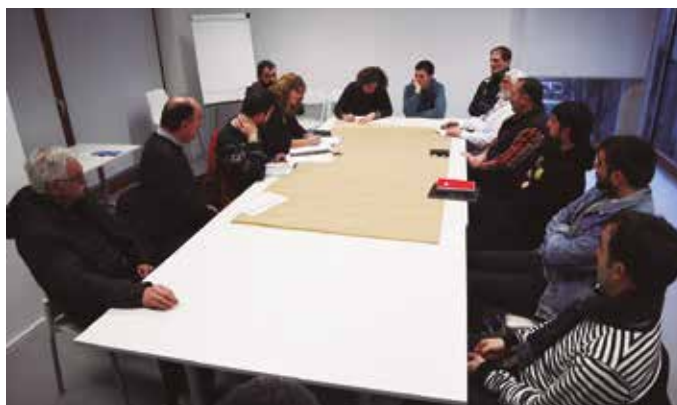
Otsailaren 27an batuko dira 18:00etatik aurrera Potxoenean. 2019ko jaiak bost eguneko iraupena izango dute, ekainaren 28tik uztailearen 2ra.

Egunak finkatuta, antolaketa prozesuari buruz luze zabal jardun zuten lehen bilera honetan parte hartu zuten herri eragileetako ordezkari ezberdinek. Azken urteon ildo beretik, orri zuri batetik abiatu eta bideratu nahi dituzte Santixabeletako prestaketa lanak. Herritik herriarentzat, eta Jai Batzordearen altzoan, elkarla-