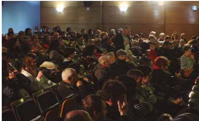
Enpresa eraikitzaileek sustaturiko komunikazio planaren berri izan du GuraSOsek.

Erraustegiak gizartean eragiten duen errezeloz jabetuta, “ate irekien egunak, egokitutako irtenbideak proposatu eta herritarren kezka lehen eskutik tratatzeko solasal-