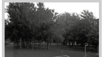
“Guztira, 40 bat zuhaitz moztea aurreikusten da”.

Mantenu lan ezberdinak bideratuko ditu Udalak, zuhaitz batzuen eta beste egoera aintzakotzat hartuta. “Datozen egunotan, udal zerbitzuek Artzabalgo parkean dauden astigarren bakanketa lanak egingo dituzte, parkea egin zenean erabilitako irizpide bera jarraituz. Zenbait kasutan hazkuntza handia izan duten astigar batzuk moztu egin beharko dira, hazkuntza txikiagoa izan duten baino osasuntsu dauden beste zuhaitzen mesedetan. Beste zenbait kasutan, modu desegokian hazi eta etorkizun urria duten zuhaitz txikiak moztuko dira”.