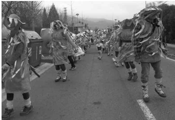
Egun osoko festa izango da otsailaren 23koa.