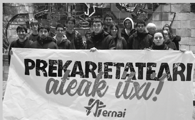
Larunbat honetarako manifestazioa deitu dute Bilbon. Autobus zerbitzua antolatu dute Usurbilen. Aurrez izena emateko zerrenda Aitzagan da.

Gaur Usurbildik dei egiten diogu Euskal Gazteriarri sistemari hortzak ateraz, Euskal Herria eraikitze borrokara batzeko, otsailaren 16an denak Bilbora!". Hortxe Usurbilgo Ernaik eta Aztarrika gazte mugimenduak, hilaren 7an Mikel Laboa plazatik luzatu zuten gonbita. Lan eta bizi prekarietatearen aurkako elkarretartzea egin zuten frontoi atzean, eta hitzordu honen bidez, larunbatean, otsailaren 16an, Euskal Herri mailako Enai gazte antolakundeak gai beraren hari-