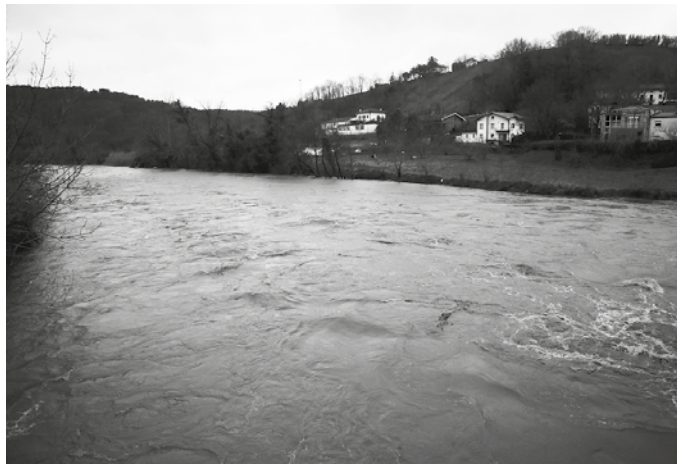
2019an lanak lizitatu beharko dituzte, 2020an hasi eta 2022rako bukatu.

Udal gobernu taldetik gogorazten dutenez, besteak beste, EHBilduren babesaren ezinbestekoa izanik, Añarbek joan den urrian Gipuzkoako Batzar Nagusietan aurkezturiko aurrekontu-proiektua atzera bota zuen koalizioak, “urteetan mahai gainean izan diren hainbat proiektuei heltzeko konpromiso faltagatik”. Proiektu horien artean, bi nabarmentzen ziren EHBilduk; Pasaiako Por-