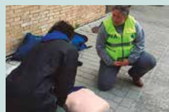
Desfibrilagailuen ikastaroa Aginagan.

■ Apirila 3-4, 18:00-20:00 “Erosketa seguruak Interne-