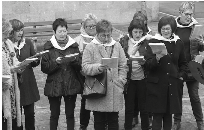
Kantuzaletasun aktiboa sustatuz, galdutako plaza berreskuratzen du Kantu Taldeak, azken hamarkada honetan.

Bota Punttuba, Usurbilen Nahi Ditugu, Gure Pakea Elkartea, Zumarte... izan dituzte bidelagun 10 urteotan. "Elkarlan hori garrantzitsua da, elkarren arteko hormak hautsi eta halako elkarbizitza bat izateko. Usurbilek hainbat eragile ditu zorionez eta Kantu Taldea horietako bat da. Pozik gaude horregatik", adierazi diote Kantu Taldetik NOAUA!ri. Hainbat dinamika sortu dira elkarlan horietatik; besteak beste, kantua, bazkari edo afariekin edota bertsoekin uztartu izan dituzteneko saioak, sortzaile ezberdinen omeneko saio monografikoak beste herri eragileen hitzorduetan ere parte hartu izan dute. Talde barrura begira, "kantu-jira eta kantu-afari mordoak egin dugu". Topaketak beste kantu talde-