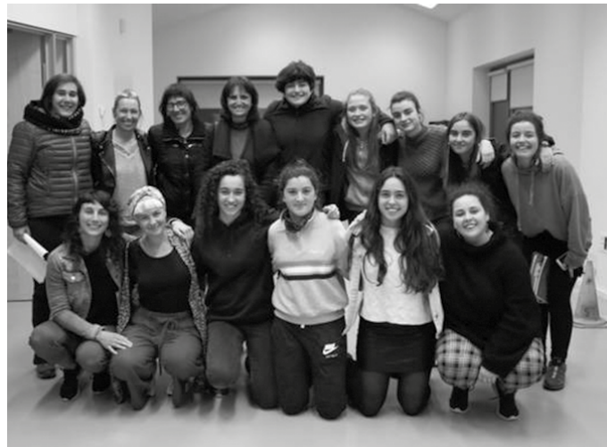
Martxoaren 8ko greba feministaren balantzea egiteko, martxoaren 21ean Potxoenean bildu zen emakume taldea.

Martxoaren 8ko bizipenetatik ekin zioten feministek balorazioari, bakoitzak bere sentipenak partekatu zituen gainontzekoekin eta egunean zehar bizitakoaren inguruan egindako hausnarketak azaldu zituzten. Egun hartako argazki eta bideoak ikusi zituzten gogora ekartzeko prozesu guztia eta ondoren, banan-banan zenbait aspekturen gainean hausnarketa egin zuten: egitaraua, zaintza, pentsiodunak, ikasleak... eta gai bakoitzaren