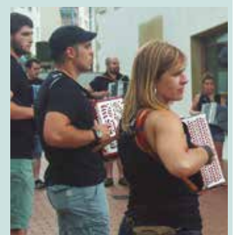
Ikasle ohiak Santixabel egunez batzen dira.

dago tartean eta kide ia denak nire ikasleak izan dira. Garai bateko ikasleak berriro elkartzea gauza polita da. Neroni ere harro sentitzen naiz. Jarraipen bat izan du gainera eta hori ederra da. Kontua da Santixabel jaiek nire herriko San Pedro jaiekin bat egiten dutela eta urte batean kale egin nuen, baina libre egonez gero urtero etortzen naiz. Ikusgarria da.