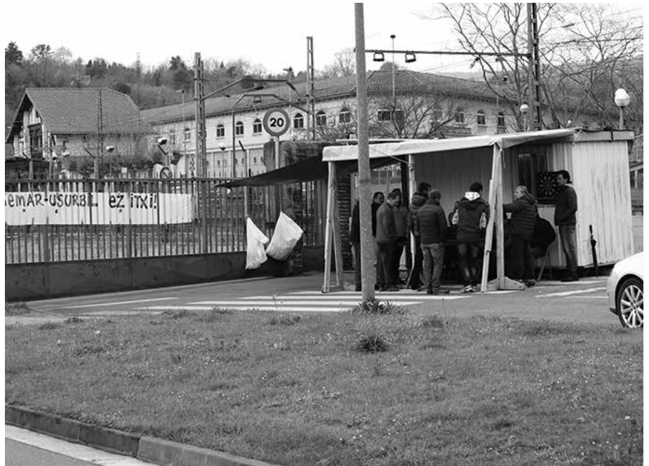
Bi astetik gora daramate Ingemarreko langileek greba mugagabeen.

I a langile guztiak kaleratu nahi dituzte, eta finean, Atalluko planta itxi. Horren aurrean, dituzten lanpostuen eta Ingemar irekita segitzearen alde duela 10 urte hasitako borrokan segitzen dute langileek. Duela bi aste baino gehiagotik greba mugagabeen dira berriz. Astartean, egunero biltzen dira lantegi atarian bost orduko bi txandetan, 8:00-18:00 artean, bertan egokitua duten etxetxoan. Lantegia errentagarria dela defendatzen dute, “inor ez dago soberan”. Ingemar taldeko 47 langile kaleratu nahi dituzte, haietatik 31 Usurbilgo lantegikoak. Kontratu amaierako EEE aurkeztu zaie.