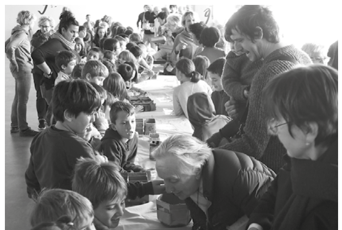
Martxoaren 22an Agerialden antolatu zuten azoka solidarioa ireki orduko, LH2ko ikasleek ziztu bizian saldu zituzten eskulanak.

toian antolatu zuten halako hitzordu solidarioa, Greziako errefuxiatuak laguntzeko. "LH6ko eta Udarregi ikastolaren partez eskerrak eman nahi dizkizuegu gure Azoka Solidarioan agertutako eskuzabaltasunagatik, bai herriko saltokiei baita bertaratu eta erosketak egin zenituztenei ere. Gure ikasleek guztira 1.113 euro lortu dituzte. Diru hori Zapareak (GKE) elkartera bideratuko da. Eskerrik asko guztioi eta bereziki LH 6ko ikasleei beraien lanagatik!".