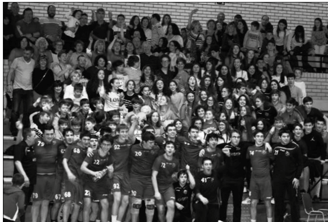
Usurbil K.E.-ko taldea, lagun, senide eta elkarteko kideez inguratuak.

du genuen, baina gustora joan ginen sagardotegira, Euskadiko txapelkun ginela ospatzera.