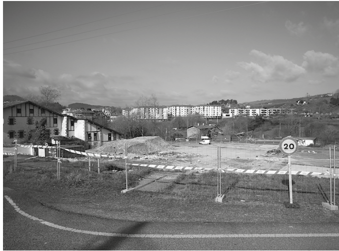
Babes ofizialeko 46 etxebizitza eta 46 etxebizitza tasatu eraikiko dituzte.

Ohar bidez Udalak jakitera eman duenez, “obra honek eremu horretako zirkulazioa aldatzea ekarriko du”, aipatu moduan, astearte honetatik (martxoak 26) obrak amaitu artean. Batetik, “Pikaolatik Kaxkorantz doan errepidea itxi egingo dute, eta, ondorioz, Ugarte aurreko errepidea bi norabidekoa bihurtuko dute. Ibilgailuen joan-etorria semaforo bidez erregulatuko da: aldaparen hasieran eta amaieran jarriko dira semaforak”.