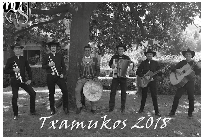
Txamukos Mariatxiak izango ditugu, 15. Soinurbil Musika Asteako gonbidatuen artean. Lesakako talde honek Usurbilgo kide bat du.

Emanaldirik ere izango da haurrentzat; "Txomin & Txistuman, Deskontzertuan" izenekoa hilaren 2an Sutegin. "Euskal Herriko eta munduko instrumentu tradizionalen kontzertu xelebrea umeentzat. Txomin txistu hitzun bat da, eta banda bateko zuzendaria ere bada: munduko instrumentu musikal tradizionalen