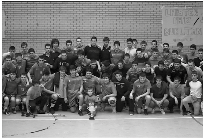
Usurbil K.E.-ko jokalariek Euskadiko Txapelketa irabazi berritan.

Igandean, Tolosarentzat irabazi beharreko partidua zen eta guretzat, taldeko giro onarekin jarraitzea zen asmoa, jokalariei guztiei minutuak emanaz. Azkenean, batengatik gal-