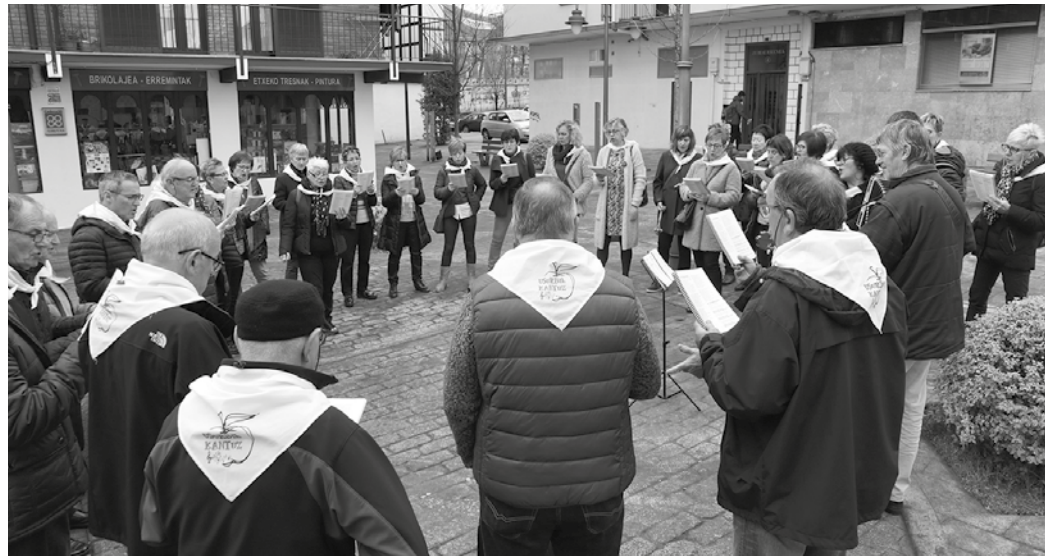
10 urte bete ditu Usurbilgo Euskal Kantu Taldeak, herria kantuz girotzen, euskara eta euskal kultura sustatzen.

Euskal Herrian beste hainbat herrietan gertatu izan denaren ispilua izan zen herri hau. 2009. urtean sartu berri-tan, Udarregi Ikastolako musika gelan hasi ziren lantzen kanturako zuten zaletasuna. Lerrootan protagonista nagusia dugun 10 urteko ibilbidea osatu duen Kantu Taldea jaio zen. Ordutik, euskara eta euskal kantutegia ardatz, kan-