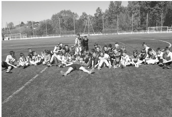
Usurbil F.T.-k apirilaren 23tik 27ra antolatu dituen kirol txokoetarako izen ematea egunotan bideratu beharko da.

Futbol taldeen bilgunea izanik, egun horietan eskainiko dituzten jardueren artean futbola izango da noski, baina "Usurbil Futbol Taldeak, futbola ardatz badu ere, kirolaren onurak go-raipatzen ditugu orokorrean. Horregatik, ekintza honetako eskaintza anitza eta zabala izango da". Besteak beste, eskubaloia, jolas tradizionalak, futbola, eskupilota, herri kirolak, saskibaloia... ekintza hauetan jolasteko aukera izango dute gaztetxoek. Jolasteko aukera, ez lehiatzekoa. "Adin hauetan, kirol eta jolas ezberdinak egitea aberasgarria da eta