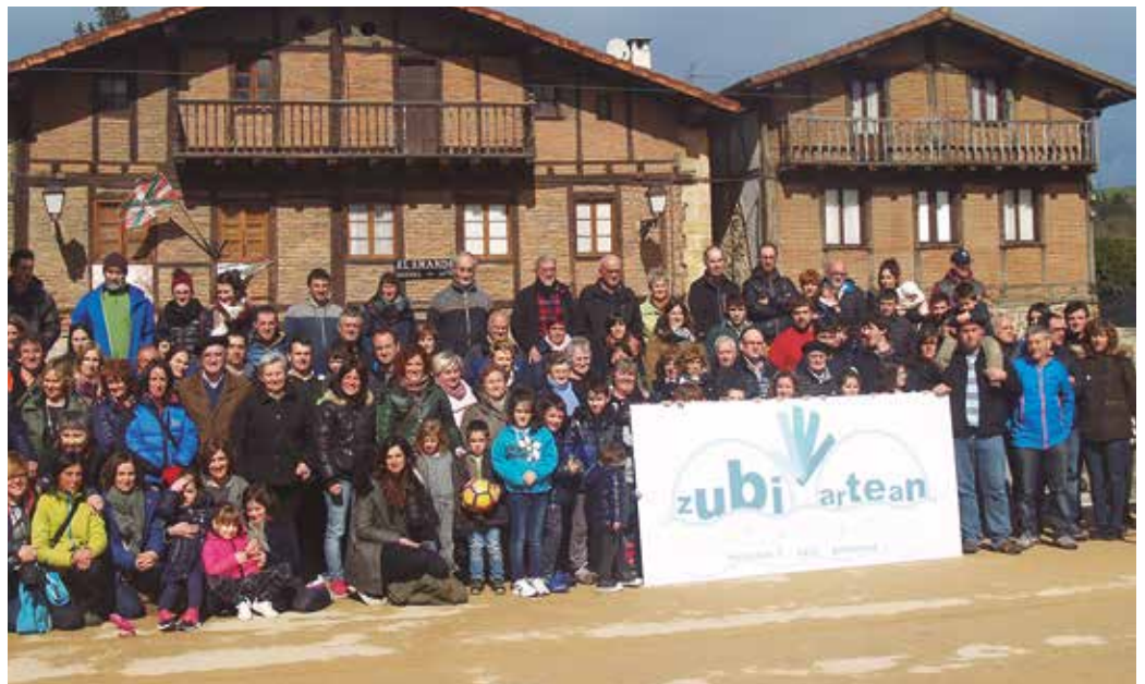
Zubietako hainbat herritar 2017ko maiatzerako antolatu zuten galdeketaaren aurkezpenean.

Zubietako Herri Batzarrak datorren apirilaren 3rako deitua duen bilkuraren bezperatan, Zubietako hizpide izango dute Usurbilgo Udaleko udalbatzaren osoko bilkuran. Izatez, hilabeteko azken asteartean izaten