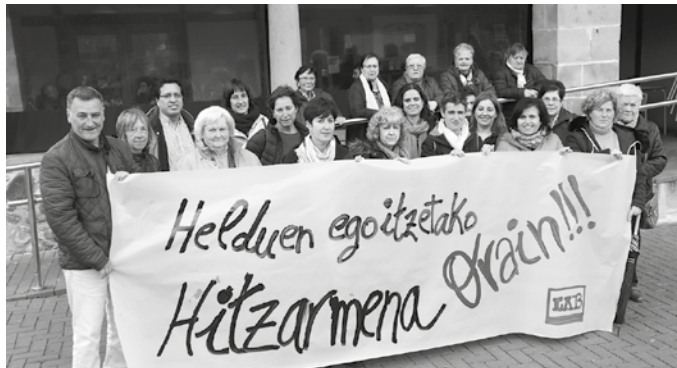
Hainbat langile, duela hilabete Artzabalen eginiko elkarretaratzean.

Egoera prekarioa bizi dute langileok; jardunaldi par-