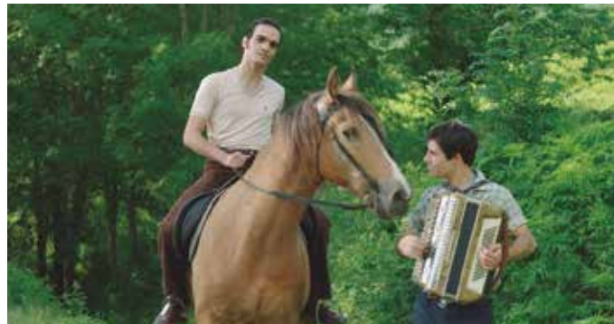
Jexux Artze Kultur Elkarteak antolatu du filmaren proiektzioa.

Hiru garai islatzen ditu filmak: haurtzaroa, 20 urte inguru zituzteneko gazte garaia