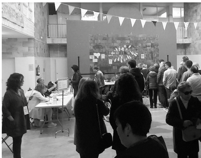
Udal, foru eta Europako hauteskundeak ospatuko dira maiatzaren 26an, eta Zubietan Herri Batzarra berritzeko aukera ere izango dute.