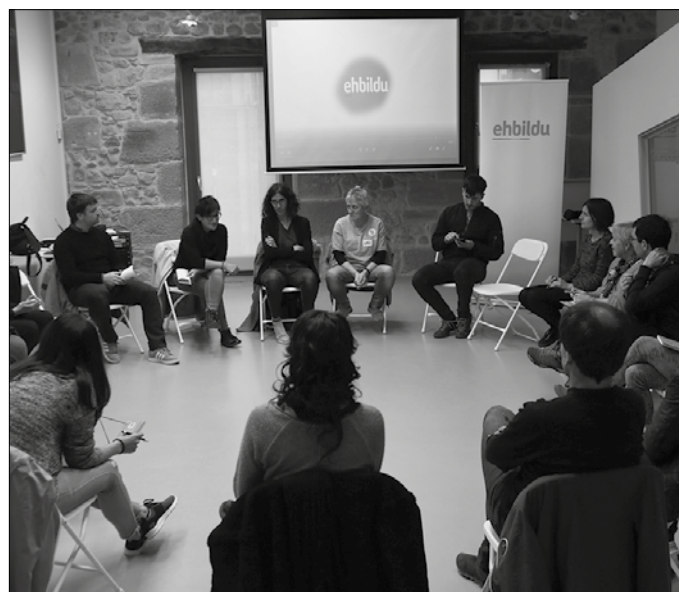
Ostegun honetan feminismoaren inguruko bilera deitu dute Sutegin.

■ 12:00 Gazteekin bilera Sutegi kanpoaldean.