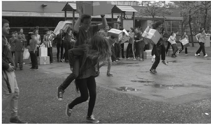
Maiatzaren 13an hasi eta maiatzaren 17an amaituko da kanpaina.

Ziortzako neska-mutil talde batek Caritasen aldeko ekimen bat sustatu nahi du. “Proiektu hau gure gizartean gertatzen diren ez-beharrekin enpatizatzeko eta laguntzeko hasi dugu”, ohar bidez jakinarazi dutenez. Galtzerdiak batuko dituzte. Bilketa kutxak Sutegin, Kiroldegian eta Ikastolan aurkituko dituzue.