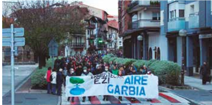
Errausketaren Aurkako Mugimenduko Usurbilgo kideek bat egin dute deialdiarekin.

Baita maiatzaren 17ko Birziklatzearen Nazioarteko Egunean, Errausketaren Aurkako Mugimenduak eta Donostia Bizirik herri plataformak 19:00etan Gipuzkoako hiriburuko udaletxe ondoan (lekua egunotan zehaztuko dute) elkarretaratzera ere.