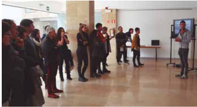
Usurbilgo Udalak, Hiritik At Kooperatibak eta LZB Arkitekturako ordezkariak Txirikorda partehartze prozesuaren berri eman zuten aurreko larunbatean.

Pozik agertu zen Usurbilgo alkatetea proiektuak herri barruan nahiz herritik kanpo izan duen harrerarekin. Herritik kanpo, hedabide ezberdinek, baita jubilatuz zein zaintza elkarrekin deitu baitute Usurbilera, Txirikorda proiektua ezagutzeko jakinminez. Proiektu honek bi kolektiboen, gazteen eta adinekoen beharrei erantzun die: gazteen emantzipazio beharrei eta bizimodu erosoagoa, isola-