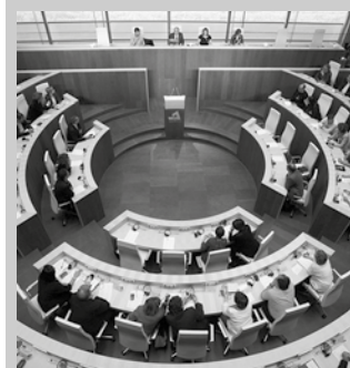
Zazpi zerrenda hauek bozkatu ahal izango dira: EH Bildu, EAJ-PNV, PSE-EE/PSOE, PP, Ciudadanos, Elkarrekin Podemos eta Aulki Zuriak.