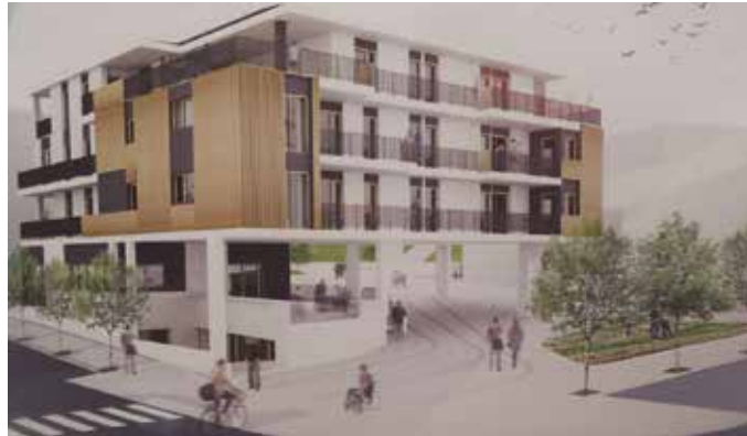
Informazio panelak Sutegiko erakusketa aretoan dituzue ikusgai.