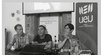
Uztailearen 12an eta 13an egingo da.

“Maitasuna politikoa da” izena du aurtengoan Usurbilen ospatuko den UEU-ren udako ikastaroen baitako Jakin Jardunaldiak. Uztailearen 11n eta 12an ospatuko da hirugarren edizioa. Usurbilgo Udalak, Jakinek eta UEU-k antolatutako hitzordurako matrikulazioa maiatzaren 13an zabalduko da. Izen ematea osatzeko edo informazio gehiagorako: ueu.eus