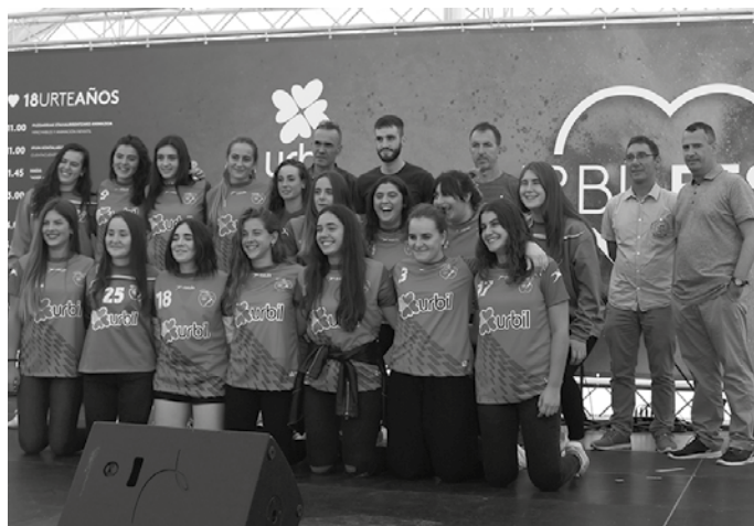
Usurbil K.E.-tik zorianak helarazi nahi dizkiete senior nesken taldekoek. Gipuzkoako txapeldunak ditugu Urbil-Usurbil K.E. taldekoak. Zorianak!