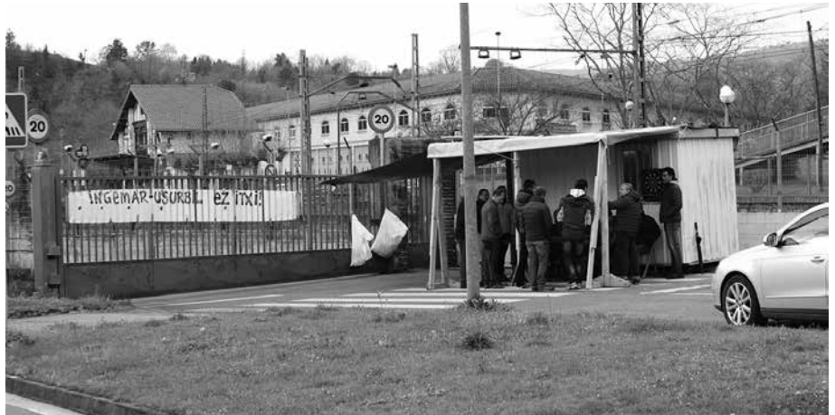
Ostiral honetan, arratsaldeko 18:00etan abiatuko da manifestazioa udaletxe paretik.

Duela 10 urte hasitako borroka luzea egin dute langileok, Usurbilgo lantegia itxtearen eta urte guztian izan diren