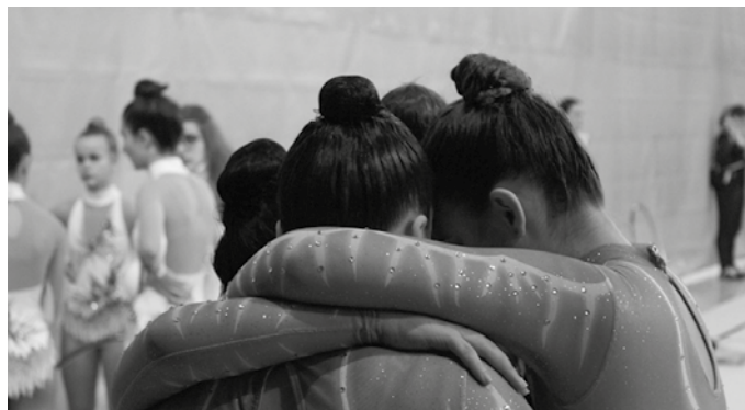
Maila bakoitzari aparatu bat dagokio, beraz, ikuskizuna anitza eta oparoa izango dela adierazi digute Tximeleta Taldekoek.

V. G: Nik uste gehienok eza-gutzen gara. Entrenatzaileok topaketetan eta txapelketetatik ezagutzen gara. Ordezkapenak ere egiten ditugu beharrezkoa denean, beraz, beti gaude kontaktuan.