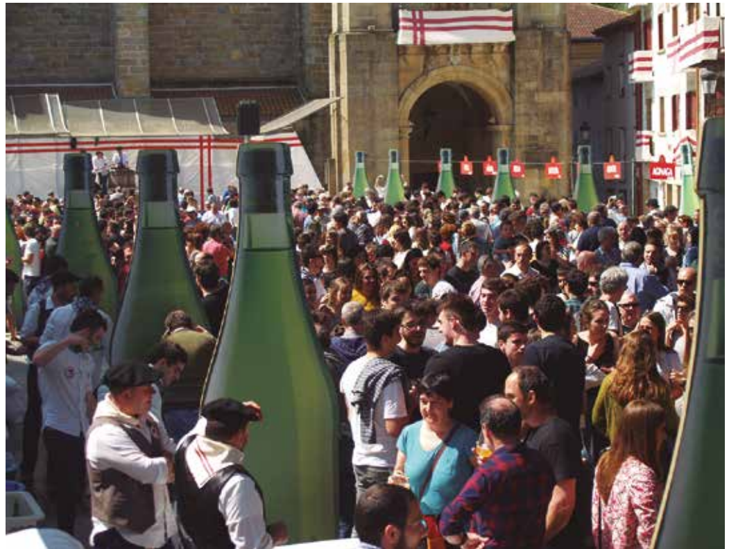
41 sagardo postu ipiniko dira maiatzaren 19ko Sagardo Egunean.