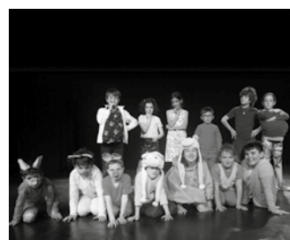
Larunbat honetan, 12:00etatik aurrera Sutegin.

ra jauzi egin dute Muxurbileko gaztetxoek, entsegu saioetan. 4-11 urte arte inguruko gaztetxoak ariko dira antzezle lanetan larunbatean. “Adin tarte handia baina hala gertatu zaigunetik gusturago gaude. Gauzak naturalago ateratzen zaizkigu. Ilusio handia dute”, adierazi digute antzerki taldeak.