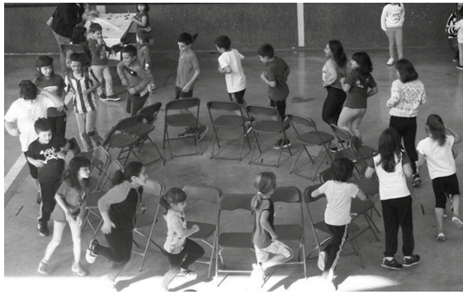
Usurbilen, Aginagan eta Zubietan antolatu dituzte aisialdi ekintzak.