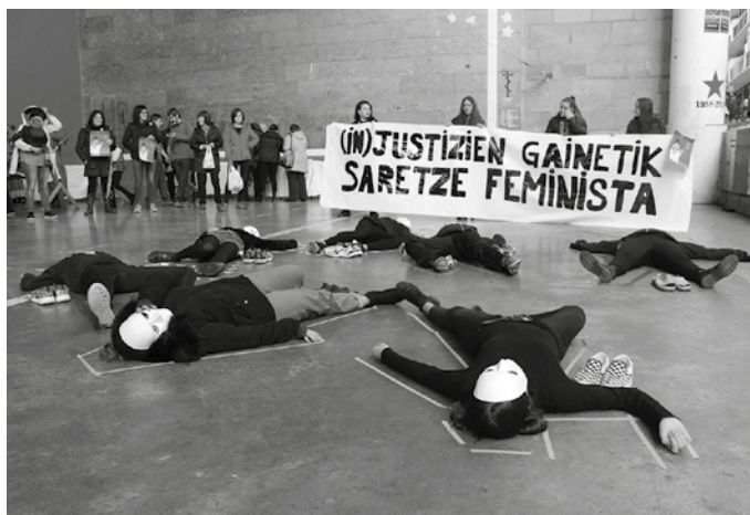
Udazkenerako prozesu berri bat martxan jartzea dute helburu.

Martxoaren 8ko grebaren ondoren bilera bat deitu genuen