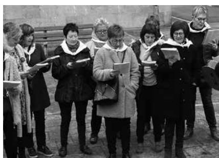
Larunbat honetako kantu saioa eguerdiko 12:30ean abiatuko da Mikel Laboa plazatik.

Besteak beste, azken urteotako hitzorduari hutsik ez diote egingo aurten ere. Usurbilgo Euskal Kantu Taldea, Euskal Herria Kantuz elkarteak eta Xiberoko Kantuzaleen Biltzarrak ekainaren 15ean Zuberoan, Maule-Urdiñarben antolatuta duten Euskal Herria Kantuz Egunera joateko irteera prestatzen ari da. Autobus zerbitzua antolatu dute Usurbildik; 8:30etan abiatuko da Oiardo Kiroldegi ataritik. Egunpasa joan asmo duenak Kantu Taldeko kideren batekin hartuemanetan jar dadila.