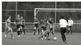
Emakumezkoen erregerial taldea osatzeko asmoa dute.

Interesa duzuen guztiontzako bilera hitzordua finkatu du herriko futbol klubak; ostegun