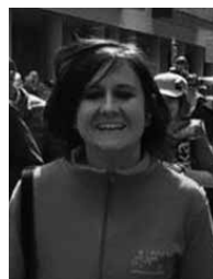
Itxaso, ez jarri jelskor! Zuri ere iritsi zaizu txanda. Ondo ospatu urtebetetzea!