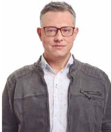
“Kudeaketa-programa serio eta zorrotz bat proposatzen dizuegu”.

Udal ekintzak sustatuko ditugu Naturklimarekin lankidetzan (Aldaketa Klimatikoaren Gipuzkoako Fundazioa).