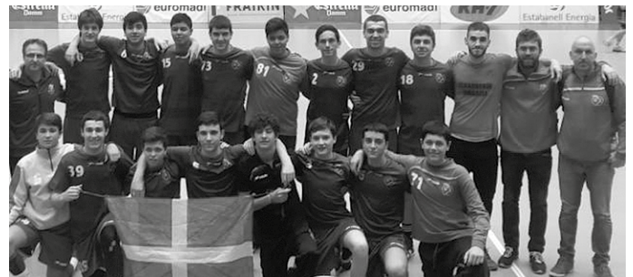
Usurbil KE taldeko kadeteek denboraldi ederra osatu dute. Sektoreko txapeldun-orde izan ziren asteburuan. Zorionak!