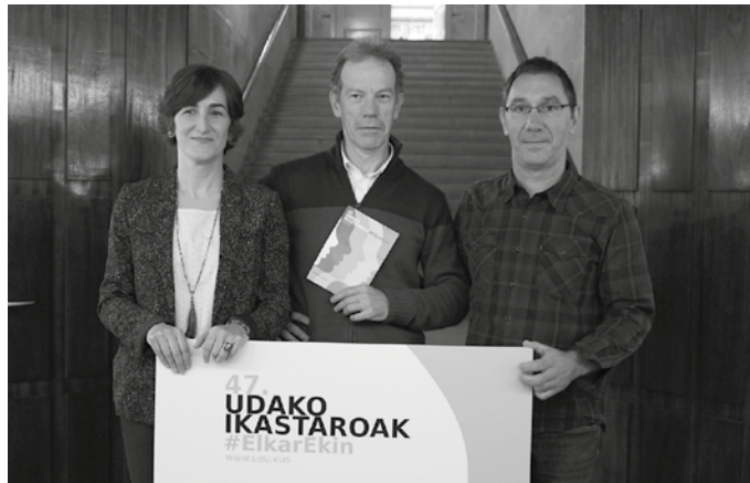
Maitasuna politikoa da jardunaldietan arlo ezberdinetako adituak batuko dira.

Jakin Jardunaldiak hain zuzen, UEU, Jakin eta Usurbilgo Udalaren elkarlanaren emaitza dira. Uztailaren 11n eta 12an egingo dira Artzabalen baina izena emateko epea dagoeneko zabalik da.