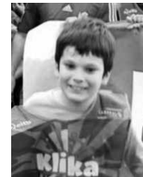
Zorionak Peru! 8 urte!! Muxu handi bat, Eire, aitatxo eta amatxoren partez!