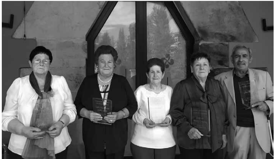
Atxega Jauregian egin zitzaizen omenaldian oroigarri bana jaso zuten.

O ndoko irudian 75 urte bete dituzten Santueneko jubilatuei udaberri honetan bertan Atxega Jauregian egin zitzaizen omenaldiko irudia. Oroigarri bana jaso zuten. Gogoan izan, Usurbilgo Gure Pakeak, Santueneko Gure Elkarreak eta Aginagako Arrate elkarreak deitutako hilero bizi eta pentsio duinen aldeko mobilizazioa, astebete barru izango dugu, maiatzaren 30ean 19:00etan Mikel Laboa plazan.