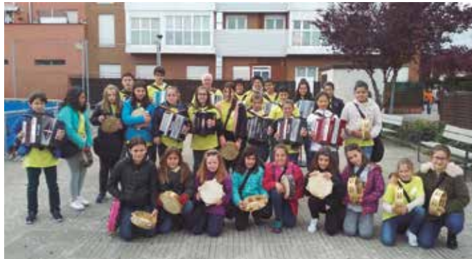
Trikitixa-pandero taldea Alegria-Dulantziko Musikaldin izan zen aurreko larunbatean.