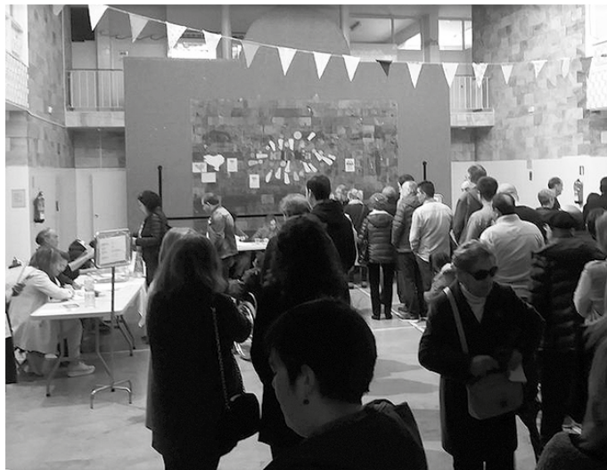
Igandean, iluntzeko 20:00etan itxiko dira hauteslekuak.