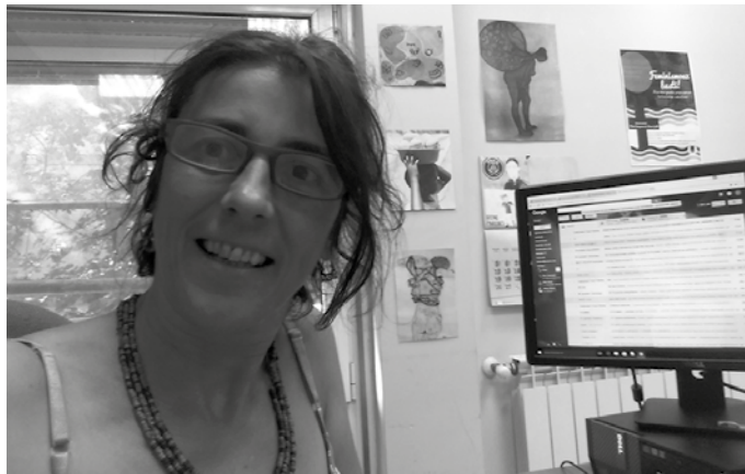
Maiatzaren 27rako eta 29rako orientazio saioak antolatu dituzte.

Egoerok kudeatzen asmatzeko, liburuak proposatuko dira. Ez liburuetan galderon erantzunak egongo direlako. Liburuak sexualitateaz hitz egiten hasteko, komunikazio bidea errazteko aitzakia edo laguntza gisa baliatuko dira.