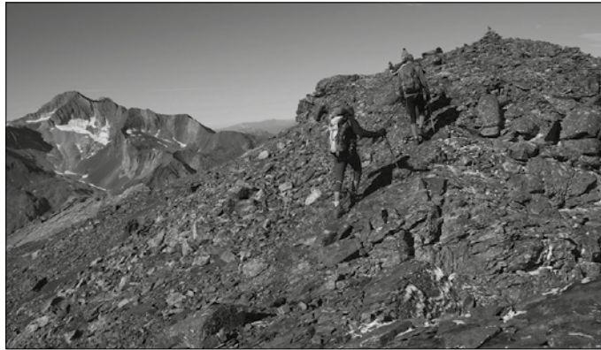
Irailean 21etik 22ra bost hiru milako egiteko asmoa dute Andatzako kideek.

nek, 45 euro FEDME gehigarria ez dutenek.