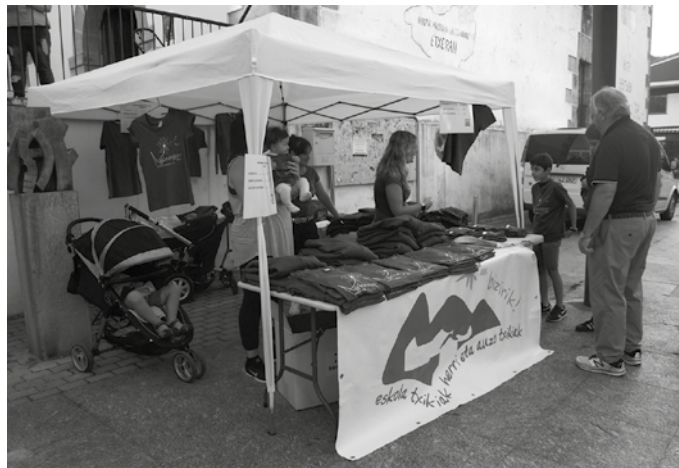
Eskolatik pasa diren ikasle, irakasle, guraso eta gainerako kideak batu nahi dituzte larunbat honetarako prestatu duten ospakizunean.

Ekainaren 9an ospatuko duten Gipuzkoako Eskola Txikien jaialdiaren atarian dira Aginagan. Jaialdi honen inguruko xehetasunak eskainiko dituzte