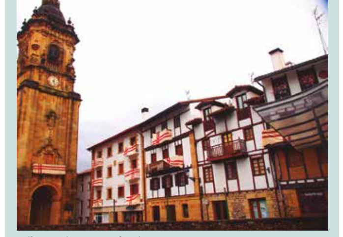
Irudi gehiago web orrialdean topatuko dituzue, noaua.eus/galeriak/ estekan.