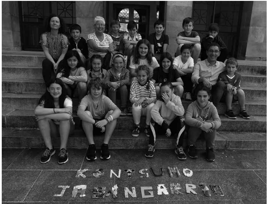
Ekainaren 4an udaletxean izan ziren Udarregi ikastolako ordezkari batzuk, aurten landutako gaiaren berri emateko: kontsumo jasangarria.

Ikasturtean zehar, ikastolako nahiz herriko diagnostikoa osatu dute. Honen guztiaren berri emateko, udaletxean izan ziren ekainaren 4an.