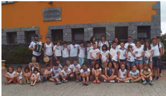
Oilasko biltzaile gaztetxoak eta gurasoak, Ibarrola Txikin.

Garai bateko biltzaile helduei lekukoa hartu diete azken hamarkada luzean. 2003. urte inguruan hasi ziren ospatzen, urtebete lehenagotik eguneko jai giroa suspertu eta familia giroko ekitaldien aldeko apustua egin zuen guraso taldearen eskutik. “Eskatzen genuen bakarra umeak beti arduradun batekin agertzea zen. Ibarrolara igotzen ginen furgoneta”, eta han abiatzen zuten gero Kalezar erdigunera alde-rako itzulia. Etxe askotan, bero