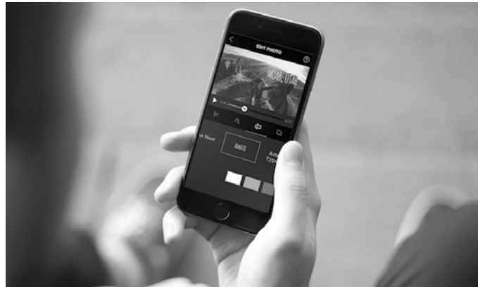
Mugikorrarekin bideoak egiteko ikastaroa eskainiko dute uztailaren hasieran. 14-18 urte arteko gazteei zuzendua dago.

ten ikasteaz gain, mugikorrarekin grabazioa egingo dute. "Jasotako irudiekin eta aplikazioen laguntzaz, bideoa editatu eta emaitza paregabea lortuko dugu".