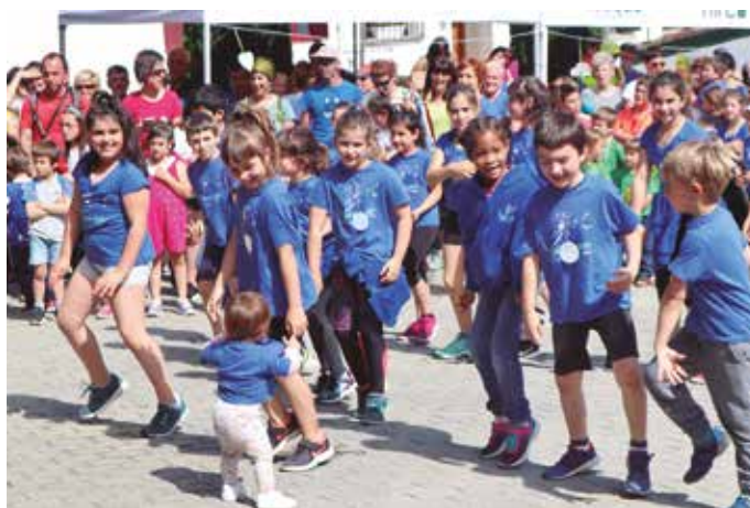
Protagonista nagusiak Aginagako Eskolako ikasleak izan ziren.