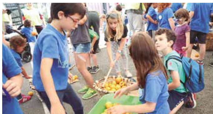
Eskola txikien jaeko argazki gehiago web orrialdean topatuko dituzue, noaua.eus/galeriak/ estekan.