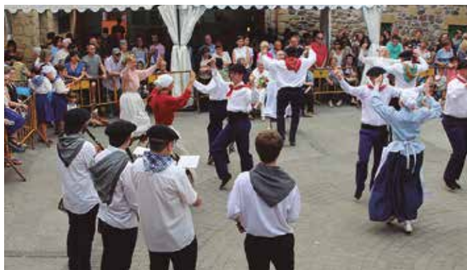
2004an berreskuratu zuten soka-dantzaren ohitura Kalezarren.