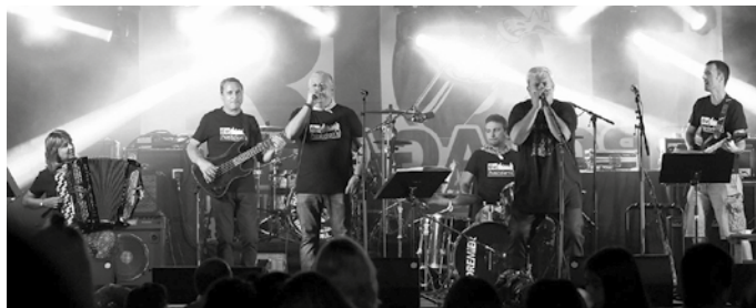
Ekainaren 21ean Anakruxa eta The Hastelen's (argazkian) arituko dira Artzabalben.

■ 19:00 Triki-pandero taldeen emanaldia Artzabalgo plazan.