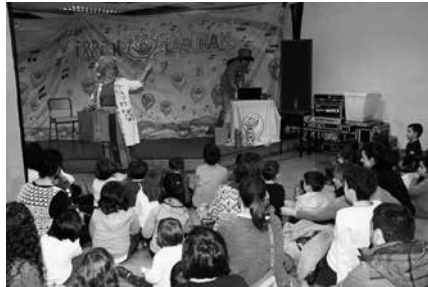
17:30ean hasiko da pailazoan emanaldia.

■ Ekainak 18 asteartea. ■ 17:30ean frontoian. ■ Sinopsia: "Herriko plazetan beti dago sorpresaren bat irriak eragiten dituen. Zer aurkituko ote dute Tiritatxok eta