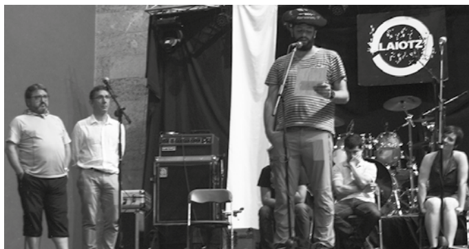
16 urtetik gorako usurbildarrei zuzendua dago txapelketa.