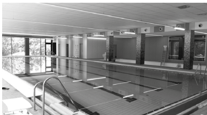
Uretako ikastaroak ere egunotan bertan hastekoak dira.

Kiroldegiak plazaratu du jada uda parterako ikastaro eskaintzaren gaineko informazioa. Izen ematea zabalik dago: