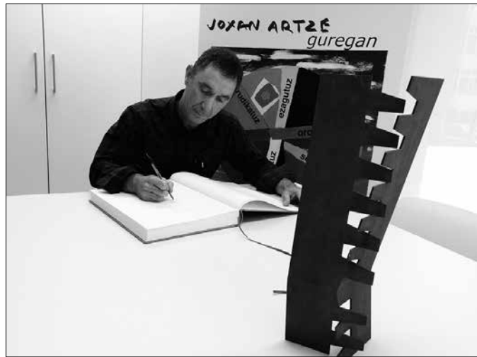
“Usurbildarrok: zorte oneko izan naiz halako herri batean aritzeagatik. Herri honek erruz eman dit”.