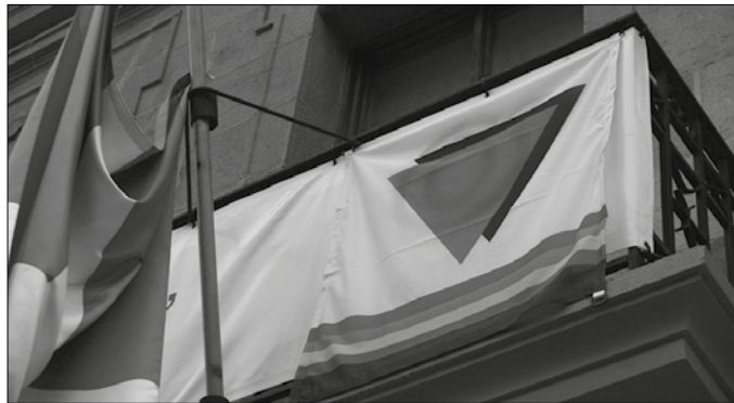
Medeak taldeak erasotua izan zen kidearen lekukotza plazaratu du eta medeak.wordpress.com atarian irakur dezakezue osorik.

Medeak taldeak ere talde ki-deetako baten jasan duen eraso larria salatu du. Aritzetako gasolindegian “arrazoi lesbofobo eta transfoboek bultzatuta, eraso fisiko larria jasan zuen gizon baten eskuetan”. Ondoren, gaineratzen dutenez, “justizia patriarkalaren prozesu biktimizatzaile bikoitza ere jasan behar izan zuen; besteak beste, bizitakoa eraso sexual edo gorroto-delitu bezala ez prozesatzearena”. Justizia feminista epaitegietan ez dutela lortuko adierazita, “askatasunaren