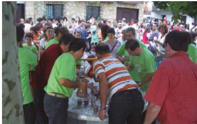
Ekainaren 21ean hasiko dira festak Kalezarren.