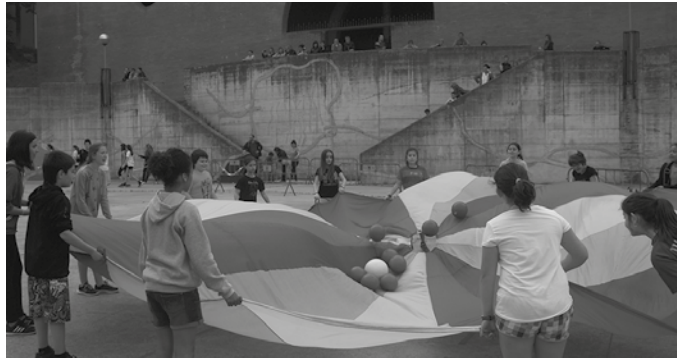
Udarregi Ikastolaren eguna larunbat honetan ospatuko da.

Emanaldira joan nahi duzuenontzako bi ohar. 11:40ean irekiko dira futbol zelaiaren aldeko ateak, ikuskizun gunera sartzeko. Sarrera-txartelak bertan emango dira. Sarrera librea izango da aforoa bete arte.