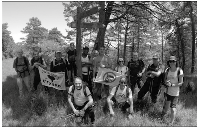
Ezkabako ihesaldiko lehen etapa osatu zuten aurreko igandean. Andatza M.M.K. taldeak antolatu zuen irteera.

Ohartarazi dutenez ordea, “sindromearen ikerketarako ere ahalik eta laguntza gehiena eman nahiko genuke”.