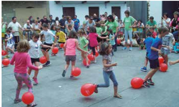
Haurren Egunak arrakasta du eta ez da kasualitatez gertatu. Bere historia propioa du.

T xikien egun handia izaten dute Kalezarko San Joane. Oso osorik haiena, familia giroko eguna izaten da, goizetik iluntzera. Aurtengoan, larunbatez (ekainak 22) ospatuko dituzte jolasak, tailerrak, txokolate gozoa edota krosa. Lehen ez zuen protagonismoa izan du Haurren Egunak azken hamarkada pasatxoan, Kalezarko jaietan. Ez da kasualitatez gertatu, bere historia propioa du.