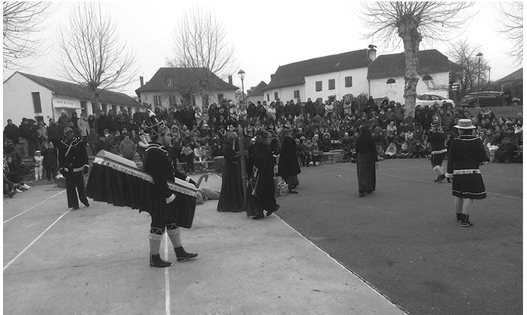
Igande honetan, eguerdiko 11:30ean abiatuko dira Potxoenetik udalera. Arratsaldera arte luzatuko da maskarada.

Xiberotar kulturak Usurbilgo kaleak bereganatuko ditu igande honetan ospatuko dugun Maskarada Egunaekin. Adi, Urdiñarbeko lagunekin izango ditugu hitzordu hauei. Kantu Taldea ere parte hartzeko da. Bezperan, Urdiñarben eta Maulen izango dira Euskal Herria Kantuz Egunean. Larunbatean 8:30ean Oiardo Kiroldigitik irtengo den autobus zerbitzua antolatu dute. Maskaradari buruz gehiago jakiteko, bisitatu Artzabalgo Iñaki Agirresaroberen argazki erakusketa.