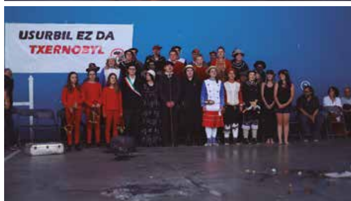
Maskaradako argazki eta bideo gehiago noaua.eus web orrialdean aurkituko dituzue, noaua.eus/galeriak/ estekan.