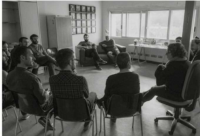
Hautatuak Kabienean urtebeteko egonaldia egiteko aukera izango du.

Horrekin batera, “Beterri-Buruntza ekinean, enpresak sortzen laguntzeko aholkula-