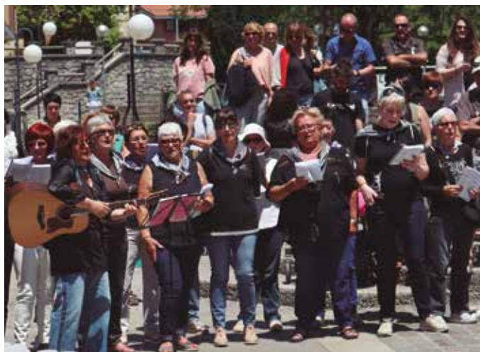
Ekainaren 29an jaietan arituko dira Kuxkuxtu txarangarekin batera.