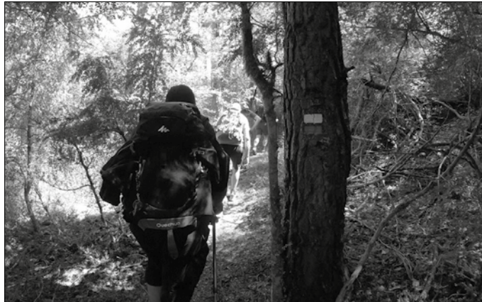
Uztailaren 6an proba motza edo proba luzea egin ahalko da.

Lasterka aritu nahi eta ezin duenak, badu elkartasuna adierazteko beste modu bat ere; dorsal solidarioa eskuratzea. Alegia, nahiz eta lasterketan ez parte hartu, aipatu sindromearen ikerketara bideratuko den diru ekarpena egin daiteke. Guztia, kronoak.com atariaren bidez.