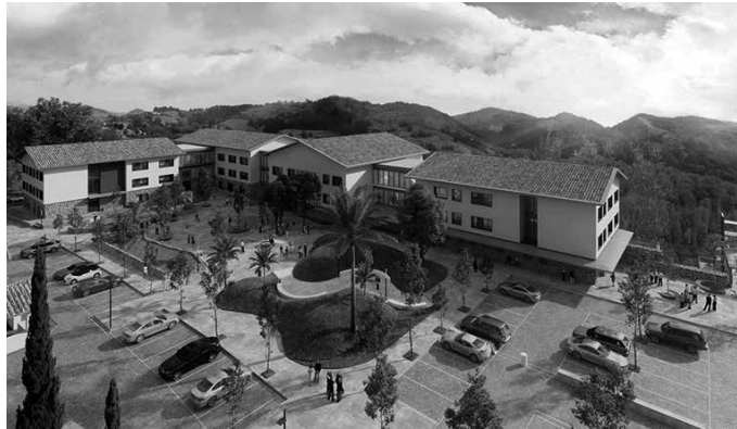
Maketa honen itxura izango du egoitza berriak. Irudia: Udala.

2021erako eraikia izatea aurreikusia dagoen egoitza berriaren gaian urrats berria eman zuen udalbatzak, maiatzaren 23ko osoko bilkuran. Hiri Antolamendurako Plan Bereziaren Aldaketa behin betiko onartu zuen. Proiektu honi lotuta, hirigintza arloko bi tresna berrien tramitazioan urrats berriak ematen segitzeko konpromisoa agertu zuen.