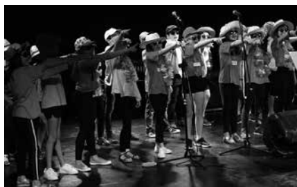
Ostiralean amaituko da kontzertu zikloa.