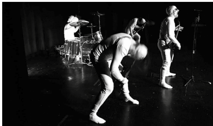
Ostiral honetan, Pelax eta Floxbin arituko dira zuzenean. Kontzertuaren ondoren Iratzar taldeak girotuko du dantzaldia.