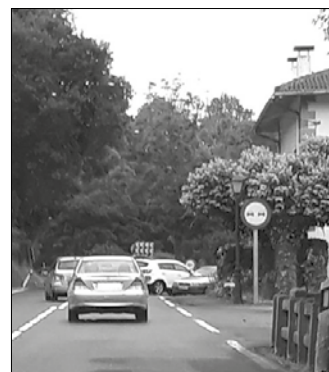
Txokoaldeko sarbidean bi autoren arteko talka izan zen ekainaren 13an.

Azken asteotan, istripu gehiago izan da udalerria zeharkatu eta puntu beltz bat baino gehiago dituen N-634 errepidean; Luzuriagan bi istripu izan dira azken asteotan. Beste bat, Txikierdi eta Troia arteko errepide zatian.