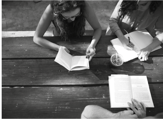
Ikastaroon %50a diruz-laguntzeko aukera eskaintzen du Udalak.

Aurkeztu beharko duen dokumentazioa: dirulaguntza eskari normalizatua, eskatzailearen NANaren fotokopia,