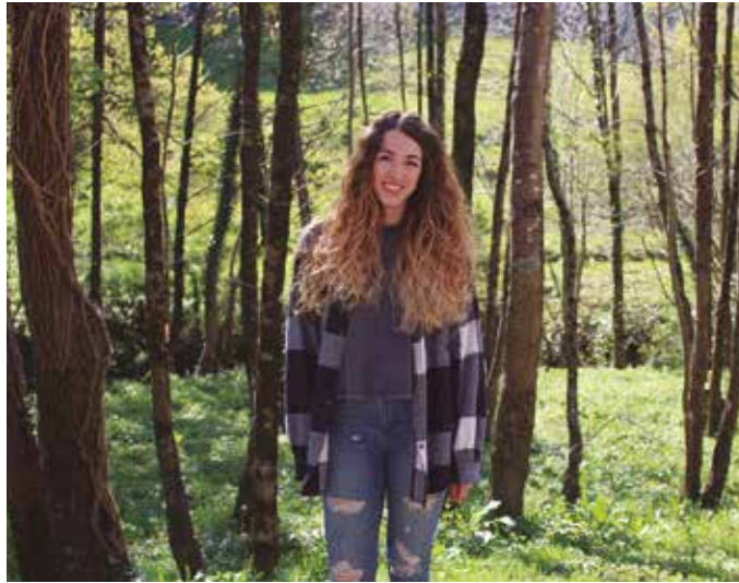
Ekainaren 30ean Usurbilgo frontoian arituko da eta uztailaren 14an Kobetamendin, Berri Txarrak-en kontzertuaren baitan antolatuta den jaialdian.

Deialdira guztira, 71 bakarlarari edo talde aurkeztu dira, tartean Natali Usurbilgo taldea. Ahotsenearen 8 talde hautatuen artean da herriko musika taldea! Natalirekin batera kontzertua eskainiko dute Berri Txarrak-en aurretik, uztailaren 14an, Kobetako