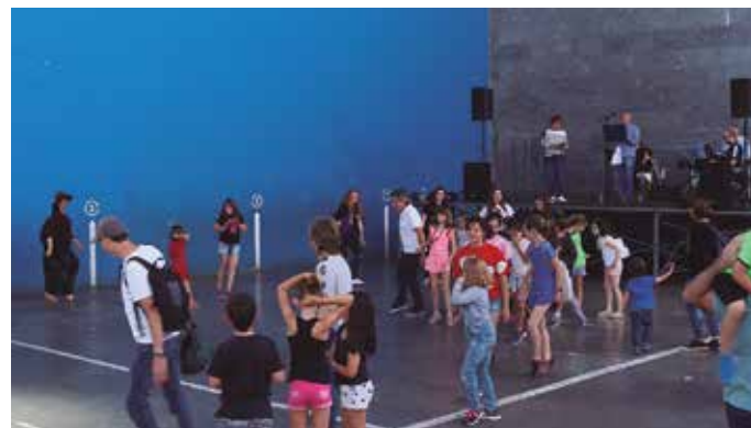
Ikastola Eguneko argazki eta bideo gehiago noaua.eus web orrialdean aurkituko dituzue, noaua.eus/galeriak/ estekan.