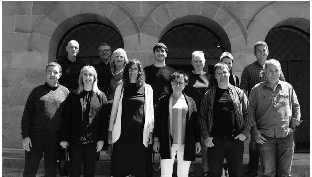
Argazkian, 2019-2023 legealdiko udal ordezkariak. EH Bilduk 8 eserleku bereganatu ditu, EAJ-PNVk 4 eta PSE-EEK 1.