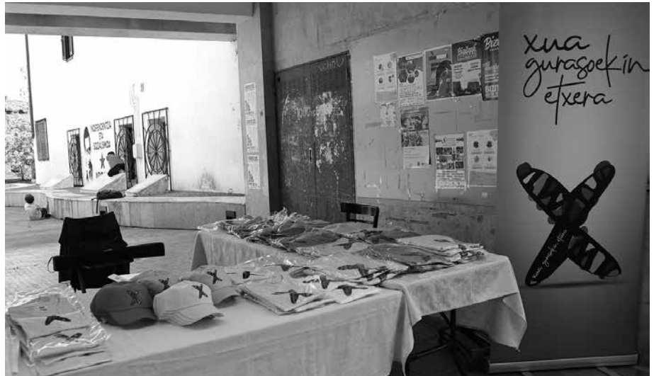
Herri ekimenaren aldeko arropa jarri zuten salgai Ikastola Egunean. Datozen asteetan ere jarriko dute salmenta postua.

Antolakuntzak ohartarazi duenez, euskal preso eta iheslarien eskubideen aldeko