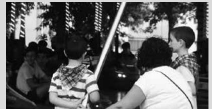
Barrakak ambulatorio ondoan topatuko dituzue.

Anbulatorio ondoko aparkalekuan ipiniko dute jaietako ferriagunea. Prezio bereziak iragarri dituzte bi egunetarako; uztailaren 1eko Umeen Egunerako eta uztailaren 3rako.