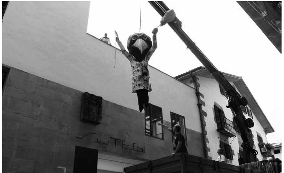
Argazkian, jaietako maskotaren zati bat. Buruhandia Sutegiko paretean eskegirik topatuko duzue.

Ondo begiratu gero, maskotak kate bat du zintzilik lepoan. Eta katearen muturrean giltza bat ageri da. “Gurasoekiko maitasun lotura eta askatasunerako giltza irudikatzen du. Azken batean Xua-ren egoera islatzen du”, Xua gurasoekin etxera herri ekimeneko kideek aditzera eman digutenez (informazio osatuagoa 9. orrialdean topatuko duzue).