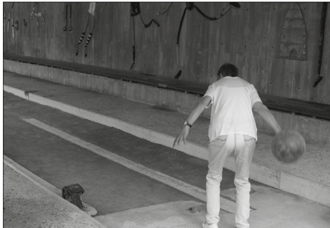
Helduen bola txapelketa ekainaren 29an egingo da eguerdiko 11:00etan, haurrena uztailaren 1ean arratseko 16:30ean, Askatasuna plazako bolatokian.

frontoian asteotan Azarrika gazte mugimenduak antolatuturiko Multikirol txapelketak. Giro ezin ederragoan aritu dira ekimenean izena eman duten gazteak eskubaloian, futbolearen eta hockeyan. Jaietara hedatu dute ekimena; multikirol festa antolatu dute ekainaren 28rako 11:00etan txosnetan. Gazte egitarauko lehen hitzordua izango da.