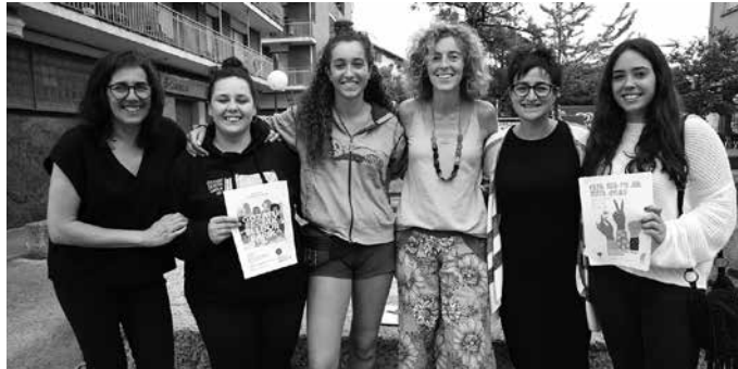
Aurreko urteetan Beldur Barik kanpainarekin bat egin zuten, aurten ordea “zerbait landuagoa nahi genuen”.

NOAUA!ri adierazi diotenez, “eraso bat zer den lantzetik hasi ginen”. Norbere ikuspegi subjektiboa agerian geratu