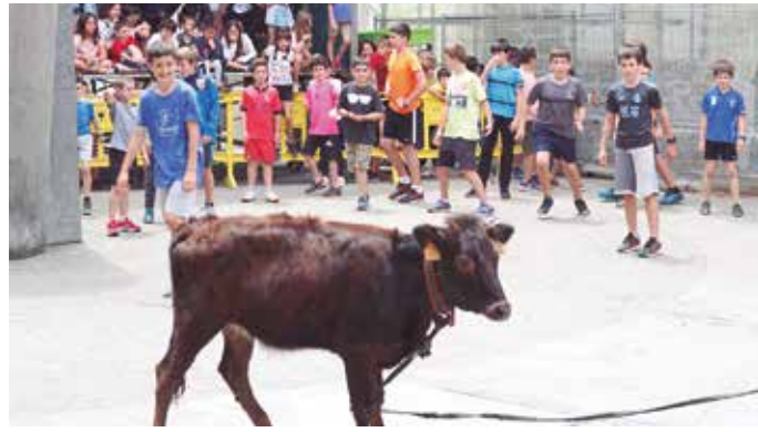
San Joan jaietako argazki gehiago noaueus atarian. Kalezartarrek eskerrak eman nahi dizkiete jaien antolatzaileei.