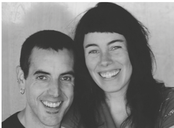
Ondoko elkarrizketa eskaini diete NOAUA! eta Orioko Karkarari.