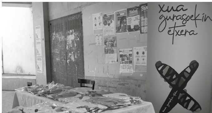
“Xua Gurasoekin etxera” plataforma aurkeztu berri da egunotan.

Horixe du espetxeak, fisikoki bakarrik giltzaperatu zaitzakeela. Buruak aske jarraitzen du; ideiek, pentsamenduek, sentimenduek eta ametsek aske jarraitzen dute. Agintariek bestelako mezua zabaltzen duten arren, espetxe sistema pertsona ezeztatzeko diseinatua dago eta preso dagoenak indarra atera behar du egunero munstroari aurre egiteko. Ez da erraza. Esan bezala, espetxe sistemak presoan otzantzea, despertsonalizatzea eta alienatzea du helburu. Eta zer esanik ez euskalduna eta preso politikoa bada. Izan ere, bera makurraraztea sari politikoa bilakatzen da. Kontatu ahalko genituzke bere lanean zorrotz, baina preso eta pertsona gisa modu humanoan tratatu gaituzten hainbat kartzelerok esandakoak, aitortuz guri sistematikoki egiten zaigunak ez duela izenik. Horretan ere, ingurunearen eta kideen