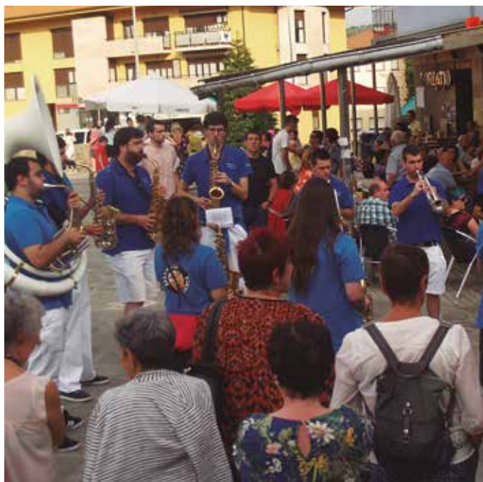
Ostiral honetan arratsaldeko 19:00etan piztuko dute txupinazoa txosnetan eta Elektrotxufla elektrotxaranga abiatuko da. Ondoren Arraiketai txarangarekin kalejira.

■ 12:00 Euskal preso eta iheslarien eskubideen aldeko kantujira