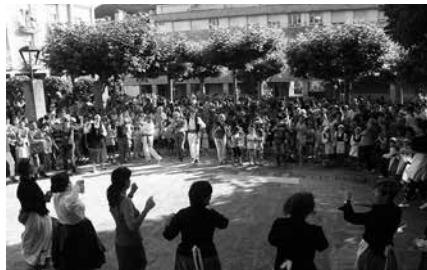
Txupinazoa eta gero lehertuko da festa udaletxeko plazan.