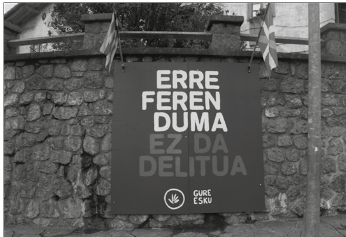
Usurbilgo Gure Eskuk, “erreferenduma ez da delitua” aldarrirpean Gaztañaga inguruan eseki duen kartela.

Adi egoteko oharra zabaldu du Usurbilgo Gure Esku mugimendua. Kaleratzeaz dute Kataluniako buruzagi independentistek lotutako epaia eta “ezinbestekoa da mobilizatea. Gure eskubide eta askatasunak ere jokoan dau-