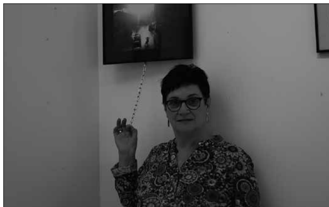
Sutegin erakusketa bisitatze ordutegia: astelehenetik ostiralera, 16:30-19:00 artean eta larunbat eta igandeetan, 11:30-12:30 artean.

Gehienak ateratzen diren bezala uzten ditut. Bakarren bati zuzenketaren bat egiten diot oker ateratzen bada edo. Kolorearen aldetik eta ez dut ezer egiten, ateratzen diren moduan argitaratzen ditut. Filtro be-