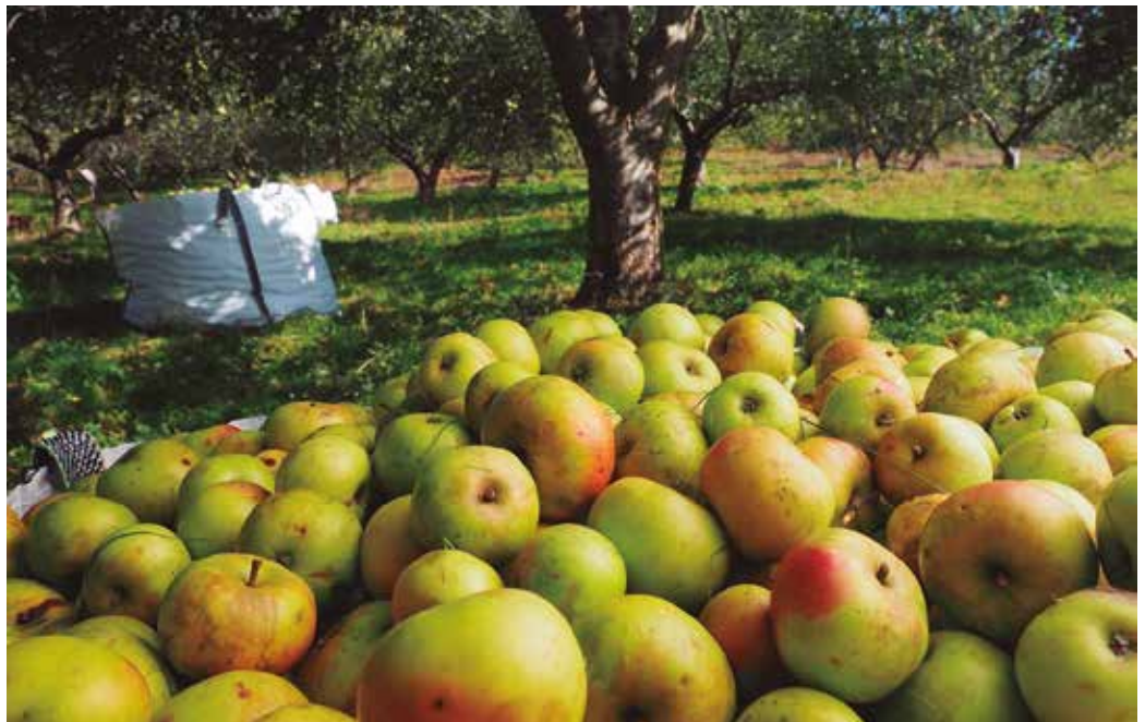
Neguko, udaberriko eta udarako giroak sagar uzta handia eragin du.