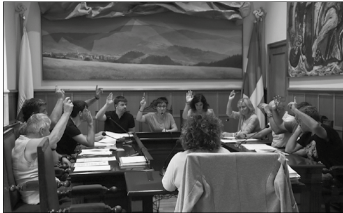
Buruntza Beterrikoa da garapen agentziarik ez duen eskualde bakarra.

Bide horretan, mugari garrantzitsutzat jo zuen aurreko legealdi amaieran, martxoko plenoan udalbatzak hartutako erabakietako bat; lankidetzaren