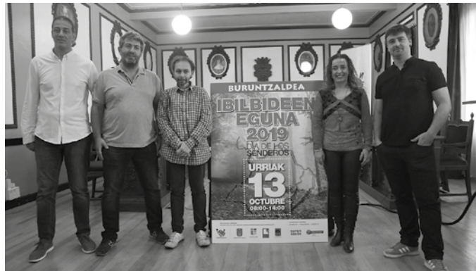
Buruntzaldeko udal ordezkariak, urriaren 13ko hitzordua aurkezteko joan den astean Andoainen egin zuten agerraldiko irudia.

■ Eguna: urriak 13, igandea. ■ Orduetgia: 08:00-14:00. ■ Tokia: Buruntzaldea (Aginaga, Usurbil, Lasarte-Oria, Urnieta eta Andoain). ■ Herri bakoitzaren koloreak: -Andoain: urdina. -Lasarte-Oria: urre zaharra. -Urnieta: berdea. -Usurbil: laranja. ■ Ibilbideak: -Andoain-Lasarte-Oria: ibilbide urdina eta urre zaharra; 7,9 kilometro; oinez egitekoa, mendiko oinetakoak beharrezkoak. Ibilbidea osatzeko bi aukera: Buruntza mendiko gailurra eginez edo mendia inguratuz. -Andoain-Urnieta: ibilbide urdina eta berdea; 4,8 kilometro; oinez edo bizikletaz egitekoa, kirol oinetakoak beharrezkoak.