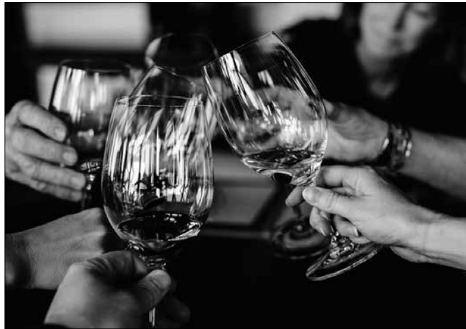
Bi asteko epean bost topaketa ezberdin antolatu dira.

Urriaren 19an ospatuko dute. Añana Gatzaga bisitatu, Ner-