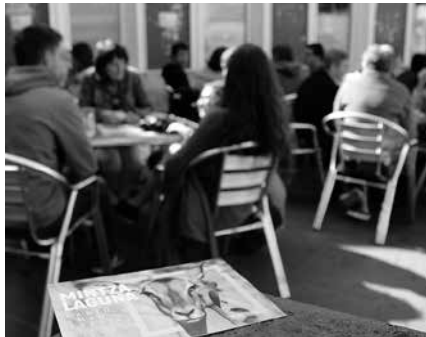
Ostiral honetan egingo da aurkezpen ekitaldia, arratsaldeko 17:30etik aurrera Etumeta AEK euskaltegian.

Bidelari eta bidelagunak behar izaten ditu ekimen honek; euskara ikasten aritu edo maila hobetzen ari direnen eta euskara baliatzen jakinik, mintzapraktikan aritu nahi dutenena.