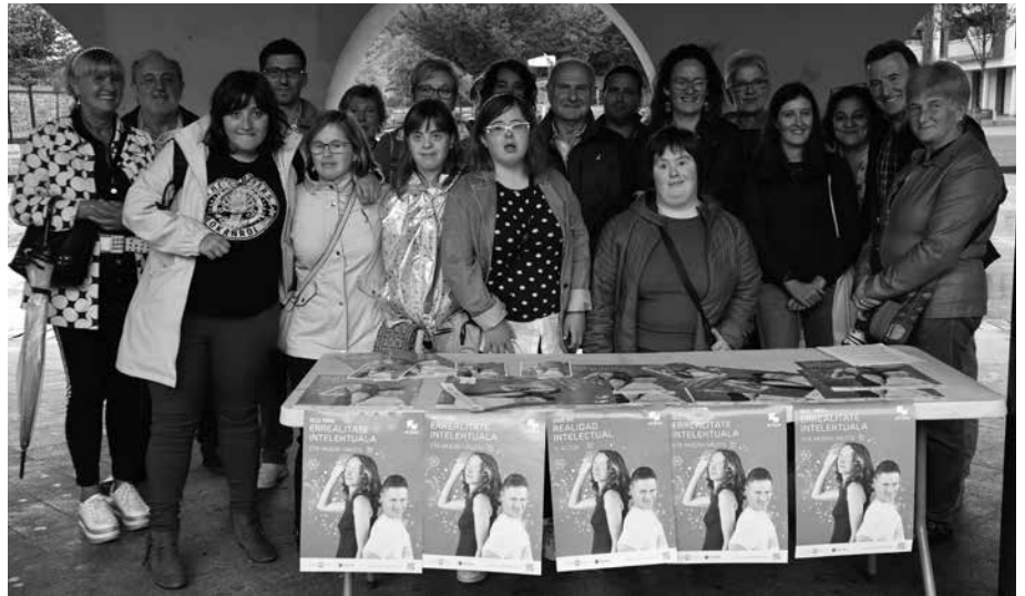
Euskarri anitzekin plazaratu du Atzegik sentsibilizazio kanpaina berria. Eskualdeko aurkezpena Lasarte-Orian egin zuten urriaren 2an. Informazio gehiago atzegi.eus atarian.

Gaiak kolektibo honen bizi-kalitatean bete betean eragiten baitu. Horregatik diote Atzegitik, kolektibo honetako kideak “ahalik eta autonomoenak izateko, berebiziko garrantzia du mundua ondo ulertzeko aukera izatea”.