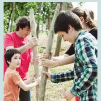
Jarduera honetan parte hartzeko erreserba egin behar da aurretik.

Telefonoz: 943 550 575 info@sagardoarenluraldea.eus www.sagardoarenluraldea.eus