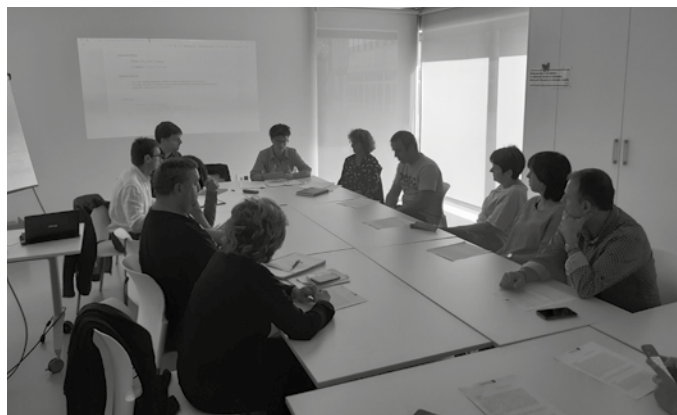
Merkataritza mahaiaren Potxoeneko bilera. Irudiaren egilea: Udala.

Hamar urteotan, “hainbat alorretan izan diren aldaketak behatu nahi dira -esaterako, kontsumo ohituren aldaketa, Internetez eta saltoki handietan kontsumitzeko joeraren gorakadagatik. Bestetik, aurrera begira herri-merkataritza eta ostalaritza biziberritzeko zein bide jorra daitezkeen aztertu nahi dute. Horrela, eskaintzaren, eskariaren eta epe ertaineko balizko garapenaren diagnostikoa egingo dute: azterketa horren emaitzen arabera, lau urterako ekintza plan bat zehaztuko da”. Faseka gauzatuko den lau hilabeteko prozesua