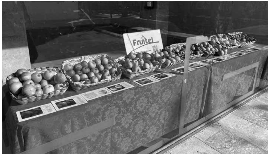
Sagar barietateen aukeraketa bat egin dute eta Sutegin ipini dute ikusgai igandera bitarte.