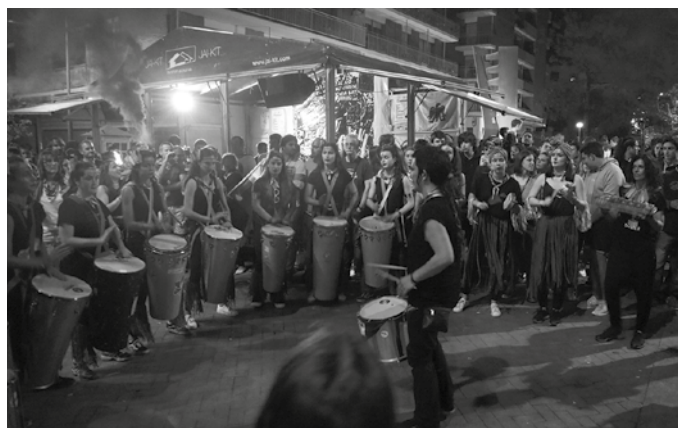
Ikastaroko saioak asteazken arratsaldean egingo dira.

Saioak asteazken hauetan, 17:00-19:00 artean izango dira Harane futbol zelaiko Kalezar 38A lokalean: azaroaren 6an eta 20an, abenduaren 4an,