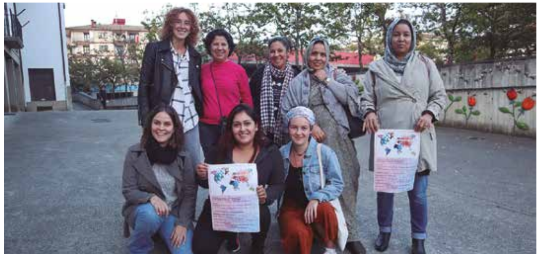
Herritar talde bat Usurbilgo Udalarekin eskuz esku antolatzen hasia da eguna.

Lehen migrazio olatua aztergai Mundualdiak usurbildarron hartuemanak estutzen lagundu, elkar ezagutzen eta elkarbizitzan sakontzeko zubi lanak egin ohi ditu. “Herriko komunitate aniztasuna erdigunean jartzea da festa horren helburua”, Udalaren esanetan. Aurreko edizioen ildotik, “munduko hainbat txokotatik etorritako herritarrek hartuko