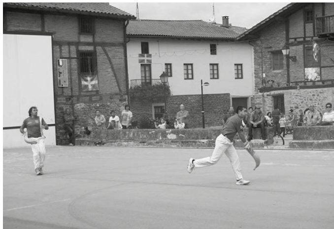
Eguraldiaren beldur, urriaren 27ra atzeratu zuten finala.

Euria tarteko aurreko iganderrako iragarria zegoen 56. Endika Abril Errebote Txapelketako finala bertan behera uztea erabaki zuen Gipuzkoako Pilota Federazioak. Igande honetara, urriaren 27ra atzeratu dute azken neurketa. Eguraldiak laguntzen badu behintzat, goizeko 11:00etan ospatuko da final handia Villabonako errebote plazan. Gogoan izan, Zubieta heldu da azken txanpa honetara. Hazparneko Noizbait taldea izango du aurrez aurre.