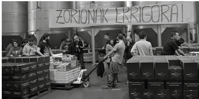
Nafarroa hegoaldean ekoiztutako produktuekin osaturiko hiru saski daude aukeran.

Orburuak, zainzuri zuriak, pikillo piperrak, ardoa, oli-ba-olio birjina estra, potxak, mahats-zukua, zainzuri-krema, teilak, melokotoia almibarrean, kardua, tomate frijitua, piper txorizero mamia.