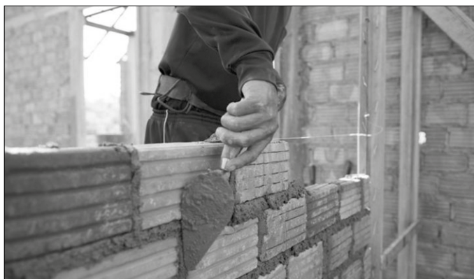
Udal bakoitzak beharren arabera zehaztuko du kontratazio kopurua.

Zereginotan hasi aurretik, pres- takuntzarako egitasmoa ere landu dute Beterri-Buruntzako udalek eta EAGI-k, Eraikuntza Eskolak. 150 orduko iraupena izango duen ikastaro hau Usurbilgo prestakuntza zentroan egino da, urriaren 28tik aben-