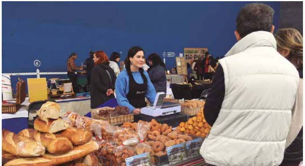
Usurbilgo Gure Pakea, Santueneko Gure Elkartea eta Aginagako Arrate adinekoen elkarteek antolatu dute sukaldaritza lehiaketa.