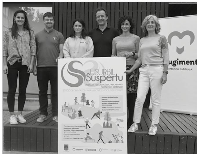
Osasun nahiz kirol munduko eragile eta erakundeekin elkarlanean aritu da Udala.

Asteazkenetan 9:00-11:00 artean Oiarde Kiroldegian eta 11:00-13:00 artean anbulato-