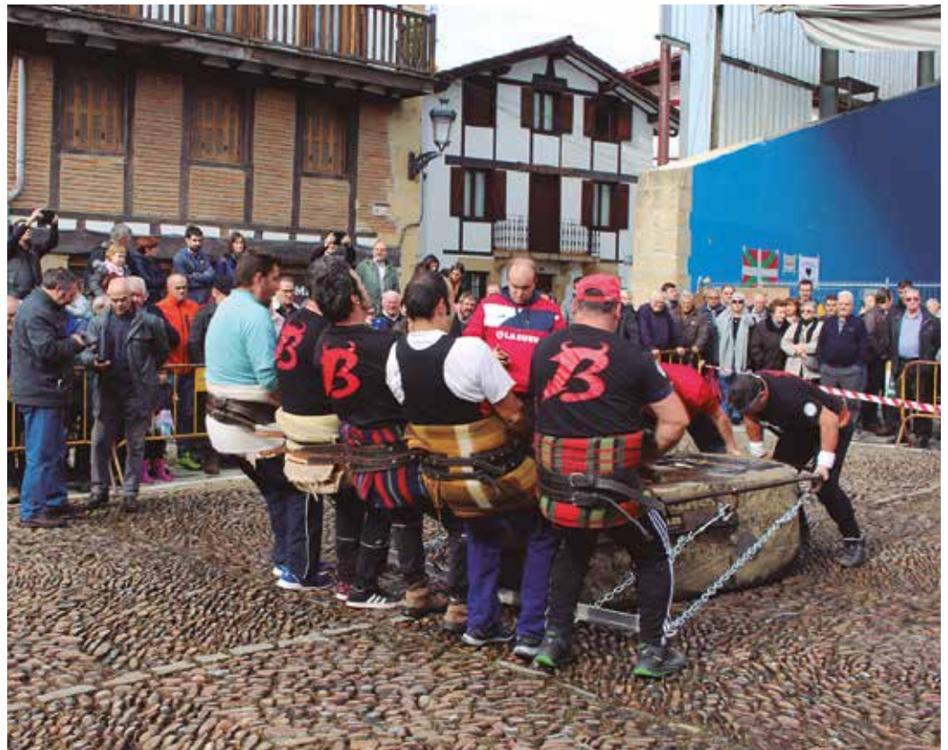
Usurbil Herri Kirolen Taldeak azaroaren 1erako antolatu duen desafiorako entrenatzen ari dira hiru talde bizkaitar. Argazkia aurreko urteko desafiokoa da.

Dema plazan dagoen 1.800 kiloko “Ur-epel” izeneko harriarekin lehiatuko dira hiru