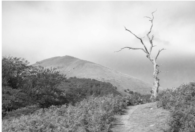
Auzaren ikuspegia, Izpegitik begiratuta.

Ibilbidean zehar egingo den otordurako bazkaria norberak