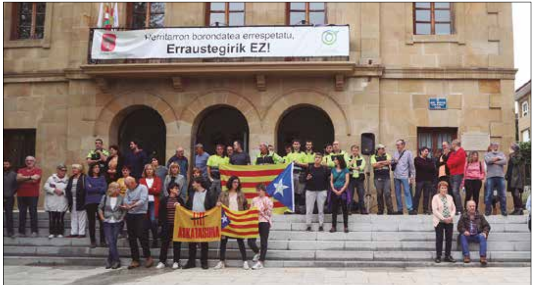
Aurreko ostiralean, elkarretaratzea egin zen udaletxe aurrean.

1-Usurbilgo Udalak ziurtatzen du demokraziaren adierazpen baketsua, indibiduala zein kolektiboa gauzatzea eta herriari hitza ematea ez dela delitua. Hori horrela, urriaren 1eko erreferenduma tresna demokratiko eta zilegizkoa izan zela, eta Kataluniak eta Euskal Herriak berezkoa dutela etorkizuna erabakitzeko eskubidea.