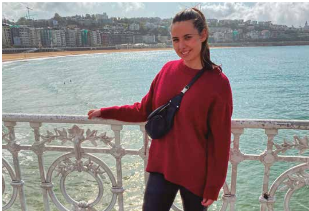
“Londresen lan asko eta baldintza onak daudela ikusita, eta azken urte honetan ederki bizi izan naizela ikusita bertan gelditzea erabaki nuen”.

Ez zait horren gogorra egin, unibertsitate ikasketak ingelesez egin nituen eta egunerokotasun horretara ohituta nengoen. Bartzelonan egon nintzen ikasten, eta jakina, kalean gazteleraz edo katalanez hitz egiten nuen. Ahal nuen moduan aritzen nintzen, orduan bi hizkuntzetako bat bera ere ez nuen ondoegi kontrolatzen eta [kar kar kar]. Alde horretatik, ingelesa ez da arazo izan niretzat. Norvegiar egin nuen graduko azken urtea, eta bertan, mundu osoko lagunak egin nituen: Maroko, Singapur... elkarrekin denok ingelesez aritzen ginen. Orduan egunero-egunero hitz egitera ohitu nintzen. Londres-