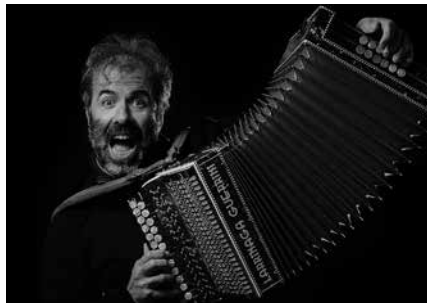
Ostiral honetan bi saio eskainiko ditu. 20:00etan lehen; 22:30ean bigarrena.

Emanaldi berezi honen baitan bi saio iragarri ditu, 20:00etan lehen kontzertua, 22:30etan bigarrena, kultur etxeko auditorioan. Sarrerak aurrez eskuratu