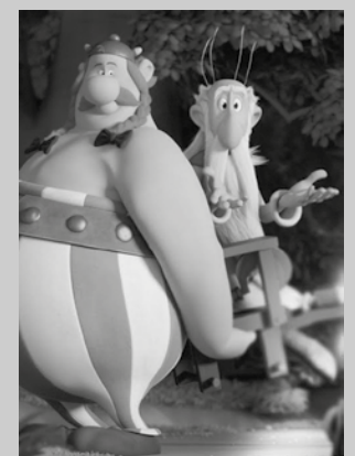
"Asterix, edabe magikoaren sekretua" filma eskainiko dute azaroaren 3an Sutegin.

Usurbilgo Udalak Ziortza Gazte Elkartearekin haur eta gaztetxoentzat antolatutako negu parteko euskarazko zine zikloa bueltan dator. Lehen proiektzioa, azaroaren 3an (igandea) 17:00etan Sutegin: "Asterix, edabe magikoaren sekretua". Sarrerak egunean bertan 3 eurotan eskuragarri. Martxora arte luzatuko da hileroko zikloa.