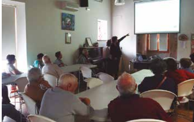
Usurbilen bezala antzeko ekimenak martxan dira Gipuzkoan barrena.

Asteazken goizero 11:00etatik aurrera adineko hainbat herritar ikusiko dituzue herrian barrena osteratxoa egiten. Usurbilgo Udalak sustatzen duen “Goazen kalera” egitasmoko parte hartzaileak dira. Adineko eta dibersitate funtzionalak dituzten herritarren bizi kalitatea hobetu eta ohitura osasuntsuak sustatzea helburu duen egitasmoak hiru urteko bidea jorratu du jada herri honetan.