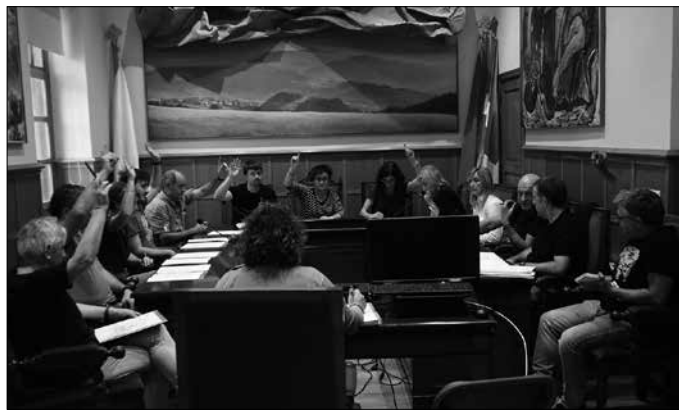
Udal langileek 18 asteko guraso-baimena izango dute, “2019ko irailaren 1erainoko atzeraeraginez”.

Erabaki honekin ama biologikoen pareko baimenak izango dituzte, ama biologikoak ez diren gurasoen baimenek. Horretarako, Udaleko langileen lan-baldintzen araudia jasotzen duen hitzarmeneko gai honi lotutako 41.1 puntua