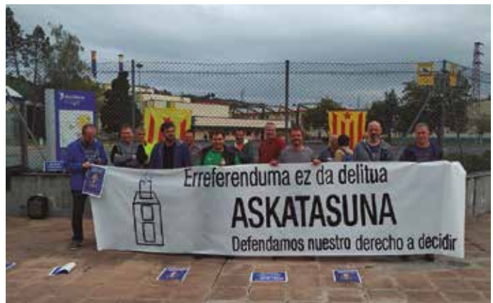
Langileak ere kalera atera ziren urriaren 18ko eguerdian. Ezkerretara, Osinalde industriagune atariko bilkura. Eskubitara, Michelin aurrean eginikoa.