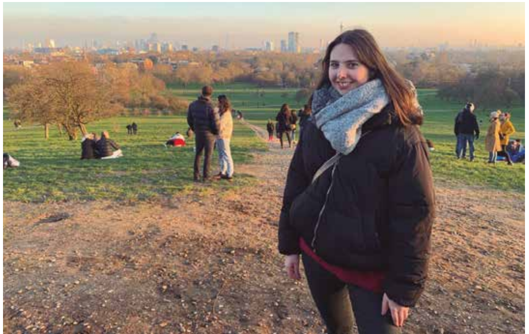
“Horrenbeste jendekin egon naiz kontaktuan azken urte hauetan... Lagunak dauzkat mundu osoan zehar”.

Kuriosoa da. Horrenbeste jendekin egon naiz kontaktuan azken urte hauetan, lagunak dauzkat mundu osoan zehar. Planak egitean lagun argenti-