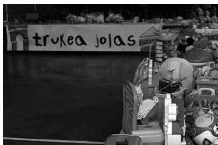
Azoka larunbat honetan egingo da. Jostailuen bilketa aldiz, ostegun eta ostiral honetan, 17:00-etatik 19:00era Sutegiko erakusketa aretoan.