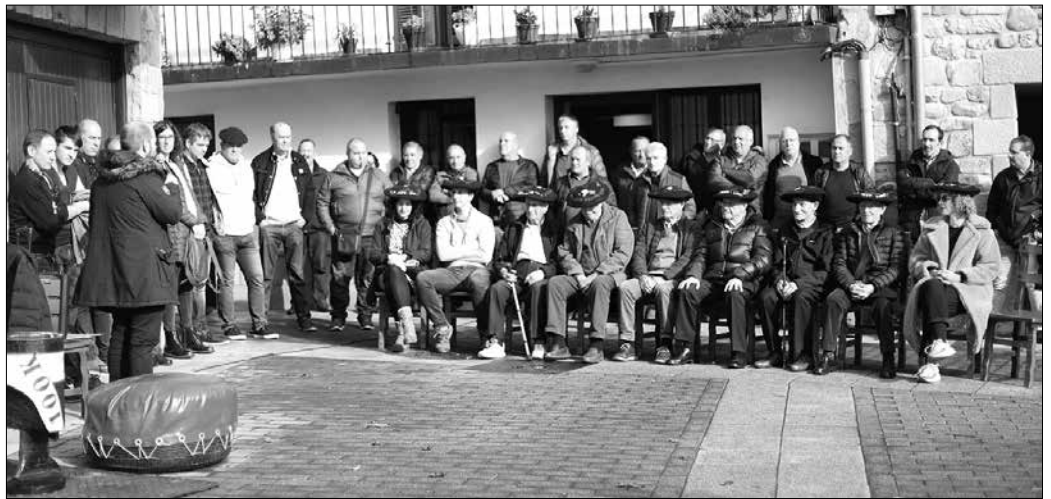
Elkartearen sorreran egon ziren lagunak omendu zituzten.