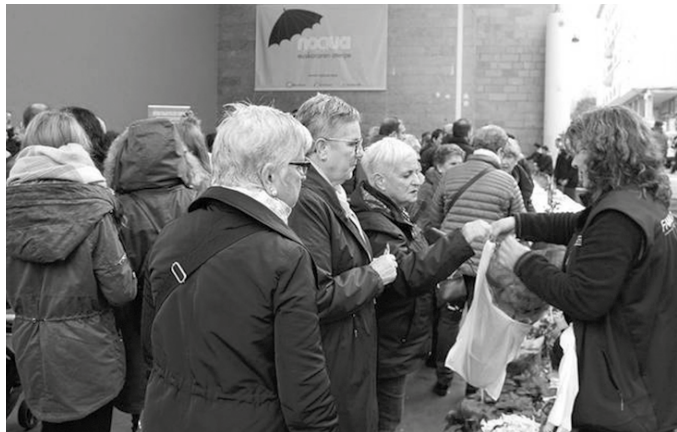
Abenduaren 15ean ospatuko da San Tomas eguna Usurbilen.

■ Goizean zehar, herriko babarruna ikusgai eta sagardoa