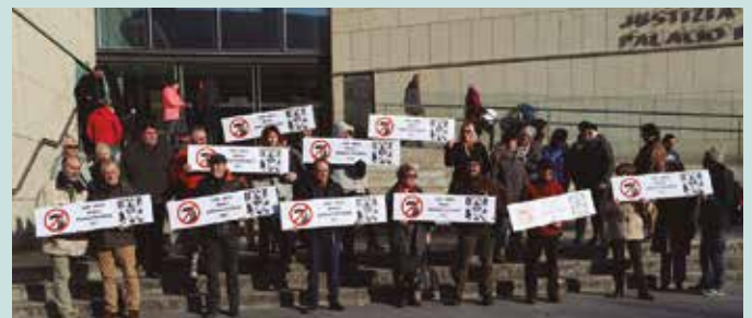
Urtarrilaren 9rako elkarretaratze berri bat deitu dute.

2018ko irailean Zubietako erraustegiaren aurka antolatu zen martxan parte hartu zuten lau lagun epaitzen hasi ziren joan den astean Donostian. Epaituak izango ziren lagunei elkartasuna adierazi eta protesta soziala kriminalizatzeko ahalegin hau salatu zuten hiriburuko epaitegi atarian. Besteak beste, “protesta egitea ez da delitua”, errausketaren