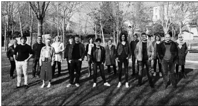
EAJ-k eginiko hiru proposamen txertatu ditu EHBilduk aurrekontuotan.

Ekarpenok txertatu arren, EAJ-k aurrekontuok zergatik