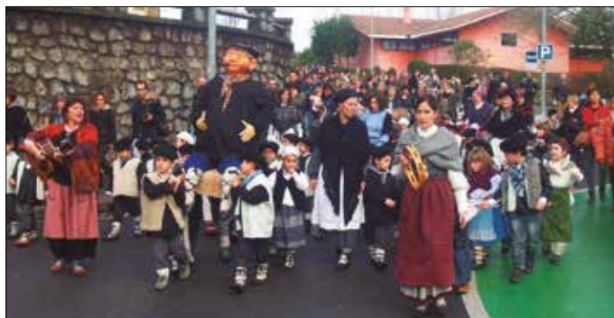
Abenduaren 20an kantari arituko dira Aginaga, Zubietako eta Usurbilgo gaztetxoak.

■ 12:00ak aldera, gabon kantak senideekin Errebote plazan.