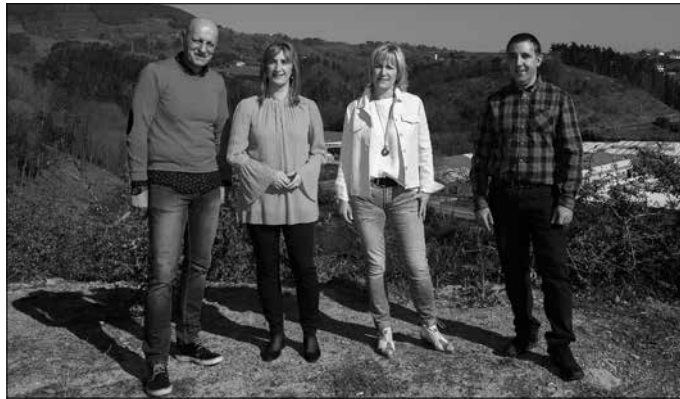
EAJ-rentzat aurreikuspenik gabeko udal aurrekontuak dira.

Diru-sarreraren %3,2ko eta gastuen %4ko igoerarekin orka bermatu gabe geratu dela zioen EAJ-k. Horrela jarraituz gero, “urtetik urtera inbertsioetarako diru gutxiago izango dugu”. Udal gobernu taldeak diru-sarrerak ordenantza fiskalak ukitu gabe jasoko dituela zioela baina “hori ez da zuzena” diote EAJ-tik. “KPIaren igoera onartua dauka eta be-