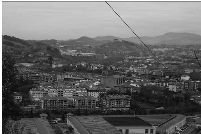
Hasieraz onarturiko udal aurrekontuok erreklamazio epean dira abenduaren 5az geroztik 15 lanegunez.

Azken proiektuon harira, aurreko legegialdiak eginiko ahalegina goraiatu zuen So-