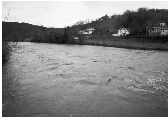
Lanok bideratzera doaz Udala eta Añarbe Uren Mankomunitatea. Bi erakundeon hitzarmena sinatzea onartu zuen udalbatzak azaroko bilkuran.

Udal artxiboko edukia xahutzen hasiera doa Usurbilgo Udala, bertan duten toki faltari (aspaldian ez dute dokumentazio berririk hartzen) eta segur-