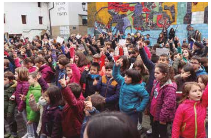
Euskararen Egunaren bueltan hainbat ekitaldi antolatu dira azken asteotan: Pirritx, Porrotx eta Marimotots pailazoaren emanaldia kiroldegian; herriko artisten "Usurbildarrak daukate" ikuskizuna Askatasuna plazan edota Udarregi ikastolako ikasleen kalejira.