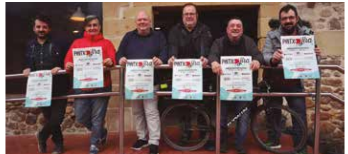
2,5 euroren truke, pintxoia eta edariaz gozatzeko aukera egongo da.

Aitzaga, Txirristra, Guria, Txiriboga, Bordatxo eta Artzabalgo langileak herritarrek abenduaren 14, 15, 28 eta 29an sei edaritegiotan barrena osatu ahalko dute Pintxojaran zerbitzatzeko prest dira. Gogoan izan, 2,5 euroren truke, pintxoia eta edaria (zurittoa, sagardoa, urteko ardoa, muztioa eta ura) dastatu ahalko duzue sei taberna hauetan. Taberna bakoitzean pintxoia eta edaria kontsumitu ahala guneotan emango den txartelean zigilua eskuratzen joango zarete. Bost zigilu eskuratuta, bost mokadutxo dastatuta alegia, seigarrena doan izango duzue!