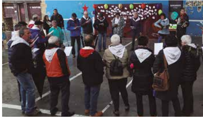
Bigarren Euskaraldia 2020ko azaroaren 20tik abenduaren 4ra egingo da.

Etorkizuna irabazteko indarrik handiena gudan dagoela gogorazita, euskara ahotan hartzeri deitzen gaituzte. “Euskararen aldeko defentsarik