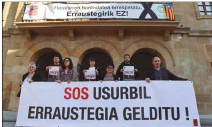
Ostiral honetarako manifestazioa deitu du udal gobernu taldeak. 19:00etan abiatuko da udaletxe ataritik.

Atzerapauso larritzat jotzen dute EHBilduko ordezkariak erraustegia probaldi fasean martxan jarri izana, Europako Legebiltzarrak klima larrialdia deklaratu zuen egun berean