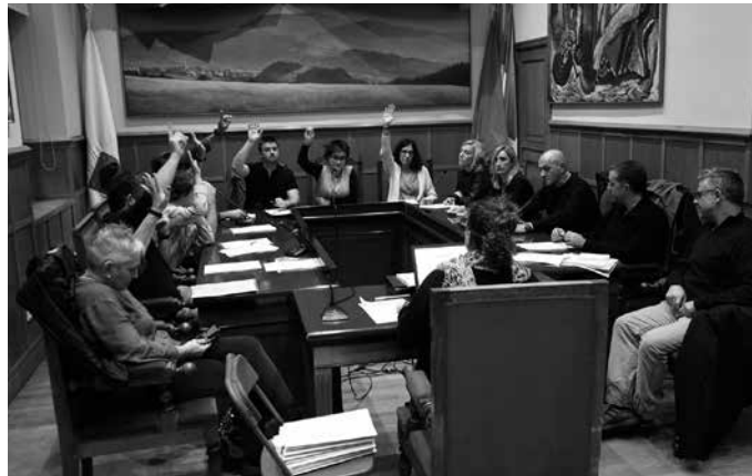
Azaroaren 28ko plenoan gai ugari landu zituzten.