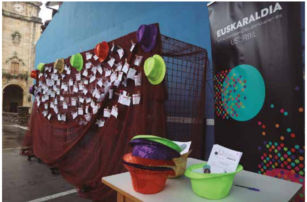
Datorren urteko Euskaraldirako desioak biltzen aritu ziren frontoian azaroaren 30ean. Horietako batzuk batu ditugu orrialde honetan.