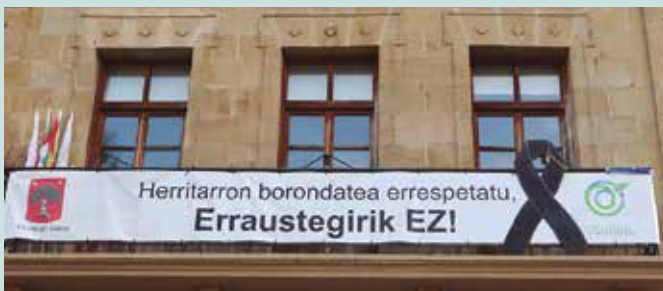
Balkoietan xingola ipintzeko deia egin du udal gobernu taldeak.

Abenduaren 13rako manifestazioa deitzearekin batera, etxean xingola beltzak zintzilikatzeko deia egin du udal gobernu taldeak soilik babestu duen adierazpenak.