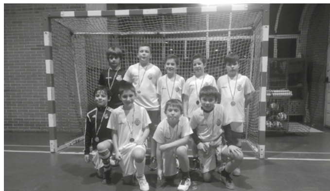
Lasarte-Oriako areto futbol txapelketan bikain aritu ziren.

Abenduaren 23tik 30era, Lasarte-Orian ospaturiko Gabonetako Areto Futbol Txapelketan parte hartu zuten Usurbil F.T.-ko benjamin jokalariek. Bigarren amaitu zuten txapelketa. Zorionak!