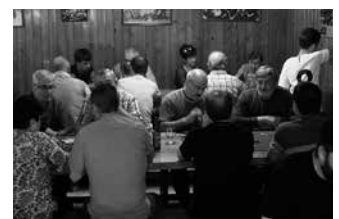
Atarialde eta Aitzaga elkarteetan jokatu dira bi partidak.