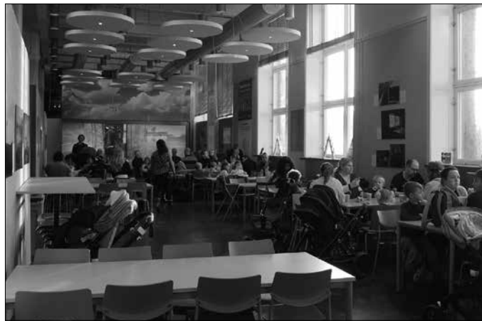
Stockholmeko museo bateko piknik gunean jendea etxetik eramandako janaria jaten, tabernara edo jatetxera joan beharrik gabe.

Erabiltzeko eta ukitzeko oparri zerrenda amaigabe horretatik haratago, ordea, aurten beste "opari" batek eman dit atentzioa, Stockholm-ko haurrek Gabonetan jasotzen dutenak: garraio publikoa doan dute Gabonetan. SL garraio konpainiak Gabonetan haur eta gaztetxoei ez die bidaiarik kobratzen, doan bidaiatu dezakete alde batetik bestera autobusez, tranbiaz, metroz eta barkuz. Ez al da opari ona? Haur eta gaztetxoentzat ez ezik, haien gurasoentzat ere