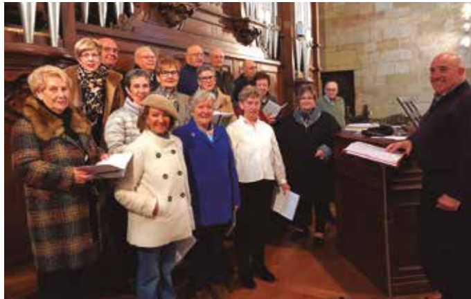
Irriuko kide izan nahi baduzu deitu 637 208 558 telefono zenbakira.