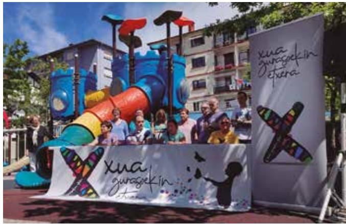
Xua gurasoekin etxera plataformak bi ekitaldi deitu ditu iganderako. Xehetasun gehiago, orrialde honen azpikaldean.