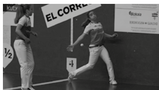
Sarrerak Bordatxon eta Arraten daude salgai.

■ Binakako Promozio Txapelketa 2020: Arteaga II-Urretabiz-