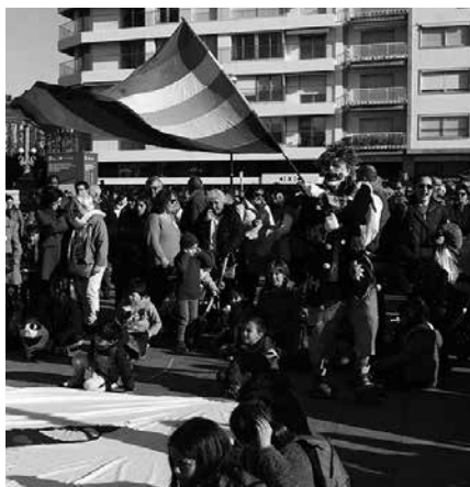
Porrotx pailazoak hartuko du parte igande honetako ekitaldian.