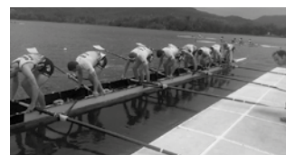
Igande honetan, goizeko 10:30ean.

Igandean (hilak 19) goizeko 10:30ean hasita, Aulki Mugikorrek Distantzia Luzeko Gipuzkoako Txapelketa jokatu du erriotan Aginagatik Oriora. Infantil eta kadeteak 4.000 metroko estropadan lehiatu dira Sarikolatik Oriora. Jubenil eta absolutu mailakoek 6.000 metroko distantziko proban parte hartuko dute, Mapiletik Oriora. Otsailaren 22an ospatuko da bestalde, Oriaren XXVI. Traineru Jaitsiera.