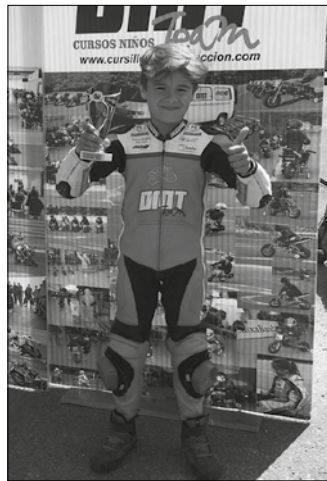
Duela urtebete eskas hasi zen DMT Moto1 eskolan motorrean gainean nola ibili ikasten.

Eskolako klaseez gain, DMT Kopan parte hasi zen iaz. “Olaberrian eta Azpeitian izan ziren iazko lasterketak eta hauetako zenbait oso lehiatuak izan ziren. Urtearen