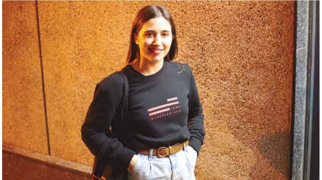
Donostiako Tabakalera du lan egiteko lekua eta erakusleihoa.

Egia esan erreferentzia askorik gabeko diseinatzailea naiz ni. Diseinatzaile askok erreferentzia mordoa izaten dituzte bildumak edo jantziak egiterako garaian, baina ni nahiko modu librean aritzen naiz. Jakina,