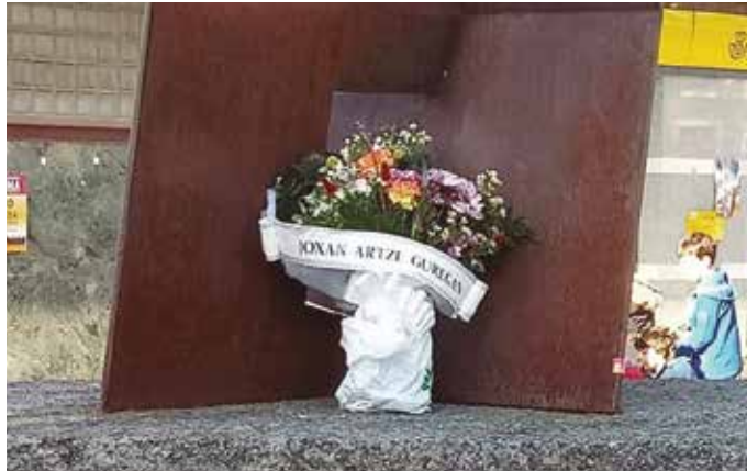
Urtarrilaren 12an egin zioten lore eskaintza, "Ikimilikiliklik" eskulturaren.

Bi urte sortzaile usurbildarra zendu zenetik eta ondoko argazkiko lore sortak dioen moduan, Joxan Artzek gudan segitzen du. Lore eskaintza hau bere heriotzaren urtemuga egunez egin zioten. Joxanek anaia Jexuxekin batera jotako errezitaldi batzuk ere entzungai izan ziren. Eguntan bestalde, Sutegi udal liburutegian Artzeren sortze lanen bilduma duzue ikusgai eta erregristo liburu bat, idatziz Joxan omendu eta oroitzeko.