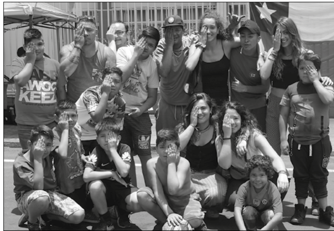
Hezitzaile gisa praktikak egitea egokitu zitzaionean, Txileko errealitate gordinarean lekuko zuzenean bilakatu zen.

Hezitzaile izateko ikasketak burutzen ari den gazteak itsasoz bestaldeko errealitatea hurbilagoatik ezagutzeko aukera izan du beka bati esker, ikaskide talde batekin batera;