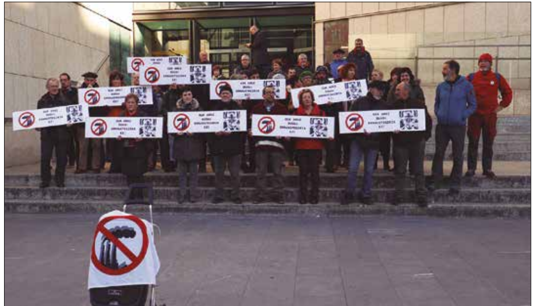
2018ko martxa batean parte hartu zuten zenbait lagunak aurkako epaiketa salatu zuten elkarretaratze bidez urtarrilaren 9an, Donostiako Egiako auzitegi atarian.

Abenduaren 4an abiatu zuten, 2018ko irailean Zubietako errausketaren zero gunera, erraustegiaren aurka antolatu zen martxan parte hartu zuten lau lagunak aurkako epaiketa. Mendi martxa hartan parte hartu zuten ia 2.000 lagunak aurka oldartu zen Ertzaintza egun hartan. Indarra baliatuz, guztionak diren mendi bidetik bota