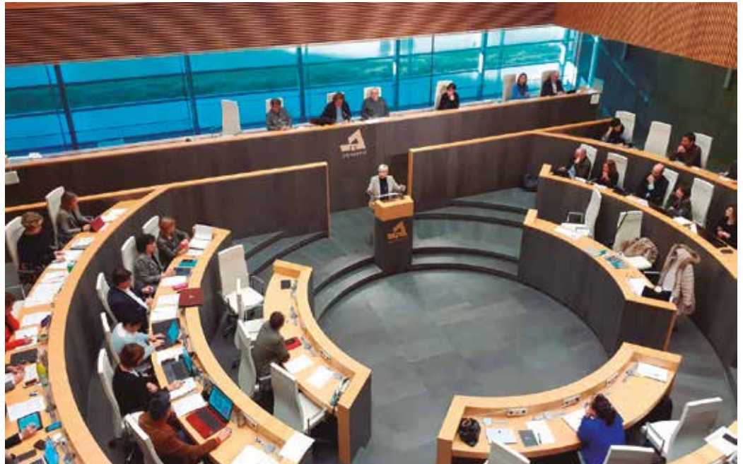
49 batzarkideetatik 48 (EHBildu, EAJ, PSE, Elkarrekin Gipuzkoa) alde agertu ziren eta 1 aurka (PP).

Gogorarazi zuenez, Xua-ren gurasoek indarrean den araudiko baldintzak betetzen dituzte “hirugarren gradua aplikatua izateko. Baldintzapeko askatasuna aplikatu beharko litzaieke”. Elkarrekin Gipuzkoak botereen banaketan eta independentzia judizialean sinesten duela azaldu