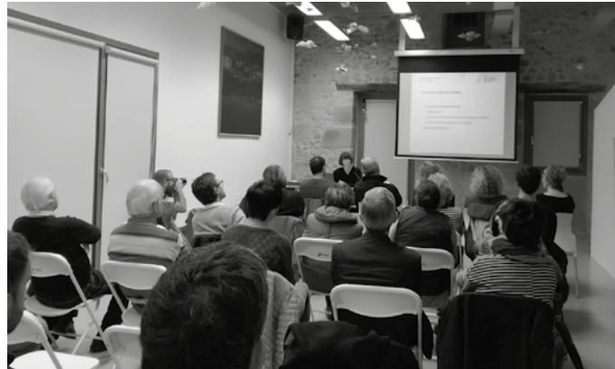
Usurbilen ere dagoeneko entitateen parte hartzea sustatzeko lanean da herritarren batzordea.