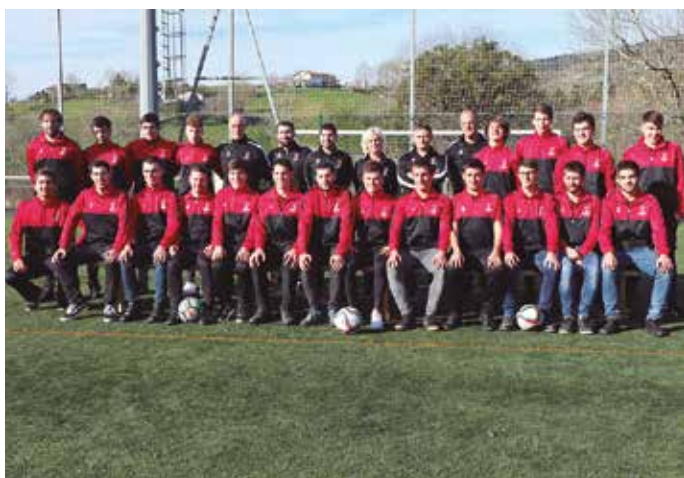
Erregional mailako taldea.