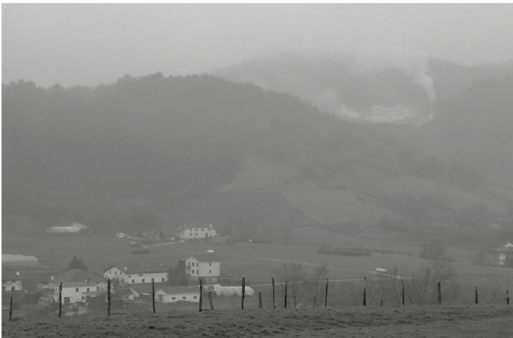
Otsailaren 17an Zubietako erraustegiak zuen itxura duzue ondoko irudiotan.

Beste behin, otsailaren 17an Zubietako erraustegiak zuen itxura duzue ondoko irudiotan.