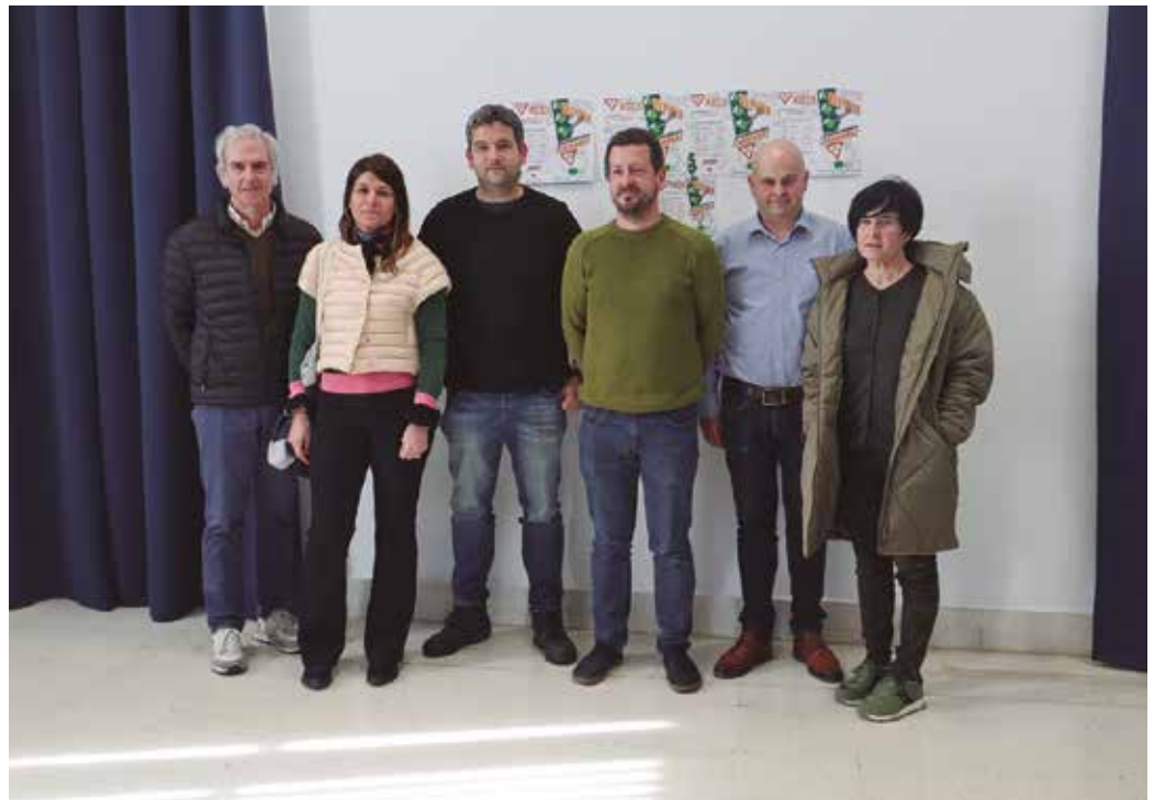
Maiatzean emango diote segida kanpaina honi. 18 urte bete dituzten eskualdeko gazteei gidabaimena euskaraz ateratzera gonbidatzeko gutun bana helaraziko diete Buruntzaldeko udalek.

Egitasmoa babesten eta sustatzen jarraitzeko konpromiso irmoa dute guztiek. Maiatzean emango diote segida kanpaina honi. 18 urte bete dituzten eskualdeko gazteei gidabaimena euskaraz ateratzera gonbidatzeko gutun bana helaraziko diete Buruntzaldeko udalek. “Esparru honetan ere, euska-