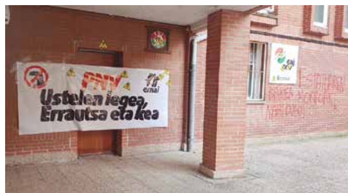
Zaldibarren gertatutakoaren aurrean, EAJ-PNVk deitoratu nahi du “eragile politiko batzuk egiten ari diren erabilpen doilor eta okerra”.

EAJ-PNVk, bide batez, deitoratu nahi du “obra-hondakinen azpian oraindik jarraitzen duten langileen senide eta lagunentzat horren mingarri eta dramatiko gertatzen den egoerarekin eragile politiko batzuk