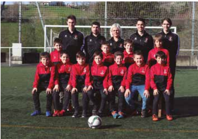
Futbol Eskola 2010.