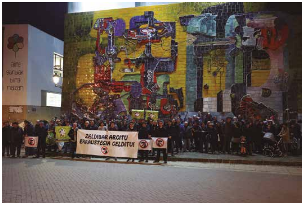
Zaldibarko luiziko kaltetuei elkartasuna adierazi zieten otsailaren 12an Mikel Laboa plazan.

“Marra gorri guztiak gaintitu dituzte”, salatu du Errauste- giaren Aurkako Mugimendak sare sozialen bidez. Kezka handiz eta haserre hartu ditu aipatu herri mugimen- duak otsailaren 14an Eusko Jaurlaritzaren Osasun Sailak kaleraturiko CSIC-en laginen emaitzak. “Eibar, Ermua, Zal- dibar eta ingurueta dioxina eta furano mailak onartutakoa baino 40-50 aldiz handiagoak direla azaldu du Jaurlaritzak”, Erraustegiaren Aurkako Mugi- menduaren esanetan. Baina ez da aski. “Jaurlaritzari exijitzen diogu egin dituen ikerketen emaitza osoak eta datu guztiak gardentasunez publiko egitera