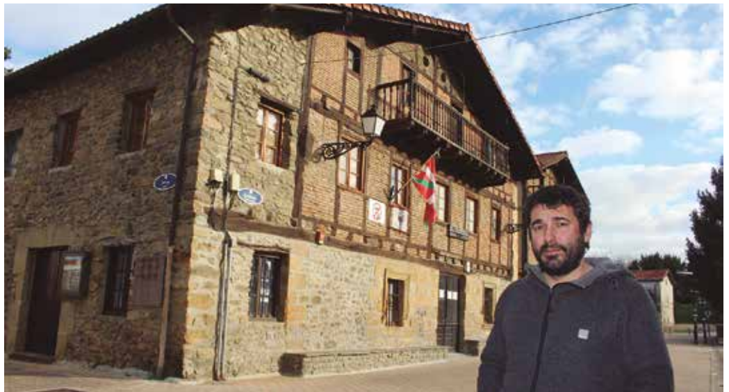
Otsailaren 25erako bilera deitu du Zubietako Herri Batzarra. “Zubietarrek dituzten beharrak eguneratu, zerrendatu eta adostu” nahi dituzte. Hori izango da 18:30etatik aurrera Kaxkapen egingo duten bileraren helburuetako bat.

Bilera batzuk egin genituen aurreko batzarkideekin eta asko lagundu digute, baina egunerokotasunean bakarrik gaude. Usurbil eta Donostiako Udalekin harremantzeko garaian ere berdina gabilza, ikasten.