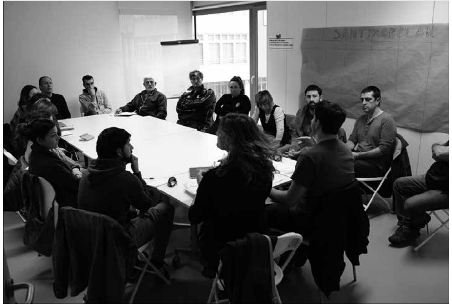
Hurrengo bilera irekia, martxoaren 4an arratsaldeko 18:00etan Potxoenean.

Festa egunen kopurua eta epea finkatzearekin batera, lehen proposamen zehatzak ere jasotzen hasi zen Jai Batzordea. Horiek definitu eta egitaraua osatzen segiko dute hurrengo hilabeteotan: noiz zer ospatu, aurrekontuak zehaztea, festa parekideen inguruko lanketa... Usurbilgo jaiak prestatzen segitzeko Jai Batzordearen hurrengo bilera irekia norbanako nahiz eragileentzat, martxoaren 4rako finkatu dute arratsaldeko 18:00etan Potxoenean.