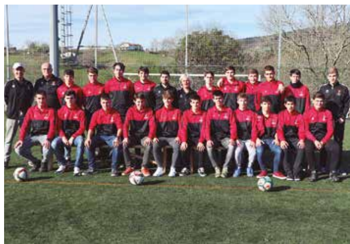
Jubenil mailako taldea.