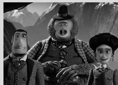
“Mr Link: jatorri galdua” izeneko filma eskainiko dute martxoaren 1ean.

Usurbilgo Udalak Ziortza Gazte Elkar-tearekin batera negu parterako antolatuturiko euskarazko zine zikloaren azken proiektzioa iragarri dute martxoaren lehenerako; “Mr Link: jatorri galdua” izeneko filma, ohi bezala, 17:00etan Sutegin. Sarrerak egunean bertan 3 eurotan eskuratu ahalko dira.