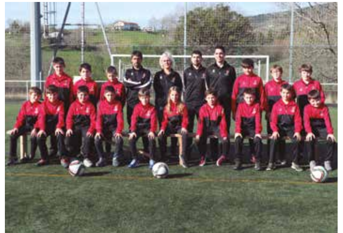
Futbol Eskola 2009.