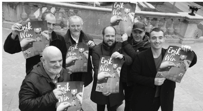
Musikari eta bertsolarien arteko fusiotik sortutako ikuskizun berria estreinatu berri dute: “Erik eta Win”.