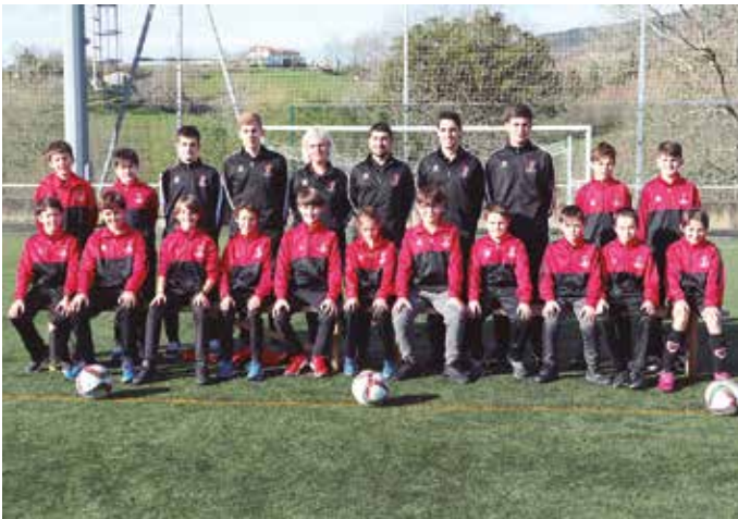
Futbol Eskola 2008.