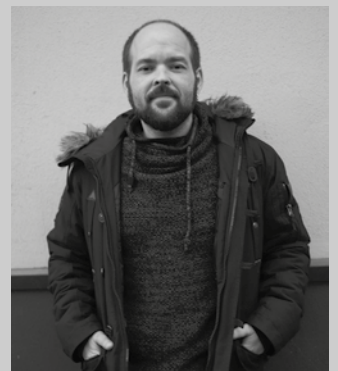
“Bertsolaritza zabaldu egin da beste diziplina batzuetara”.

dela esan daiteke, baliabide asko biltzen dituen: bertsoa, musika, poesia... Bertsolaritza zabaldu egin da beste diziplina batzuetara ere. Modu naturalean gertatzen diren panoramak dira. Diziplina ugaritako jendea ezagutu eta nahi gabe ere nahastu egiten dira guztiak. Probak egin eta jolastuz sortzen diren esperimentu txiki horiek handi egiten dira askotan.