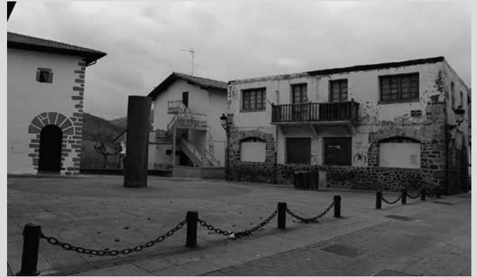
Udal ekipamendu gabeziaren hutsunea beteko du Pelaiouenea berrituak. Bilera otsailaren 26an egingo dute, 19:00etatik aurrera Haur Eskolan.

Usurbilgo udal gobernu taldea kalezartarrekin bilduko da otsailaren 26an, iluntzeko 19:00etan Haur Eskolan deitu duen hitzorduan. Gogoan izan, Kalezar erdiguneko Pelaiouenea eraikina birgaitzen ari da Udala. Bi egitasmoren bilgunea izango da: Emakumearen Etxearena eta kalezar-