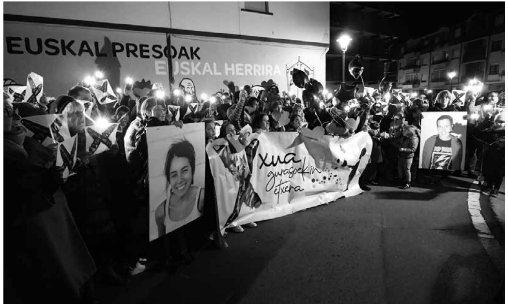
Bidaian Olatz eta Patxi bereziak izan ondoren, Aranjuezen ere berezita segitzen dute.

Astebeteko bidaiaren ostean, aipatu bilgunetik NOAUA!ri aditzera eman diotenez, otsai-