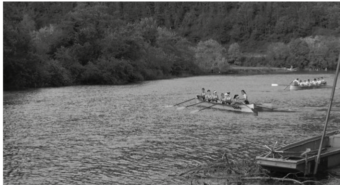
"Mila arraunlaritik gora" espero dituzte larunbat arratsalde honetan bertan, Oriako uretan.