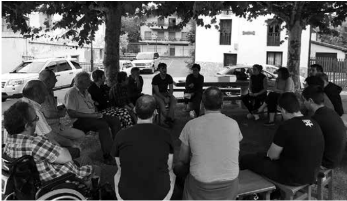
Udalak deitu du bilera. Otsailaren 26an iluntzeko 19:30ean elkartuko dira eta Akerra proiektu berria aurkeztuko dute bertan.

Txokoaldeko bizitza hobetu, auzotarren beharrak identifikatu eta auzoaren etorkizuna diseinatzeko aritu dira bizilagunak eta Udala, Hiritik At Kooperatibak bideratuta udazkenean zehar Akerran egin duten parte hartze prozesuaren bidez. Gaztetxea izandakoa etorkizunean txokoaldetarren bilgunea izatea proposatzen da. Prozesu hartan