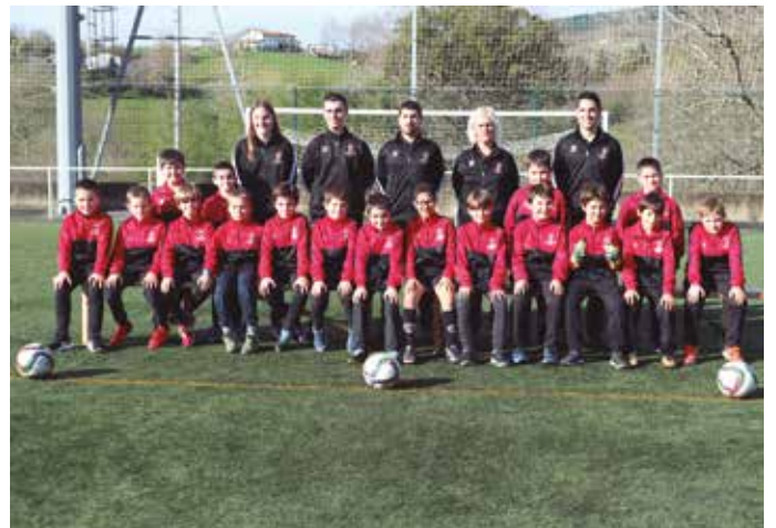
Futbol Eskola 2011.