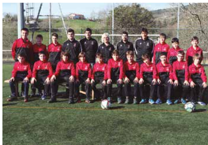
Infantilak, mutilak A.