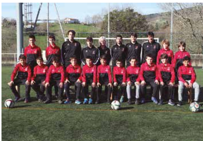
Infantilak, mutilak B.