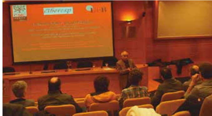
CSICek Zubietako erraustegiaren inguruko azterlana egin zuen 2018an. Ingurumen Baimen Bateratuak ez zuela osasuna bermatzen ondorioztatu zuen.

Eusko Jaurlaritzaren Osasun Sailak zenbait “prebentzio neurri” hartzea aholkatu zien herritarrei: etxeko leihoak itxi