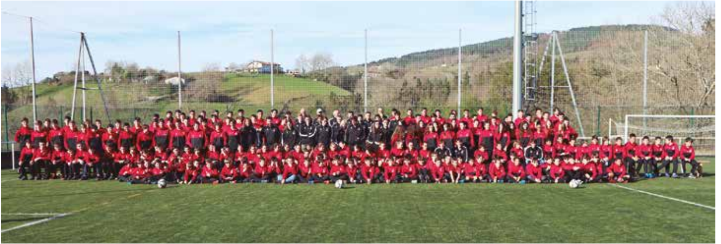
Argazkian Usurbil FTren jokalarik, entrenatzaile eta zuzendaritzako kideak, denak elkarrekin.