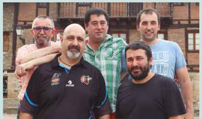
Iazko udaberrian hautatuak izan ziren kide guztiak lehen aldiz ari dira Zubietako Herri Batzarrean lanean.

Bilera partehartzailea izangoenez, hurbilduko direnek pentsa dezatela Zubietaren etorkizunerako zer nahi duten. Guk gure asmoak zeintzuk diren aipatuko ditugu. Dena den, zubietarren proposamenak entzun nahi ditugu. Legealdiko erronka nagusiak denon artean zerrendatu nahi ditugu. Behin hori eginda, 2020rako premiak eta lehentasunak zehaztuko ditugu.