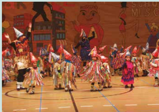
Ostiral honetan, goiz partean hasiko dira kalejirak eta ikuskizunak Udarregi ikastolan.

-Udarregi Ikastola, Atxegalde, Usurbilgo Udala, Kale Nagusia, Errekatziki kalea, Puntapax kalea, Bordatxoko biribilgunea eta Oiardo Kiroldegia.