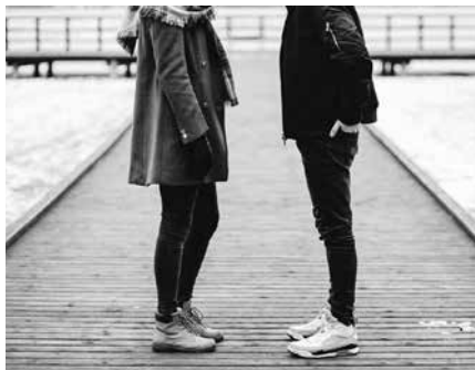
Ostiral honetan, gaueko 22:00etatik aurrera Potxoenean.

Iaz bezala, aurtengo saioa ere tratu onak sustatu, eta parekidetasuna eta sexologia alorrak lantzen dituen Arremantitz Kooperatibak eskainiko du. Izena aurrez eman beharra zegoen, Kafe Tertuliaren Instagrameko kontura idatzita.