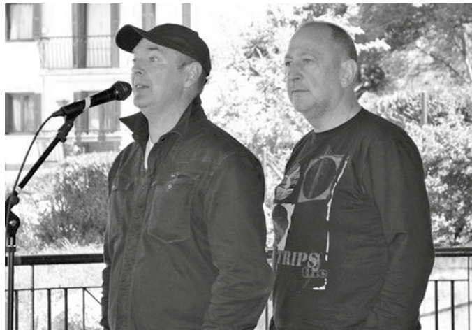
Bertso-afaritarako txartelak salgai dituzue jada 30 eurotan Aginaga Sagardotegian bertan edota Arraten.