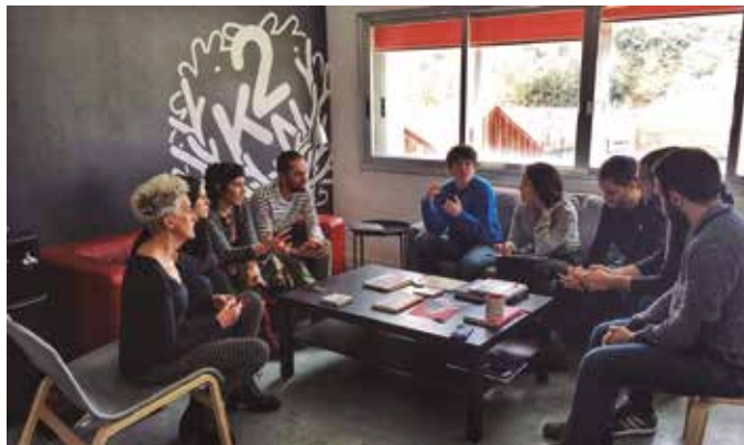
“Telelana aukera bat izan daiteke. Agian ezinbestekoa egungo larrialdi egoeran, baina badu bere alde iluna ere”.

Telelana bolo-bolo dabil egunotan, “eta badirudi etxetik lan egitea zoragarria dela, arazo guztien konponbidea”. Kabieneko kideek ordea bestelako irudipena dute: “gutako asko urte luzez aritu gara etxetik lanean, eta jakin badakigu