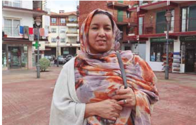
Semeak Usurbilgo ikastolan matrikulatu zituen. “Euskaldun euskaldunak dira. Etxean haien artean euskaraz hitz egiten dute. Arabieraz baino hobeto moldatzen dira”.