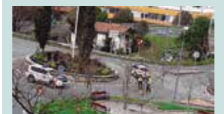
Ertzaintzaren kontrola. Aurreko astean, San Inazio errotondan.

Ahal den heinean gidariak bakarrik joatea aholkatzen da, bigarren pertsona batekin joanez gero, bigarrenak atzeko eserlekuan eskuin aldean eseri beharko du.