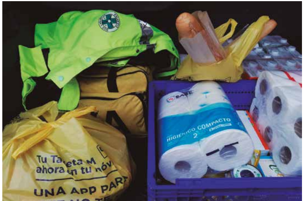
“Erosketak egin eta etxera eramateko, botikak helarazteko, egunkaria eramateko, berriketaldi bat izateko telefonoz bakardadean daudenekin, informazioa emateko, zalantzak argitzeko... Edozertarako”, baliatu daiteke DYaren sarea.