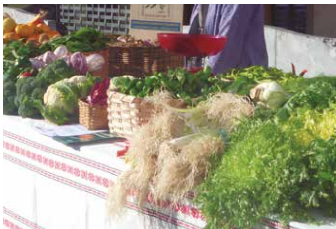
Ekoizleak eta erosleak bildu nahi ditu proiektu berriak.

Indarrean den konfinamendu egoerak, tokiko produktuak salerostea nabarmen zaildu du. Krisialdi honi erantzuteko hainbat eragile eta baserriar bildu eta baserrikoplaza.eus ataria sortu dute; “egoera honek tokiko baserriar eta ekoizleek elikagaiak saltzeko