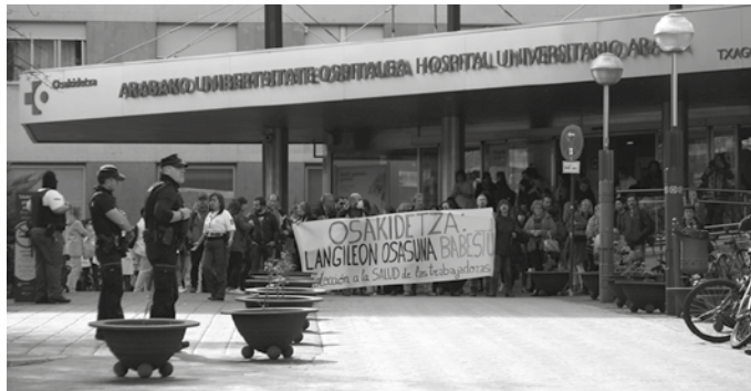
Osasun arloko langileek agerraldia egin zuten martxoaren 10ean Txagorritxuko ospitalean, langileentzat babes neurri gehiago eskatzeko.

Eguneroko elkartasun keinu hauekin oso eskertuta dago usurbildar erizain hau: “estimaten da pila bat jendeak hain ondo baloratzea. Ez nuke hau egun batzuetako kontua izatea, isolamendua-ren hasierako egunetan gaudelako oraindik. Eta euforiko gaudelako”. Gero animoak berherantz egingo duten beldur