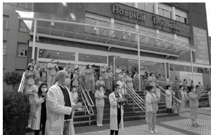
Osakidetza erizain bat COVID-19 gaitzak jota hil zen. Bere lankideak kalera atera ziren biharamunean.

Ospitaleko larrialdietara jaitsi eta ez da ezer entzuten. Jendeak ordurako bazekien etxean geratu behar zuela, ospitalera ahal den gutxien joateko deia zabaldu zelako.