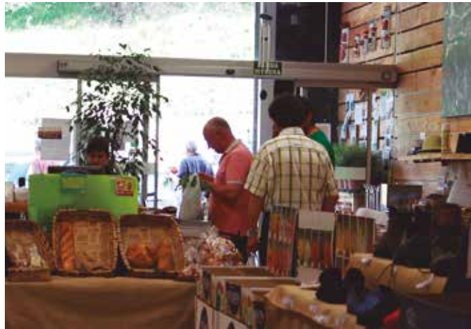
Azken egunetako salmentetan agortutako produktu gehienak “biltegiratu ditugu berriro, gure hornitzaileekin elkarlanean”.

Bezeroei eskerrak eman nahi dizkiete: “egunotan gurekin izan duzuen adeitasunagatik eta kutsadura saihesteko neu-