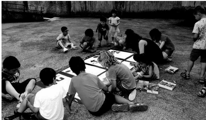
Egitasmoak hiru ardatz ditu: udala, hezkuntza arloa eta herrigintza.

Hiru ardatzetan oinarritzen da egitasmoa; udalean, hezkuntzan eta herrigintzan. Xedeok bete nahi dira. "Jolasa eta sormena ikasteko eta garatzeko berariazko tresnatzat dituen haurren kultura aitortzea; hori oinarri hartuta, haurrei benetan parte hartzeko eta erabakitzeko ahalmena ematea; eurek eraikitako aisia hezitzaile eta euskaldunaren