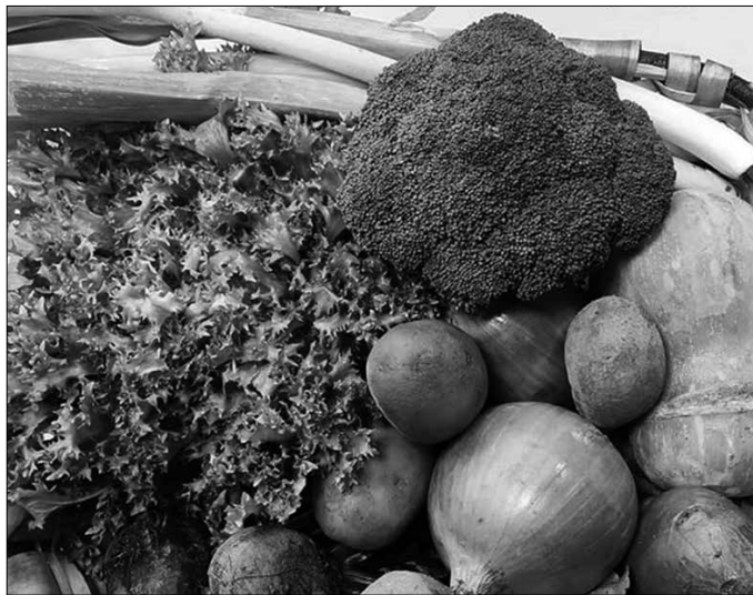
“Konfinamenduari aurre egiteko oso ondo dago etxean kirola egitea, baina gai horretaz ez naizenez aditua (ezta aritua ere, izan gaitezen zintzoak), utzidazue gutxienez elikadura gomendio batzuk ematen”.

■ ARRAINA. Omega-3 eta koipe osasungarriak ditu. Bere azidoetako batzuk ge-