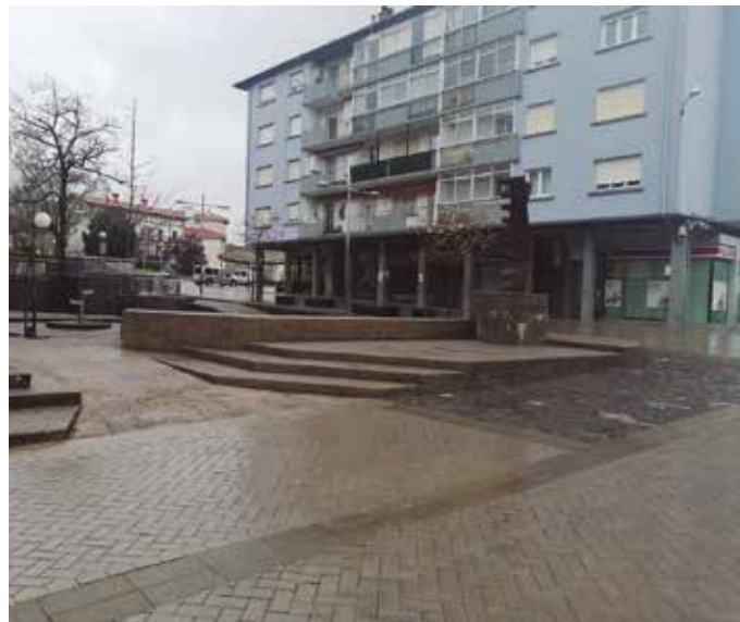
Nahi ez dugun bizitarik gabeko herriaren adierazle argia da ondoko argazkia.