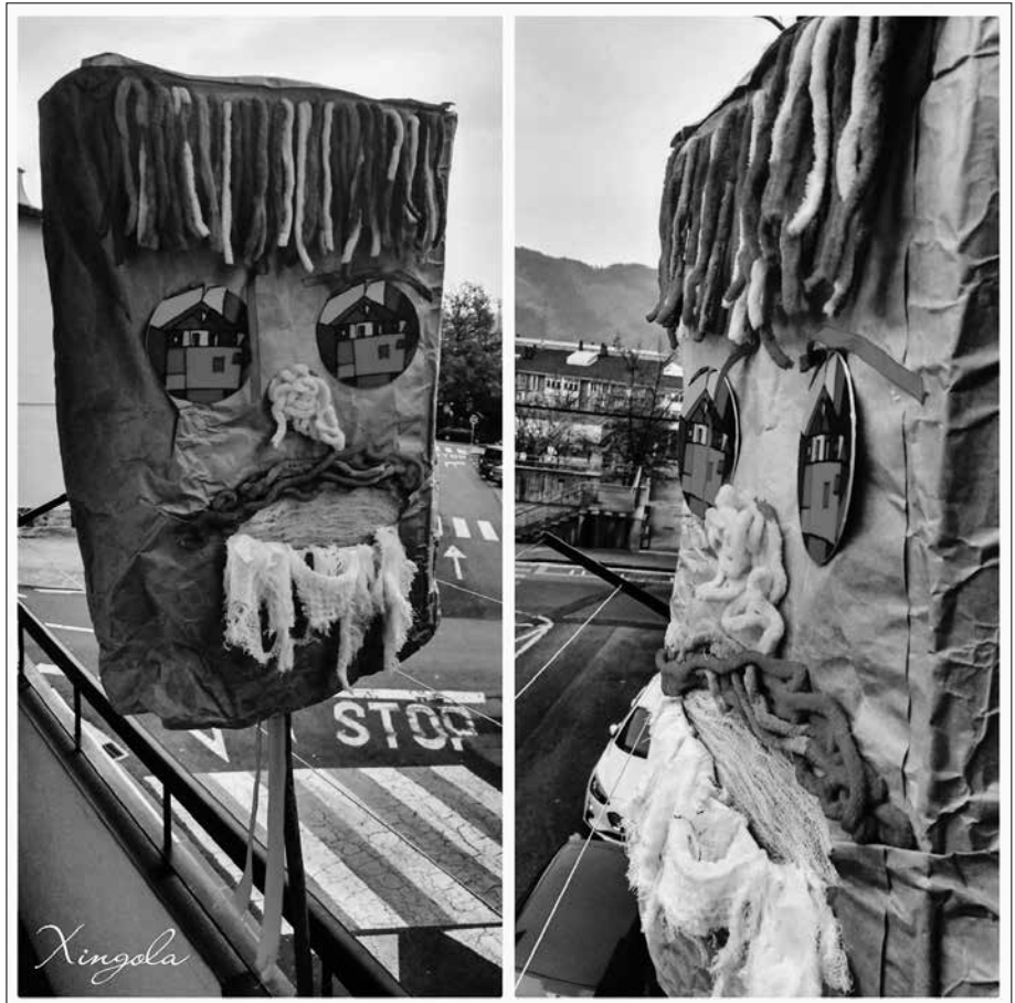
"Etxeko balkoian Koronamaloa jarri dugu, txoriak aldentzeko txorimaloak lez, kalean dabilen bitxua guretik uxatzeko... Ea nork egiten duen beldurgarriena!".