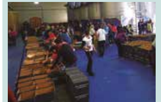
Jakien banaketa egunak aurrerago zehaztuko dizkizuegu.