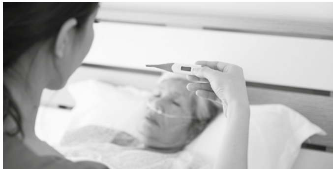
“Jende asko dago etxean, inor ez zaiona joan test bat egitera”. Erizain usurbildar baten esanetan, “datuak desbirtuatuak daude. Honek beste dimentsio bat du”.

Beldurrez bizi ditu egun hauek. “Ez dakigu zeren aurrean gauden”, aitortu digu Usurbilgo erizain honek. Oso eskertuta dago iluntzeroko txaloaldiengatik, baina umiltasun osoz esan digu euren lana baino ez dutela egiten. Birusa ez da buruan duten kezka bakarra. Lan baldintzek loa galarazten diete. “Gero eta material gutxiago dago eta hortik dator protokoloaren egokitzapena. Gaur egun, gure unitateak badu materiala”. Baina gero eta gaixo gehiago ospitaleratzen dituzte. “Materiala