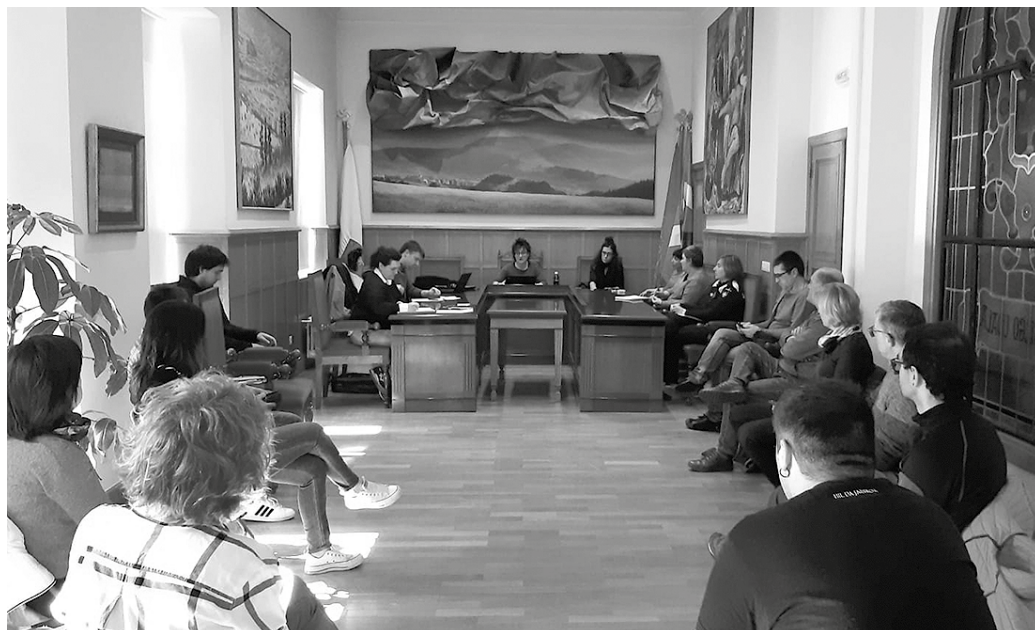
Oinarritzko elikadura bermatzeko diru-laguntza bereziak sortzea erabaki zuen lehengo astean Prebentzio Mahaia.