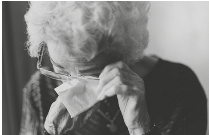
Osasun fisikoa zaintzeaz gain, burukoa ere zaintzen laguntzeko zerbitzu bat jarri du martxan Gipuzkoako Psikologia Elkargo Ofizialak.

Egunerokoan gizartearen bizi ditugun denetariko arazo, gatazka eta indarkeriak etxe barruetara eramatea eragin du indarrean den itxialdiak. Edota lehendik etxe barruan bizi zirenak okertzea. Egoera hauei itxialdia bera kudeatzeko norberak izan ditzakeen zailtasunak batu behar. Covid19-ari aurre egitearekin batera, uneotan sor daitezkeen errealitate anitzak kudeatzeko zenbait protokolo indartu eta laguntza zerbitzu zabaldu dira.