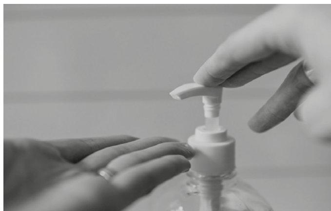
Eskuak ondo garbitzeko ohiturari heldu beharko diogu gerora ere.

Osasun arloko langileek ez dute beste munduko ezer eskatzen. Lan baldintza duinak eta material egokiak. “Gu babesteko eskatzen dugu, gu ez kutsatzeko eta guk gure ingurukoak ez kutsatzeko”. Baina horretarako, osasun arloko egitura guztia berrindartu behar dela adierazi digu erizain usurbildarrak. “Askotan minimoan gaude lanean, eta egunak pasa ditzakegu horrela. Baina halako gauza bat helitzen denean, ez duzu nahikoa baliabiderik”. Eta baliabide faltan, azken buruan, nork ordaintzen du? “Gaixorik datarrenak. Guk ahalegin handia