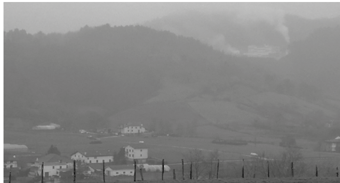
Ekimen honekin herritarrak kontzientziatu nahi dira.

Era honetan herritarrak kontzientziatu nahi dira, “zer nolako arriskua dakarren honek euren bizitza eta osasunari begira”. Gogorazten dutenez, Osasunaren Mundu Erakundearen arabera 1,6 milioi pertsona hiltzen da urtero munduan kutsaduragatik. Zientziaren alorreko txostenek salatu eta egiazaturikoa ekarri dute gogora. “Erraustegiak Kutsatzaile Organiko Jarraikiak isuriko dituela eta beste substantzia oso toxikoak ere bai, minbizi eta