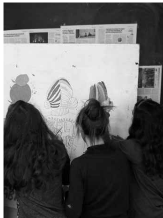
Aurrez aurreko jarduerak eten egin dira. Gaztelekua, Sutegi Udal Liburutegia eta KzGunea egoera berrira egokitu dira eta online zerbitzuak ipini dituzte martxan.

Gaztelekua: Bai hala da. Aldaketa handia izan da, Gaztelekuan elkarrekin egotetik, soilik sarean bitartez komunikatzera. Guretzako ere, erronka da eta erronka honetan zerbitzua eskuragarri egotea beharrezkoa ikusten dugu eta nahi dugu, hau da ikusgai jarri nahi dugun xedea, gailuen beste aldean bada ere, egoten jarraitzen