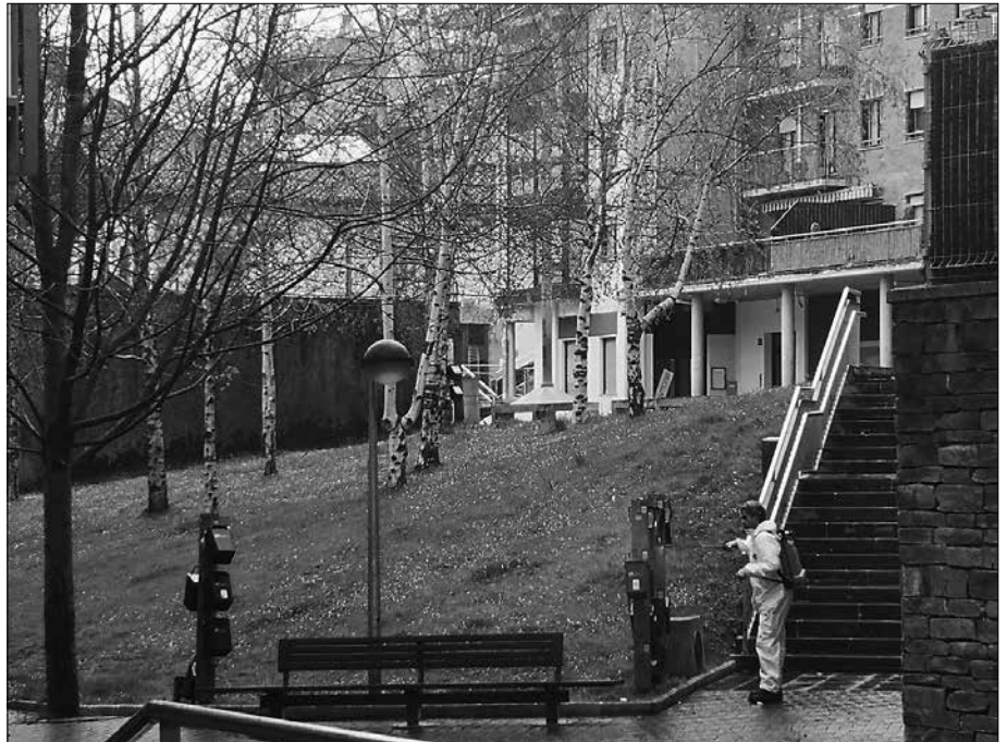
Konpost-guneak, paperontziak eta atez ateko zintzilikarioak (irudian) desinfektatzen dituzte.

Konfinamendu garaia hasi zenean, udal brigadak bere lanak egokitu behar izan zituen. Egunero derrigor egin beharreko zereginen gain, Covid19-ren kutsatze-arriskua gutxitzeko lanak eginen hasi ziren. Talde txikituta banatuta eta prebentzio neurriak hartuta aritzen dira lanean.