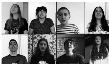
Itoiz taldearen 'Elurretan' kantaren bertsioa partekatu zuten aurreko asteburuan. NOAUAren web orrialdean duzue ikusgai.