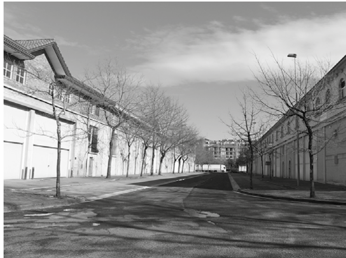
Krisiaren eragina gutxitze aldera, Beterri-Buruntzako udalek zerbitzuak zentralizatzea adostu dute. Enpresa eta autonomo guztiei zuzenduta dago eskaintza. Web orrialde bat zabaldu dute horretarako: beterriburuntza.eus

Informazioa eta aholkularitza Krisiaren eragina gutxitze aldera, Beterri-Buruntzako udalek zerbitzuak zentralizatzea adostu dute. Enpresa eta autonomo guztiei zuzenduta dago eskaintza. “Eskura ditugun gaitasun guztiekin eta gainontzeko administrazioekin batera (Espainiako Gobernua, Eusko Jaurlaritza, Foru Aldundia eta tokiko instituzioak)” arituko dira. Etortzearen diren neurri publikoen nahiz diru-laguntza deialdien berri emango dute.