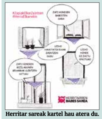
Herritar sareak kartel hau ateratu du.

Kale eta auzoak elkar laguntzeko gune seguruetan bilakatu behar ditugula dio Herritarren Babes Sareak, bereziki konfinamendu honetan egoera zaurgarrienean diren herritarrentzat. “Beharra duten horientzat, espazio seguruak sortuz, bizilagunen arteko eraso eta epairik gabekoak eta eraso polizialen aurrean bizilagunon arteko babesa eskainiz”. Babes Sareak bide batez, eskerrak eman nahi dizkie usurbildarrei, “osatu dugun sareagatik”.