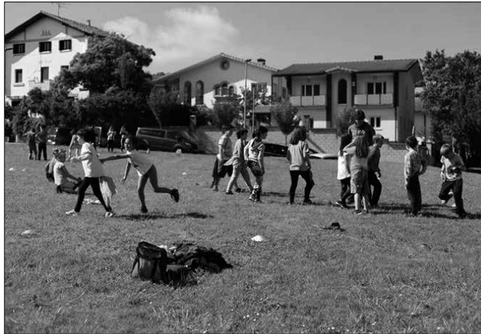
"Nahi dudana da konfinamenduaren ondoren, gu eta umeak ateratzen garenean, zelaian txakurrak ibili diren bezala ibiltzeko aukera izatea".

Baina nire imajinazioa tustustean bertan behera erori zait. Laino beltz bat etorri balitz bezala. Ikusi dudanak irudi eder hori itsusitu dit. Pareko etxekeo bizilagun bat etxera sartzera zihoan bi