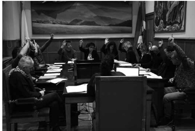
Udalak dekretu bidez onartu ditu neurri hauek.

Osasun-larrialdi egoerak iraun bitartean beraien jarduera eten behar izan dutenei udalak ez die eman ez duen zerbitzurik kobratuko. Esaterako, hondakinen tasa edota terrazaren prezioa ez zaie kobratuko jarduera eten behar izan dutenei, alarma egoerak iraungo duen epealdiari dagokionez. Aurrez kobratua izan balitz, itzuli egingo zaie dirua. Epealdiaren zati batean zerbitzua eman bada, eta beste zati batean ez, emandako zerbitzuari dagokion zatia soilik jasoko du udalak. Halaber, gainerako herritarrei dagokienez, kiroldegiko ikastaroak bertan behera gelditu direnez, eman ez diren aldiari dagokion dirua bueltatu egingo zaie. Kirold-