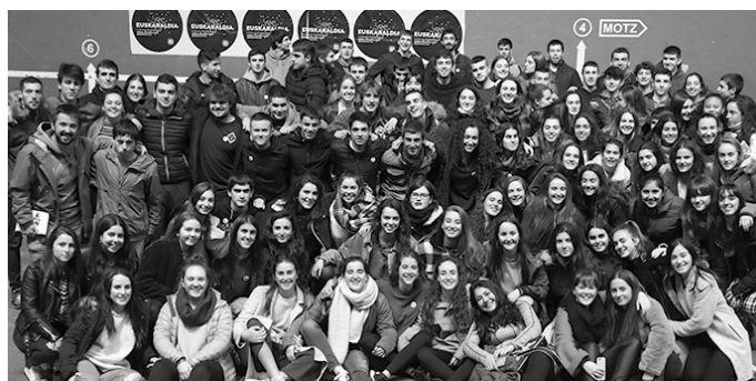
Apirilaren 27tik 30era, borroka astea iragarri du Aztarririkak. Maiatzaren 1eko Langileen Egunean borobilduko du zikloa.

Asteroko dinamika hiru hitzordu izango ditu: gaiari lotutako bideo laburra plazaratuko dute astelehenera; gai berari