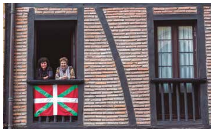
Argazki bilduma osoa noaua.eus/galeriak/ helbidean ikusgai.