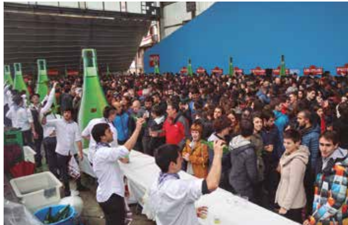
Azken ordura arte zain egon dira baina, egoerak hala behartuta, etsi egin behar izan dute azkenean: “Sagardo Eguna bertan behera uztea erabaki dugu”.

Gizartea orohar ez da egoera samurra bizitzen ari, dio Sagardo Egunaren lagunak