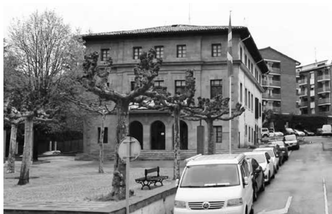
Aberri Egunean, udaletxe-ko ikurrina masta erdian jarri eta minutu bateko isilunea egin zuten.

Igandean ospatuko dugun Aberri Eguna egoera oso berezian datorkigu, izan ere, konfinamendu betean aurkitzen da euskal jendartea, eta, dagoeneko, Euskal Herriaren luze zabalean bere arrastorik gordinena utzi du gaitz honek: mila herritar inguru zendu dira, gaitzak jota daude milaka herritar, eta beste milaka herritarrek euren lanpostua arriskuan dute. Halaber, osasun krisi honen ondorioz, gure herriko egitura ekonomikoa gogor kolpatzen ari