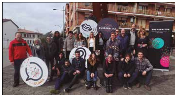
Euskaraldiko batzordetik proposamen hau luzatu dute: “leihoetan edota balkoietan koloretako puntu bat jartzera gonbidatu nahi ditugu herritarrek”.

Urte amaierako 2. Euskaraldiaren prestaketa saioa izango da, eta “euskara gehiago, gehiagorekin eta gehiagotan erabiltzea” izango du helburu nagusia. Etxean ahotan hartzen dugun hizkuntzaren garrantzia azpimarratzen dute. “Etxekoe-kin gure hizkuntza ohiturak aldatu edo finkatzen baldin baditugu, askoz errazagoa izango zaigu kalera irteten garenean horiek mantentzea edo Euskaraldira iristen garenean ere gure hizkuntza ohiturak aldatzea edo finkatzea”.