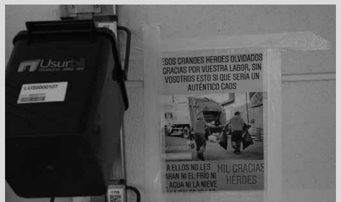
Konfinamendua hasi zenetik hona elkartasun mezu ugari jaso dituzte.