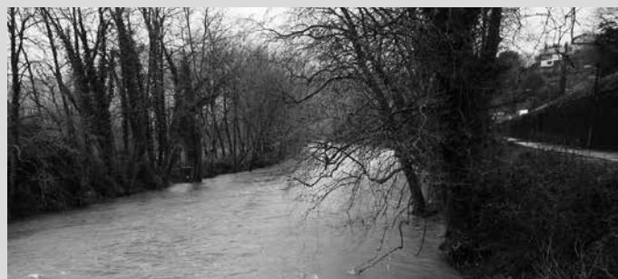
1995. urtean abiarazi zituen Foru Aldundiak izokinak berreskuratzeko lanak Usurbil zeharkatzen duen erriean.

Inork ez du arrantzatu, izokinen arrantza debekatua baitago Gipuzkoan. 27 urte daramatza Gipuzkoako Foru Aldundiak espezie hau berreskuratzeko lanetan. Aipatu izokina, neurtu, pisatu eta izokina markatzeko baliatu