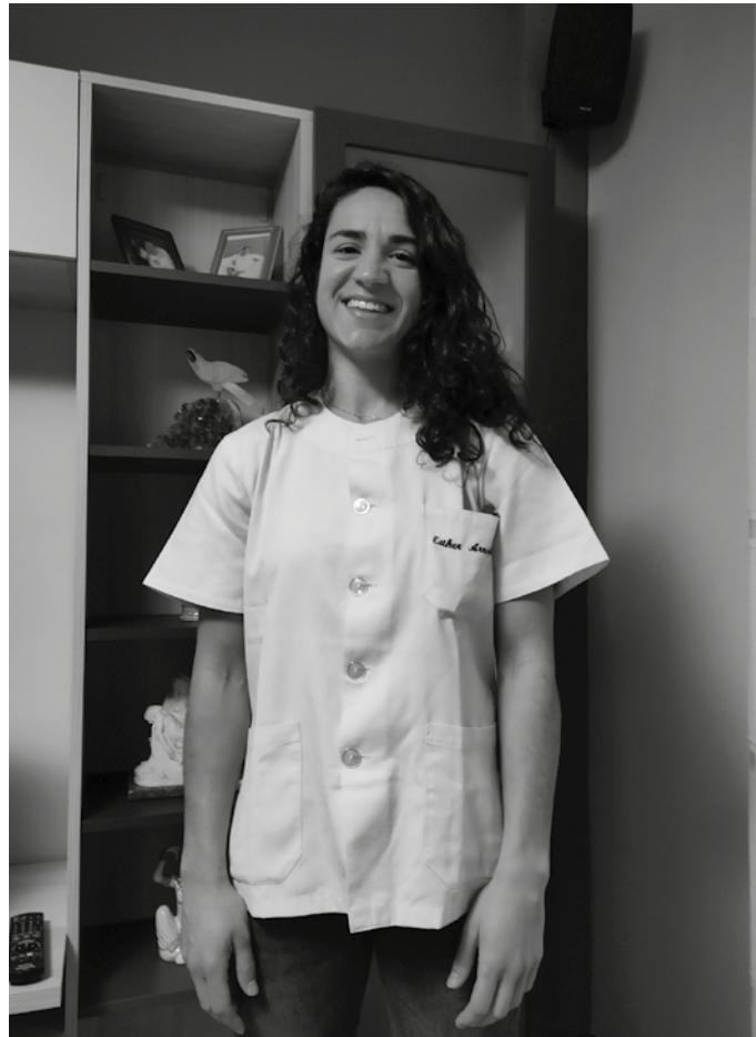
Donostiako Guna osasun zentro pribatuan egiten du lan. “Higiene neurriekin, distantziekin eta gainerako gomendioekin kontu berezia izan behar dugu orain”.

Lehen esan bezala, ez dut ospitalean lan egiten eta ez dakit bertako egoera benetan nolakoa den, baina material falta dagoela egia da. Nire esperientzia pertsonala kontuan izanda, konfinamendua hasi zenean 2 maskarila eman zizkidaten eta horiekin moldatu behar nuela