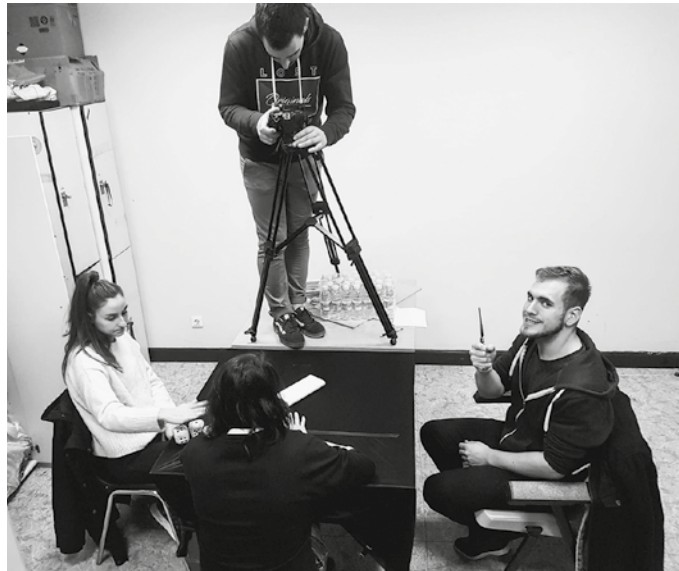
“Betiko jolas bat hartu eta buelta bat eman diogu. Askotan detaile txiki batek jolasa guztiz alda baitezake”. Youtuben Mendu Astialdi Eskola kanalean eta Instagramen @menduastialdieskola helbidean aurkituko dituzue jolas guztiak.

Eskola bezala, eboluzio bat izan du taldeak. Hasiera batean, begirale eta zuzendari ikastaroak eskaintzen zentratu ginen buru belarri. Zailtasunak zailtasun, paraleloki astialdi taldeei ikastaro ezberdinak ematera jarri ginen, izan jolasen eraldaketen inguruan, izan elikagaien manipulazio ikastaroan; sektorearen beharretara moldatuta. Aurretik esan bezala, esperientzia asko eta ezberdineko jendea dago taldean eta oso ondo ezagutzen ditugu hezkuntza