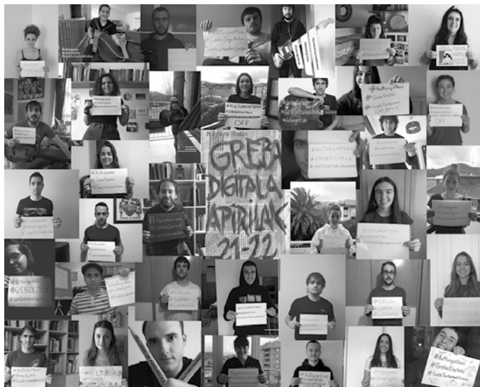
Bi egunetan, sarean kultur edukirik ez partekatzea eskatu zuten.

Bi egunotan sarean kultur edukirik ez partekatzea eskatu zuten. Milatik gora norbanako, talde zein elkarteek bat egin zuten kultur gintza.eus atarian plazaratu zen manifestuarekin. Tartean ziren Usurbilgo hainbat sortzaile ere. Eta