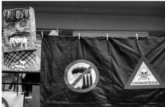
Kutsaduraren aurka, osasun alarma piztu eta oihal beltzak jartzeko deia egin zuten apirilaren 26an.

Gogorarazi dutenez, Osasunaren Mundu Erakundearen arabera, kusadurak munduan 5,5 milioi pertsona hiltzen ditu urtero, 800.000 European, 40.000 espainiar es-