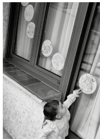
Balkoiak edota leihoak apaintzeko eskatu zaie herritarrei, koloretako borobil bat eginda.

Oraingoz, Etxealditik Euskaraldira ekimenean parte hartzera gonbidatu dituzte herritarrak, eta hala egitea erabakitzen dutenei euren balkoi edo leihoak apaintzeko eskatu diete, koloretako borobil bat