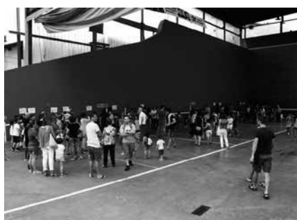
Izen-ematea orain zabalduko da. Uztailean ezingo balitz egin, ordaindutako kuotaren %100a itzuliko da.