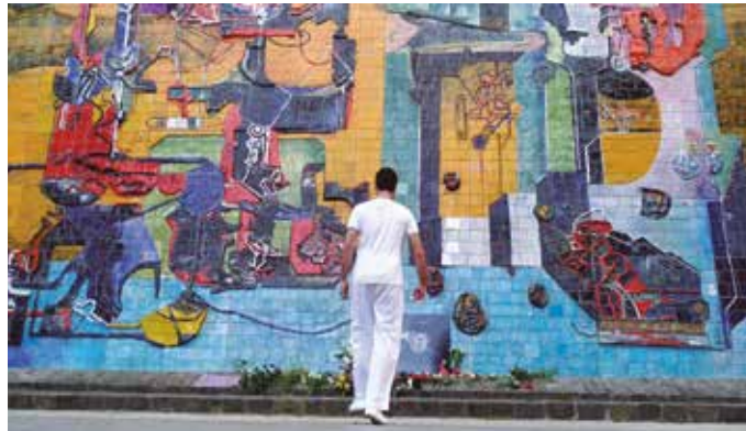
Herritar batzuk modu anonimoan egin zuten bideo batek arrakasta handia izan zuen sare sozialetan. NOAUA!ren web orrian duzue ikusgai.

Lehenago gaztetan Parisen egin zuen egonaldiaz ere entzun izan genion, bere erreferenteak aipatzerakoan.