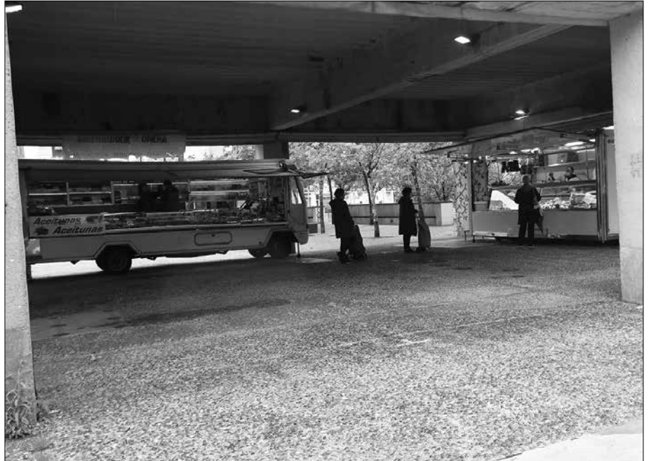
Herri-tarrak tantaka produktuak erostera hurbildu ziren.

COVID-19-ak martxo hasieran etendako asteazkeneko azoka itzuli zen apirilaren 22an Askatasuna plazako estalpera. Ohi baino postu gutxiagorekin. Usurbilgo Udalak ohartarazi moduan, soilik elikagaiak saltzen dituztenek baitute baimendua kalean saltzea. Ondoko irudia, azoka aipatu enparantzako estalpera itzuli zen eguneko duzue. Elikagaiak saltzen dituzten lau postuetatik hiru itzuli ziren. Herri-tarrak tantaka produktuak erostera hurbildu ziren.