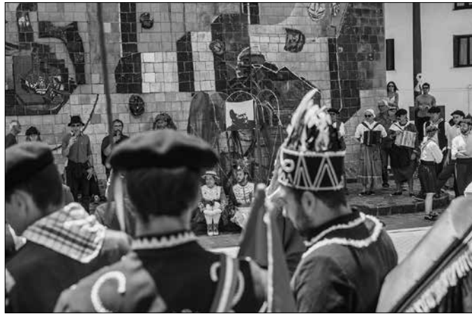
"Donostiako Jaun-kuntiak bidali zituen buhamiak bere lurretatik eta maskaradaren erritmora, konkistatu zuten Usurbil bilakaturik Üsurbil, Zuberoako 42. udalerrria, eta Pitxuk bere burua herriko alkate izendatu zuen".