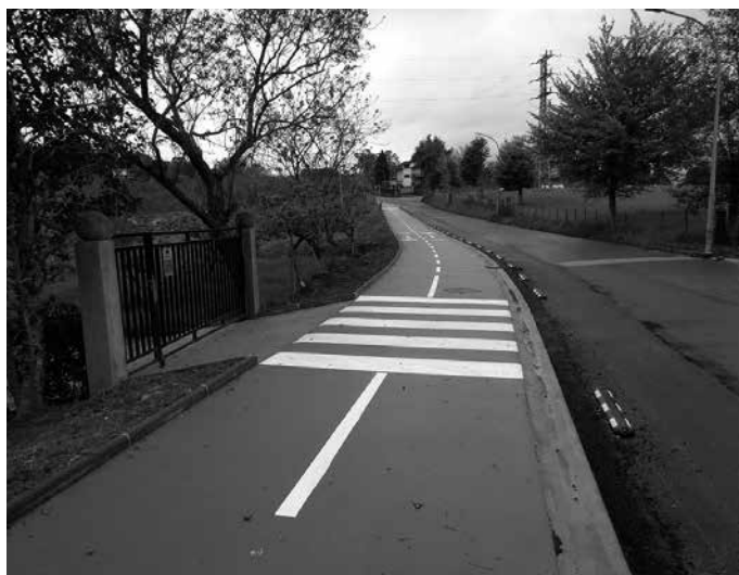
Murkaiku eta Pikaola arteko bidegorriko lanak amaitu dituzte.

Kalezarren, Espainiako Gobernuak obrak geraraztea erabaki zuenean, Murkaiku eta Pikaola arteko bidegorriko lanak amaitzear zituzten. “Lanegun bat baino ez zitzaion falta”, Usurbilgo Udaletik zehaztu dutenez. Sektore hau lanera itzultzea baimendu denean, “amaitu dute dagoeneko”. Antzeko egoeran da Kalezarretik mugitu gabe, etorkizunean auzotarren udal ekipamendua eta Emakumeen Etxearen egoitza nagusia izango den Pelaiouenea eraikina ere. “Pelaiouenearen estalkiaren obrak apirilaren 1ean hastekoak ziren. Orduan