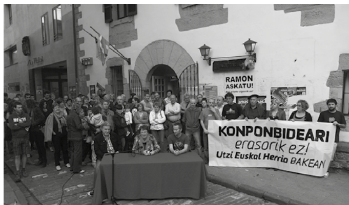
Ezker Abertzaletik iragarri dutenez, “Koronabirusa dela-eta egoera arraroa izanik ere, ez gara isilik geratuko”. Argazkia artxibokoa da.

Halere ohartarazi dutenez, 2012ko ekainean irekitako kontu zenbakia da enbargatu dutena eta “diru hauek zerikusirik ez dutenez, berreskuragarria izango da”. Halere, Espainiako Auzitegi Nazionala exekutatzeko hasi den herriko tabernen eta elkarten aurkako sententzia, “1936ko gerraz geroztik eman den expolio ekonomiko eta politiko handiena” da.