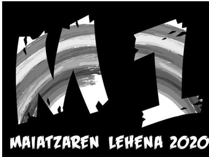
Herritarrei leiho eta balkoietan irudi hau ikur gisa jartzera deitzen diete LAB, ELA, ESK, STEILAS, HIRU eta ETXALDEK.

Gogoan izan, Aztarrika Usurbilgo Gazte Asanbladak azken hilabete honetan martxan izan duen Bloke Gorria