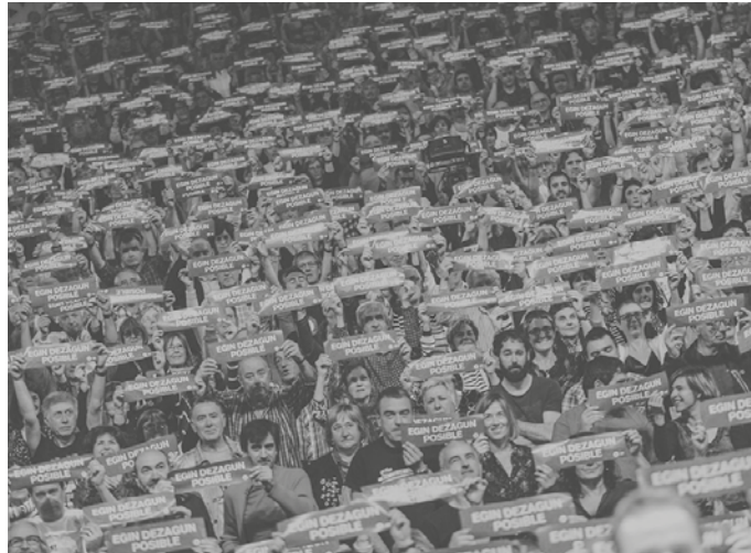
Laster, komunitatearen babesa indartzeko bazkideza kanpaina abiarazteko da Gure Esku.

Laster, komunitatearen babesa indartzeko bazkideza kanpaina abiarazteko da Gure Esku. Erabakitze eskubidea arautzeko erreferendumaren aldeko sinadura bilketa masiboa abian dute baita, hamaikagara.eus atarian.