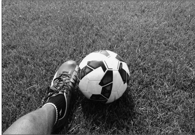
"Eta iritsi da eguna. Bi taldeak aurrez aurre Anoeta Arenan eta bertako eta urrutiko ikusleak zoroen moduan".