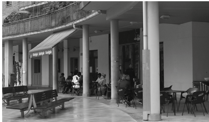
20.000 euro bideratuko ditu Udalak egitasmo honetara.

Bonoen salerosketa sistema honetatik kanpo geratuko dira, ostalaritza establezimenduak. Sektore honi zuzendutako apar-