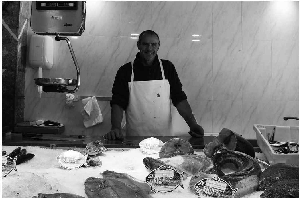
“Guk, denda txikiok, martxan egon behar dugu”, adierazi digu Pellok. “Errotak ura behar du mugitzeko eta guk bezeroak behar ditugu mugitzeko”.

Jendeak oso ondo ulertu du itxaron beharra zuela. Eta modu naturalean erantzun du. Hortik ez dugu inolako arazorik izan. Baina egunotan sortu