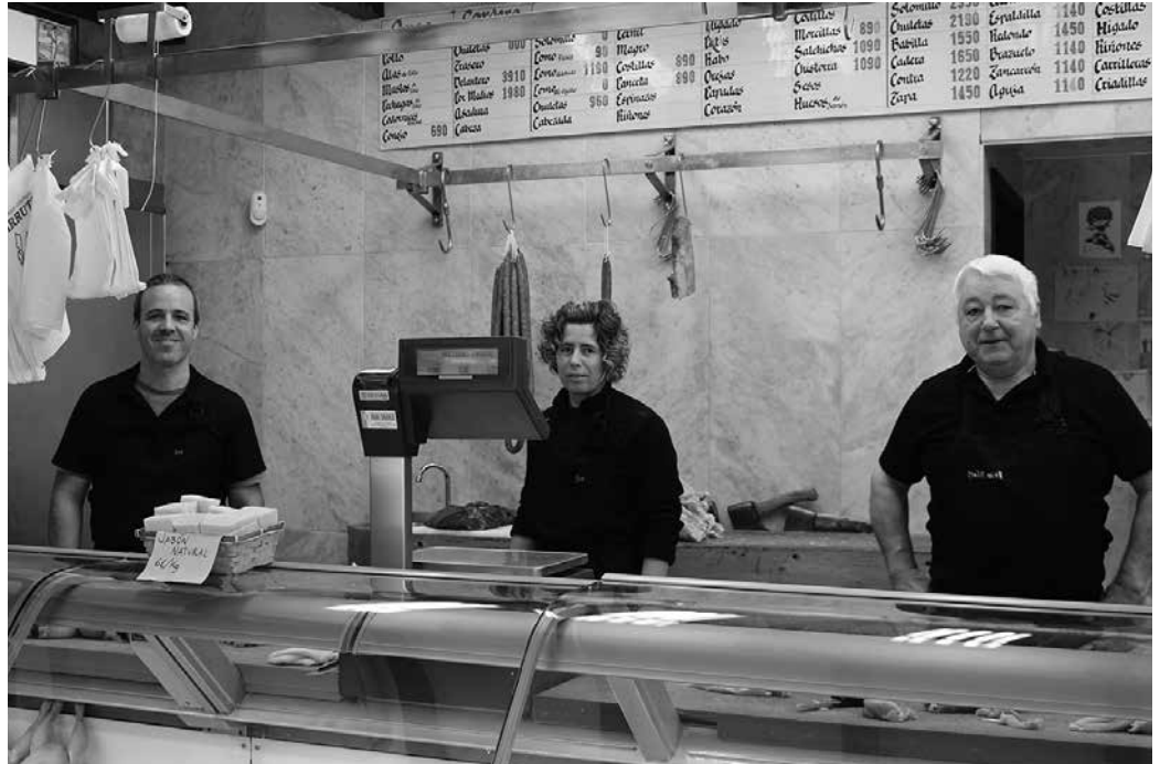
Osasun krisia hasi zenetik hona etenik gabe aritu dira lanean. Goizez bakarrik zabaltzen dute, 8:30etik 13:30era. Konfinamendua baino lehen ere, ordutegi horrekin ari ziren lanean.