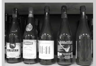
Sagardo botilen salmenta igo egin da konfinamendu garaian.

Ez, stock handia izaten dugu beti. Legamia amaitu zen bai, baina beste produktuekin ez dugu arazorik izan.