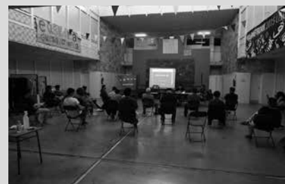
Prebentzio eta higiene neurriak aintzakotzat hartuta egin zen Jai Batzordearen bilera.

Aste hasieran berriz bildu zen Jai Batzordea Udarregi Ikastolako erdiko aretoan. Bizi dugun osasun krisialdira egokitutako bilkura izan zen. Jaiak ere, testuinguru honetara egokitu behar dira. Eredu berri hau zehazten ari dira azken asteotako bilkuretan.