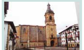
Igande honetan, hilak 31: Aginagan 10:30ean eta Usurbilen 12:00etan.

Ohar baten bidez aditzera eman dutenez, "bertan izango gaituzue laguntzeko. Pazko mezu bat luzatu nahi dizuegu, ez izan beldurrik, errespetua eta ardura bai, baina, mesedez, beldurrik ez. Beldurrak lotu, gogortu, geldiarazi egiten du. Izan gaitezen elkar-arduratsu".