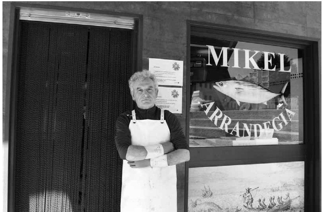
“Barruan bi ari bagara lanean, bi lagun bakarrik sar daitezke. Bakarra badago lanean, bezero bat bakarrik sartzen da”.

Lehengo bezeroak mantendu dituzue. Baina berriren bat ere