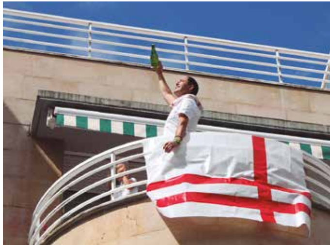
Sare sozialetatik hartu ditugu argazki batzuk, NOAUA!ko kideok atera ditugu beste batzuk. Eta badira helbide elektroniko bidez iritsi zaizkigunak.

Plazan ezin batu, herritarrek etxean eta etxeokokin ospatu zuten Sagardo Eguna. Osasun krisialdiaren ondorioz, 39. Sagardo Eguna ezohikoa bezain ikusgarria izan zen.