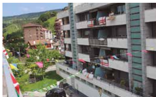
Argazki eta bideo gehiago topatuko dituzue noaua.eus orrialdean.