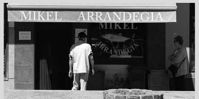
Jendeak pazientziarekin errespetatu du bere txanda.