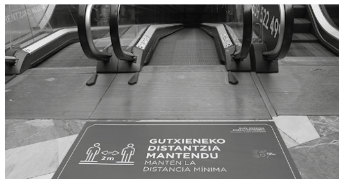
Seinale ugari ezarri dituzte saltoki atarietan nahiz sarbideetan.

Segurtasun eta garbiketa zerbitzuak indartu ditugu. Batetik, bezeroari bete behar dituen neurriak gogorarazteko. Eta bestetik, egunero garbituko ditugu sentsibleak izan daitezkeen puntuak: atak, eskailera eta igogailuetako heldulekuak, komunak... Aforoa mugatua izango denez, hori ere zorrotz beteiko dugu.