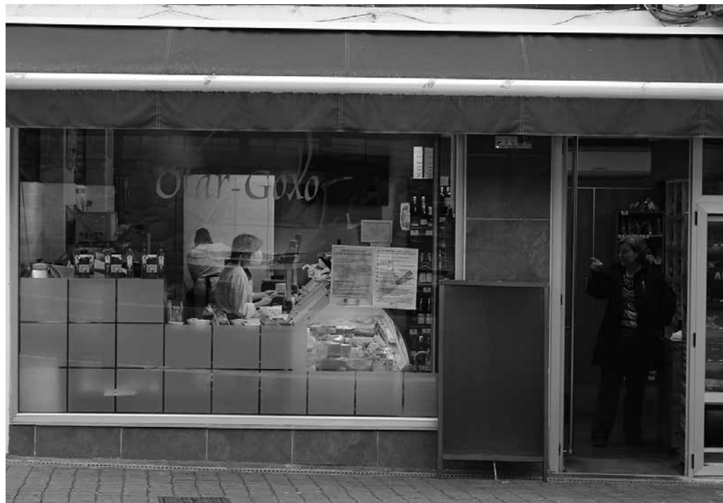
“Jende askok telefono bidezko zerbitzua erabili du”, adierazi digute Otar-Goxokoek.

Konfinamendua ezarri bezperan, martxoaren 13an eta 14an, oso zaila izan zen lan egitea. Zergatik? Jendeak beldurra sartuta zeukan barruraino, lokal guztiak beteta, eta