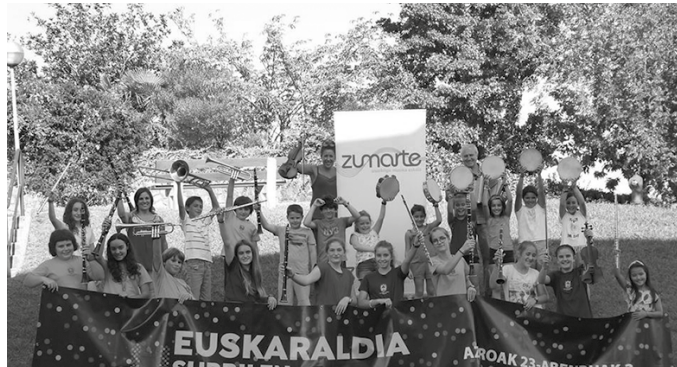
Matrikula on-line egin daiteke www.zumarte.eus web orrialdean. Bestela presentzialki: ekainak 2 asteartea arratsalde; ekainak 4 osteguna goizez.

Konfinamenduan, ikasleek entseatzeko jarraitu dute etxean eta Zumartek sare sozialetatik