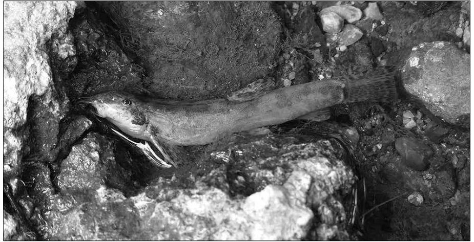
“Isuria maiatzaren 7an gertatu zen, baina GHK-k ez zuen haren berri eman, legez egin behar zuen bezala”, salatu dute Anerreka Ingurumen Elkar-teak, Zubieta Lantzenek eta Eguzki Talde Ekologistak.

Gipuzkoako Hondakinen Kontsorzioak horrelako gertaerei garrantzia kendu nahi diela uste dute, “baina gurekin bat ez datorrenak ere aitortu beharko du Arkaitzerrekaren kasuan izan duen