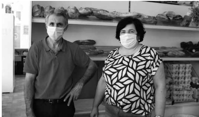
Opil-Goxo okindegia Kale Nagusian dago eta kafetegia ere bada.

Herritik ezin atera, bertan kontsumitu behar zen. Zuei ere lana handitu egingo zitzaiz-