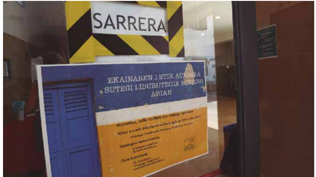
“Musukoa ekarri behar da, eskuak garbitu behar dira Sutegiko atarian eta 2 metroko distantzia mantendu”.