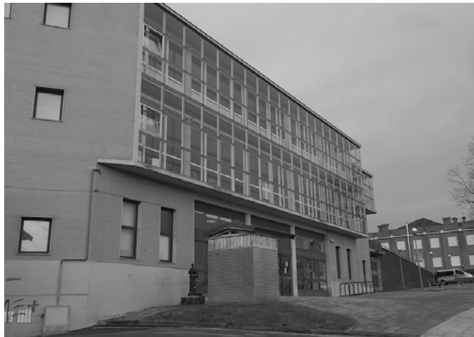
Ekainaren 8an irekiko da gimnasioa; ekainaren 15ean, igerilekua. Zerbitzuak mailaka eta prebentzio neurriak kontuan hartuta emango dira. Gutun bat bidaliko diete erabiltzaile guztiei, neurrien zein itzulketen berri emanez.

■ Bilerak %30eko edukierara mugatuak: sotoan 9 lagun, I. solairuko proiektore gelan 7 lagun eta 4 lagun gela txikian, 15 lagun Urdintxo gelan. Giltzak goizko harrera ordutegian hartu beharko dira. Erabiltzaileei protokoloa helaraziko zaie eta desinfektatzeko produktuak eskura izango dituzte.