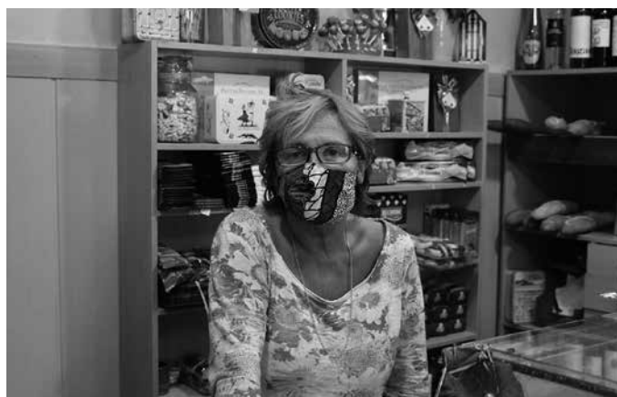
Kale Nagusiko dendan antzeko martxan aritu dira lanean.

Hemen, dendan, ez dut aldaketa handirik atzeman. Gu-