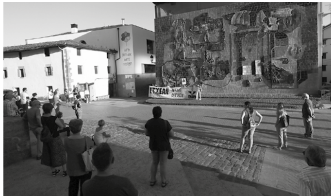
Usurbilen Nahi Ditugu bilguneak deituta, mobilizazio jendetsua egin zen aurreko ostiralean frontoi atzean.

M aiatzeko azken ostiralarekin batera, Euskal presoek eskubideen aldeko mobilizazioak Euskal Herriko plazetara itzuli ziren, covid19-aren eraginez bi hilabeteko etenaldia izan ostean. Baita Usurbilgo Mikel Laboa plazara ere. Usurbilen Nahi Ditugu bilguneak deituta, mobilizazio jendetsua egin zen frontoi atzean.