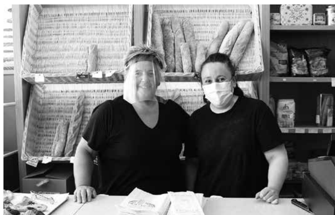
Betiko ordutegia berreskuratu dute. Astelehenetik egun osoan da zabalik.

Laukote okindegia. Lan gehi- go eduki dugu, bai. Jendea lanera joaten denean, bere