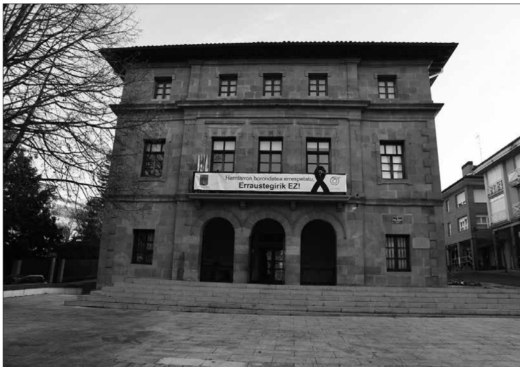
Gai honi buruzko bi moztio aurkeztu ziren azken plenoan. Bat EH Bilduk aurkeztu zuen; EAJk eta PSE-k bigarrena.

Edozein kasutan, %20ko murrizketak udalerrri honek diru ekarpen txikiagoa jasotzea eragingo du urte honetan, 900.000 euro gutxiago hain zuzen, udal gobernu taldearen esanetan. “Beharrik gehien du-