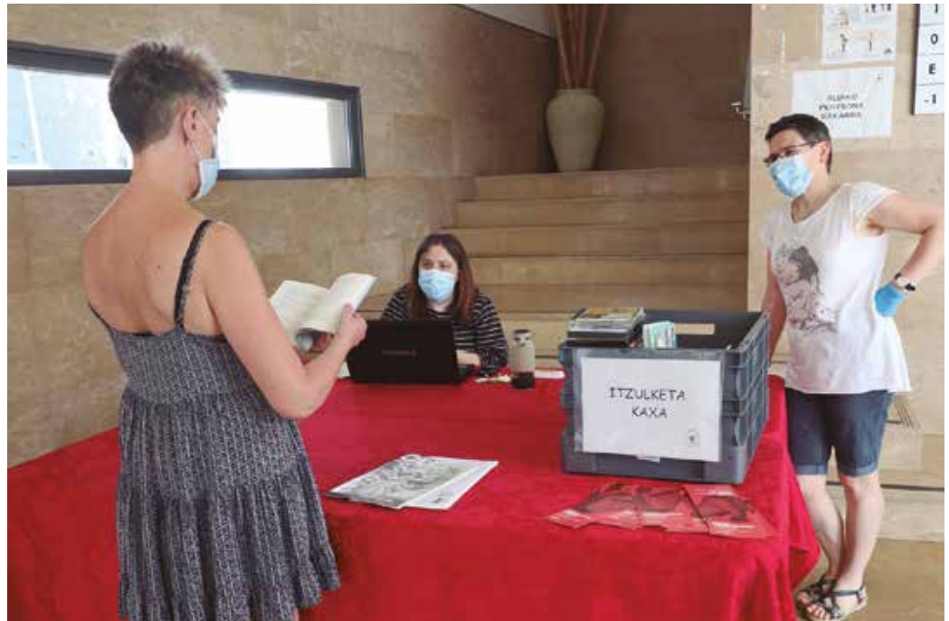
“Mailegua telefonoz edo birtualki egin ondoren, dokumentuak jasotzeko hitzordua adostuko dugu”.

Sutegi udal liburutegia: Aste hasieratik erabiltzaileak Liburutegiarekin harremanetan jarri ahal izango dira telefonoz (943360692), whatsapppe (688625477) eta posta elektronikoz (biblioteca@usurbil.eus), astelehenetik ostiralera, goizeko 10:00etatik arratsaldeko 18:30era. Hartueman horretan, erabiltzaileak zein liburu eta ikusentzunezko eskuratu nahi lituzkeen adieraziko digu; horiek Liburutegian badaude, mailegua prestatuko dugu, bestela, Liburuzainok beste batzuk proposatuko dizkiogu. Nahi duenak Euskadiko Liburutegien katalogoan (www.katalogoak.euskadi.eus edo www.liburubila.euskadi.eus-en) begiratu dezake gure eskaintza; egun hauetan,