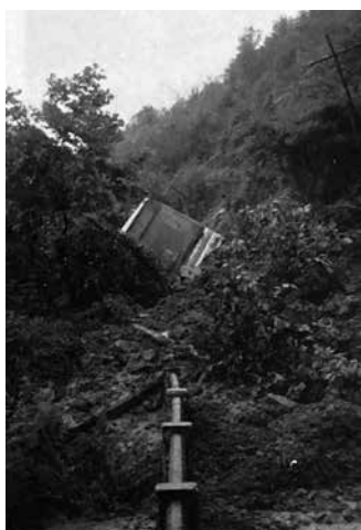
Autobus bat, N634 errepidean iraulita.