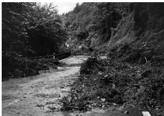
Aginaga eta Usurbil arteko bidean hainbat luizi egon ziren.