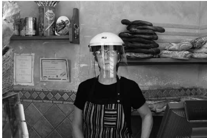
Bezeroak banaka atenditzen dituzte Mikel Laboa plazako okindegian.

Lanpetuago ibili zarete hortaz. Lana oso ezberdina izan da. Ilarak sortzen ziren kanpoan eta urduritasuna nagusi zen. Baita hemen barruan ere. Gu presaka, eta hemen zegoen