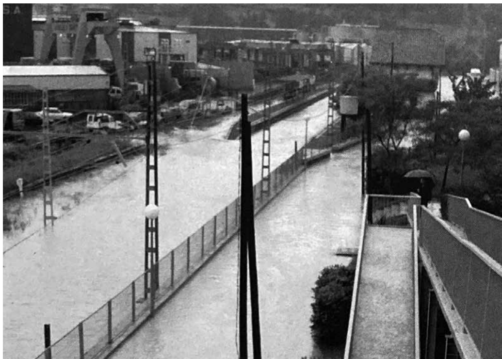
Peru Galbeteren ikusentzunezkoaren aitzakian, 1997ko ekainaren 1eko uholdearen irudi batzuk berreskuratu ditugu. Erauntsiak kalte material ugari eragin zituen. Irudian, tren geltokia, urak estalia.

Etxealdia urez estali zen. Txokoalden, urak aurrean harapatzen zuen guztia eraman zuen. Kalezarren, beste horrenbeste. Troian jendeak teilatutik irten behar izan zuen. Puntapaxen berriz, zubia puskatu eta errepidea altxa zuen. Eta Kaxkoan, hilerriaren horma zati bat apurtu zuen uholdeak. Hortik goiburua.