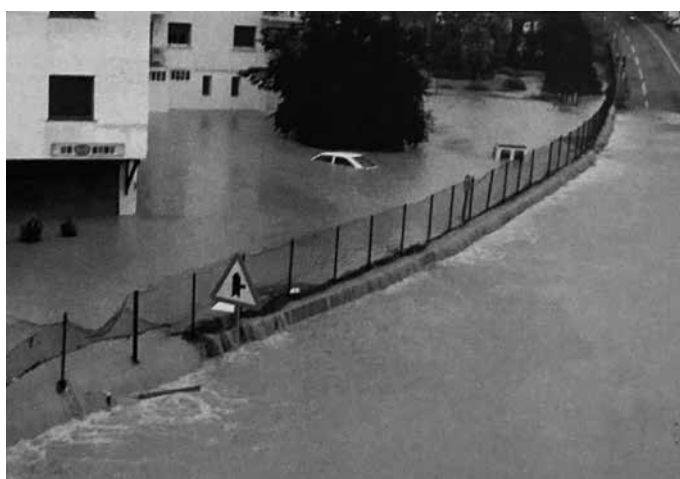
Etxealdia ondoko N634 errepidea, urez gainezka.