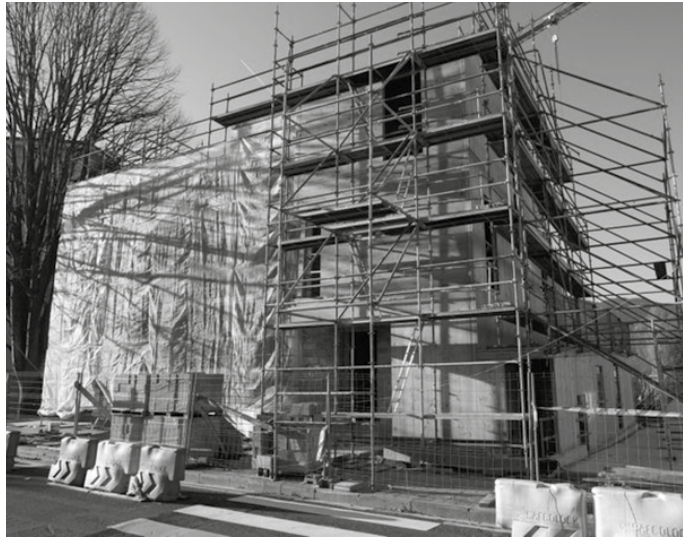
2020-2021 ikasturtea eraikin berrian hasiko dela aurreikusi du Udalak. Zumarte Musika Eskolan matrikulatzeko epea ostiral honetan amaituko da.

Aipatu moduan ordea, lanen amaiera zertxobait atze-