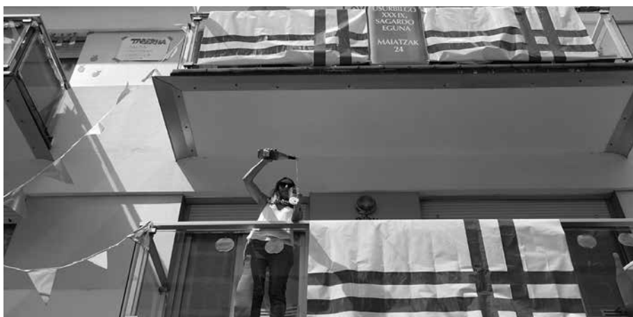
Asteburu honetan jasoko dituzte plastiko zatiak, Artzabalgo Guria taberna ondoko lokalean.

S agardo Egunekeo antolatzaileek ez dute “etxe ondoan eraiki diguten munstroa elikatu nahi”. Bi proposamen egin dituzte: “Plastikoa etxean gorde, datozen urteetan ere balkoietan jarri eta herria girotzeko. Edo guri itzuli, datorren urteko Sagardo Egunekeo postuetako mahaietan erabiltzeko”.