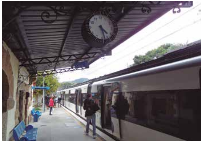
Lan egunetan zerbitzuen %100a eskaintzen segitzen du Euskotrenek.

Astebeteko tartean, berriz eguneratu ditu Lurraldebusek bus