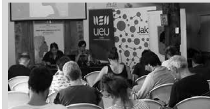
“Birusak agerian utzi ditu gure gizartearen gaitzak eta horiei erreparatuko diegu”.

■ Antolatzaileak: UEU, Usurbilgo Udala eta Jakin Fundazioa.