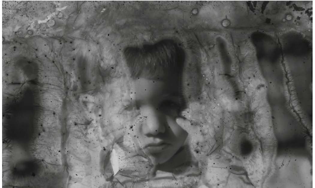
Aitak etxeko baje-ran gordetzen zituen argazkiak. Uholdeekin busti egin ziren. “Urak argazkietan zer nolako eragina izan zuen ikusten da diapositibetan, eta interesgarria iruditu zitzaidan”. Artelanak dirudite.

Urak argazkietan zer nolako eragina izan zuen ikusten da diapositibetan, eta interesgarria iruditu zitzaidan. Baina ez da uholde haiei buruzko lan bat