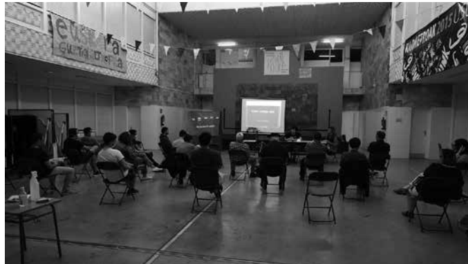
“Herritik eta herriarentzat antolatzen gabiltzan dinamika erabat berritzaile hau gauzatzeko, modu batean edo bestean, zure laguntza beharko dugu”. Idatziak Usurbilgo, Sanxetebango, Santueneko, Atxegaldeko eta Agiñako Jai Batzordeen sinadura darama.