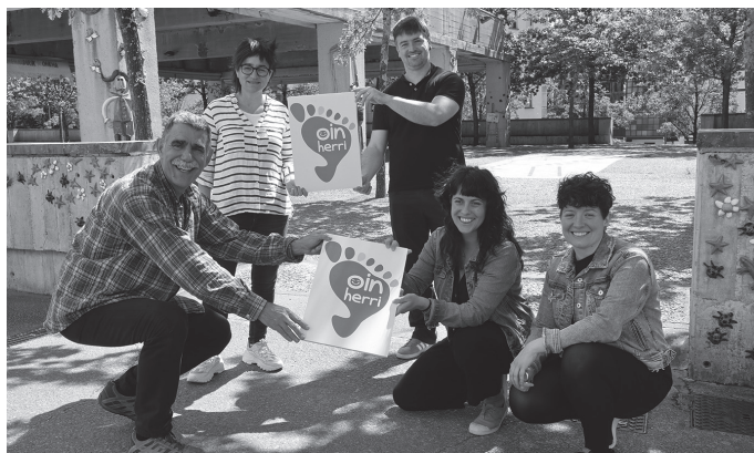
Otsailean onartu bazen ere, hitzarmena ekainaren 12an sinatu zen Potxoenean.

Gogorazi zuenez, bai konfinamenduan eta “deseskalatze” prozesu osoan, “ikusitako ahal izan dugu haurrak bazterrean utzi dituztela erakunde ezberdinek eta ez dituztela aintzat hartu haurren eskubide eta beharrak”. Testuinguru honetan zioenez, “helduoi haurren ahotsak entzunaraztea, haien eskubideak aldarrikatzea eta haien hitza eta erabakia ematea dagokigu”. Eta horregatik zioen bat egin dutela “Oinhe-