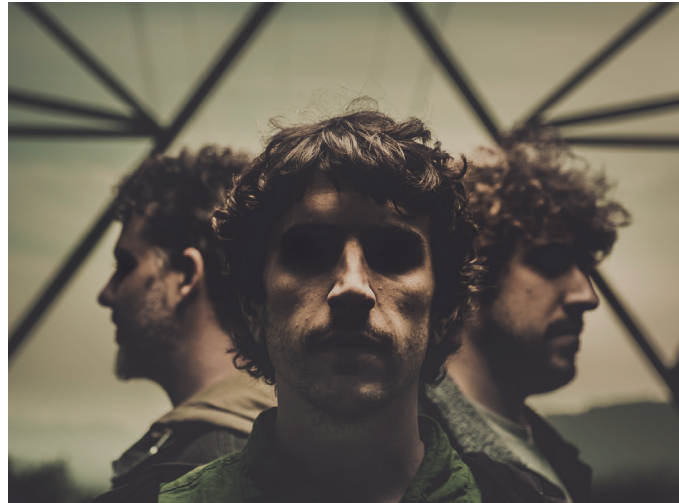
‘Balio dute’ musika kolektiboarekin plazaratu dute Kronik@ izeneko diskoa.

Antton: Guk musika sortzen dugu lehenbizi. Eta ondoren letra. Kanta batean musika prest genuenean orduan etor-