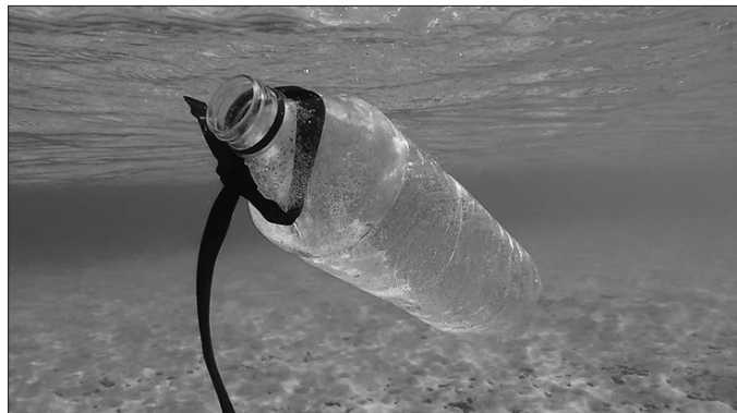
“Plastiko gehienak erabilera bakarrekoak direla hartu behar da kontuan, eta beraz, geroz eta hondakin gehiagoren sorrera eragin dugula”.