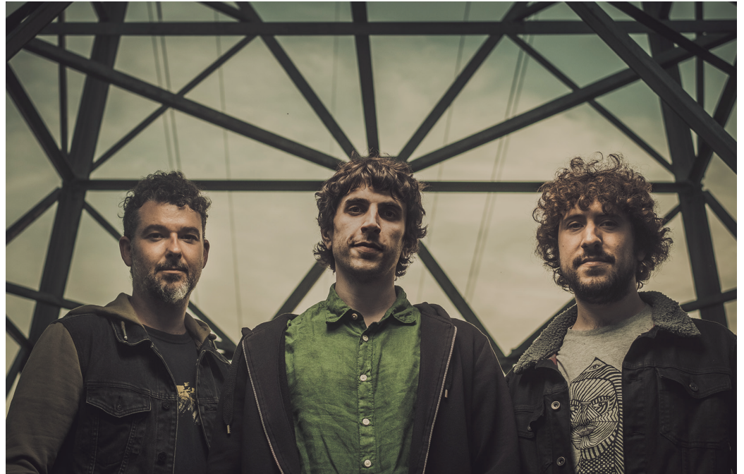
Aste honetan aurkeztuko dute diskoa. Lehen zuzenekoak ekainaren 26an eskainiko dute Donostiako Dokan. Uztailaren 2an Usurbilgo Kultur Biran arituko dira, Oiardo kiroldegian.