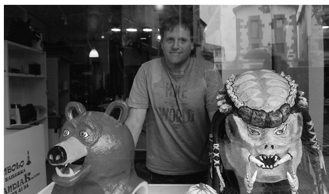
Denda izateaz gain, tailerra ere bada Txirinbolo.

Lasai dago dena. Nik enkarguz egiten dut lan. Umeek buru-