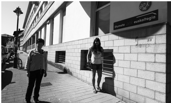
Etxealdia ezarri zenean, telematikoki bideratu behar izan zuten euskaltegiko jardunaren zati handiena; “nola edo ahala moldatu gara”.

Euskara ikasi edo ezagutza mailan sakontzeko autoikas- kuntza hautatu zutenek, ez dute alde handirik nabarmen- du konfinamendu asteotan, ez baitute aurrez aurreko klaserik izaten. Tutoretza saioak soilik eta hauek bideo deien bidez egin dituzte. Etxealdiak bene- tan eragin dituenak, “aurrez aurreko saioak jasotzen dituz- ten ikasleak izan dira, ez online bidezkoak”. Emailez jasotako ariketen aurrean, “ahal zuten moduan erantzun dute ikas- leek. Askok oso ondo eta beste batzuk, gurasoak izanik, lana bikoiztu edo hirukoiztu zaie eta ezin izan dute lan txukun bat egin”, Olaiaren esanetan.