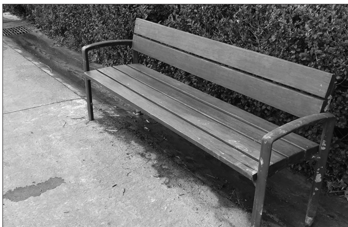
Udalak jada konpondu ditu kaltetutako eserlekuak. Salaketa bidali zigun herritar berberak helarazi digu ondoko argazkia.

Santuenetik Txokoaldera doan bi eserlekuren egurrezko oholak ebaki eta ostu zituztela berri eman ziguten zenbait herritarrek ekaina hasieran. Udalak jada