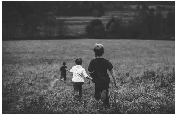
“Deseskalatze” prozesuaren 3. fase honetan, udalekuak antolatzea baimendu du Eusko Jaurlaritzak.