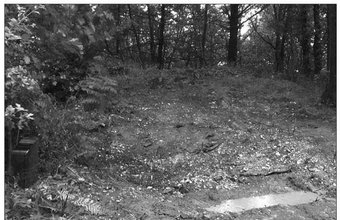
Andatzan, Juanasoro parajea da Karamiolatz trikuharria. Bertan ezezagunek botatako hondakinak jada kendu egin dituzte.

Ekaineko lehen asteburuan albiste izan zen Andatza mendia. Ezezagunek hondakinak pilatu zituztela trikuharri baten ondoan eta argazki bate-