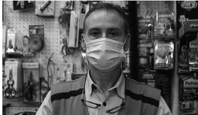
Bonuekin ere hurbildu zaizkio bezeroak. “Eskertzekoa da Udalak egin duen ahalegina”, aitortu digute burdindegian.

Bi hilabetez geldu egon eta gero, zaila izan al da berriro martxan jartzea?