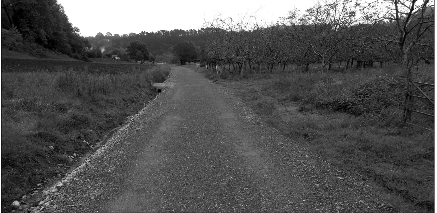
Bidea txukundu eta euri-urak jasotzeko sistema jarri dute.

Aginagako erriberako herri-bidea egokitze-ko lanak Murgil Eraikuntzak enpresak egin ditu. Usurbilgo Udalak aditzera eman duene-