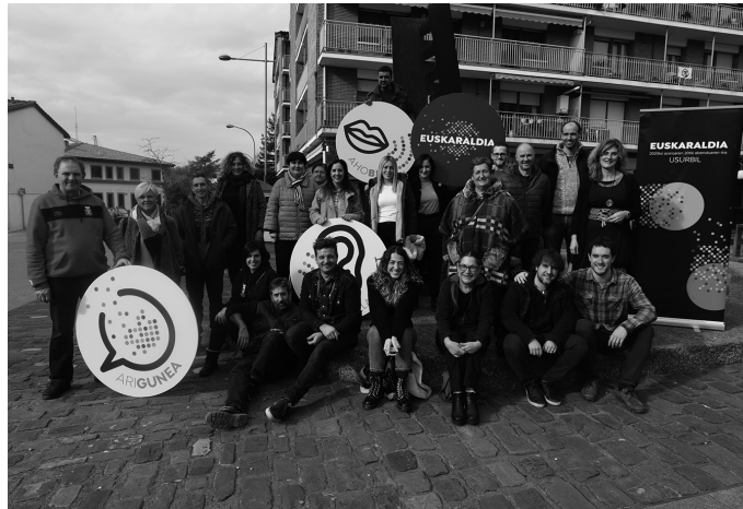
Entitateotan ariguneak edo euskaraz aritzeko gune babestuak sortu edota sustatu nahi dira aurtengo Euskaraldian.

Entitateotan ariguneak edo euskaraz aritzeko gune babestuak sortu edo sustatu nahi dira. Ekimenean parte hartzeko izen ematea zabalik dute. Usurbilen jada urte hasieran 13 entitatek hartu zuten konpromisoa Euskaraldiarekin: Santueneko Gure Elkartea tabernak, Santueneko Zaharren Egoitzak, Usurbilgo Lanbide Eskolak, Kabieneak, Orbeldi dantza taldeak, Fagor Automationek, Saizar Sagardotegiak, Usurbil Kirol Elkarteak,