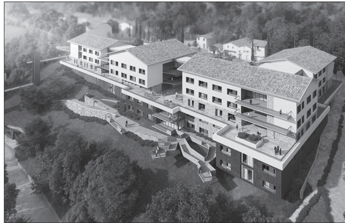
Matia Fundazioak eginiko %50eko hobari eskaerari baiezkoa eman zioten gehiengo osoz udal ordezkariak. Argazkian, maketa baten irudia.

Hauekin batera ordenantza fiskaletan aldaketa bat egitea aztertzen ari da udal gobernu taldea, azken plenoan jakinarazi zuten bezala. Proiektu honek