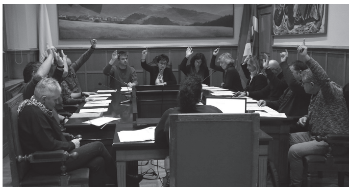
Krisian leialtasun instituzionalez jokatu dutela nabarmendu du PSE-k.

2019-23 legealdia abiatu zenetik lehen urtea bete den honetan, azken hilabeteok Covid19-ak nabarmen baldintzatu dituela dio PSE-ren oharrak. Eta horretan jarria dutela arreta, aurrerarik izan ez eta konplexua den errealitate honen aurrean, "Usurbilen berreraikitze ekonomiko eta sozialean". Leialtasun instituzionalez jokatu dutela nabarmendu du PSE-k, "udalerrri honetako herritarren inte-