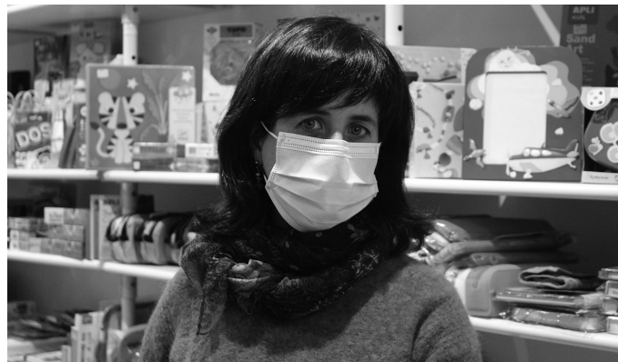
Martxoaren 21ean itxi behar izan zuten denda. Maiatzaren erdialdean ireki zuten berriro.