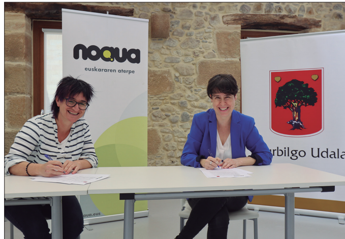
Diruz lagunduko du Udalak NOAUA! kultur elkarteak eta, horrekin batera, Bordaberri 3 behean duen egoitza utziko dio Udalak NOAUA!ri.

"Edozein testuingurutan beharrezkoa den hitzarmena sinatuko badugu ere, esango nuke oraingo testuinguru sozioekonomiko zail honetan are beharrezkoagoa dela izaera honetako hitzarmenak sinat-