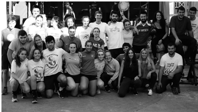
“Oraintxe hirugarren fasean gaude, baina jaiak ez ospatzeko eginiko hautuari eustea erabaki dugu”, esan digute Jai Batzordekoek. Argazkia, artxibokoa.

C ovid19-agatik izan ez balitz, festa giroan murgiltzen lehena izango zen urtero moduan Kalezar. Asteburu honetan bertan hasiko zituzten jaiak. Aurtengo ediziorako antolaketa lanak ere oso aurreratuak zituzten; baina osasun krisialdia tarteko, Jai Batzordeak ospakizunak bertan behera uztea erabaki du. Auzo giroa suspertzeko ahaleginetan segitzen dute ordea, lerrootan adierazi digutenez.