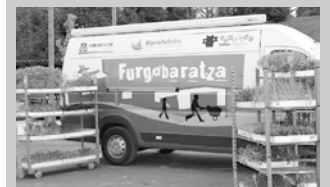
Uztailaren 20an Agerreazpin izango da Furgobaratza.