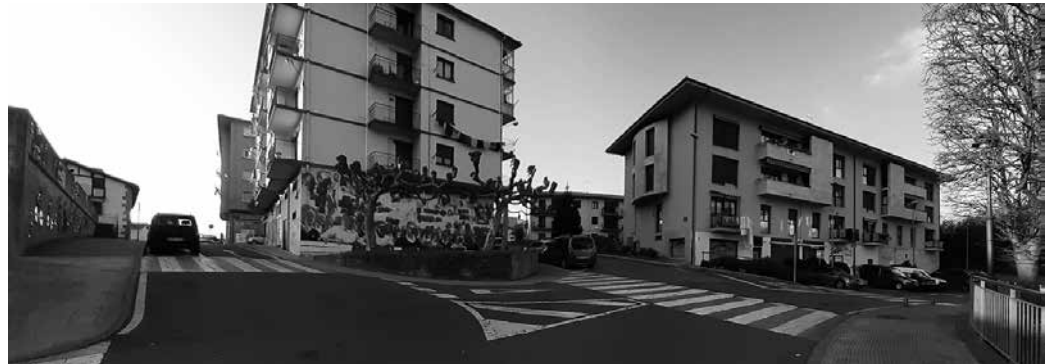
Oinezko bidea osatzeko lanek lau hilabete iraungo dutela aurreikusia du Udalak.

Lanen eremua bitan zatitu du Sasoi enpresak. Batetik, Artzabalgo parke sarreratik Kontzeju Zarra eta Zubiaurrenea kaleek bat egiten duten guneko zebra biderako eremua legoke. Tarte honetan, oinezkoei lehentasuna emateko lanak bideratuko dituzte. “Horretarako, Borda Berri kaletik behera doan kaleko espaloia,