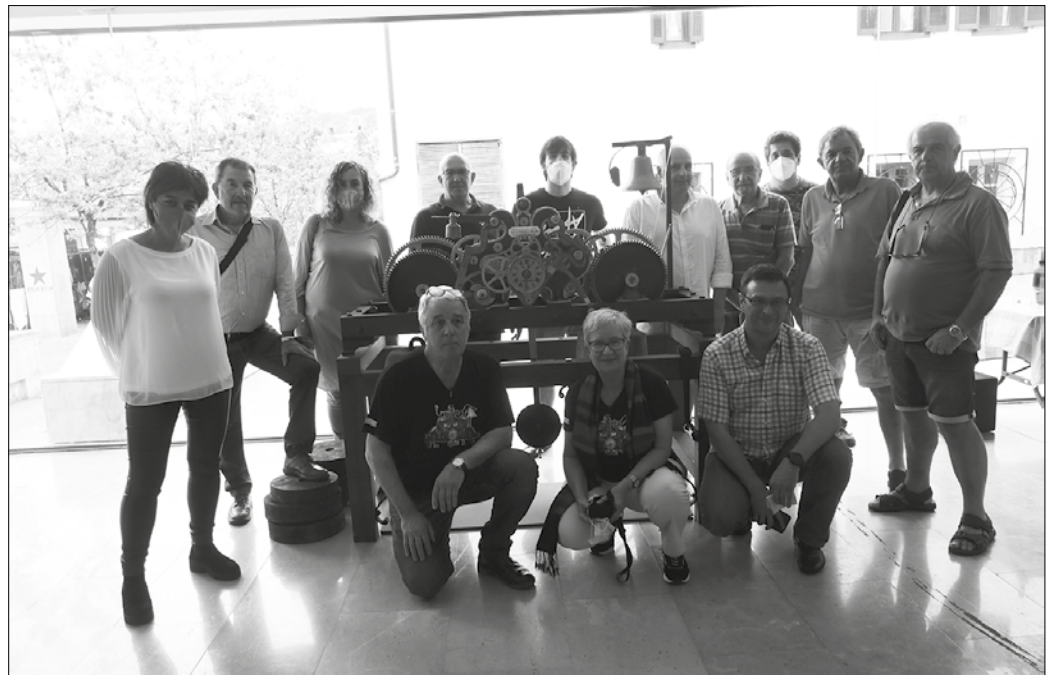
Duela lau urte hasi zituzten zaharberritze-lanak. Erlojua elizako kanpandorretik kontu handiz jaitsi, garbitu eta piezaz pieza desmuntatu zuten, “hurrenkera zehatz batean”.

“Patsadaz aritu gara, lasai”, zioten “ErlojERUAK” taldeko