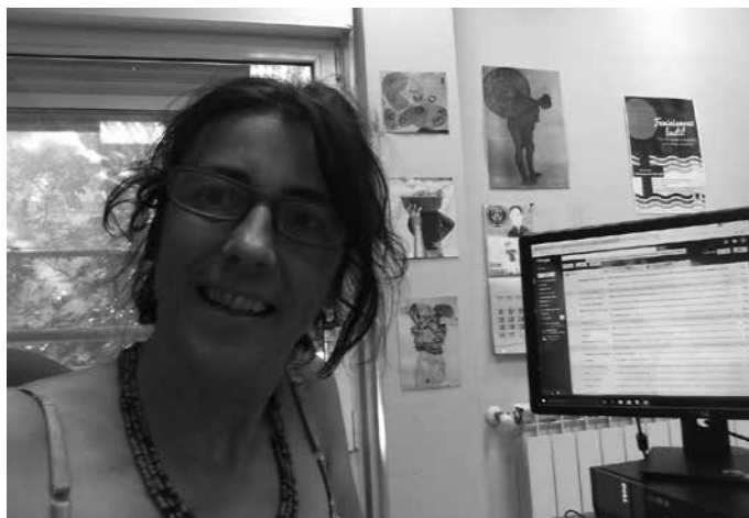
Urrats hau ematea zaila dela ulergarria izan arren, aholkularitza zerbitzuarekin hartuemanetan jartzera gonbidatzen dute.

Gunetik bertatik gogorazten dutenez, batzuetan "guri bakarrik gertatzen zaigula pentsatzen dugu, baina ez da horrela". Zailtasunak agertuz gero, "zailtasuna arazo bilakatu baino lehen" laguntza eska-