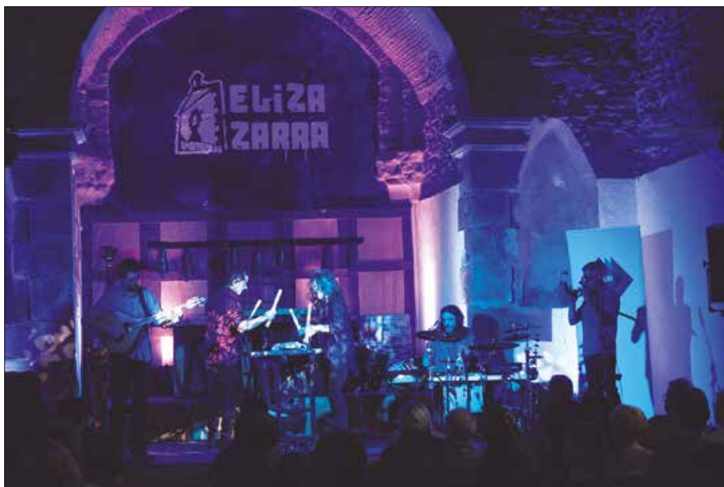
Abenduan plazaraturiko “Koklea” izeneko lan berria aurkeztu zuten Aginagako Eliza Zaharrean.

Oreka Tx taldeak lotura estua du udalerrri honekin. “Disko honen berezitasunetako bat da, Txokoalden sortua dela ia bere osotasunean. Hain zuzen