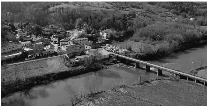
Lanok ez dute ibilgailuen joan-etorria baldintzatuko.

Aste hasieran abiatzekoak ziztuen lanok URA agentziak erria zeharkatzen duen zubia- ren bueltan. “Bioingeniaritza lanak egingo dituzte, hau da, egurrezko zutabe batzuk sartuko dituzte lurrian, higadurari