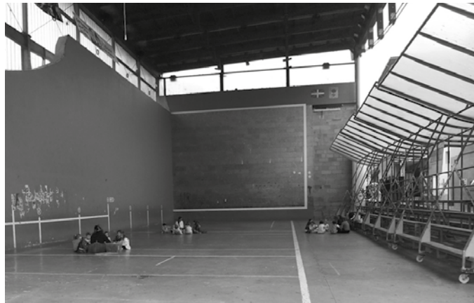
Protokolo zehatz bat landu du antolakuntzak, hainbat prebentzio neurriekin.

Bakoitzak bere txokoa du Kaxkoan goizean bildu, eguneko ekintzak burutu eta etxeratzeko. Asteroko irteerak aurten, Usurbildik atera gabe. Protokolo zehatz bat landu du antolakuntzak hainbat prebentzio neurriekin, eta covid19 kasurik diagnostikatuko balitz, nola jokatu jakiteko, Eusko Jaurlaritzak eremu hau kudeatzeko