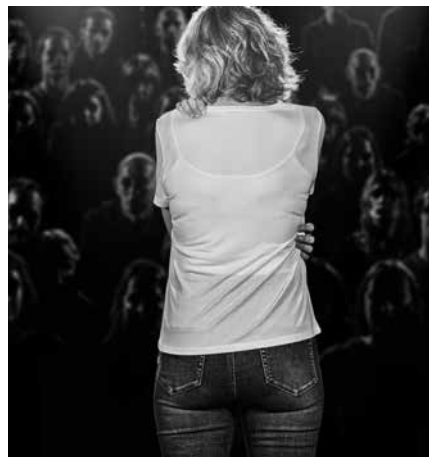
Kultur Biraren baitan, "Birritan bortxatua" izeneko antzezlan ikusteko aukera egongo da larunbat honetan Udarregi ikastolan.

de bortxaketako epaiketetan oinarritua, euskarazko 'fikzio-dokumental' estiloko antzezlan dugu".