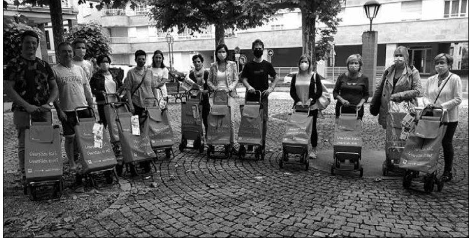
Orga hauek zuenak izan daitezke. Hurbilago merkataria eta ostalarien elkarteko kide bakoitzak bat zozketatuko du, uztailaren 24ra arte erosketak bertan egiten dituztenen artean.

Opari ederrekin gainera; albiste honi atxikitako Hurbilagoren argazkia duzue horren lekuko zuzena. Herriko merkataria hainbat ageri dira, erosketa-orga banarekin. Orga hauek zuenak izango dira laster; merkataria eta ostalarien elkarteko kide diren denda bakoitzak bat zozketatuko du, uztailaren 24ra arte erosketak egiten dituztenen artean. Erosketak egi-