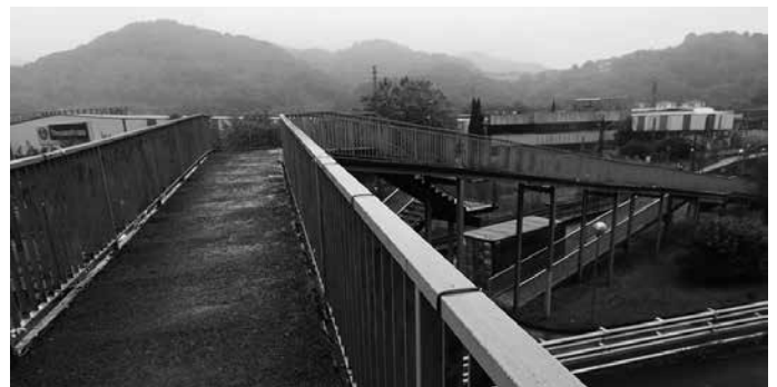
Uztailearen 20tik aurrera lau astez itxita egongo da zubia.

Zubiaren egitura eta zoladura konponduko ditu Gipuzkoako Foru Aldundiak. Uztailearen 6an hasitako lanek sei aste iraungo dute; lehen bietan zabalik izango da, “trabaren batekin ziur aski, eskilarak edo aldapa