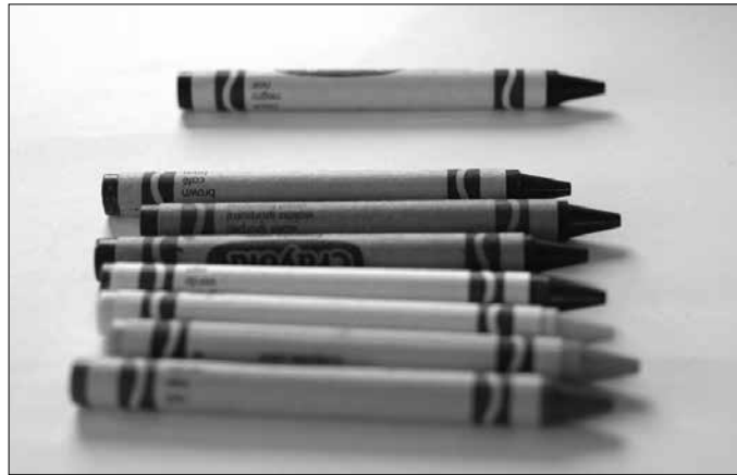
“Koloreek, euren existentziaz gain, testuinguruaren beharra dute, izateko”.