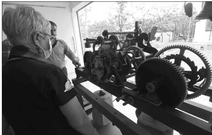
Erlojua gertutik ikusteko aukera duzue egunotan Sutegin.

Arbasoengandik datorren teknologia hura aldarrikatu zuten