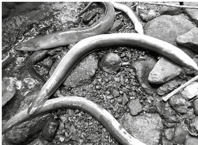
Fiskaltzak Arkaitzerrekako isurketa "ingurumenaren aurkako ustezko delitu bat dela uste du".

Anerrekak, Eguzkik eta Zubietako Lantzenek ohartarazi dutenez, "Zigor Kodearen 325. artikulua berariaz jasotzen ditu, ingurumenaren aurkako delituen artean, uren kalitateari edo animaliei edo landareei funtsezko kalteak edo kalte nabarmenak eragiten dizkieten edo eragin diezazkieketen legez kanpoko isuriak. Arkaitzerreka zeharo erreta geratu zen. Argien kaltetutako arrain-espezietako bat aingira izan