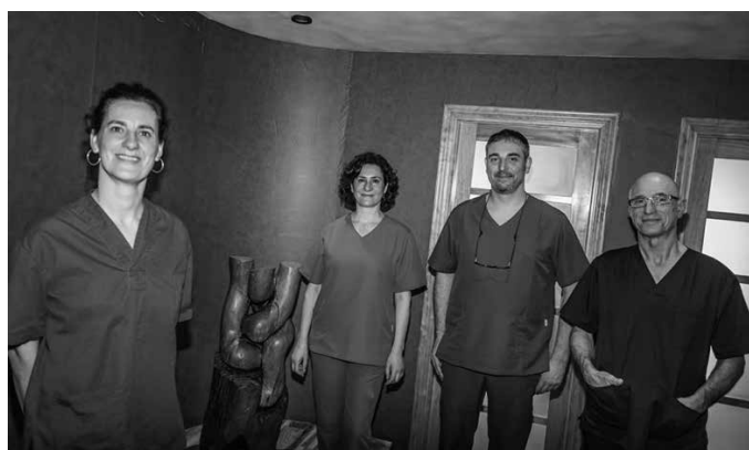
Lan askorekin ibili dira Hortz Kliniketan, “baina egoera lasaitzen hasi da”.

Guk, berez, beti aplikatu behar izan dugu protokolo bat desinfekzio eta esterilizazio arloan. Beraz, aldaketa handirik ez dugu sumatu. Hala ere, hartutako protokoloak askoz ere zorrotzagoak dira orain Covid19a-