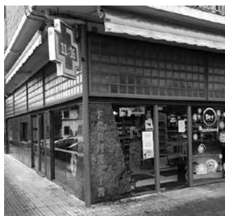
“Jendea lasai gerturatzen da. Ez dugu beldurra nabaritzen, ez behintzat martxoan eta apirilean bezala”.

Termometro digitalak eta infragorriak, adibidez. Gelak