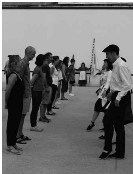
Zubietan sokadantza iragarri dute larunbat honetarako. 11:00etan hasiko da.