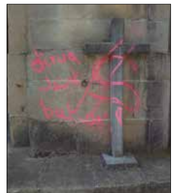
Salbatore elizaren kanpoaldean egin zuten pintada.

Urdaigakoa ez da kasu bakarra izan. Duela egun batzuk, pintada batzuk agertu ziren Salbatore elizako kanpoaldean.