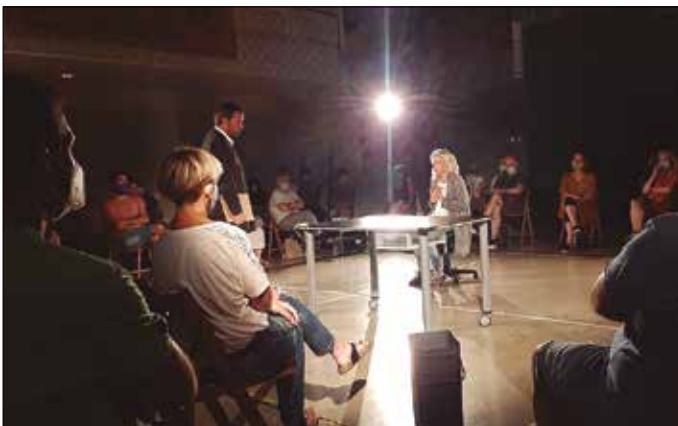
Birritan bortxatua antzezlan Udarregi Ikastolan eskaini zuten eta Skratx ikuskizuna, aldiz, Sutegin.