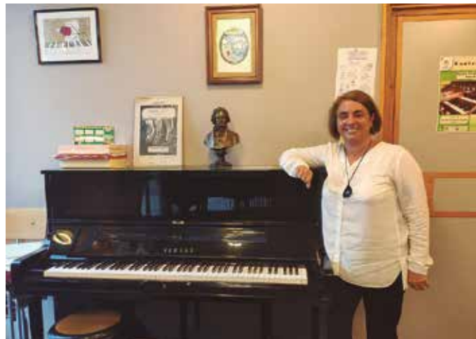
Kultur ikastaro ezberdinen artean, musika aukeretako bat da. Musika tresnetan sakontzeko aukera eskaintzen da eskualdean. Erreportajea: Aiurri.

Lehenik eta behin, musika eskola antolatzea behar du. Egun,