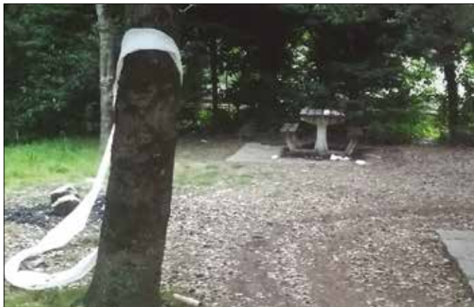
“Debekatuta dago sua egitea, eta, are gehiago, Usurbilgo ondare diren zuhaitz horien artean”, dio udal oharrak.

“Elkar zaindu gaitzen” Maskaren erabilera derrigo-