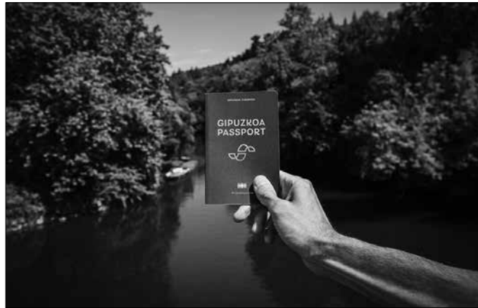
“Gipuzkoarrontzat, euskaldunontzat baldin bada, zergatik passport eta ez pasaporte?”.

Eta horrela jarraitzen du: “Itzuli gure tokirik esan-guratsuenetara eta aurkitu berriak, ikasi gehiago tokiko historiari buruz eta ezagutu gure pertsonaia ospetsuenak. Gure J. S. Elkanok burututako Munduari lehen biraren V. mendeurrenaren ospakizunean, bidaiia desberdin samarra proposatzen dizuegu. Desberdina, baina zirraragarria: izan zaitez bidaiari gure lurraldean! Gipuzkoa txikia da, baina oso aberatsa. Egitasmo eta jarduera ugari eskaintzen ditu, berezi egiten dutena. Agian pentsatuko