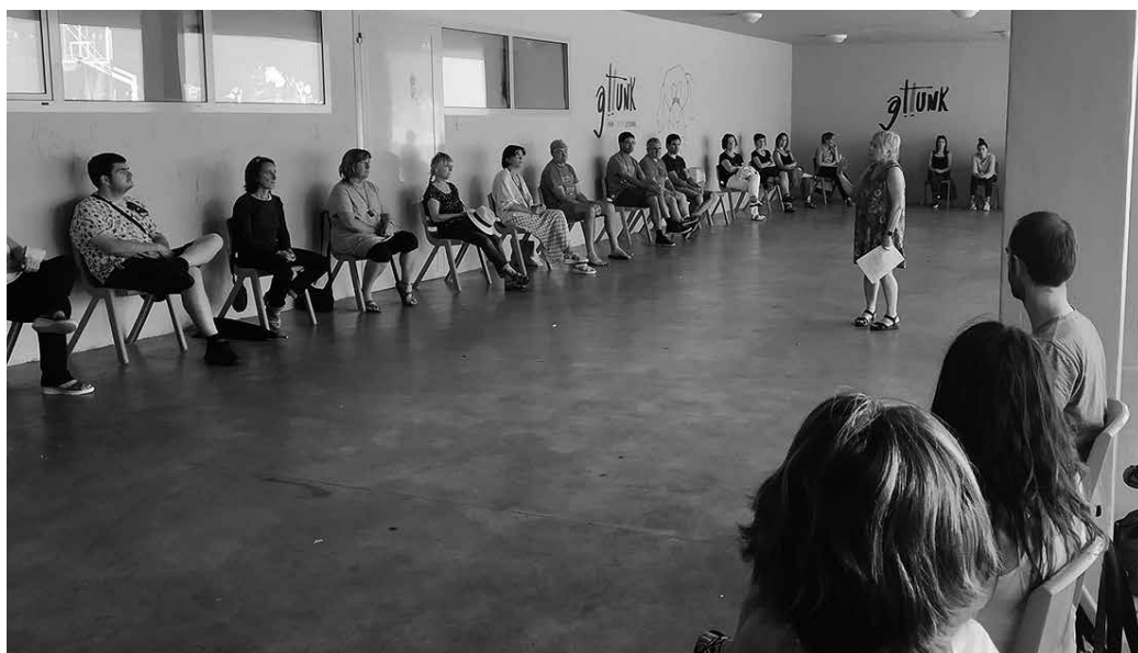
Ekainaren 30ean, Udarregiko langileak klaustroan elkartu ziren ikasturte berezi honi amaiera emateko.