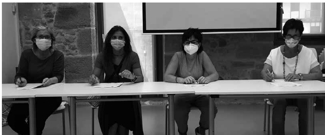
Guztira, 7.500 euroko udal dirulaguntza jasoko dute Etxean Nahi Ditugu, Odol-Emaleak eta DYA elkarteek.

Urtero moduan, Usurbilgo Udalak hitzarmen berritzea sinatu zuen aste hasieran Etxean Nahi Ditugu, Odol-Emaleak eta DYA-rekin. "Hirurak ere ongizate esparrukoak dira, eta urtero berritzen dituzte hitzarmen horiek, hiru taldeek gizarteari egiten dioten ekarpenaren garrantzia tarteko. Guztira, 7.500 euroko dirulaguntza banatuko dute hiru taldeen artean", berri eman du Udalak.