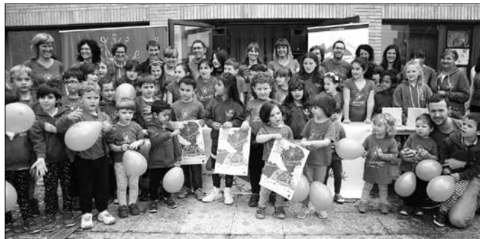
Irailaren 7an bueltatuko dira ikasleak eskolara. “Gu irailaren 1ean edo egoeraren arabera agian lehenago”, azaldu digute irakasleak.

Jakin nahiko genuke plan zehatz bat izateko, baina ezin dugu ezer aurreikusi ez dakigulako zer egoeratan aurkituko garen. Udan gertatzen denaren baitan ikusiko dugu zer egoerarekin topatzen garen irailan. Gure asmoa eta nik uste dut ikastetxe gehienena, presentziala izatea da. Irailaren 7an hasiko dira ikasleak. Gu irailaren 1ean edo egoeraren arabera agian lehenago. Gero ikusiko