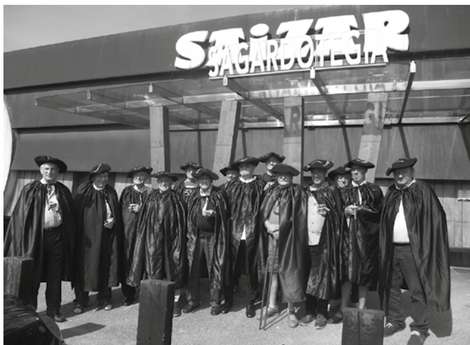
Bazkaritara joan nahi duenak aurrez sagardotegira deitu beharko du.

Urtero moduan abuztuko azken ostegunean bilduko dira Saizar Sagardotegian, abuztuaren 27an. 14:00etan jarri dute biltzeko hitzordua. 1997az geroztik egin bezala, kofradekide berria izendatuko dute laiaren laguntzaz kapa beltzak jantzita, hurrengo urtekoa iragarztearekin batera. Guztia, baba beltz txikia elikagai nagusia izango duen bazkarian. Bazkaritara joan nahi duenak lekua hartzeko aurrez sagardotegira deitu beharko du, 943 364 597 telefono zenbakira.