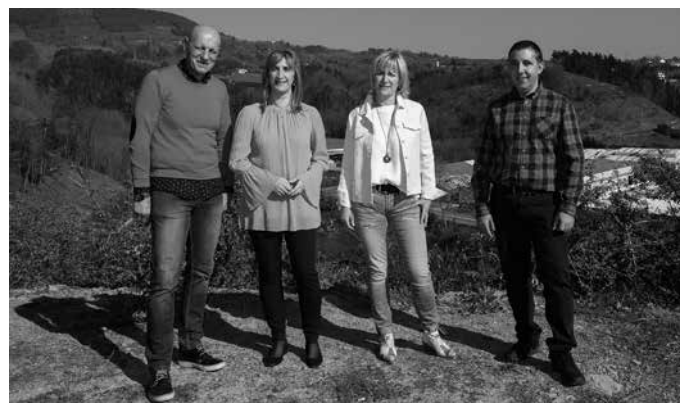
Usurbilgo EAJren hitzetan, “lanean jarraitzeko beharrezko bultzada jaso dugu”.

“Usurbilen jasotako 659 botoekin eta Euskadi osoko