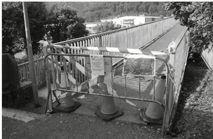
Lau astez itxita egongo da pasabide hau.

Santuenea eta tren geltokia herri erdigunearekin lotzen duen Etxealdiako zubiaren egitura eta zoladura konpontzen ari dira. Lanok tarteko, lau astez itxita egongo da pasabide hau. Honenbestez Bizkarreko edota Zumartegi industriaguneko pasabidea baliatu beharko da.