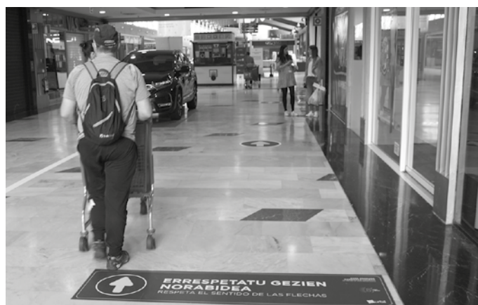
“Ingurumenari buruzko sentsibilizazio kanpainak egiten ditugu urtero”.

Iraunkortasunari laguntzen dioten jarduerak egiten jarraitzen duela dio Urbilek. “Azken urtean ingurumenarekin lotutako hogeita hamar ekimen baino gehiago egin