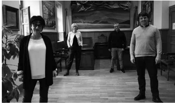
Hainbat lehentasun onartu dira udaletxean ordezkatuta dauden alderdien artean.

130 neurriak bertan bilduta bazeuden ere, osatzeko zegoen. “Une oro neurri bakoitza zein egoeratan dagoen azaltzea falta