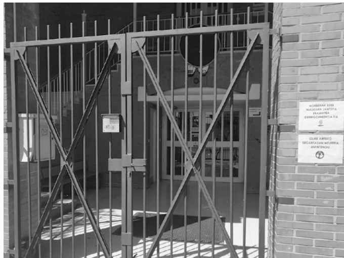
Agur jaien eta azken bileren hilabetea izaten da ekaina, baina bizi dugun osasun krisialdiak planak aldarazi dizkie ikastolan.

Balantzaren beste aldean etxealditik ikasitakoa dago. “Gure arteko harremanak,