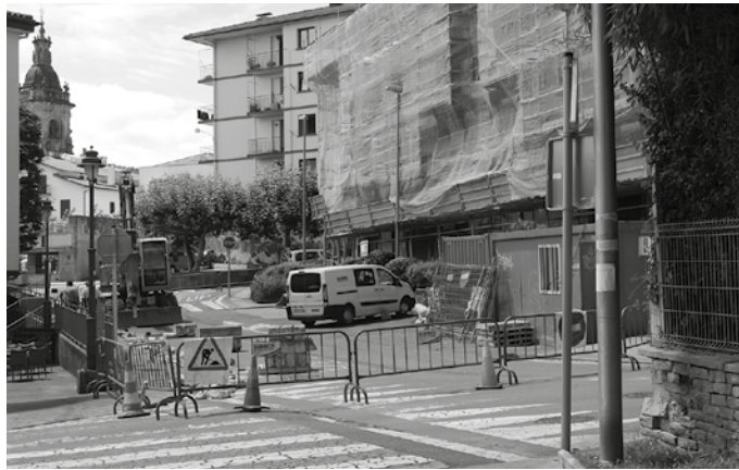
Hurrengo asteotan, lanok eragozpenak eragin ditzakeela ohartarazi du Udalak.

Bordaberri kaleko espaloia, Artzabalgo parke sarrerakoa eta Zubiaurrena kalekoa batuko dituzte lanekin, handitu, eserleku eta zuhaitzak jarri eta gune hau norabide bakarrekoa bilakatu. Bordaberri kaletik soilik sartu ahalko dira ibilgailuak. Hortik Kontzeju Zarra kaletik gora Mikel Laboa plazarako bideko oinezkoen konexioa