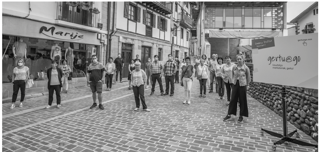
Gertuago kanpaina aurkeztu zeneko argazkia duzue hauxe. Bigarren txandan 20 saltoki gehiago batu dira.

Udalak bonuen bigarren sorta bat ateratzea erabaki du, saltoki gehiagorekin. “Lehenengo aldia bezala, Udalak bere gain hartuko du herritarrek izango duten %20ko deskontu hori”. Bigarren txanda honetan, elikagaien dendak eta tabernak gonbidatu dituzte. Lehengo 30ez gain, beste 20 saltoki inguru izango dira orain.