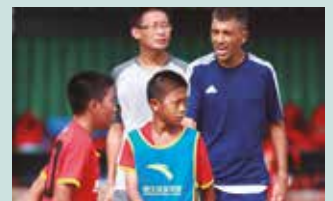
Harrobian aritzen da lanean.

Orain ez da erraza bertara joatea. Bisatu berezi bat behar