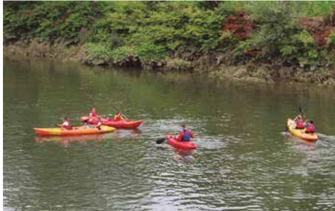
Udajolaseko LHko gazteak Txokoalden izan ziren aurreko astean.

Usurbila etorrita, uztailearen 30era arte antolaturiko Udajolas bertan behera utzi behar izan genuen. Udalak Eguneko Zentroa ere ixtea erabaki zuen. Bestalde, aste hasieran abiatzekoak ziren udako ikastaroak ere bertan behera geratu dira. “Abuztuan ere eskaintzekoak ziren ikastaro horiek, baina egoeraren arabera baloratuko dute eskaini edo ez”, ohartarazi du Udalak. Erabakiok “prebentziozko eta behin-behineko