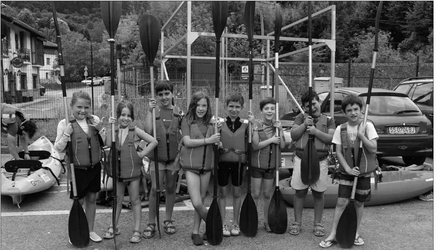
Udajolaseko gaztetxo hauek padel-surf egiten aritu ziren aurreko astean. Uretara sartu aurretik atera genien argazkia.

Udajolaseko gaztetxoak Txokoalden izan ziren uztailearen 16an, padel-surf egiten. Begi Bistan enpresako begiraleekin batera