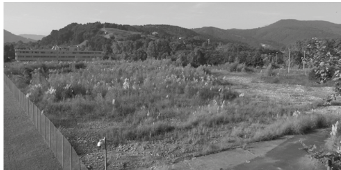
Errekerimendua “ez da proiektuaren aurkakoa edo egitasmoa atzeratzeko”. Eduki batzuk argitzea xedez egin du Usurbilgo Udalak.

Argibideak eskatzeko xedez Errekerimendua “ez da proiektuaren aurkakoa edo egitas-