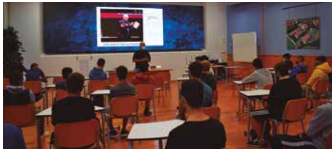
Goizeko 8:00etan gelan sartzen direnean, ikasle denei tenperatuta hartzen zaie.