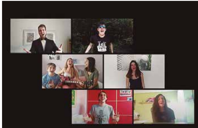
Plataforma digital bat sortu dute eta hilabete amaieran aurkezpen ekitaldiak egingo dituzte herri herri. Irudia, artxibokoa.

Isolamenduak ordea, argi utzi zuen artea eta kultura “lehentasunezko alderdiak direla gure bizitzetan, sorkuntza, argi izpi bilakatu zen bakardadez jositako zingira ilunean. Eta, gure agintariak, hortaz ohartu