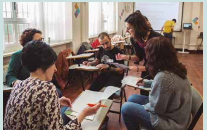
Ostegun honetan, Hernaniko Biteri Kultur Etxean.

Tokia: Biteri Kultur Etxea, Hernani (Nafar kalea 18) Ordua: 9:30etik 12:30era. Izen-ematea zabaldik da: https://labur.eus/U55hd