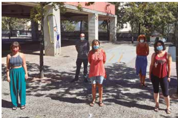
“Gure herrian jatorri eta kultura aniztasun ezberdina dugunon arteko gertutasuna eta elkarbizitza hobea lortze aldera, ekintza desberdinak diseinatu eta adostu nahi dira”.

Prozesu honen helburua, elkarbizitza sustatzea litzateke, beti ere jatorri aniztasuna aintzakotzat hartuta. “Elkarbizitza horren egoerari buruzko