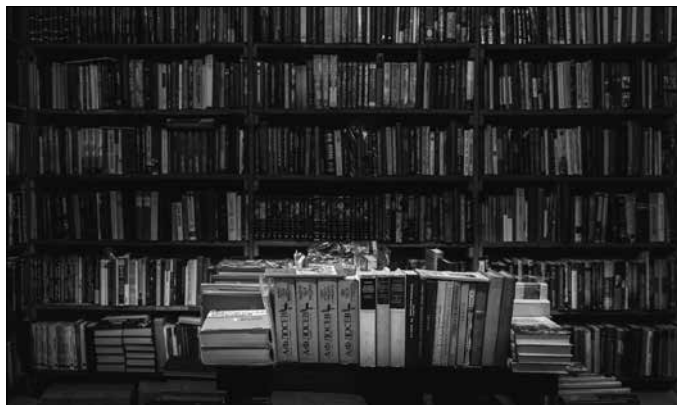
“Harrokeria ariketa litzateke esatea liburu haien esaldi guztiak buruz dakizkiela”.