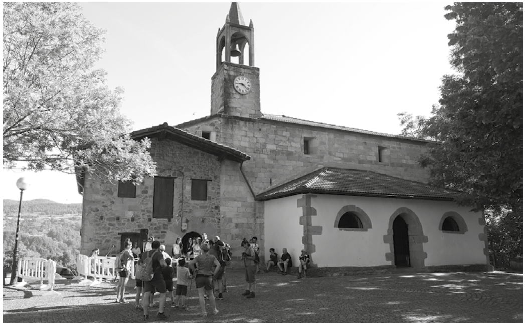
Urdaiaga ezagutzeko aukera izango da urriaren 18ko ibilaldian.

“Inguruan zeuden zetak, burdinolak, eta baserrien historia ezagutzeaz gain, Irisasi-Andatza eremutik ibilbide zoragarri bat egiteko aukera izango da”, urriaren 18an. Igandez, goizeko