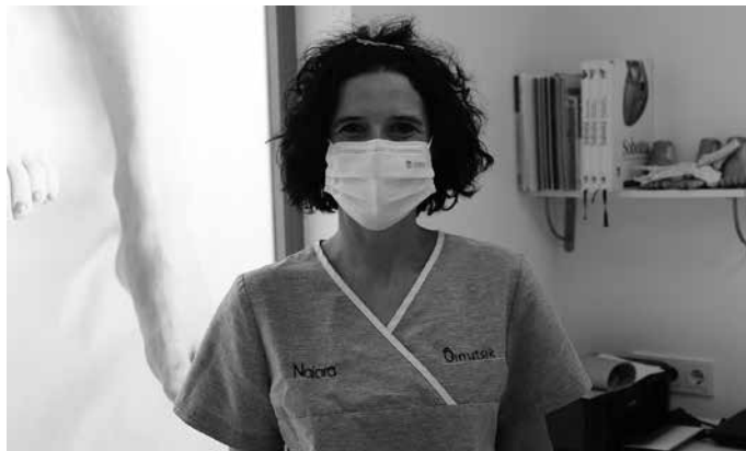
“Oso gustura nago Gertuago egitasmoarekin. Bezero bati bonu bat duela esatea beti da lagungarria”.

Larrialdi kasuekin oso gutxi lan egin dugu. Diru sarrerarik ez, gastuak denak. Larrialdietarako zabalik ginela kontuan hartzen zutenez, laguntzetatik kanpo geratzen ginen. Gero hainbat sanitario eremuetako langileak elkartu ziren indarra egin eta laguntza jasotzeko, bestela bideraezina zen. Bezeroei dagokienean, konfinamendu ostean ikusi da oinek asko sufritu dutela berriz martxan jartzean. Postura aldetik