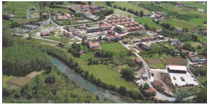
Zubietarrekin eginiko ekarpenak Usurbilgo HAPO-an txertatuko dira eta plangintza honek “hurrengo 10-15 urterako Usurbil marraztuko du”.

Plangintza honen lanketaren baitan, “herriko hainbat toki-