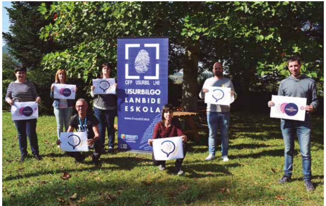
“Klaustroak euskaraz egiten dira orain”, azaldu digute Usurbilgo Lanbide Eskolako ordezkariak.

Sentsibilizazio arloan, oso ondo etorri zen Euskaraldia-rena. Bestetik, azken urteotan gauzak aldatu egin dira