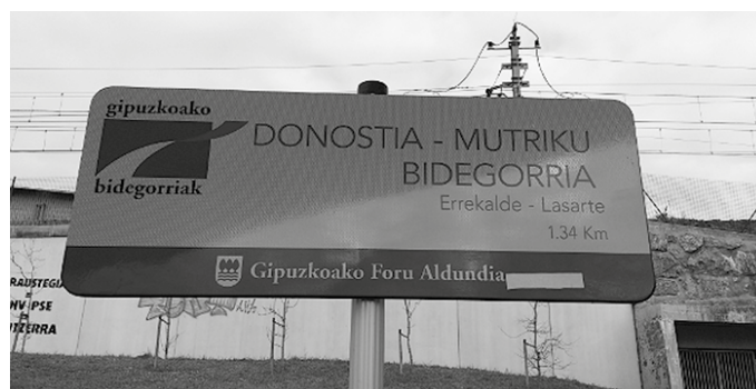
“Planaren arabera, Donostia-Mutriku ibilbideak datorren urterako bukatzeaz egon behar zuen”, dio Eguzkik. “Alabaina, Lasarte eta Txikiardi bitarteko tartea ari gara orain. Atera kontuak”.

“Lasarte-Txikiardi bidegorria behingoz eraikitzen hasiko direla albiste ona izango da” dio Eguzki Talde Ekologistak. “Baina albistea ezin dugu ontzat hartu, baldin eta kontuan hartzen badugu Lasarte-Txikiardi bidegorria 2017rako amaituta egon behar zela eta Donostia-Mutriku ibilbidea, berriz, 2021erako oso-oso aurreratua”, hala dio Eguzkik idatzi baten bidez.