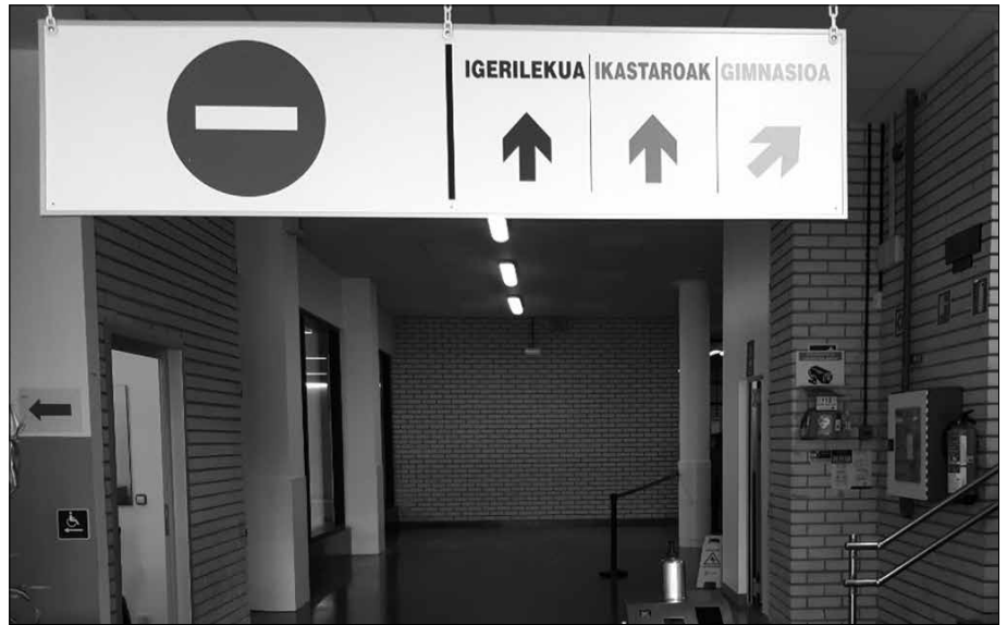
Erabiltzaileak hiru multzotan banatuak dituzte, “igerilekuetakoak, ikastaroetakoak eta gimnasiokoak”.

Txandak berrantolatu dituzte. Erabiltzaileak hiru multzoetan banatuak dituzte, “igerilekuetakoak, ikastaroetakoak eta gimnasiokoak”. Bakoitza kolore, aldagela eta komun bereziak izango dituzte. “Taldea bakoitza modu independentean ibiltzea izan dute helburu. Kartelak berriak eta koloretako markak jarri dituzte lurrean, bakoitzak nondik joan behar duen eta zein espazio erabil ditzakeen jakin