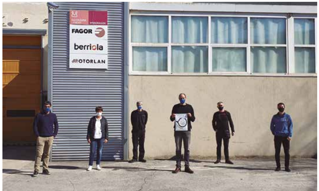
“Lantokian Arigune desberdinak izango ditugu, zonaldeka banaturik. Eta guztia bermatuta eta adostuta dago”.

Lantegian bertan Euskaraldiaren aurkezpena egin genuenean azaldu genuen bezala, ulermena bermatuta egotea eta langileen onespena izatea. Lantokian Arigune desberdi-