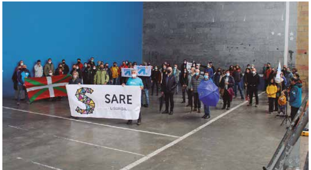
Salbuespenezko espetze politika bertan behera uztea exijitzeko mobilizazioa egin zuten urriaren 3an Usurbilgo frontoian.

Hurrengo urratsa, urriaren 24an Donostian egingo den manifestazioa eta herritarrek eraikiko duten mosaikoa "Resolution". Mundu zabalera he-