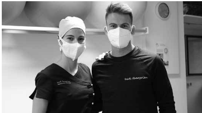
“Jendea lasai dator hona, badakielako protokoloak betetzen direla”.

Telelana egiten ari ziren askok deitzen zigun lanean ote ginen galdetzeko. Inpotentzia handia sentitzen genuen. Artatu