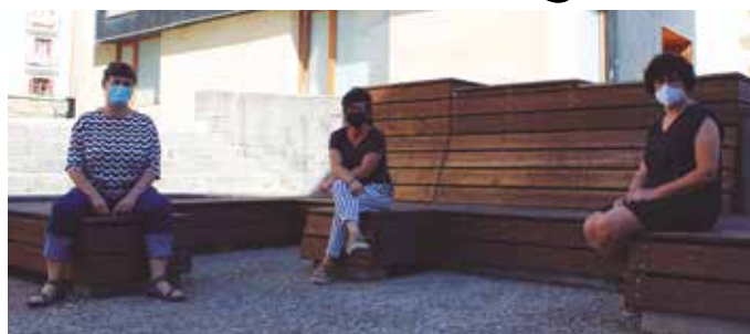
Idazketa fasean da Hiri Antolamendurako Plan Orokorra (HAPO).

Bi kanpo aholkularitzok lanean dira, azterketa lanak urte amaierarako bukatzea aurreikusia dute. Helburu argia dute; azterlanok aintzakotzat hartuta, euskara eta genero ikuspegia Hiri Antolamendurako Plan Orokorrean (HAPO) txertatzea. Usurbilgo Udaleko alkate