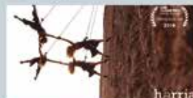
HARRIA HERRIA Dimegaz Kultur Elkarte