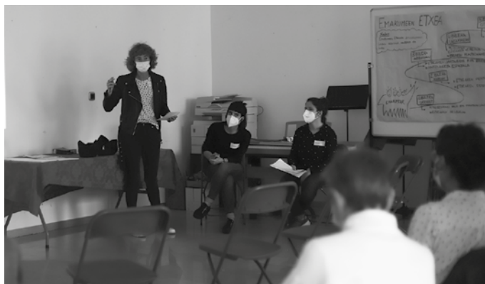
Aurreko ostegunean izan zen lehen bilera.