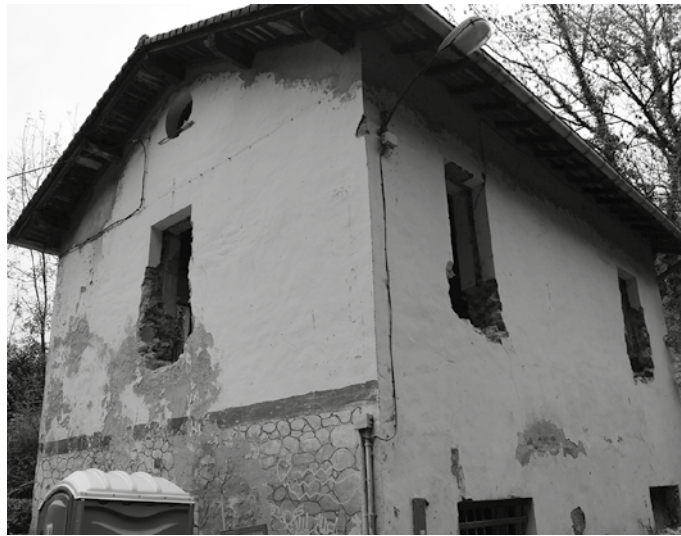
Lanak lau hilabeteko tartean amaitzea aurreikusten dute.

Hala erabaki zuten duela urtebete, txokoaldetarrek Usurbilgo Udalak antolatuta eta Hiritik