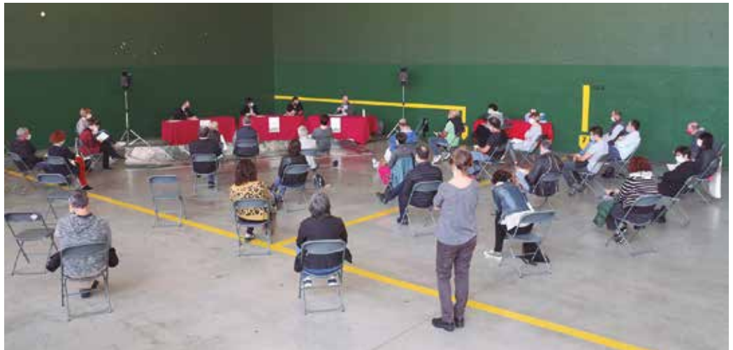
Zubietarrek eginiko ekarpinak Usurbilgo HAPO-an txertatuko dira eta plangintza honek “hurrengo 10-15 urterako Usurbil marraztuko du”.

Prozesua Zubietako frontoian garatuko da, beti ordu-tegi berdinean eta prebentzio neurriak hartuta. Pilotalekura sartu eta irtetea, ibilbide zirkular moduan egingo da, antolakuntzak egokitutako seinaleei erreparatu beharko zaie. Eskuak garbitzeko gela izango da, musukoa jantzita joan beharko da. Segurtasun distantzia mantenduta egingo dira saioak.