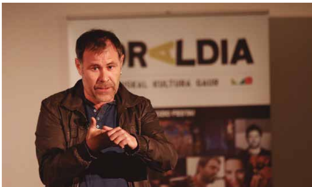
Larunbat honetan Zaldi urdina antzezlanaren eskaintzera hurbilduko da Sutegira.

Larunbatean, Jexux Artze Kultur Elkartearen eskutik etorriko zarete Sutegira. Maiatzeko egitaraua bertan behera utzi