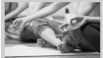
Astelehenetan Kaxkapen batzen dira.

Astelehenetan 18:00-19:30 artean Kaxkapen. Izen emateko deitu telefono zenbaki honetara: 647 587 258.