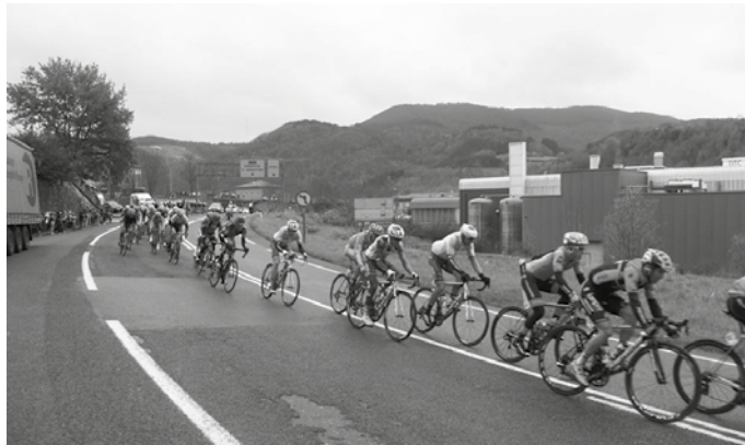
Irunetik eguerdian abiatzekoak dira. Orereta, Pasaia eta Donostia zeharkatu ostean, Txikierritik helduko dira N-634 errepidean barrena.

Covid19-aren ondorioz, Espainiako Itzulia txirrindularitza txapelketa abuztutik urrira atzeratu dute, baita abiapuntua aldarazi ere. Herbehereetan ospatze-koak ziren lehen hiru etapak, hurrengo Euskal Herrian. Baina azkenean Irun eta Arrate lotzekoa zen 173 kilometroko laugarren etaparekin abiatuko dute. Urriaren 20an ospatuko da eta bidean Usurbildik igaroko dira txirrindulariak.