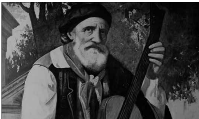
“Amaiera tristea izan arren, ezin da ukatu bere ekarpen oparoa. Artista peto-petoa izan zen eta oso herrikoia”.

19 urterekin utzi zuen Euskal Herria “bizitzaren onenean”, bere esanetan. Paris, Lille, Lyon bisitatu zituen. Frantsesa ikasi zuen, frantses idazleak irakurri, kantua ikasi du eta uzten zioten toki guztietan kantatzen zuen eta