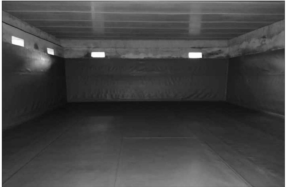
Ura ontzitik kanpo ari zen isurtzen. "Xafla horiekin, ur hori galtzea saihestuko da" dio udalak.

Aldaketa hau, ur horniduran egiten ari diren hobekuntza lanen baitan kokatzen du Udalak. "Herriarrek ez dute nabarituriko euren egunerokoa,