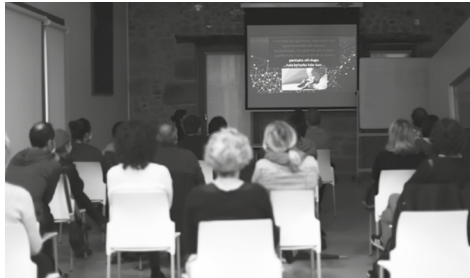
Egun, edonon aurki ditzakegun uhin indartsuen eraginak aztertu eta proba ere egin zuten elektrokutsadura neurtzen duen aparatua baten bidez.

Gaia interes bizikoa izan zen usurbildarrentzat, Potxoeneak egungo egoeran har ditzakeen 23 pertsonak bildu baitziren. Egun, edonon aurki ditzakegun uhin indartsuen eraginak aztertu eta proba ere egin zuten elektrokutsadura neurtzen duen aparatua baten bidez. Planetako bizitzarengan eragin larriak sor ditzakete uhinek, 3G eta 4G