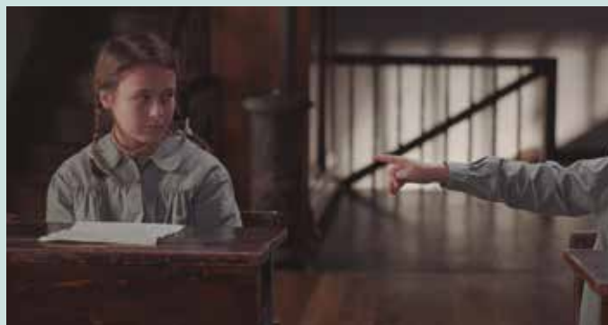
Josu Martinezen Anti laburmetraia ikus ahal izango dugu urriaren 25ean.

Ohi bezala Euskal Herrian barrena eta atzerrian zehar bidaiatuko duen 17. ediziora heldu den Laburbira buel-