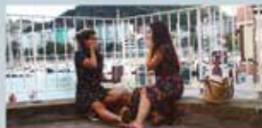
URAK DAKARRENA Marilyn taldea