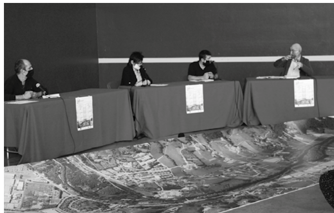
Aurreko astean abiatu zen “Guk Zubietan zer” parte-hartze prozesua.

Urrunago joan gabe, urte hasieran legealdiko lehentasunak finkatzeko parte-hartze saioa