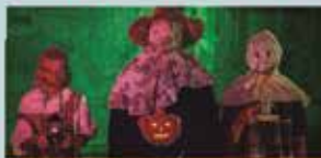
GAU BELTZA Euskaltzalen Topagunea

SARRERA DOAN. Gonbidapena usurbilkultura.eus plataformaren bitartez hartu behar da.