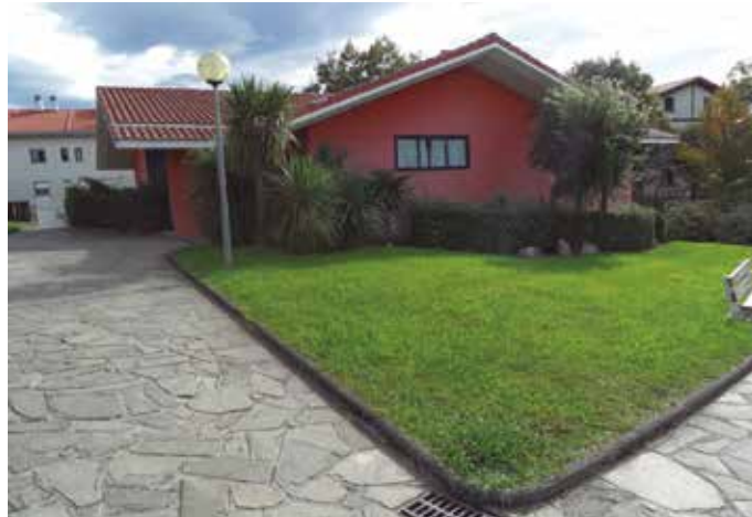
Duela aste batzuk udalerririk honetan atzematen ziren kasuak, kasu isolatuak zirela dio udalak, "elkarrekin zerikusirik ez dutenak".

7 egunetan 100.000 biztanleko kutsatze tasak nabarmen gorantz egin zuen aste horietan. Iraila hasieran, 15,83koa zen, iraila amaieran 569,80koa izatera heldu zen. Urriaren 6an, 126,62raino jaitsi zen berriaz.