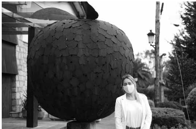
“Botilari ari gara garrantzia ematen sagardotegian, eta hala jarraituko dugu txotx denboraldia hasi arte behintzat”.

Sagardotegia itxi egin behar izan genuen, baina edari salmentetan ere lan egiten dugu, eta behintzat horri eusteko aukera izan genuen. Supermerkatu eta saltoki handiei saltzeko beharra geneukan, eta bide horri heldu genion. Partikularrei ere saltzen jarraitu genuen, elikagai enpresei ere bai,