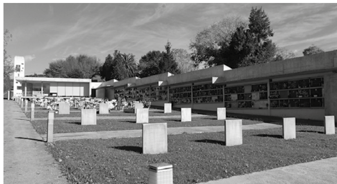
Udalak plazaraturiko aholkuei jarraiki, batek baino gehiagok aurreratu egin zuten bisita eguna. Ez zen jende pilaketarik izan azaroaren lehenean.

Beste urteetan, azaroaren lehenean jendez betea egon edo etengabeko joan etorriak biziko zituen hilerria hutsik aurtengoan. Lore-sortaz apaindua bai baina primerako eguraldia zen arren, bisitari gutxi. Usurbilgo Udalak plazaraturiko aholkuei jarraiki, aurreko egunetan bisitak egingo zituen batek baino gehiagok. Izango zen baita bertaratzeko modurik ez zuenik, edota prebentzio gisara, Covid-19aren eraginez aurtentean joateari utzi dionik ere bai. Lore saltzaileak izan dira neurri