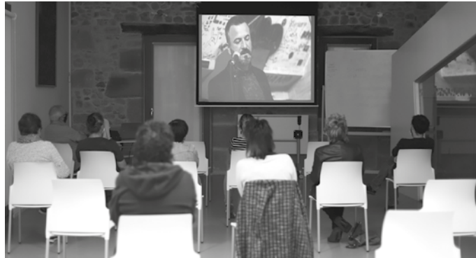
Etxetik atera ezin zuten horiek ere Internet bidez jarraitu ahal izan zuten ikuskizuna.

Ez Usurbilen bakarrik, Euskal Herriko beste hainbat txokotan ere jarri zuten proiektzioa. Etxe-