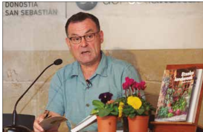
Jakoba Errekondok Etxeko landareak (Argia) izeneko liburuak plazaratu berri du.

Duela bost urte Bizi Baratzea (Argia) liburuak plazaratu zuen “eta arrakasta itzela izan zuen”, diote Argiakoeak. “Baratzearen entziklopedia modura