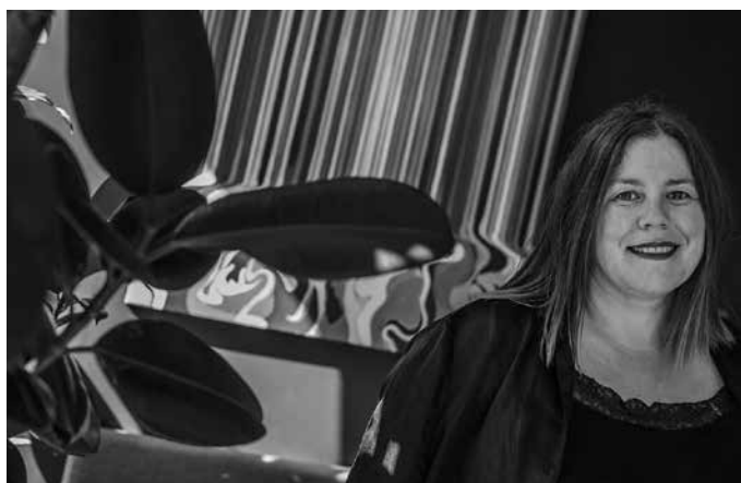
“Maiatzean itzuli ginen berrira lanera eta segituan hartu genuen betiko martxa”.

Zein neurri hartu behar izan dituzue aurrera jarraitu ahal izateko?