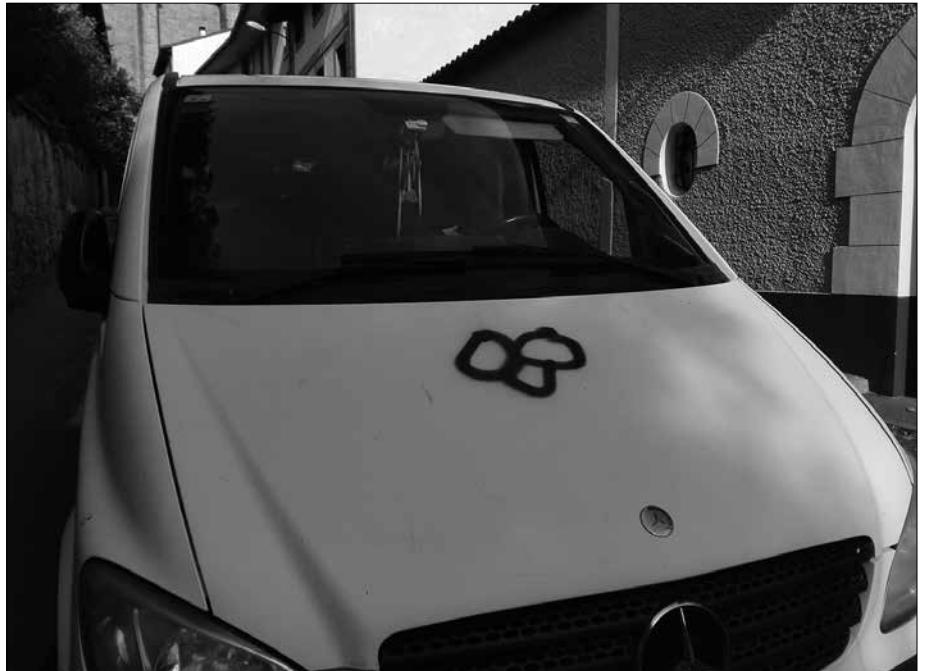
Pintadaz gain, marraz egin zizkioten furgonetan “zerbait zorrotzarekin”.