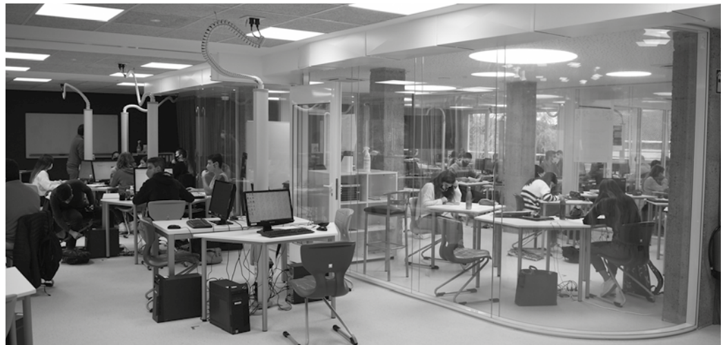
Izen-ematea zabalik da. Ikastaroak azaroaren 30etik aurrera eskainiko dituzte.

Elektrizitateari lotutako ikastaroak ere eskainiko dituzte: “Oinarriko Elektrizitatea, Hidraulika eta IOT eskainiko dira. Instalazio eta Mantenua arloan berriz, hainbat ikastaro egiteko