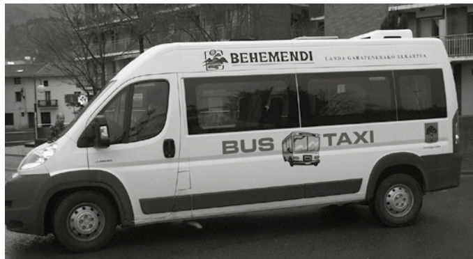
Covid-19 aurreko garaian bezala, astelehenetik ostiralera bost txandatan eskainiko du zerbitzua Taxibusak.

“Erabiltzaileei zerbitzu era- ginkorragoa ematea da hel- burua: batetik bestera joateko denbora gutxiago beharko dute aurrerantzean”, iragarri dute Usurbilgo Udaletik. Covid-19 aurreko garaian bezala, aste- lehenetik ostiralera bost txan- datan eskainiko du zerbitzua Taxibusak. Orduotan hasiko dituzte txandok: 07:30ean, 10:30ean, 13:30ean, 15:30ean eta 19:00etan. 70 minutu be- randuago amaituko dituzte. Tarte horretan, beti Kaxkotik abiatu eta udalerrir erdigunera hirutan itzuliko da. Ez baita ahaztu behar, Behemendik eta Udalak sustaturiko egi- tasmoak, landa eremua herri kaxkoarekin lotzea, eta herri