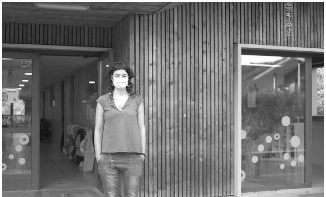
Ikasturte hasiera “oso ona izan da. Haurrak oso pozik zeuden elkarrekin zeudelako berriz ere”.