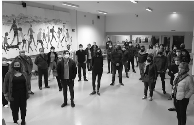
Ohiko prebentzio neurriak hartuta herri bizitzari elkarlanean eusteko apustua egin dute irudiko protagonistek.

Ia bi aste daramagu alarma-egoeran, eremu gorrian, hainbat neurri murriztaileren (etxeratze-agindua, herritik ezin atera, 6 laguneko bilkurak...) eraginpean. Testuinguru zail honetan, martxoko “lehen olatuan” gertatu zena ez dute errepikatzerik nahi, albiste honi atxikia duzuen argazkiko protagonistek; aurreko astean, Udarregi Ikastolan egindako herri bileran parte