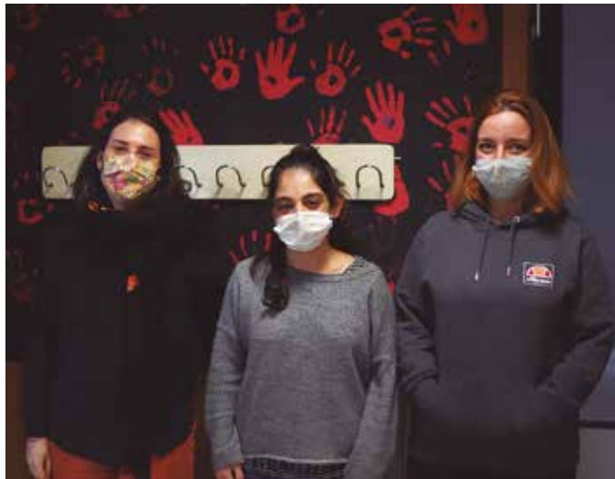
Gaztelekuan duela aste batzuk ekin zioten ikasturte berriari.

Gazteei jarri diegun eguneroko zeregina da eskuak gel hidro-