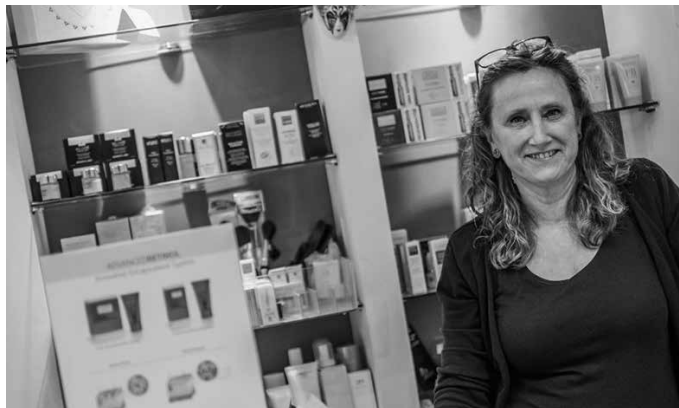
Konfinamendua amaitu zenean, “jendearen erantzuna oso positiboa izan zen”.