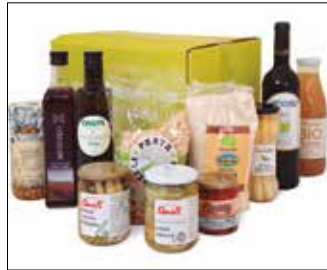
Hiru saski daude aukeran: Berdea (65 euro), beltza (55 euro) eta zuria (75 euro). Eskaerak egiteko epea azaroaren 12an amaituko da.

Errigorak hiru saski prestatu ditu aukeran. Prezioan ere bada alderik. Garestixeago dira aurrean. Erabaki horren atzetean bada arrazoi sendo bat. Covid-19a tarteko, “ez dira garai onenak Herri Urratsak, Korrikak edo Sortzenen jaiak ospatzeko, baina izan bitez oparoenak elkartasunari ekiteko”. Prezioaren zati bat hiru entitate horientzat izango dela, alegia.