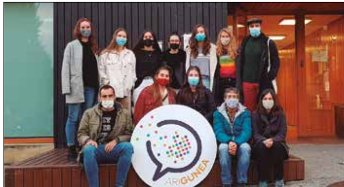
Orbeldi Dantza Taldean ere ariguneak osatu dituzte. Bestetik, Ahobizi eta Belarriprest gisa izena emateko epea azaroaren 19ra arte egongo da zabalik.

“Lekua, gaia edo egoeraren araberak erabakitzen dut euskaraz