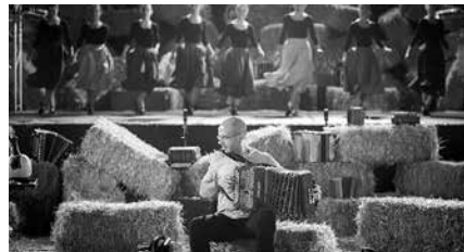
Korrontzi taldearekin arituko dira Orbeldikoak.