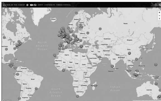
“Sounds of the forest deritzon proiektua ezagutu dut orain dela gutxi. Mundu osoko zuhaitzi edo basoen soinuak biltzea du helburu”.

Inor gaixotzen hasi aurretik ordea, bada ia gu guztiok zaugarriagoak izan gareneko garai bat. Munduratu eta inguruak bildu gintuen momentu huraxe, hain zuzen. Beraz, arazoaren errora joanez gero, premiazkoa litzateke begirada haurtzaindegi edota jolasguneetara bideratzea. Izan