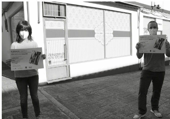
Gertu txartelarekin ordaindu eta trukean 50 euroa arteko hobariak irabazteko aukera izango duzue azaroaren 30era arte.

Erosketak guneotan egin, erosketok Gertu txartelarekin ordaindu eta trukean 50 euroa arteko hobariak irabazteko aukera izango duzue. Hurbilago Usurbilgo ostalari eta