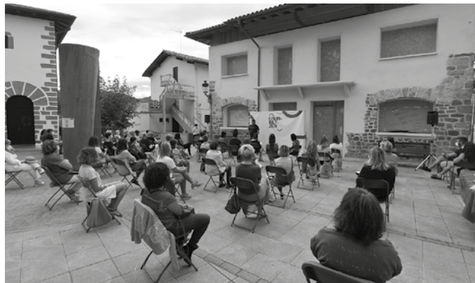
Covid-19ak eragindako zailtasunak tarteko, Pelaioeneari lotutako saioa abenduaren 3ra atzeratzea erabaki dute.