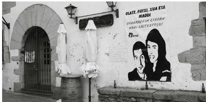
Horren ordez, "pultsera jarriko omen diote datorren astean", berri eman dio NOAUA!ri Usurbilen Nahi Ditugu bilguneak.