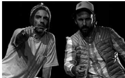
Sarrerak Lizardin edo NOAUA!n eskura daitezke.