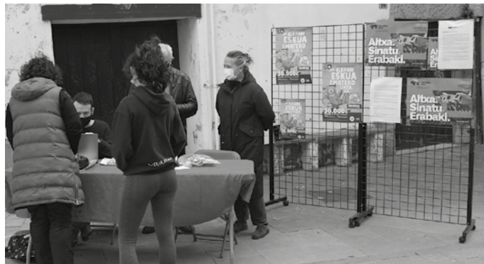
Tripontzia saltzeko postua plazara ateratzen hasia da Usurbilgo Gure Esku taldea.

Erreferendumaren alde sinatu edota Tripontzia, urteroko Gure Eskuren loteriarako txartelak eta taldeari laguntza emateko zenbait material ere erosi; tartean, 2 euroko eskumuturrekoa.