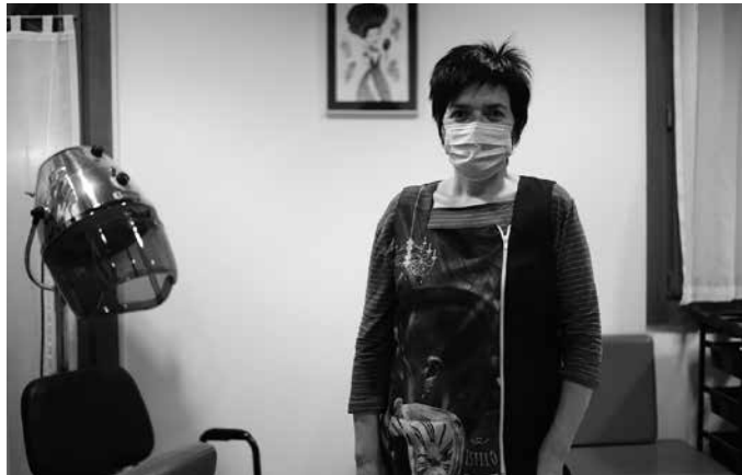
“Azken aste hauetan jende gehiago etorri da ilea moztera, badaezpada”.

Nahikoa normaldu dela bai esango nuke, baina ez erabat. Ez da berdina. Nik uste dut dena erabat normalizatu arte, eta pandemiaren kontua iragan bilakatu arte, ez garela erabateko normaltasunera itzuliko, eta gerora ere nire dudak dauzkat. Lehen noiznahi etortzen ziren bezeroak zerbait zuten bakoitzean: alaba etxera bazkaltzera datorrela, lagunekin bazkaria dutela,