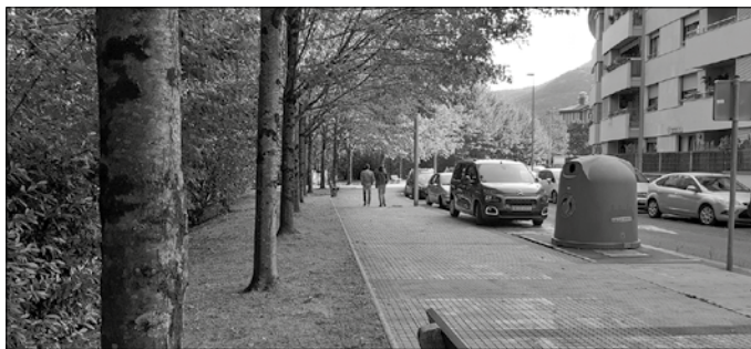
"Zuhaitzek eskatzen duten tokia emateko asmoz, bitik bat moztuko da gutxi gorabehera", Udalak aditzera eman duenez.

Bere garaian Artzabalgo parkean egin zuten antzera, "Anerrekako parkean ere zuhaitzak bakanduko ditu Udalak. Freemanni motako astigarrrak handituz doaz pixkanaka, eta azken urteetan ugaritu