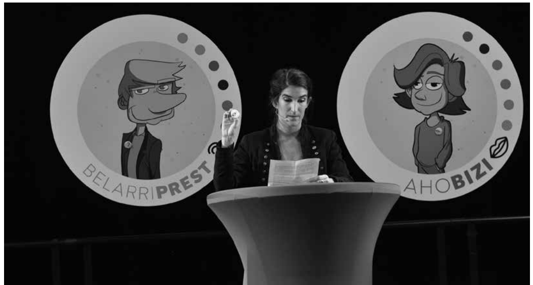
2018ko Euskaraldian bezala, bueltan izango ditugu asteotan Ahobizi eta Belarriprestak.

Entitateek hartutako konpromisoari, norbanakoena batuko zaio. 2018an bezala, bueltan izango ditugu asteotan Ahobizi eta Belarriprestak. Tarterik hartu ez edota gogoan izan ez baduzue, ostegunera arte (hilak 19) zabalik duzue oraindik, izen ematea bideratzeko epea. Kasu honetan, zeure burua jendaurrean identifikaraziko zaituen txapa eskuratu eta soinean jantzita izatea eskatzen da. Hartara, gutako bakoitzarekin hartuemanetan jarriko den edonork jakingo du, hasteko Euskaraldian parte hartzeko konpromisoa hartu dugula. Ahobizi edo Belarriprest garelara adieraziz gainera, zer modutan