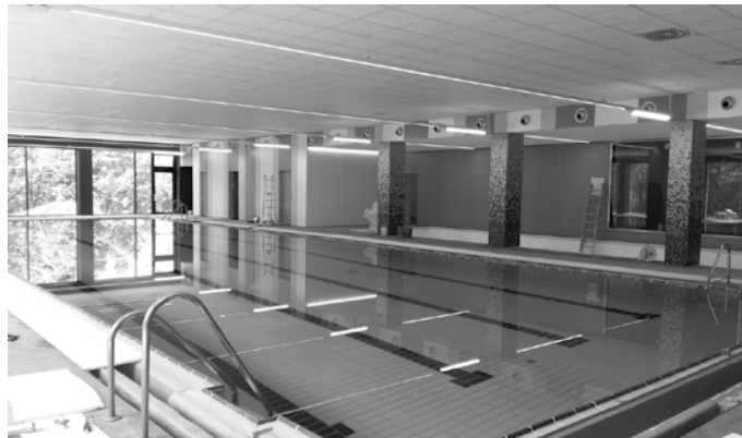
Igerilekuko aldageletan ezingo da dutxatu.

■ Bertan behera geratu dira 6-16 urte arteko zuzenduriko ikastaroak; LH1, 2, 3 eta 4ko igeriketa ikastaroak eta zumba gazte taldea. HH4 eta HH5eko igeriketa saioak bai, mantendu egingo dira. Igeriketa ikastaroak etenda daudenez, "gainerako erabil-