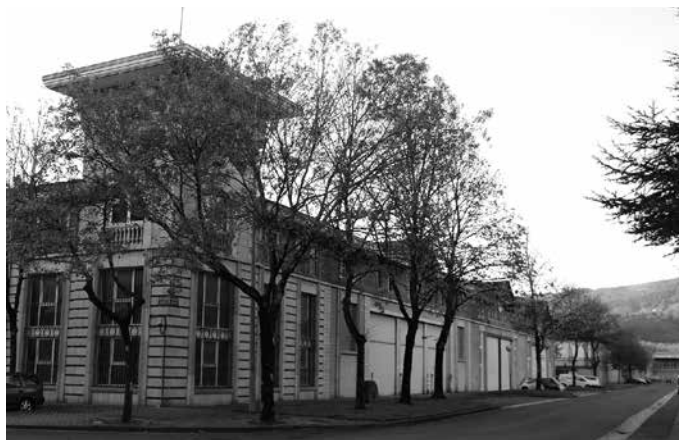
Pandemia hasi zenetik, Beterrri-Buruntza eskualdeko ekonomiak jaso duen kolpea handia izan da. Eta horrek eragin zuzena izan du langilegoarengan.

Azken bost urteetako daturik txarrenea eskaintzen du, eta