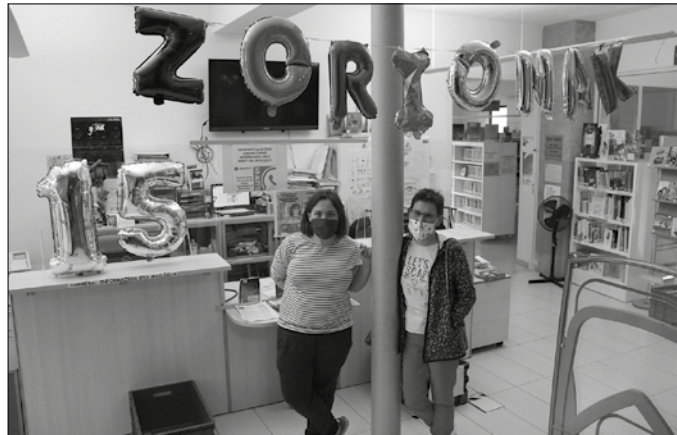
“Whatsapp bidezko zerbitzua dugu. Noizean behin mezuren bat bidaltzen diegu bertan ditugun erabiltzaileei”.

Liburutegiaren bueltan sortu den komunitatea: erabiltzaileak liburutegian bertan elkarri nola gomendatzen aritu izan diren ikustea, ze tertuliak sortu izan diren liburuak komentatzerakoan. Erabiltzaileekiko esker ona. Beti, baina bereziki orain. Hainbeste jasotzen