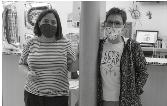
Sutegiko udal liburutegia “denon artean sortu dugun elkargunea” dela esan digute bertako langileek.

Liburutegian ezin halakorik antolatu eta alternatiba aurkitu duzue.