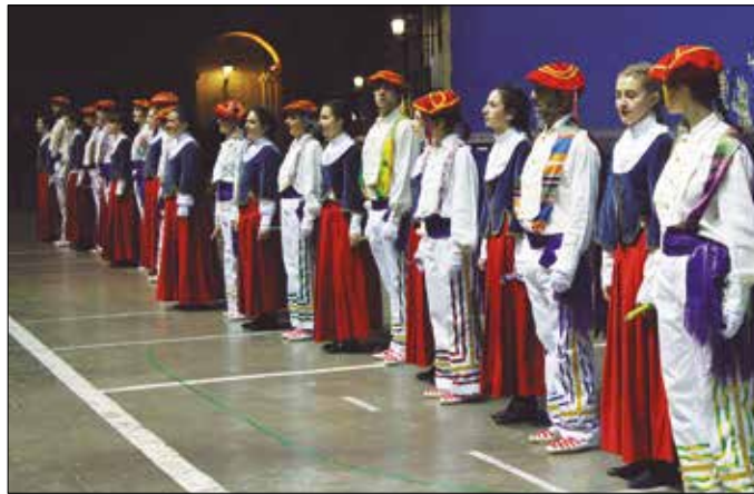
Korrontzi folk musika taldekoekin batera igoko dira hilaren 21ean Sutegiko oholtza gainera.