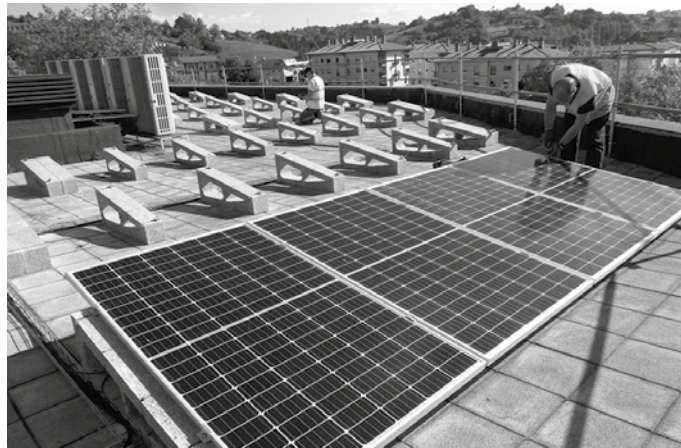
Energia berriztagarrien inguruko aholkularitza eskaintzeko edota pobrezia energetiko egoeran egon daitezkeenei laguntzeko sortu dute zerbitzua. Bestetik, energia teknikari posturako eskaintza jada argitaratu du Lanbidek.

Zortzi hilabeterako kontratazioa egitea aurreikusten du Udalak, baina “zerbitzuaren balorazioa ona bada”, jarraikortasuna emateko prest da. “Udal-energia inbentarioa