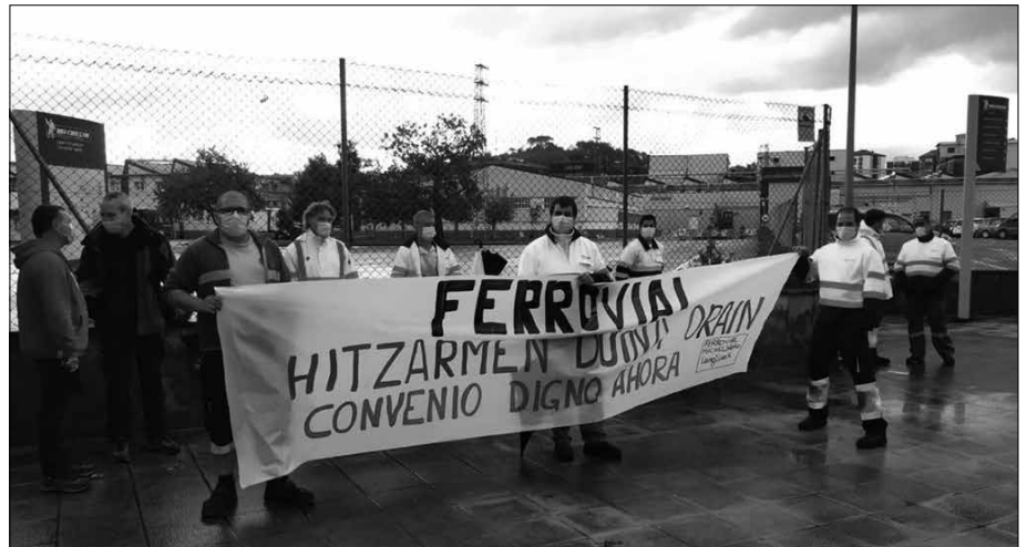
Era askotako mobilizazioak egin dituzte azken asteotan.

Mobilizazioei ekin aurretik ezarritako helburuak bete dituztela dio LAB sindikatuak. “Izan ere, multinazionalaren lanak azpikontratatzeko apustuaren aurrean, langileei antolatzea beste aukerarik ez zaie gelditzen, euren lan baldin-