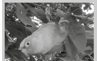
Azaroaren 13an aurkitu zuten argazkiko hegaztia.

Ondoko argazkia helarazi digu herritar batek. Txori koloretsu batena da. Azaroaren 13an aurkitu zuen Ugartondo inguruan. Zuhaitz batean. Bere hankatxoari erreparatzen badiotzue, eraztuna jarria du. “Etxeren batetik alde eginda edo?”, zioen argazkia bidali digun bizilagunak.