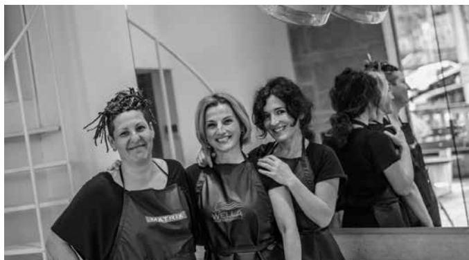
Lan egiteko modua aldatu zaiela esan digute Intza ile-apaindegian.

Jendea zain zegoen eta gogotsu. Itzulera gogorra izan zen jende asko geneukalako eta edukiera kontua dela eta ezin genuelako nahi beste jende hartu. Kezkatuta egon ginen nola moldatuko ginen neurri berrietara, baina ire-