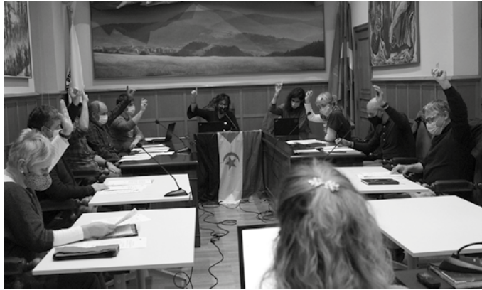
1978-1999 urte artean EAE-n indarkeriaren testuinguruan giza eskubideen urraketak jasan dituzten biktimei aitortza adierazten die mozioak.

Mozio honen bidez, “Usurbilgo Udalak animatzen ditu giza eskubideen urraketan bik-