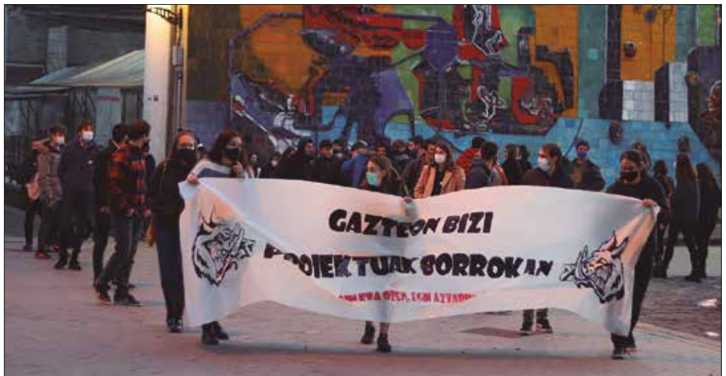
Gazte Egun atipikoarekin amaitzeko manifestazioa egin zuten Mikel Laboa plazatik abiatuta.