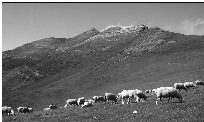
“Mikelek amets txikiak bizi zituen Nafarroako Pirinioetako bere mundu partikularrean”.