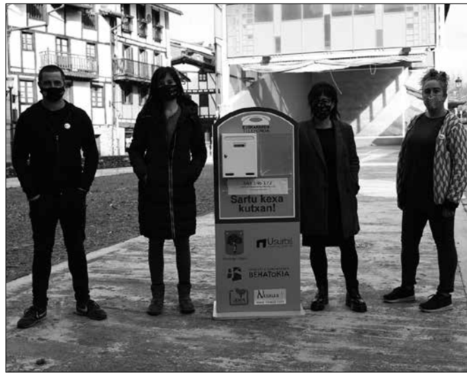
Udalak Hizkuntz Eskubideen Behatokiarekin urtebeterako lankidetzaz hitzarmena sinatu du.

Hitzarmen honetan adostu bezala, datorren urte hasieran Behatokiak abiaraziko duen ekimena iragarri du alkateak. Xehetasunak aurrerago es-