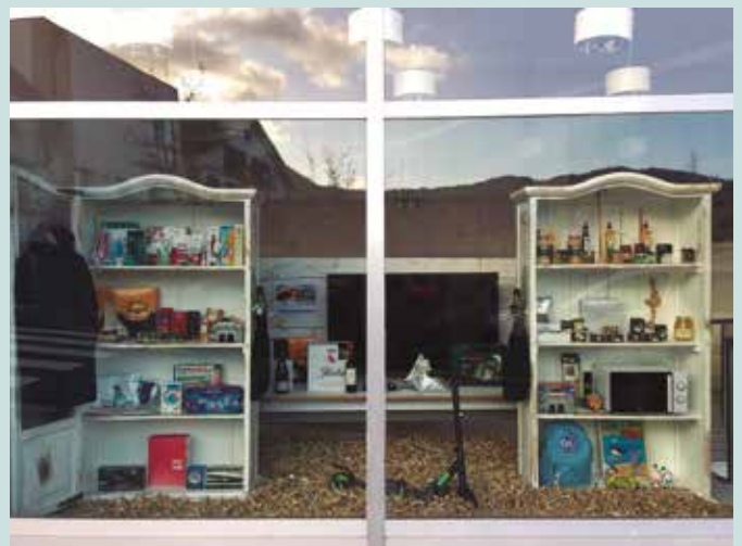
Eskaparatea Kontzeju Zarra 13 kaleko lokalean topatuko duzue. 2015ean, Kilometroak Gattunk dendaren egoitza izan zen toki berean.

Sariketa hau bideratzeko, Hurbilagok Usurbilgo Udalaren eta Eusko Jaurlaritzaren laguntza jaso du.