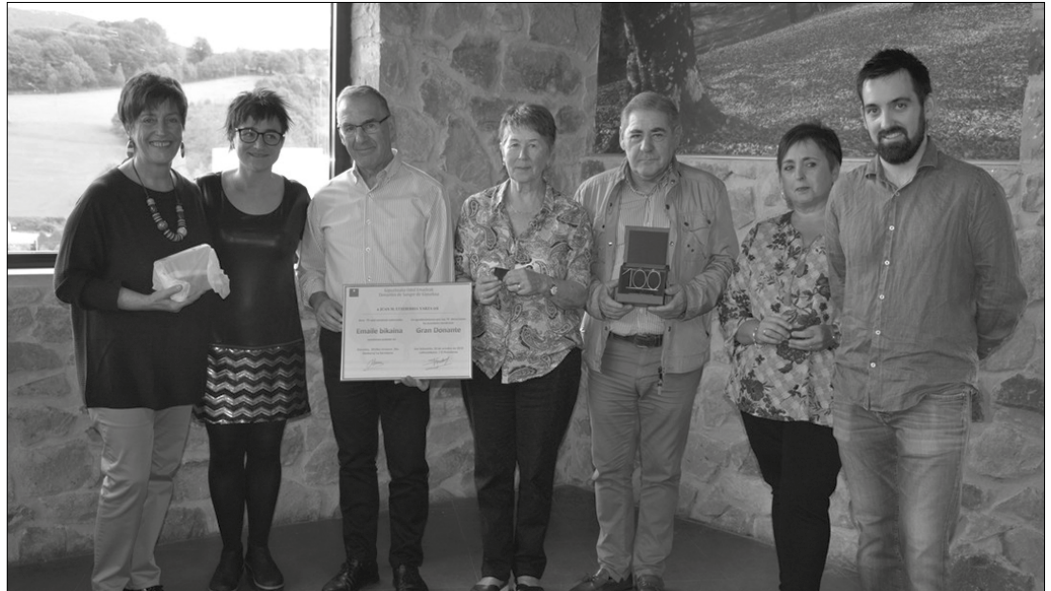
Iazko urrikoa da argazkia. Oria Behea eskualdeko odol emaleen elkarteak batu zirenekoa.

Hala ere, 211 odol-emaite egin dira aurten, “eta horietatik 117