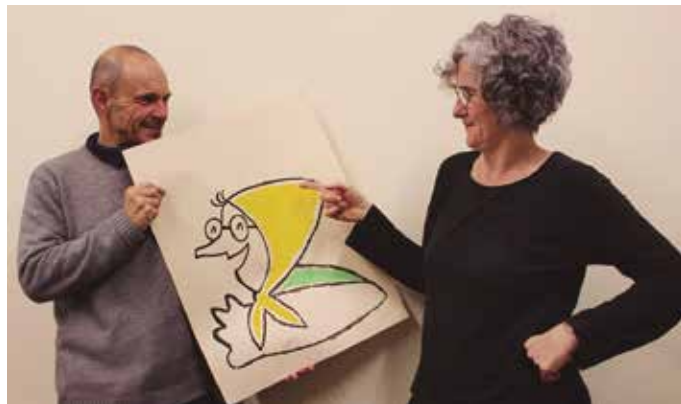
Aste honetako aldizkariarekin batera Amona Tomaxaren ipuin berri bat banatu dugu.