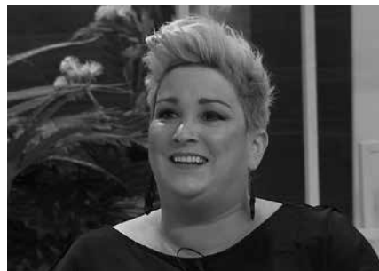
Onintza Enbeitaren hitzaldirako sarrera eskuratzeko epea abenduaren 2an amaitu zen.

Hitzaldia ostiral honetan eskainiko du. 18:00etatik aurrera, Sutegin.