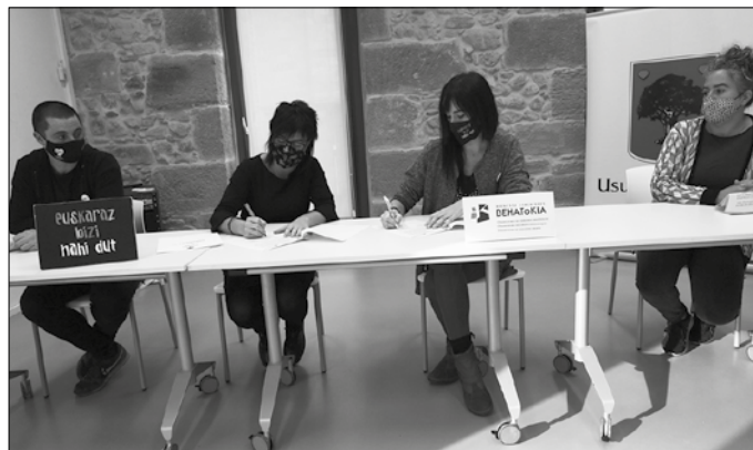
Herritarren hizkuntza eskubideak bermatzeko, eskura dauden tresnak ezagutaraziko dituzte formazio saioen bidez.

Ahalik eta “lan gutxiena” izateko desioa plazaratu du Aizpuruak, hizkuntza eskubide urraketa gutxi izango diren adierazle argia izango baita. Halere, urraketak gertatu ahala, “denon ahaleginarekin bideratzea” desio zuen.