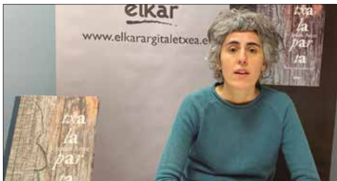
Txalaparta, tradizioaren abaroen liburua aurreko astean aurkeztu zuten.

Liburua eskuarte hartzekoan, “akaso konturatuko da zenbait esaldietan hutsu-neak daudela, puntuazio mar-