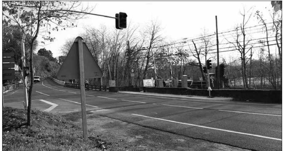
Trafikoa zuzentzeko behin-behineko semaforoak jarriko dituzte, “asteburuak eta gauak barne”.

Oinezkoek bertatik pasatzeko aukera izaten jarraituko dute, “baina orain arte