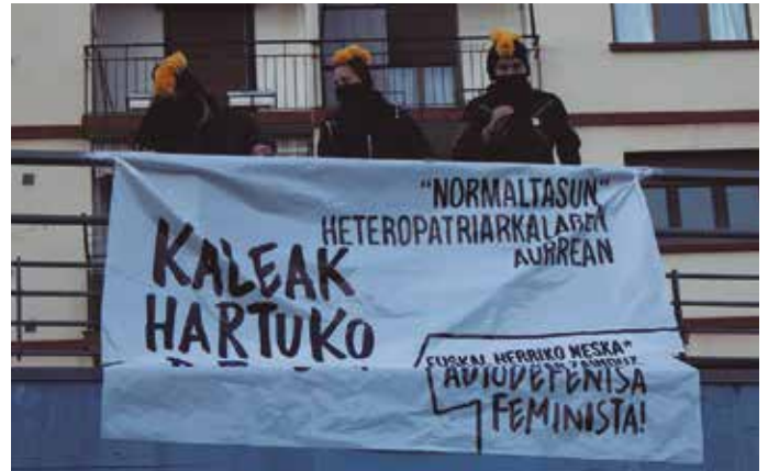
Azaroaren 25ean ekimen ezberdinak antolatu ziren herrian. Eskualde mailako mobilizazioa Lasarte-Orian egin zen.

Mezu argia plazaratu zuten Emakumeen Aurkako Indarkeria Ezabatzeko egunean, Usurbilgo Kafe-Tertuliako neskek*; “Normaltasun heteropatriarkalaren aurrean kaleak hartuko ditugu!”. Eta hala egin zuten lehenbizi, Usurbilen eginiko “Buruberoki” tailerra-