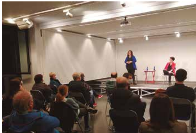
Luze edo Motz emanaldia azaro hasieran taularatu zuten lehen aldiz Altzon.

ETB1eko Barre libreata saioan gero eta emakume gehiago ikusten ditugu. Noiz egingo da bakarrizketen Emakume Master Cup txapel-