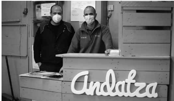
“Azaroaren erdialdean ireki genuen”. Baina proiektuarekin ekinean hasi ziren, “orduan utzi baitzuen negozioa aurreko jabeak”.

Andatza karrozeria: Zerbitzua eman zioten Usurbil eta inguruko herriei, eta guk horri jarraipen bat eman nahi diogu, horren ongi edo hobeto ahal bada. Karrozeriari lotutako zerbitzu guztiak eskaintzen ditugu: karrozeria mota guztietako erreparazioak, auto-argien leunaketa, auto-beiraren ordezkatzeta, lapurreta kalteen konponketa, margoketa lanak, kristalak al-