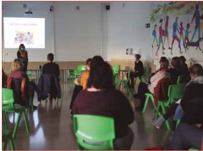
Batez besteko bat eginda, DBH1en hasten dira haurrak beren telefono propioa izaten.

Geroz eta lehenago ematen zaie lehen mugikorra haur eta nerabeei. Jaunartzeko opari izarra izan ohi da azken urteetan. Guraso asko kezkatuta zeuden eta zalantzak zituzten seme-alabei mugikorra zein momentutan eman. Egun, batez besteko bat eginda, Udarregi Ikastolan badirudi DBH1en hasten direla haurrak beren mugikor propioa izaten, hots, Interneta daukan mugikorrez ari gara uneoro. Nahiko txukuna den datua dela zioen dinamizatzaileak, eskola askotan LH3-5 bitartean hasten omen