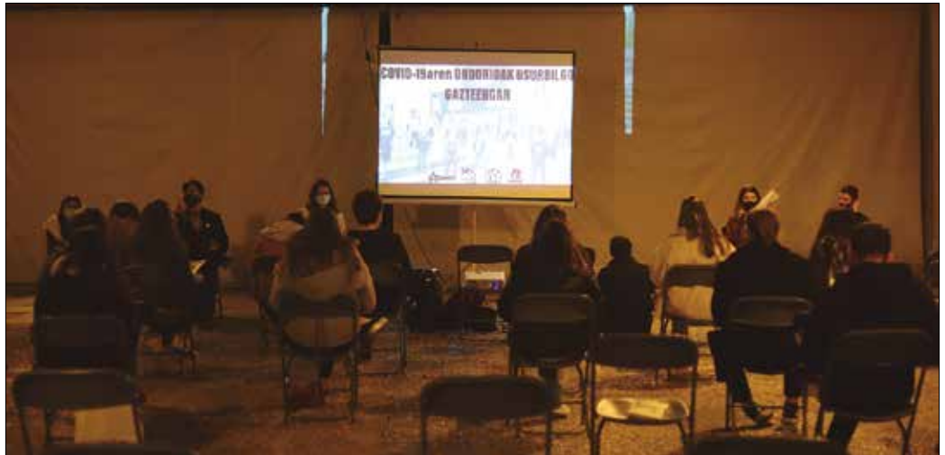
Ostiral arratsaldean Askatasuna plazan elkartu ziren, eta talde txikitan aztertu zuten gai bakoitza.

Azken bi egunetan egindako hausnarketekin amaitzeko, erantzukizunak hartzeko eskatu zuten eta gazteen bizi proiektuek izan dituzten eta oraindik ere izaten ari diren eragin negatiboak amaiara emateko eskatu dute beharrezko laguntzak emanaz.