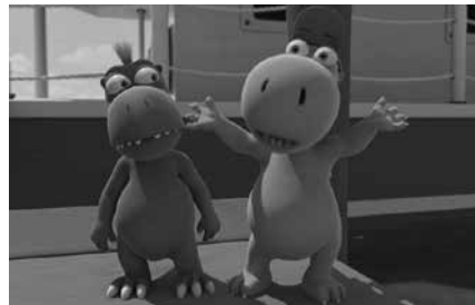
Sarrerak aurrez eskuratu beharko dira usurbilkultura.eus atarian.

■ Sarrerak 3 euro. Aurrez eskuratu beharko dira usurbilkultura.eus atarian.