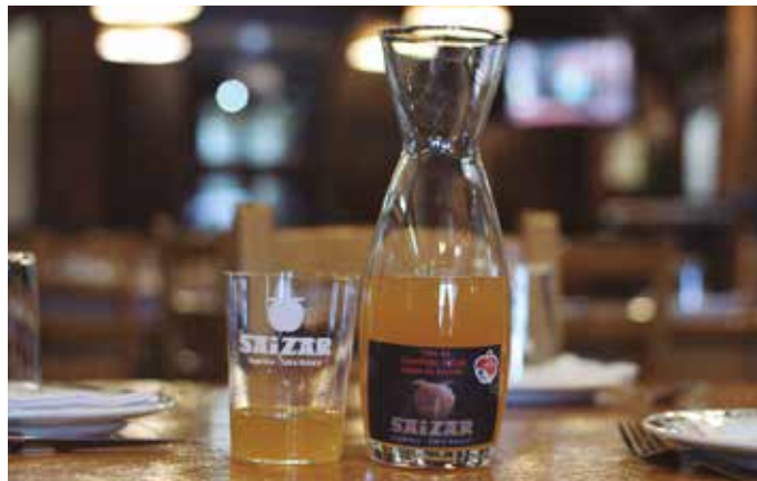
“Bezeroek badakite zer dagoen eta errespetuz jokatzeko dute”.

Upeletatik zuzenean eramaten diegu sagardoa pitxerretan.