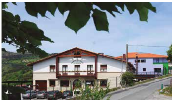
“Gipuzkoa osotik datorren jendea hartzerako ohituta geunden”.

Bezeroen partetik errespetuzko jarrerak sumatu dituzue?