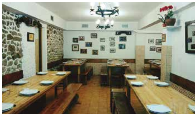
“Bezeroei aukeran ematen diegu: upelekoa edo botilakoa”.

Alboko herrietako jendeak jada sagardotegietara hurbiltzeko aukera dauka. Atzeman