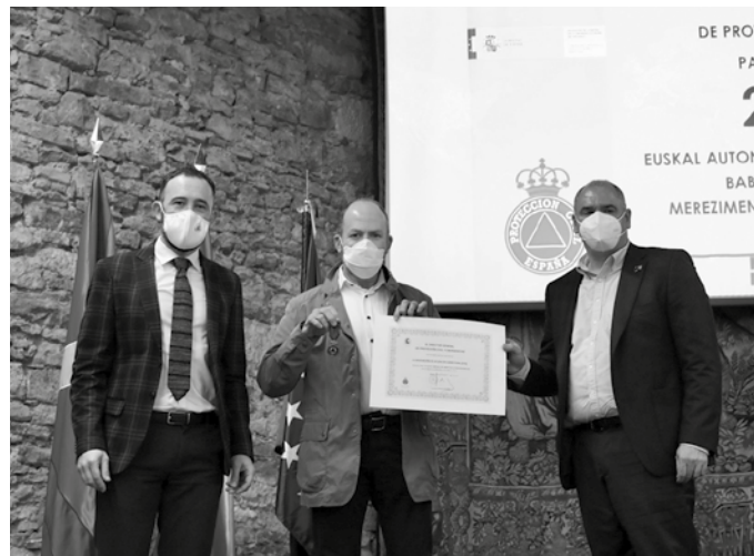
"Gure boluntarioei eginiko aitortzen garrantzitsua da, herritarrak lagundu eta babesteko egiten duten lana eskertzeko balio duena".