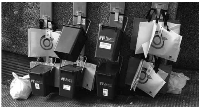
Martxoaren 1ean hasi ziren poltsak banatzen.

Poltsa hauek aurretik eskatu behar dira, Atez Ateko bulegora deituz edo e-posta idatziz. As-telehenetan egingo dute poltsen banaketa, aurreko astean jasotako eskaerei erantzunez.