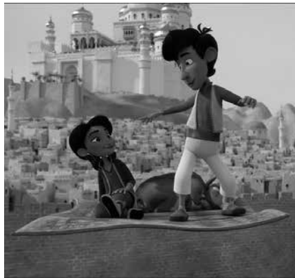
Sarrera 3 eurotan eskura daiteke usurbilkultura.eus atarian.

■ Martxoak 6 larunbata, 17:00 Sutegin. ■ Sarrerak: Doan. Sarrera kopurua mugatua da. Sarrerak aldeztatik usurbilkultura.eus bidez eskuratu daitezke. ■ Antolatzailea: Tadamun elkarte.