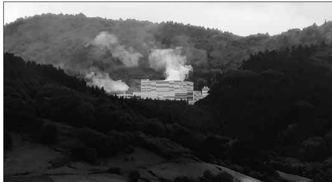
“Usurbil 0.0 da gure ibilbide-orria, eta beste hainbat helbururen artean, 0 errefusa sortzea da xederik behinena”.

Udalak hitz eman zuen aztertuko zituela bere esku zeuden aukerak GHKren morrontzatik aparteko bidea egiteko. Baita aztertu ere. Ondorioa garbia da: ez dago baldintza juridiko-ekonomiko-teknikorik bide propio horri heltzeko. Eta ez dago aukerarik arrazoi simple batengatik: Gipuzkoan agintzen dutenek sekulako ahala eta tresneria dutelako gurea eragozteko. GHKren ereduak ez da soilik erraustegian oinarritzen: arauen sare oso bat