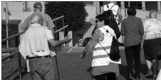
“Konturatu gabe, belaunaldiz belaunaldi, zerbait galtzen ari gara; hitanoa, hika, pobretzen ari da”.