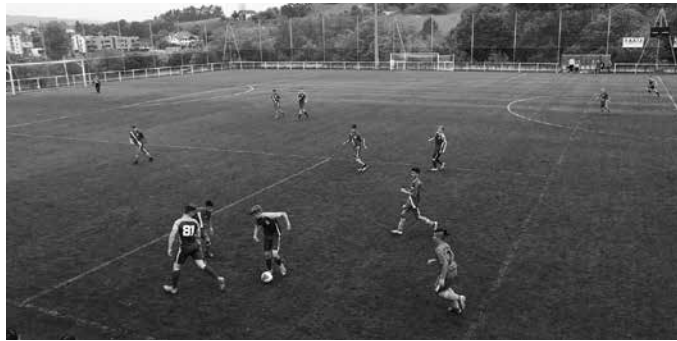
Usurbilek 257.318 euro gehiago jasoko ditu Foru Aldunditik. Diru horren zati batekin, “Haraneko harmailak jartzen hastea” proposatu du EAJk.