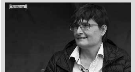
Irene Arrarats Simone de Beauvoirren "Bigarren sexua" liburuaz jardungo du martxoaren 11n.

■ Mundualdiaren edizio berezia. Aztikerren ikerketaren emaitzak emango dira ezagutzera eta Usurbila etorritako migranteen lekukotzekin sortutako dokumentalaren proiektzioa egingo da. ■ Aitortza ekitaldia.