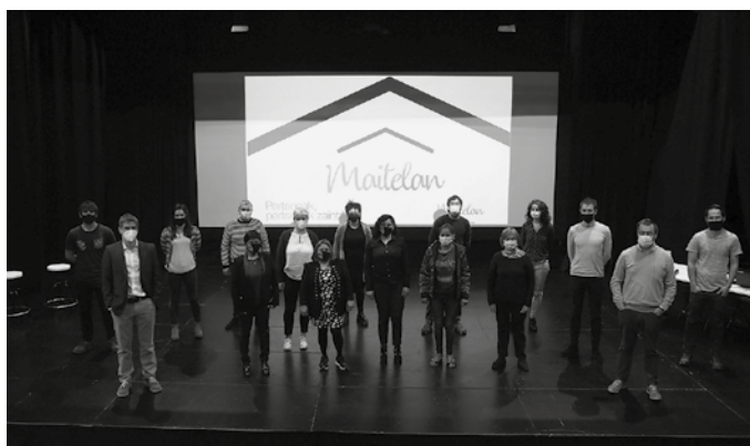
Beterri-Buruntzako udalen babesarekin abiatu zen Maitelan. Bi lan lerro ditu: pertsonen arreta eta zaintza batetik, garbiketa zerbitzua bestetik.

2000. urtea urte zaila izan da kooperatibarentzat, “pandemia egoerak ez baitu erraztu kooperatibaren bideragarritasu-