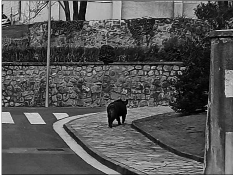
Antza denez, menditik beldurtuta alde egin zuen. Ehiztariengandik ihesi edo.

Ez zen basurdea herri aldean agertzen zen lehen aldia, baina ez da ohiko gertaera ere. Kasu isolatuetan baino ez dira agertu azken urteetan.