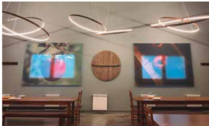
“Neurri guztiak betetzen saiatzen ari gara, ahalik eta zerbitzurik onena emateko”, Urdairakoek esan digutenez.

Usurbilen zabalik dauden sagardotegiekin jarri gara ha-