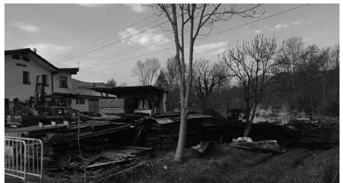
Ez zen inor zauritu baina sugarrek kalte materialak eragin zituzten.

Martxoaren 2ko goizaldean gertatu zen. Sute batek Aliri bidean izan ohi den lasaitasuna zapuztu zuen. Ertzaintzak jakinarazi zuenez, goizeko 5:00ak aldera piztu zen sua. “Arozte-