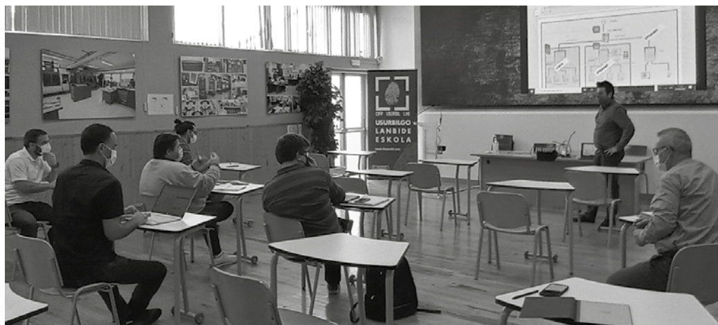
Martxoaren 10erako antolatu dute. Erdi mailakoa 17:00etan hasiko da eta goi mailakoari dagokiona 18:00etan.

Usurbilgo Lanbide Eskola: Aldez aurretik ordua hartzea ezinbestekoa izango da parte hartu ahal izateko. Printzipioz modu presentzian egingo ditugu aurtengo ate irekiak pandemiaren egoera hobera doala ikusita. Izena ematerako orduan adierazi beharko du bakoitzak zein ziklotako izen-ematean daukan interesa, ondoren guk taldeak antolatzeko. Gisa horretara, bakoitzak interesatuta dagoen zikloari buruzko in-