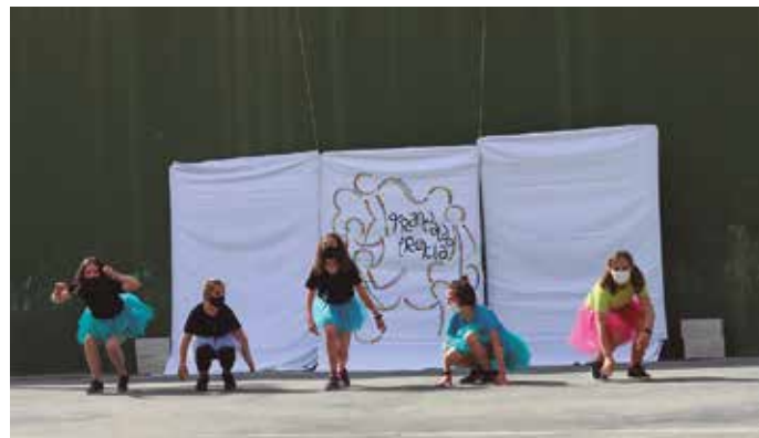
Partehartzaille ugari batu ziren lehenengo Tranpaldo Irekian. Denetarikoa dantzak eskaini zituzten.