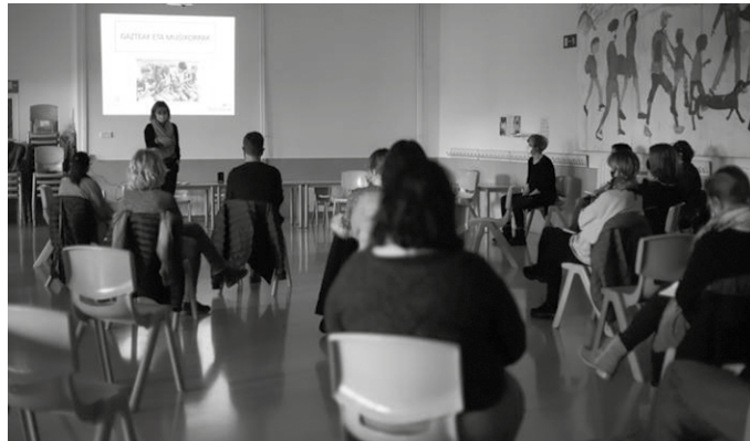
Izen-ematea harremonakusurbil@gmail.com emailera idatzita egin behar da.

Maiatzaren 12ko bilkuran “abiapuntu bat proposatu nahi