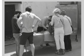
Gure Esku taldea sinadurak batzen aritu zen larunbatean.

Sinadurak biltzen segitzen du Gure Eskuk. Larunbat eguerdian frontoi atzean egokitu zuten postua. Eta sarritan ikusiko ditugu udaberri honetan kalean; sinadurak bildu edota kamisetak saltzen.