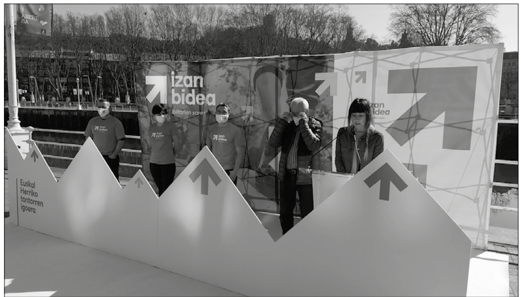
Maiatzaren 8an Andatzara igotzeko gonbitea luzatu die Sarek usurbildarrei.

G iro euritsuagatik iragan urriaren 3an Euskal Herriko 650 mendi ton-toretara igotzeko Sarek egini-ko deialdia maiatzaren 8ra arte atzeratzea erabaki zuten. Ate joka da honenbestez, "Izan Bidea" dinamikaren bueltan euskal presoen auziari aterabide bat eskatzearen aldeko mendi martxen eguna. "Presoak etxe-rantz itzultzeko bidearen hasiera aldarrikatuko dugu, eta, helburu hori lortzeko, ezinbestekoa da urruntze-politika bertan behera uztea eta gradu-progresioa aplikatzea preso guztiei".