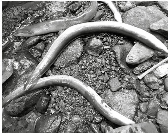
2020ko maiatzaren 7tik 10era, tarte horretan Zubietako Arkaitzerrekara isuritako amonioak ehunka arrain hil zituen.

Urtea betetzear da. 2020ko maiatzaren 7tik 10era, tarte horretan Zubietako Arkaitzerrekara isuritako amonioak ehunka arrain hil zituen. Begi bistakoa izan zen hondamendia. Hondamendi haren iturria, Zubietan gainean kokatua zegoen, erraustegiaren eremuan. Ordutik hainbat xehetasun ezagutu dira azken urtebetean. Azkena, GuraSOSeK eman zuen ezagutzera iragan astean, Gasteizko Legebiltzarreko ingurumen batzordean egindako agerraldiaren harira. Aipatu batzordeak GuraSOSeK parte hartzea eskatua zuen, Zubie-