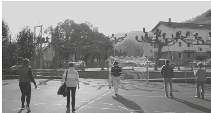
Ikus-entzunezkoa udalaren webgunean dago ikusgai.

Ikus-entzunezkoa Usurbilek jasotako bi migrazio prozesu nagusietan oinarritzen da: 1960/70eko hamarkadan Espainiatik etorritakoan, eta