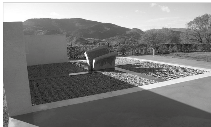
Hilerriko hilobien sorta berri bat eskaini du Udalak, eta eskaerak egiteko epea zabalik dago jada.

2000. urtean egin zen Usurbilgo hilerri berria, eta ordutik gorpuzkirik ez da atera handik. Ohiko prozeduraren arabera, hamar urtez egon daitezke gorpuzkiak hilerrian, baina oraingo honetan ez da halakorik izan, gaur arte. Ehorzleak, ordea, hilerria hus-