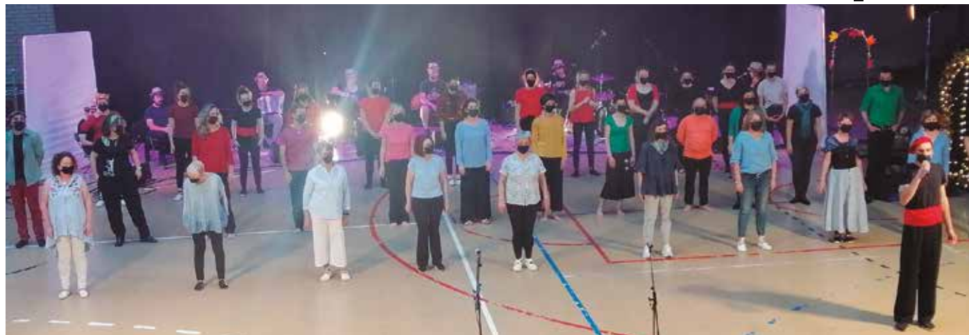
“Zorotan Bele” herri ikuskizuna Usurbilgo belaunaldi ezberdinen topaleku izan zen. Larunbat iluntzean Oiardo kiroldegira bertaratu zirenak emanaldi gogoangarri baten lekuko izan ziren: dantza, hitzak eta musika, etxekoen eskutik. Argazki gehiago noaua.eus atarian topatuko dituzue.