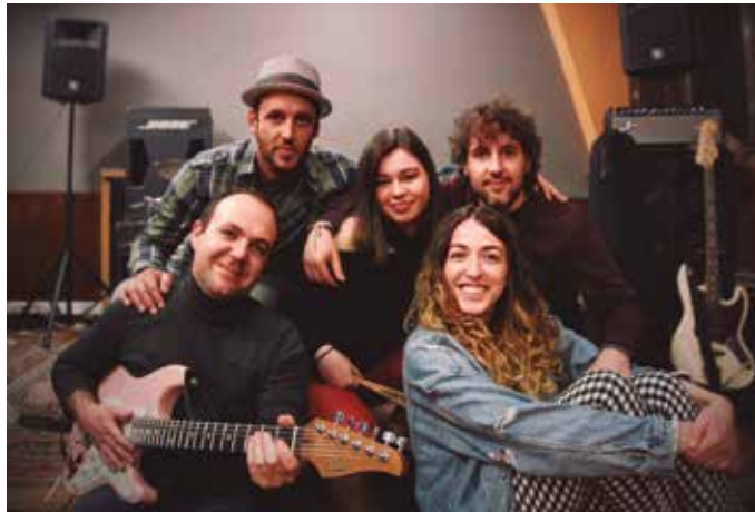
“Neona izena zerotik hasitako proiektu bat da, nolabait esatearren”.