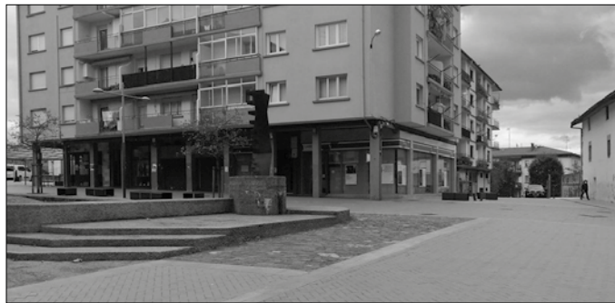
Asteartez geroztik neurri murriztaile berriak indarrean dira Usurbilen.

Eusko Jaurlaritzak astelehenero eguneratzen du eremu