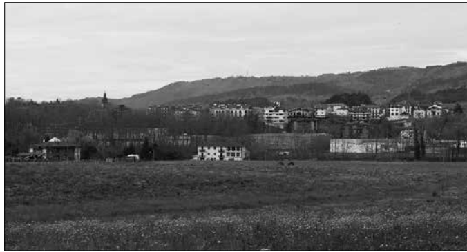
Otsailetik martxora, 249tik 268ra igo zen lanik gabeko herritar kopurua.

Iazko joera bera errepikatu da aurtengoan ere. 2020eko otsailetik martxora igoera nabarmena izan zen langabetu kopuruan Usurbilen, 221etik 245era igo baitzen lanik gabeko herritar kopurua. Urtebete beranduago, otsailean langabetu gehiago izanda, 249, 268raino igo zen martxoan, Estatuko Enplegu Zerbitzuak kaleraturiko datuen arabera.