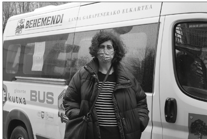
Bidez Bide taxi bus zerbitzura deitzeko haxe da telefono zenbakia: 630 643 596.

Zati bat. Ibilbideak bi zati ditu, mendiko buelta eta gero Zubietakoa. Goiko buelta hain luzea ez izateko Iarbetik behera Kaxkora itzultzen gara. Eta gero buelta egiten dugu Aginagara. Txokoalde, Urdaia eta Santuenetik Kaxkora berriz eta