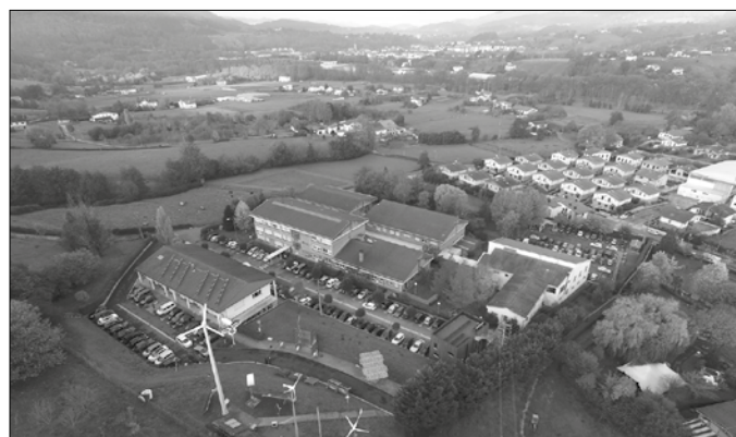
Izena emateko epea maiatzaren 31tik ekainaren 18ra bitartean luzatuko da.

Batxilergoan nagusiki lantzen diren gaitasunak indartzeko, ikastetxean eskaintzen diren ziklo guztietan astean 6 orduko STEAM errefortzua eskainiko du Usurbilgo Lanbide Eskolak. Kurrikulumez on-