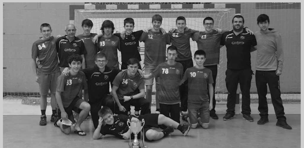
Usurbil K.E.-ko kadete mutilak ere Espainiako Sektorerako sailkatu dira. Ekaineko lehenengo asteburuan jokatu da baina lerro hauek idazterakoan oraindik ez zegoen jokalekua zehazturik.