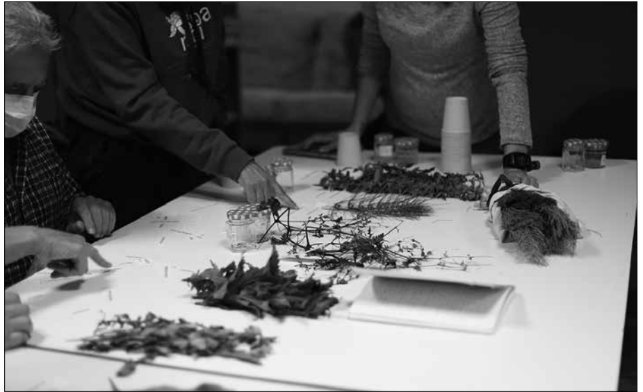
Hamabost bat lagun elkartu ziren Santuenea Elkartearen sendabelarrei buruz ikasteko asmoz.

Hamabost bat lagun elkartu ziren Santuenea Elkartearen sendabelarrei buruz ikasteko asmoz. Belaunaldi anitzetako jendea elkartu zen, eta bakoitzak bere jakintzak gainontzekoekin partekatu zituen. Gure mendi eta basoetan erraz aurki daitezkeen belarretatik abiatu, eta lehenengo ezagutza proba egin zuten, belar bakoitzarentzat erabiltzen diren izenak jakin nahian. Askok etxean ematen dizkieten erabilerak partekatu zituzten besteekin, dela janaria prestatzeko, dela minak sendatzeko.