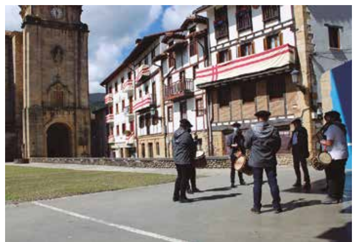
Bigarren urtez ospatu ezin izan den Sagardo Egunari gorazarre egin zioten herriko txistulariek eta ezustean heldu ziren zanpantzarrek.