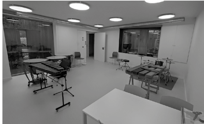
Hobariak daude familia ugarien edo unitate familiar bereko 3 senide edo gehiago matrikulatuta dauden kasuetan.