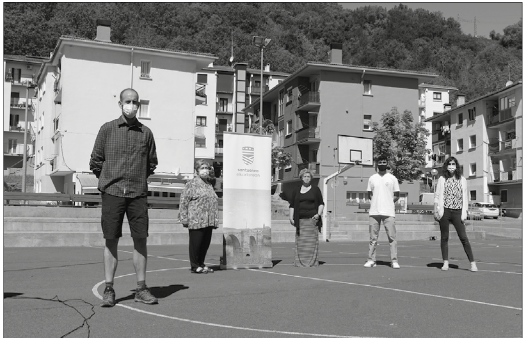
Ekainetik aurrera auzo-plan bat egingo da Santuenearentzat, “bertako biztanleen egunerokoa nabarmen hobetuko duen esperantzarekin”.

Auzotarren ekarpenak funtsezkoak izango dira. Santueneko hiru elkartetan onartu dute prozesuan parte hartzea: Jai Bartzordeak, Jubilatuen Elkarteak