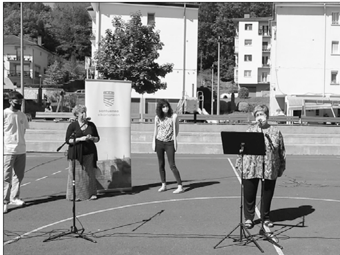
“Gure hitza bertan egotea nahi dute”, azaldu zuten auzoko elkartearen ordezkariak. “Elkarteena nahiz auzotarrena”.