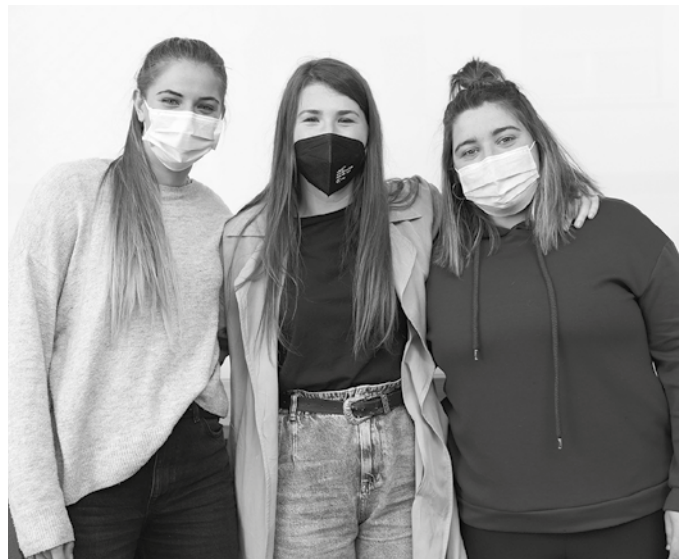
“Behin Euskadikoa irabazita, Zilarrezko Mailarako igoera fasea jokatu dugu”.