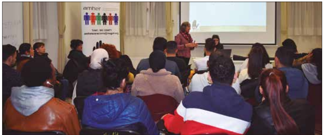
Amher-SOS Arrazakeria Elkarteak Atzerritartasun Legeari buruz antolatutako informazio saioa, Hernaniko Biterin, 2020ko otsailean.

Buruntzaldera etorrita, jatorri atzerritarra duten biztanleen proportzioa baxuagoa da. 75.000 eskas biztanle dituen eskualde honek %7 inguruko atzerritar tasa du. Proportzioak dezente aldatzen dira herri batetik bestera. Badira %5 inguruko portzentajea dutenak (Lasarte edo Astigarraga kasu)