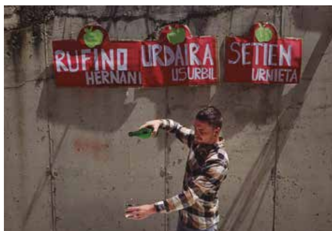
Ez zen sagardo posturik, ezta jende uhoderik ere. Sagardo egarria zuenak bestelako alternatibaren baten aldeko apustua egin behar izan zuen.