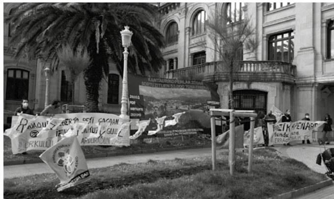
“Zergatik ez da pardelak birziklatzeko zerbitzuaren prozesua abiatzen?”. Erraustegiaren Aurkako Mugimenduaren galdera GHK-ri zuzendua dago.