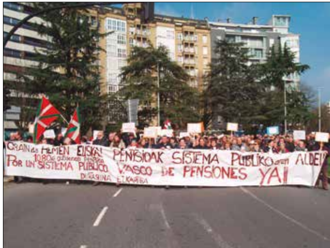
Larunbat honetan, Usurbil-Donostia bizikleta martxa osatuko dute goiz partean eta arratsaldeko 17:00etan hasiko da manifestazioa Donostiako Alderdi Ederretik.

Bizikleta martxarekin zer nolako dinamika bideratu asmo