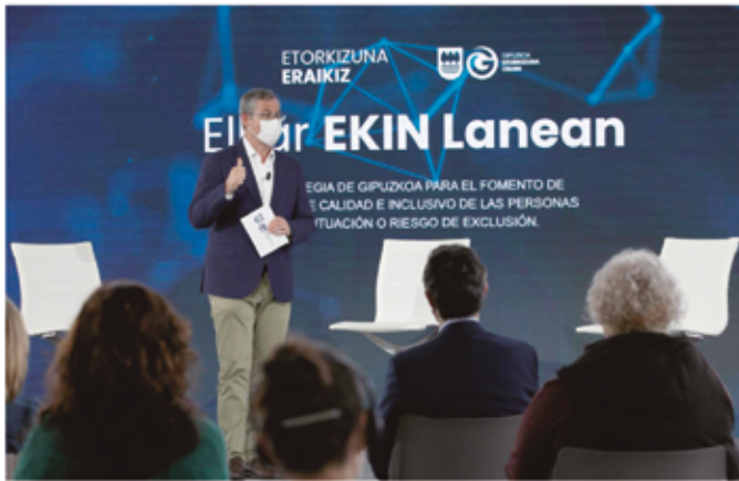
Gipuzkoako diputatu nagusia, Elkar Ekin Lanean estrategia aurkezten.