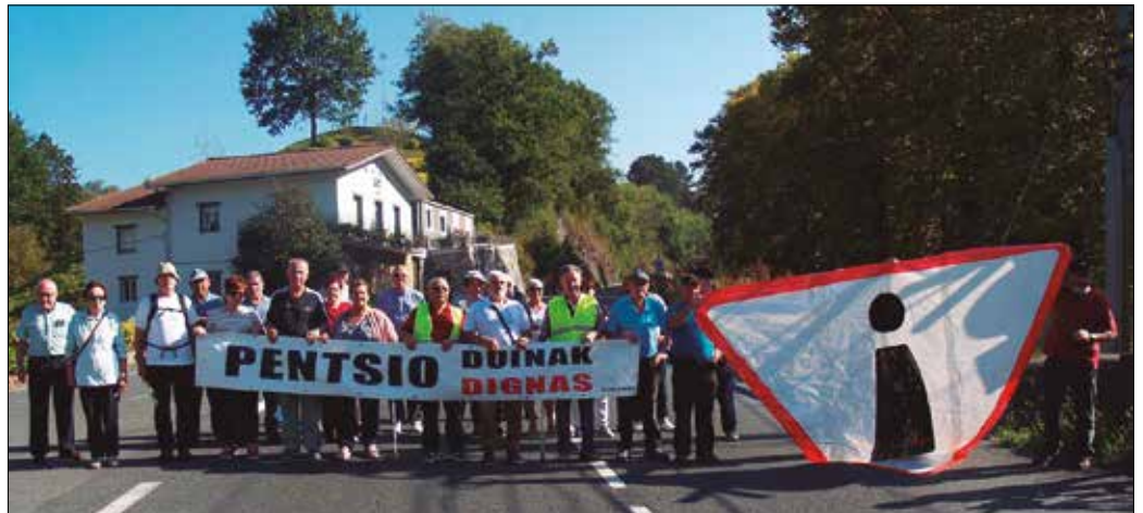
“Izurrite honek erakutsi du publikotasunak duen garrantzia”, azaldu digute Gipuzkoako Pentsiodunek.