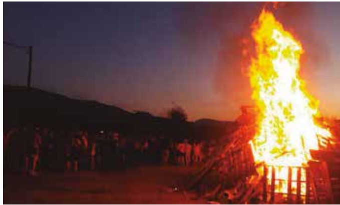
Aurtengoan ere ez da Jai Batzordeak antolaturiko San Juan surik izango, “jendea pilatzeko arriskua” ikusten baitute.

Ahal den heinean tradizioari eutsi nahi izan dio Jai Batzordeak. Hala, egungo osasun krisialdira egokitutako San Juan bezperako eskea antolatu dute ekainaren 23an. Ohi bezala, bazkalostean irtekoak dira etxez etxe. Betiko ibilbidea osatu asmo dute, bertsolari eta trikitilariak bidelagun dituztela. Geldialdiak bizilagunekin adostu asmo dituzte aurrez, etxeetara deituta eta eskea etxe atariora joatea nahi duten galdetuta. Irizpide honen ara-