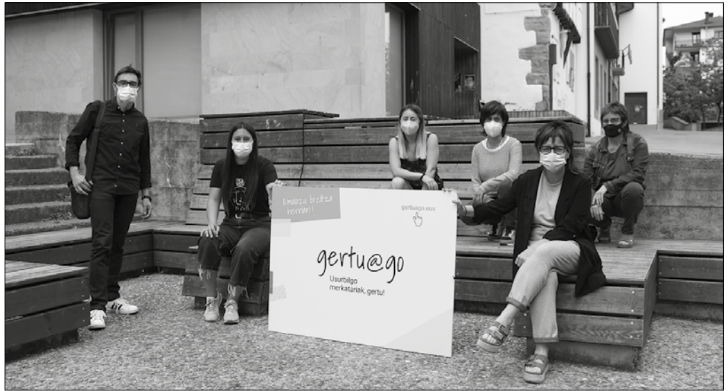
Ekainaren 10ean plangintza berriaren aurkezpena egin zuten Potxoenean.