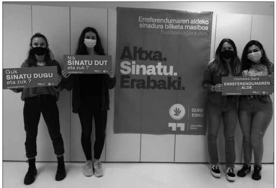
Irudian Usurbilgo Ernai, 'Hamaika Gara' ekimenari atxikimendua ematen.

Erabakiak geroz eta gutxiagoren artean hartzeko joera gailentzen den garai hauetan, "guk herritarren indarra jarri behar dugu mahai gainean", dio Usurbilgo Gure Eskuk. "Atzerakada demokratikoei herritarrok ahaldunduta, bat eginda eta demokrazian sakonduz erantzun behar diegu". Hori aldarrikatzeko asmoz, Hamaika gara sinadura kanpaina abiarazi dute. "Guztion ardura