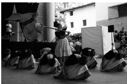
Ostiral honetan, Orbeldiko gaztetxoak Artzabalgo frontoian arituko dira.

Zehaztasunak: "Aldi berean egingo diren hiru emanalditan herriko artixtetaz gozatzeko aukera paregabea izango da. Ekitaldi desberdinak izango dira, parte-hartze zabalekoak, formatu txikian. Hiru ekitaldietako izen emateak, aparte egin behar-