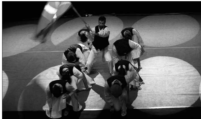
Ekainaren 18ra arte egongo da matrikulazio epea zabalik.

Kontuan hartzeko zenbait ohar plazaratu ditu Orbeldik. Batetik, “behin ordua aukeratu ezin izango da taldez aldatu”. Bigarrenik, “taldeak gutxienez 8 pertsonakoak izango dira eta gehienez 15 pertsonakoak. Muga gaindituz gero bi talde jarriko lirake ordu berean”.