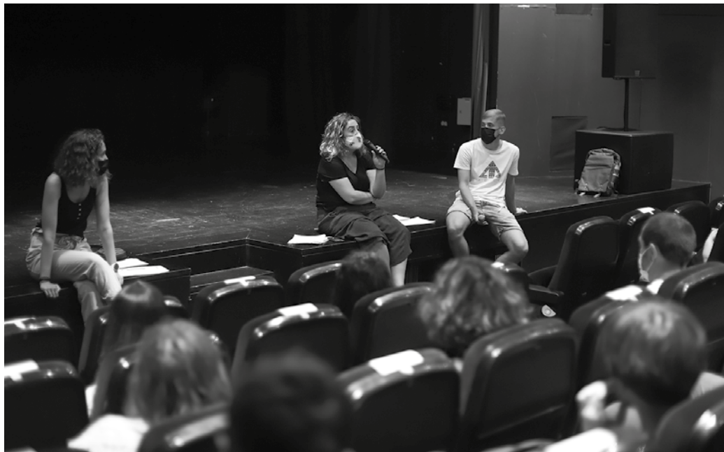
Aste hasieran bilerak egin ziren HH zein LHko ikasleen gurasoekin.

HH3-LH6 maila artean ikasten duten 4-12 urte arteko 200 laguntzako lekua zegoen, eta ia plaza guztiak bete ziren inskripzio aldian. Ia 190 izen emate batu dituzte aurtengo udaleku irekiek.