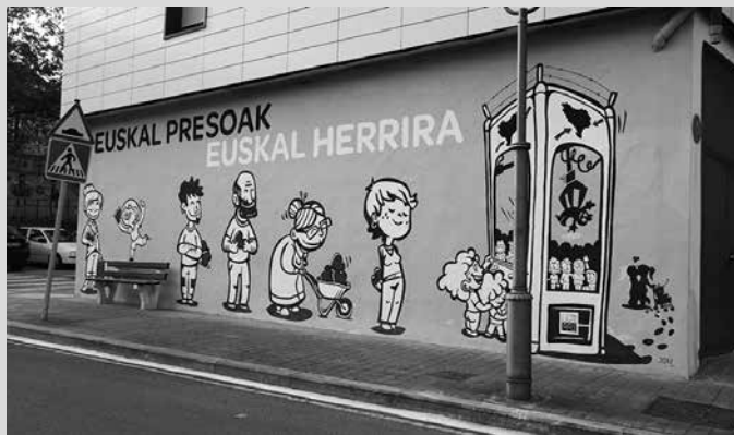
Orain, eraikinaren behealdea txuriz agertzen den arren, laster, beste mural batek hartuko du lekukoa.