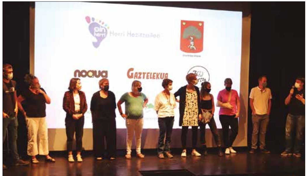
Usurbilgo zazpi eragilek osatu dute OinHerri taldea: NOAUAik, Gaztelekuak, Ziortzak, Udarregik, Zubietako zein Aginagako eskola txikiak eta Udalak.