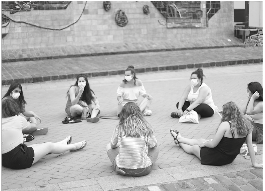
Ekainaren 12tik 27ra arte eman ahaliko da izena, mugimendu feministak sare sozialetan dituen helbideetan.

Trans egoerak hizpide izango dituen hitzaldia, prostituzioaren inguruko oka jolasa, ligoteo sanoari edota “nola feminismoak osatzen gaituen” hizpide izango duten tailerrak, Buruntzaldeko neska* gazte taldeen aurkezpena, kontzertuak, gaubelak... eta gehiago iragarri dituzte. Xehetasun gehiago datozen astekarrietan.