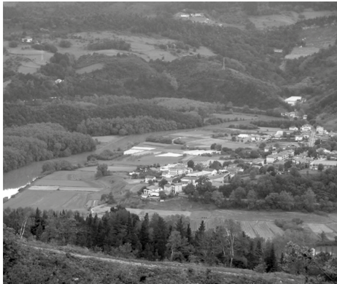
Ur Agentziak finantzatuko du %60a eta Añarbeko Urak % 40a, bi erakundeen artean sinatutako hitzarmenari esker.

Obren helburua da Usurbilgo Aginaga eta Txokoalde auzoetako hondakin-urak jasotzea; gaur egun zuzenean Oria ibaira isurtzen direnak. Horretarako, ibaiarekiko paraleloan joango den kolektore berri bat jarriko dute. Aginagako eremu baxuetatik irtengo da, Txinortatik, eta Usurbil-Lasarte Oria-Hernani hodi-biltzaile nagusiarekin