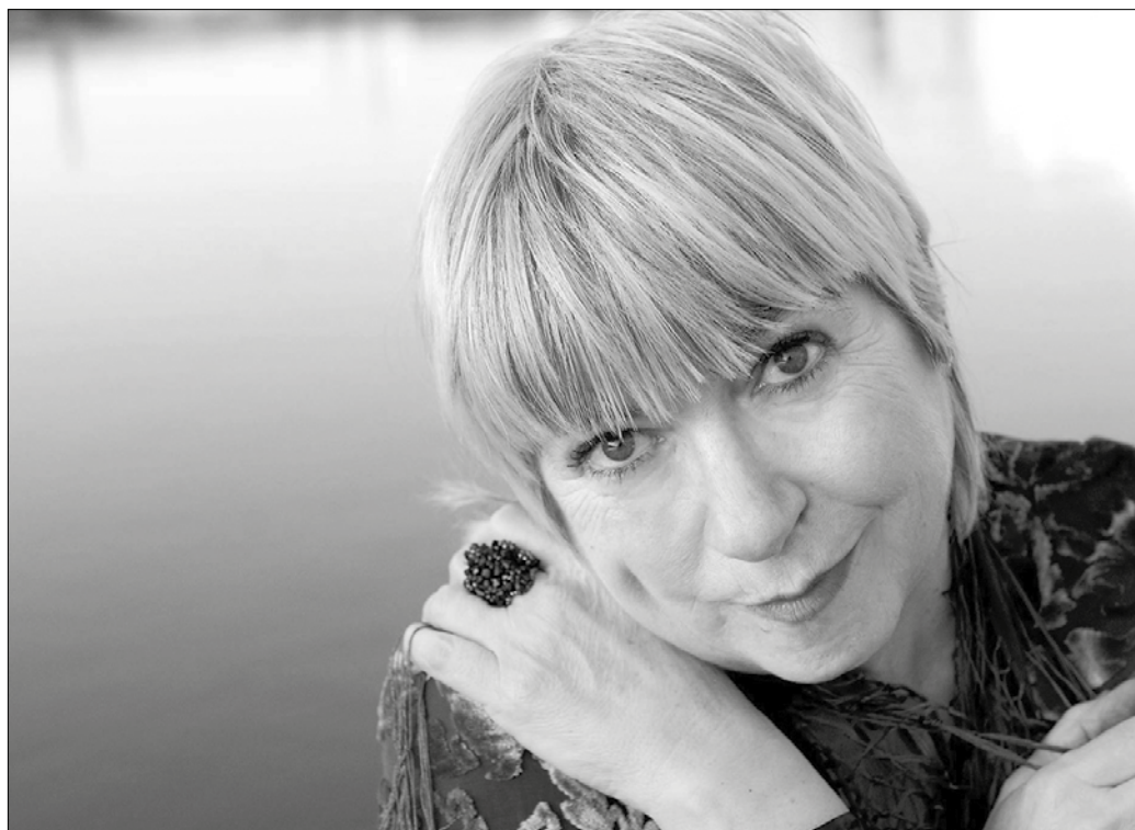
“Nire ibilbidearen zati handi bat joan da jada. Eginiko lanaren isla da sari hau”.

Leku ederra da Victoria Eugenia, baina baita beste leku