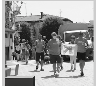
Sarek antolatu zuen pasa den igandeko herri krosa.

Krosa amaitu ostean, zozketa txiki bat egin zuten. Presoen etxeratzea eskatu zuten oihu batean ekintza-ekin.