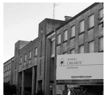
Bigarren eskuko liburuak erosteko aukera egongo da ekainaren 28an.

Kontuan izan Oriartekide Guraso Elkarteak aurrez ez duela liburu berririk salduko, eta beraz, Lasarte-Oriako eta