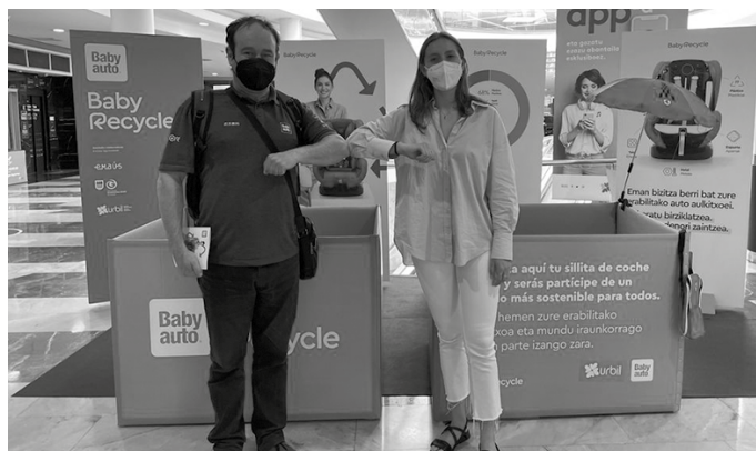
Kanpaina honekin plastiko kutsadura eta ingurumen-degradazioaren bizkortzea saihestu nahi da.

Segurtasun-eserleku zaharrak birziklatzeko aukera emateaz gain, haurrentzako aulkitxo bat erabiltzeari uzteko arrazoiak ezagutzearen eta