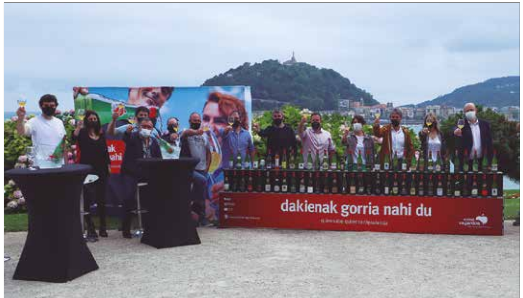
“Sagardoa botilan gozatzeko unea da”, adierazi zuten Euskal Sagardoa jatorri deituraren sustatzaileek.

Ezohiko txotx denboraldiaren eta pandemia garaiko sagardo kontsumoaren inguruko datu deigarriak eskaini zituen. Ateak itxi eta irekitzen ibili diren sagardotegiek %25ean lan egin dute aurreko urteekin alderatuta. Eserita kontsumitu