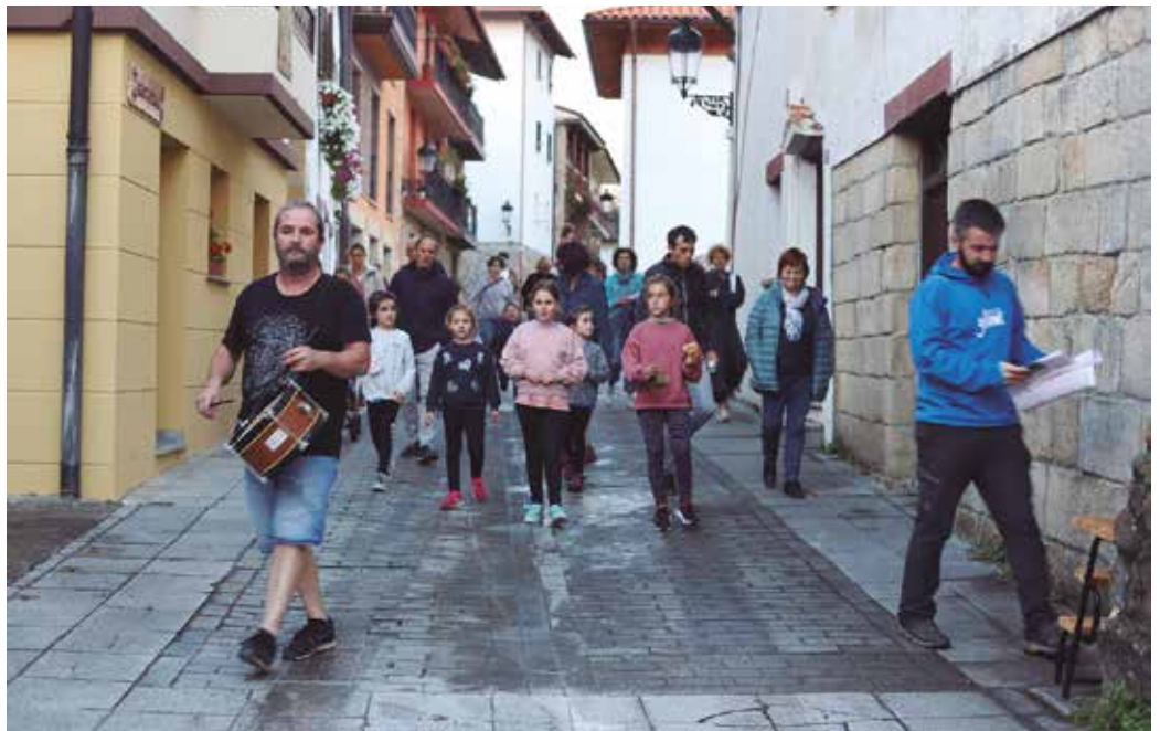
Errebaltxiki baserriaren parean hasiko da antzerkia. “Bere garaian, Belmonteren sarrera nagusia bertan zegoen”.

B. A.: Ez daude benetako pertsona zehatzak. Ikerketa lanean ere ez dira izen konkretuak agertzen, ez behintzat garai hari lotuta. Garaiko lanbideak antzeztuko ditugu, eta orduko giroa nolakoa izan zitekeen ere bai. Erregeen izenak eta benetako datu historiko orokorrak benetakoak izango dira, garai historiko batean kokatzen delako Usurbilgo