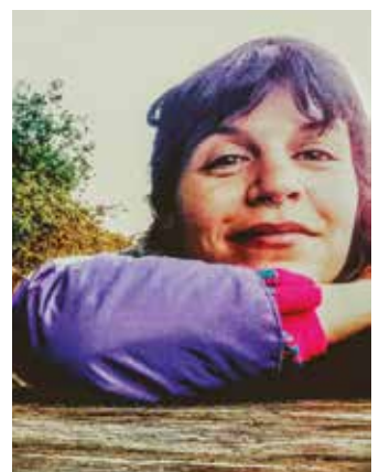
“Marrak” egitasmoa erakutsiko du.

politena. Gustatzen zaidan plaza horixe da, azokena. Zizurkilgo azokan egon nintzen duela gutxi. Beste artisau batzuk ezagutzen dituzu, kontaktuak egin, beste harreman goxoago bat dago hor.