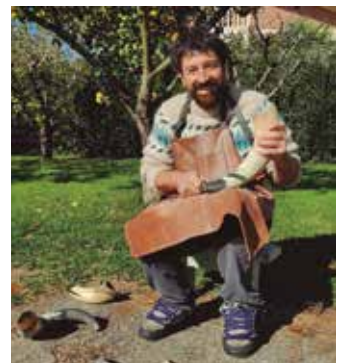
“Jotzeko adarrak egiten ditut”.

Usurbilen bizi naiz baina berez lantoki fisikoa gurasoen