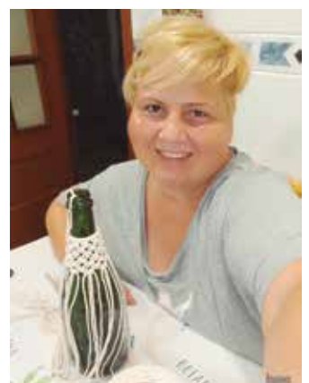
Birziklatutako materiala baliatzen du.

Bigarren bizitza ematea da goela etxean erabiltzen ditugun ontziei edo edozer gauzari. Gustuko dut oso kalera joan eta txakurrarekin buelta bat ematea. Bat-batean ikusten ditut, urteak daramatzat hala, itxura oneko belar batzuk. Hartzen ditut, lehortzen utzi, bere tratamendu txiki bat