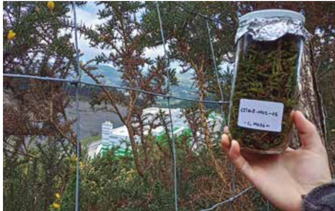
Hirugarren lagin bilketa bideratu zuten urriko bigarren asteburuan.

Zubietako Lantzen elkar- teak eta Erraustegiaren Aurkako Mugimenduk 2019an ekin zioten egitasmo honi, herritarrek “crowdfunding” bidez eta zenbait erakundeek diruz lagunduta. ToxicWatch fundazioari enkargatu zioten Zubietako erraustegiaren biomonitorizazio ikerketa egitea, “herritarrek ezin direlako fidatu ez erraustegia kudeatzen duten enpresen eta ez Gipuzkoako agintarien kontrol- letan; enpresak eta agintariak denak saltsa berean nahastuta baitaude, geroztik Arkaitzerrekan zientzian arrain hil zi-