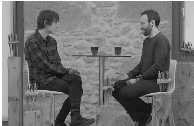
“Gure Esku Dago sortu zenean, unibertsitateko ikasketak bukatuta neuzkan eta banuen herrigintzan parte hartzeko gogoia”.

Gure Esku Dago erabakitze-ko eskubidea autodeterminazio