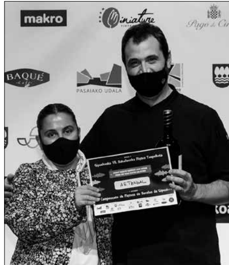
Artzabal jatetxeak eta Bordatxo edaritegiak sari bana jaso zuten.