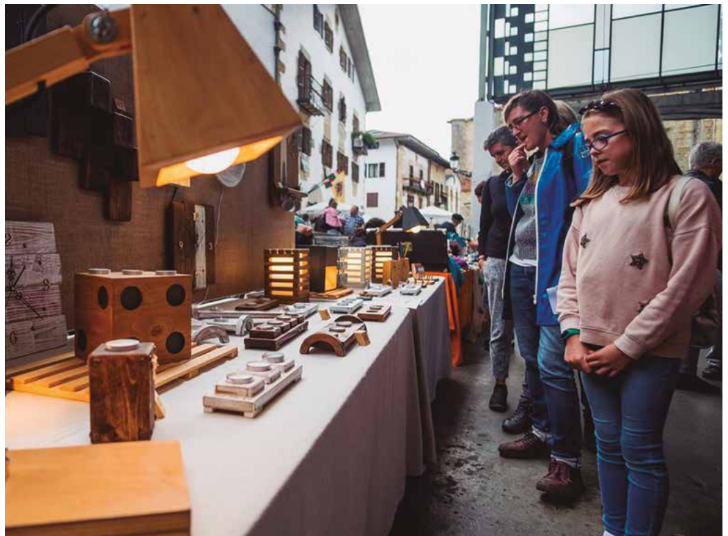
Pozik da antolakuntza, aurtan bai, Artisau Azoka egitea ahalbidetu dielako osasun krisialdiak. Irudia 2019koa da.

Pozik da antolakuntza, aurtan bai, denetariko artisauak biltzen dituen hitzordua egitea ahalbidetu dielako osasun krisialdiak. Ohi bezala, herriko nahiz Euskal Herriko txoko ezberdinetatik etorritako artisauen postuek girotuko dute azaroko lehen eguna. “Bixigintza, larrugintza, egur lanketa, beira, keramika, otargintza, metalgintza, harriak, ukenduak, makramea, pilotak, haziak...”, denetariko postuak iragarri ditu antolakuntzak, tartean lerrootan elkarriketatu ditugun hiru herritarronak.