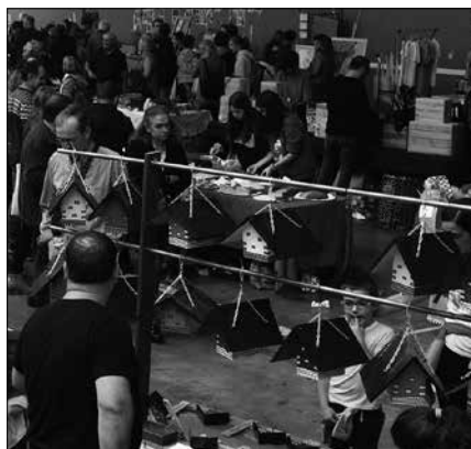
Datorren astelehenean, azaroak 1, artisauen postuekin beteko da Usurbilgo frontoia.

Ohi bezala, herriko nahiz Euskal Herriko txoko ezberdinetatik etorritako artisauen postuek girotuko dute azaroko lehen eguna.