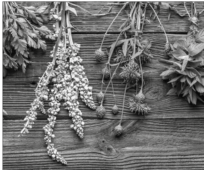
Ikastaroa azaroaren 5ean hasiko da.

■ Izena emateko bi telefono zenbaki dituzue eskura: 670 027 731 edo 615 715 991.