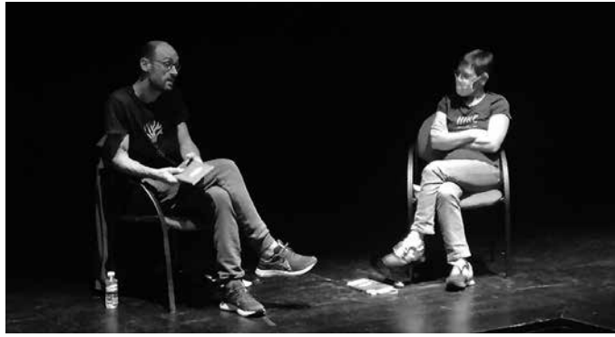
Urriaren 20an, migrazioa izan zuten hizpide "Miñan" liburuaren aurkezpenean.

G aurkotasun handiko gaitza ekarri zuen Sutegi udal liburutegiak, urriaren 20an kultur-etxeko auditorioko oholta gainera; Europarako bidean muturreko baldintzetan migranteek egin behar duten bidaiak latz, amaigabe, oztopotsua, kasu batean baino gehiagotan, helmugara bidean bizia galtzeraino eramatzen dituen bidaiak.