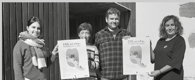
NOAAU!, Etumeta AEK euskaltegia, Udaregi Ikastola, Udala edota hainbat norbanakok osatzen dute Euskararen Aholku Taldea.

“Hikaratu, beldurrik gabe!” aldarrinean hitanoaren ezagutza eta erabilera sustatzeko ekintza sorta iragarri du Euskara Aholku Taldeak datozen asteotarako. Horietako bat, aldizkari honetan bertan iragarritako hitanoari buruzko ikastaroa duzue. Baina hitzordu gehiago ere badira, aipatu herri bilgunitik iragarri dutenez. “Hikalagun dinamika sustatzea edo gazteekin lanketa berezia egitea. Horrez gain, Euskararen Egunerako, abenduaren 3rako,