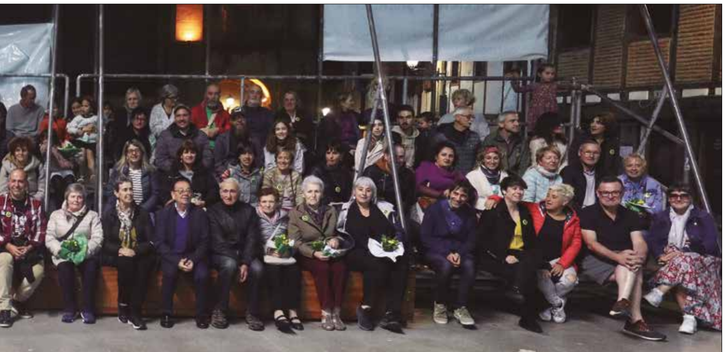
...a zen baita, mende laurdeneko NOAUA!Fest ospakizuna. Herriak babestu eta sustatu zuen larunbat arratsaldeko

Euskara indartu nahian Sortu zen aldizkaria Herritar askori esker Gertatu zen miraria Sinesten genuelako Atera zinen kalera Geroztikan abenturak Etenik gabe aurrera Segi ezazu horrela Noaua joan-da-etorritz Beste hogeitabost urte osatu itzazu neurritz (bis) eta orduan kantura etorriko gera berriz.