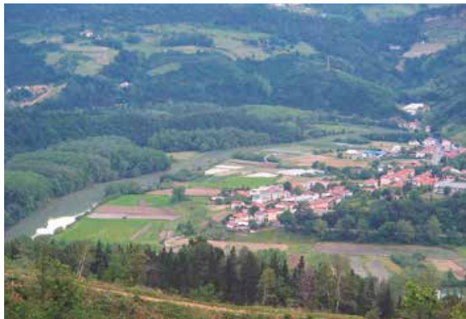
XVI. mendean, ontziola bat baino gehiago zegoen Aginagako erriberan.

Lur eremuotan bestalde, “sagardo asko ekoizten zen”. Baina historialariak bereziki goraipatzen duena, garai