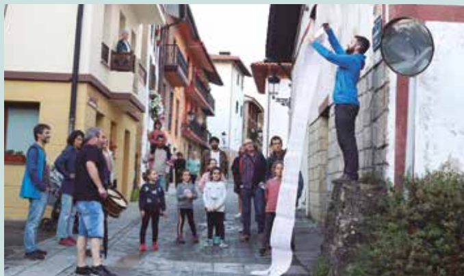
Azken asteotan buru-belarri aritu dira entseatzeko. Errebaltxiki baserriaren parean hasiko da antzerkia.