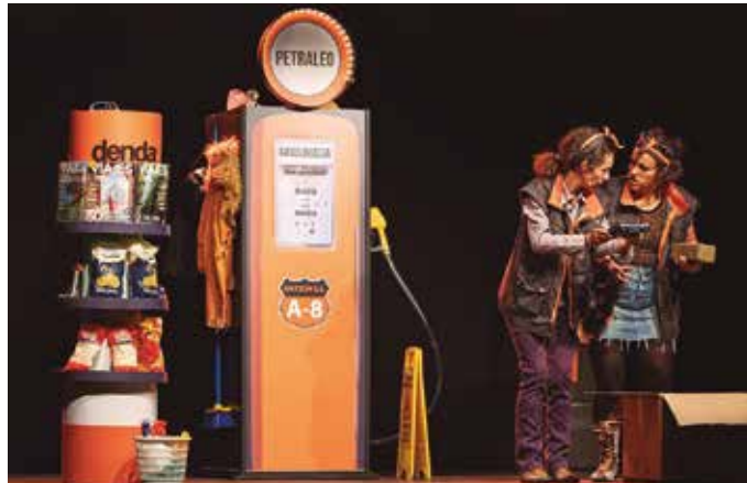
Azaroaren 12an, 'Bete ingoiau' antzezlana erekin hasiko da Kulturaldia.