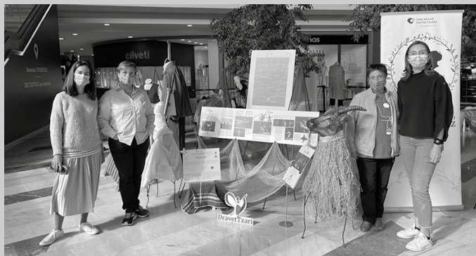
Azaroaren 10era arte bisitatu ahal izango da merkataritza-guneko elkargunean.

Urbil merkataritza-guneak Gero Axular Kultur Taldea eta Apoyo Dravet dantza ikuskizunetarako soilik diseinatutako euskal jantzi tradizionalen erakusketa zabaldu du. “Euskal kultura