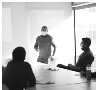
Datu jakingarriak jaso zituzten ostiral arratsaldeko ikastaroan.