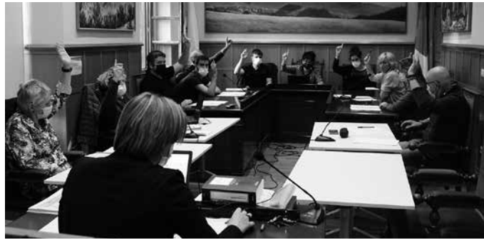
Urriaren 28ko plenoan, besteak beste, Ertzaintzaren eta Udaltzaingoaren arteko lankidetzaren hitzarmena berritzea erabaki zen ahobatez.

Añarbeko behe kanalaren alternatiba eraikitzeke lanak lehenbailehen egiteko eskaera Eskari hau urriaren 28ko osoko bilkuran aho batez onarturiko mozio bidez bideratu zion udalbatzak, Espainiako Gobernuko Trantsizio Ekologikorako eta Erronka Demografikorako Ministerioari. Lanok 2022rako Estatuko Aurrekontu Oroko-