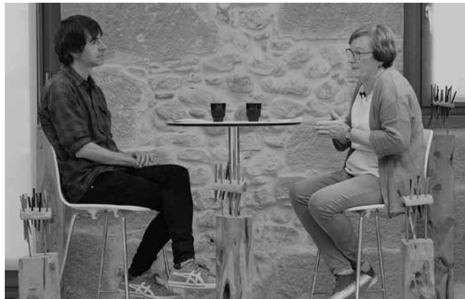
“Min handia dago alde guztietan. Hori dena jasotzea zaila da. Hasteko, bizirik dagoelako. Bizirik eta gordinegi”.

Presoa Estatuarentzat karta bat da. Orain nabarmenago ikusten ari gara zer karta diren. Frantzia eta Espainian daudden gobernuak behar batzuk dituzte eta laguntza batzuk behar dituzte politikoki beren programak aurrera eramateko. Nahikoa begi bistakoa da zergatik hasi diren sozialistak gerturatze horiek egiten. Kasu batzuetan Euskal Herrira ekarri dituzte, baina gehienak oraindik gerturatzean geratu dira.