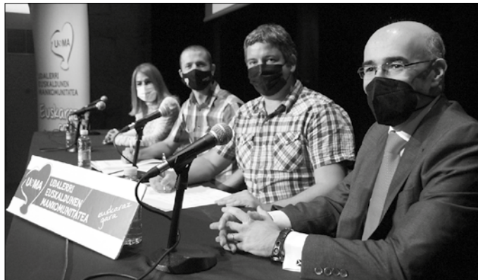
Usurbilgoa izan da konpromisoarekin bat egin duen udaletako bat.

Udalen eta finantza entitateen arteko harremanetan, finantza entitateen bulegoetako hizkuntza irizpideetan, langileen hizkuntz ohituretan edota banka elektronikoa euskara lehenesteko konpromisoa erdietsi dute hitzarmen bidez, Udalerri Euskaldunen Mankomunitateko (UEMA) 44 udalerriek eta