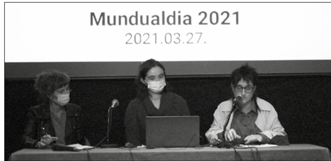
Usurbilgo Udalak bide-orri bat diseinatu du.

Bide hau halere ez dute bakarrik egin nahi, bidelagun izan nahi dute herria, jatorri ezberdineko herritarrak eta eragileak. “Argi duguna da zuekin batera egin beharra daukagula” bidea. Horretara