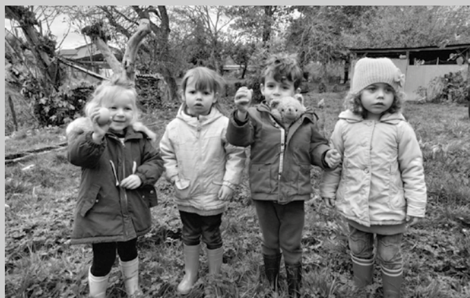
Bardozeko ikastolako atea 2020ko irailean zabaldu zirenean.

Proiektuarekin aurrera jarraitzeko lanean dihardute.