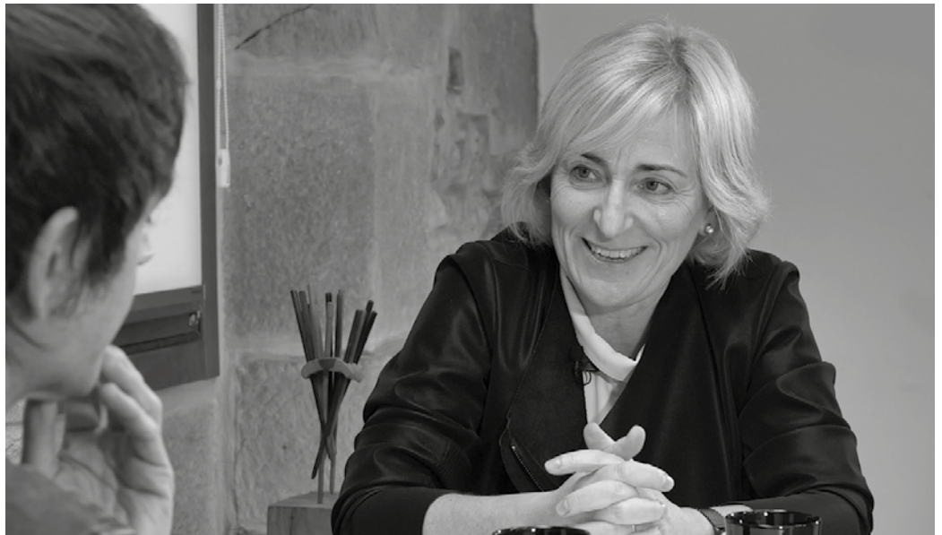
Zinegotzia izateaz gain, eraikuntza enpresa batean egin du lan. “Momentu honetan lan asko daukagu”, azaldu digu.