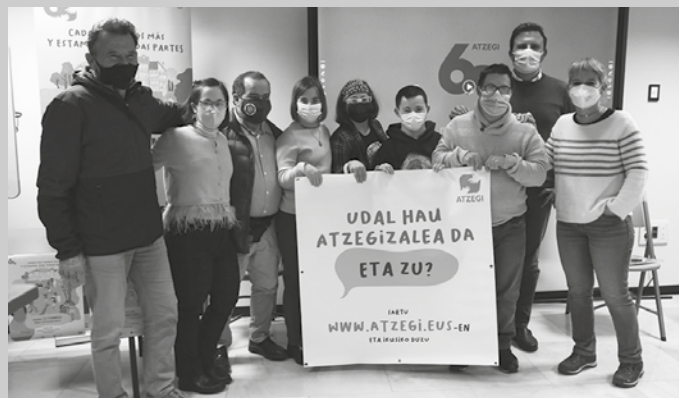
"Urte hauetan zehar Atzegizale komunitatea hazi egin da".

Atzegizale izan daiteke boluntarioa den edo Atzegi