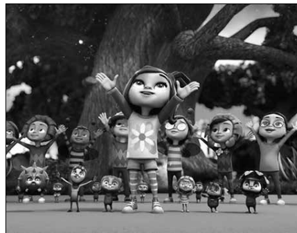
Film proiektzioa 17:00etan hasiko da. Sarrerak aurretik eskuratu behar dira.

rez eskuratu ahalko da usurbilkultura.eus plataforma bidez.