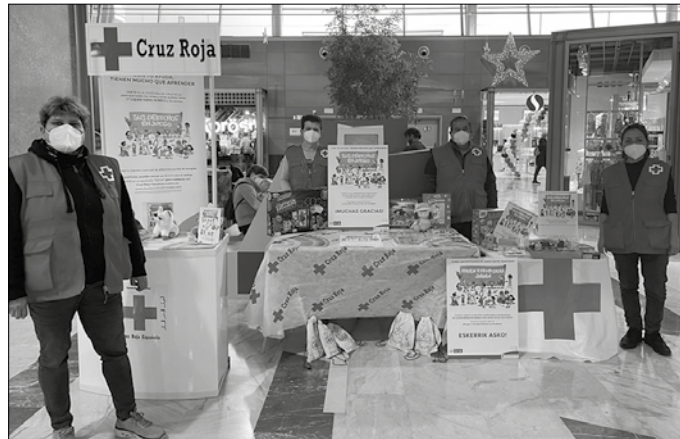
Urbilek eta Gurutze Gorriak jostailuak biltzeko gune bat jarri dute Eroski hipermerkatuko kutxen parean.