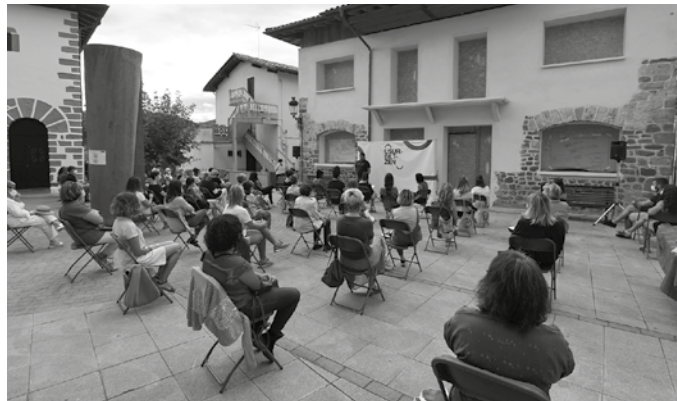
Udal aurrekontu berria Pelaiotena eraikinaren amaierako lanak aurreikusi dira.

Udal gobernu taldetik ziotenez, Covid19ak eragindako pandemiak eta haren ondorio sozioekonomikoei baldintzatu-tako udal aurrekontuak izango dira honako hauek bigarren urtez. Lehenetsun argi bat izango dutena beste behin; "herritar eta kolektibo zaugarrienak babestea", asteotan herritar eta eragileekin auzoz auzo eginiko bilera errondan nabarmendu izan duten moduan.