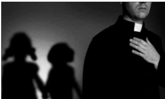
"Frantziako elizgizonek sistematikoki abusatzen zuten haurrez, Jean Marc Sauv k dioenez".