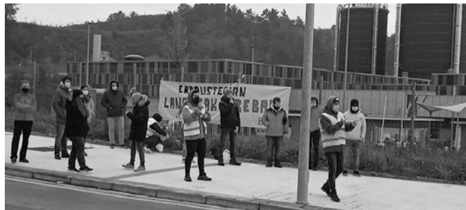
Lanaldi amaigabeak jasan behar dituzte. “Kasu askotan, etenik gabeko txandak 12 ordura arte luzatzen dira”.

Zubietako erraustegian beharrean dauden langileen egoera prekarioa agerian utzi nahi izan du ELA-k ohar bidez. “Laneko segurtasun eta osasun arloko neurririk eza etengabea da lan-