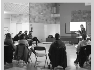
Hogei bat pertsona elkartu ziren Udarregi Ikastolan.

Behin taldeka ideia batzuk zehaztuta, gainontze-koekin partekatu zituzten ideiak, eta ondorio orokorrak atera zituzten.