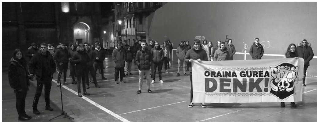
Gazte Eguna atzeratu eta frontoian mobilizatu ziren aurreko astean, “Oraina gurea denk!” aldarripean.

Osasun krisialdiagatik larunbatean ospatzekoa zuten Gazte Eguna atzeratu eta frontoian mobilizatu zen Aztarrika Gazte Asanblada “oraina guria denk!” aldarripean. Gazteen egoerak pandemia honetan okerrera egin duela salatu zuten, gazteak topagune baten beharrean direla aldarrikatzearekin batera.