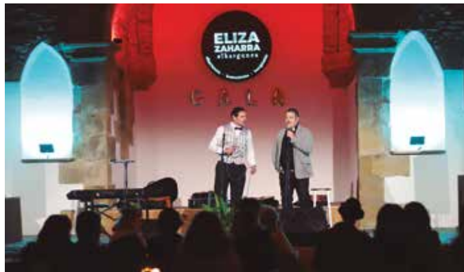
Musikaz, bakarrizketez eta magia gozatzeko aukera izan zuten larunbatean.