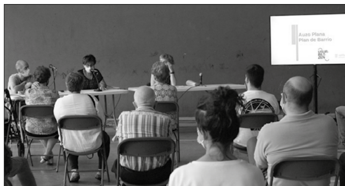
Abenduaren 2an eta 11n egingo dira auzoaren inguruko irteerak.

Auzoa aztertzeke bi txango egingo dituzte: galdetegian aipatutako gaietan sakonduz, auzoaren azterketa zehatzago bat egitea da asmoa. Lehena abenduaren 2an izango da, ostegun-egun, 18:00etatik aurrera; bigarrena, berriz, abenduaren 11n,