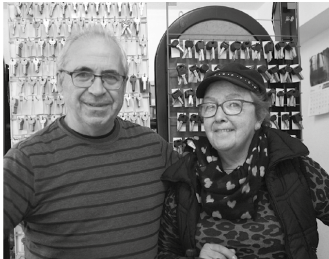
“1986ko Usurbilgo jaietan ireki genuen, zapata denda gisa”.

Orkoi, Aritzeta eta gu. Lehen jendea ez zen hainbeste