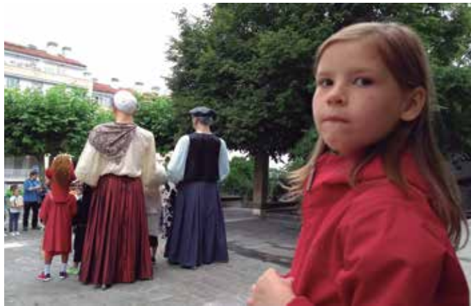
“Biki hiru urtez etorri izan da Usurbila. Osasun krisialdiko azken bi urteotan ezin izan da etorri. Halere berarekin hartuemanetan jarraitu dugu”.

Etxe oso oinarrizkoak dituzte, prekariorak. Putzu bat dute, eta handik hartzen dute ura. Askok ez dute etxeetara ura era-