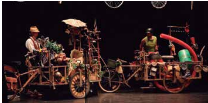
Martxoaren 17an Turukutupa konpainiak 'Reziklantes' ikuskizuna eskainiko du.

ren 'Reziklantes' ikuskizuna kalean. Hondakin-materialak berreskuratu eta birziklatu ondoren, proposamen artistiko bihurtzen dituzte. 'Reziklantes' kontzertua ibiltaria da.