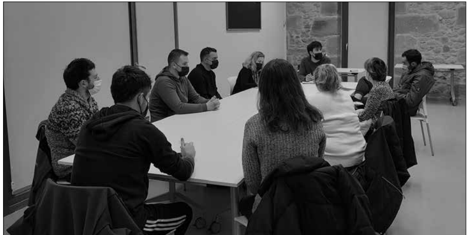
Jai Batzordea aurreko astean batu zen lehen aldiz. Martxoaren 28an bilduko dira berriz, Potxoenean.

Eusko Jaurlaritzak osasun larrialdi egoera indargabetu ondoren, herriko festen ohiko ereduraz itzultzeko aukera mahai gainean jarri du udalak. Martxoaren 2an eginiko bileran, herriko eragileek bat egin zuten udal proposamenarekin. Beraz, aurrean ez da Kultur Birarik izango, “baina horren zenbait alderdi ohiko ere-