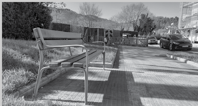
Auzoko jesarleku guztiak aldatu dira, lehen zeudenak ez zirelako irisgarriak.

Idazketa proiektua esleitu-ta, “proiektua idazteko bizpahiru hilabete behar dira,