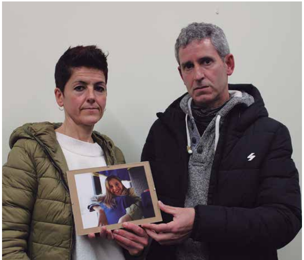
“Duela bost urte ume bat harreran hartzea erabaki genuen udan. Biki hiru urtez etorri izan da Ukrainatik Usurbila”.

Ukrainak 40 milioitik gora biztanle ditu. Guk ezagutzen dugun eskualdeko hiriburua Ivankiv da, 10.000 biztanlekoa. Inguru horretan gehienak etxe multzoak dira, ez dute herri egiturarik. Eskualde hau, Kievetik 100 bat kilometrora dago, iparraldean, Txernobil sartu ezin den eremuko perimetro horrekin mugan. Ukraina barruan baldintza okerrenetan dagoen eskualdea da. Eskualde hau hiru aldiz kolpatua izan da. Batetik, pobrezia handian bizi dira. Bigarren kolpea Txernobilgo istripua izan zen eta