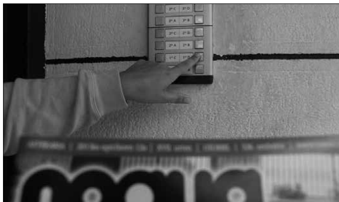
“Azken kapituluan aurkeztuak izan ziren zenbat pasadizok izango ote dute jarraipena NOAUA! #900 kapituluan?”.

Iraganeko hutsegiteak al- ferrik konpon daitezke egun, eta zama horrekin bizi behar izan dute proiektu honeta- ra bildu dituzten idazleek. Sonata bat lau eskuetara jo badaiteke, sinfonia amaiezin hau auskalo zenbat eskutara jo ote den. Animaleko zo- rakeria. Hala eta guztiz ere, eta irakurleak senti dezakeen furia eta antsia nigana jaurti aurretik, utz iezadazu nire arrazoiketa hemen argitara- tzen.