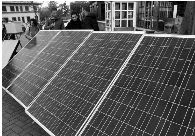
“Badirudi elektrizitate konpainiek nahita egiten dituztela oso faktura zailak, behar bezala ez ulertzeko”.

Beraz, oso garrantzitsua da jakitea zer ordaintzen ari garen. Normalean, fakturari lotutako