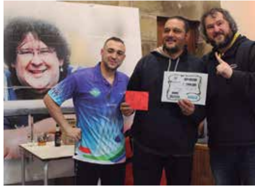
Dardo zaletuen topagunean bilakatu zuten martxoaren Sean, Aginagako Eliza Zaharra. Gipuzkoako Kopak ia ehun bat lagun bildu zituen.