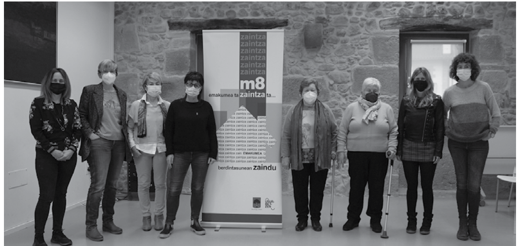
“Zaintzak begirada, ertz asko ditu eta ertz horiek guztiak barnebilduko lituzkeen prozesu bat abiatzen saiatu gara”.

Orain arte jorraturiko bidearen balantzea plazaratu dute egunotan, egitasmo honen sustatzaileek. “Zaintzak begirada,