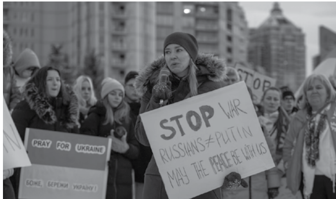
“Gerra eragin zuzena izaten ari da gasaren prezioan eta, ondorioz, elektrizitatearenean ere bai”.

Udan antzeman genuen hori, batez ere, gas gutxi badago, bere prezioa handiagoa da, nahitaez. Beraz, nahiz eta energia berriztagarria izan berdin berdin gasaren prezioaren parean egon behar du prezioak, eta horregatik, gasa izan edo energia berriztagarria izan, prezioak oso antzekoak dira. Beste arrazoietako bat sortzailerek behar dituzten ziurtagiri batzuei lotuta dago. Sortzailerekin CO2 egiaztagiriak behar