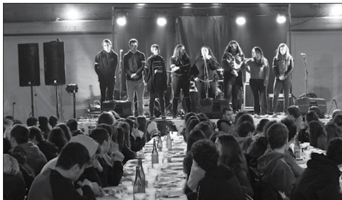
Gazte Eguna bueltan da. Ekitaldi ugari antolatu dituzte asteburu honetarako.

Herriko gazte mugimenduen aterpea izan nahi du egoitza berriak; “gune autogestionatua, herriko gazte guztiena, eragileena, kohesiorako espazio bat herriarentzat, eragile guztiek erabiltzeko. Edozein