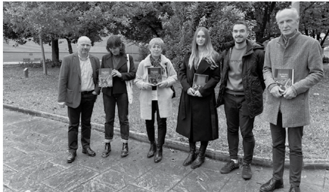
Larunbat honetan, eguerdiko 12:00etan aurkeztuko dute liburua Sutegin.