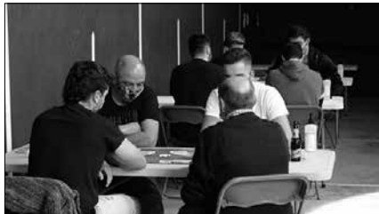
Larunbat honetan, arratsaldeko 16:30ean Aitzaga elkartearen. Izen-ematea 16:00etan hasiko da.

Bestalde, jokatzeko da oraindik 2020ko edizioko final handia. Osasun krisialdiak bitan atzerarazi duen hitzor-