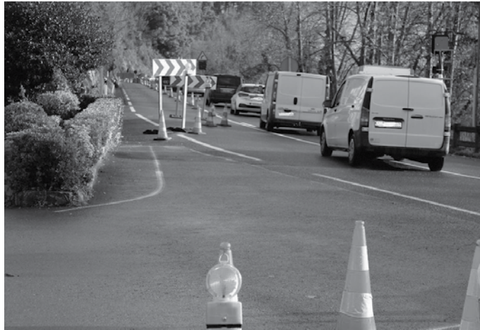
N-634 errepidea Troiako aldaparekin lotzen duen bidegurutzeari konpontzen hasiko dira aste honetan.

Otsailaren 18an hasi zituzten Troia eta Txikiardi arteko errepide zatia hobetzeko lanak. Ezustean, jakinarazi gabe, trafikoan ilara luzeak eraginez. Hasiera batean, martxoaren 4an amaitzea zen Gipuzkoako Foru Aldundiaren aurreikus-