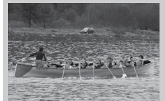
Otsailaren 19an Oriaren Traineru Jaitsiera egingo da.

■ Probaren ibilbidea: 6 kilometrokoa Mapiletik Oriara eta 4 kilometrokoa Saikolatik Oriara.