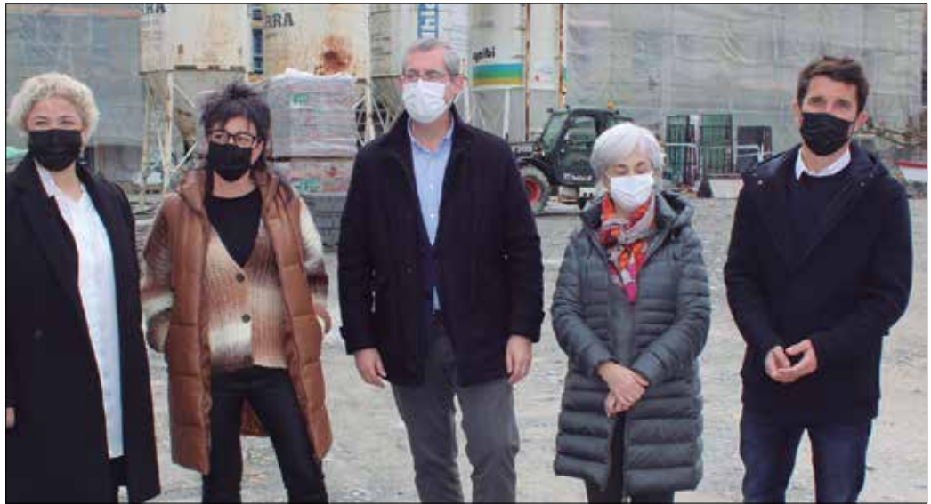
Matia, Usurbilgo Udala eta Foru Aldundiko ordezkariak bisita gidatu batean hartu zuten parte aurreko astean.

Elkarbizitza unitate txikiagoak, arreta pertsonalizatua, egoiliarren autonomia eta komunitatearekin lotura zuzena. Hortxe nagusiki, egitasmo aitzindari eta berritzaile hau sus-