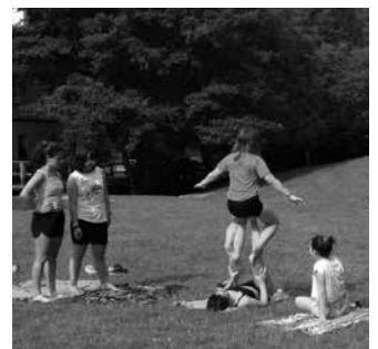
"Salto" udalekuak ekainaren 27tik uztailaren 3ra izango dira eta izena emateko epea zabalik da jada.