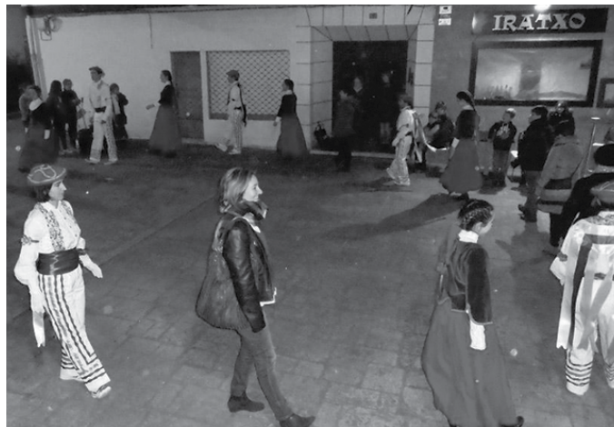
Inauteri Jaiaren bezperan, Orbeldi Dantza Taldekoekin Uztaritzeko Inauterietako dantzak egingo dituzte. Otsailaren 25ean, ostiralarekin.

■ 18:00 Burrunbazale txarangarekin kalejira. Mozorrotuta, karroza hartu eta gorputza astintzeko gogoz bazaude ez galdu kalejira!