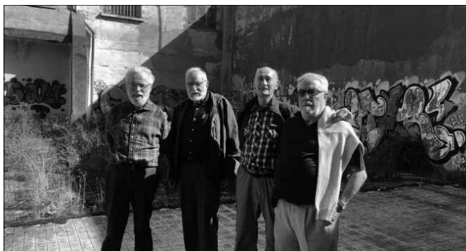
"Ehun bat apaiz euskaldun pasa ziren Zamorako kartzela hartatik".