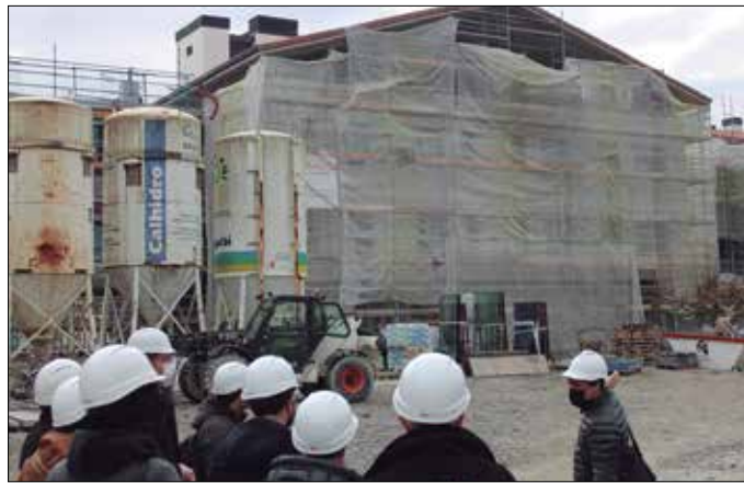
Matiak estreinakoz “arreta eredu berri bat martxan jarriko du” Kalezarren.

Nabarmendu zuenez, Matiak estreinakoz “arreta eredu berri bat martxan jarriko du” Kalezarren, “halabeharrez hona etorri behar izan duten pertsonak etxean bezala senti daitezen lortzeko”. Zaintza ekosistema berri bat dakar Kalezarren eraikitzen ari diren adinekoen auzuneak. Udalak Aldundiarekin batera estrategia oso bat diseinatu duela gaineratu zuen. “Traupen luzeko zainketen sostengarritasuna bermatzea helburu duen ekosistema bati buruz ari gara, Usurbilen errota, oinarri komunitarioa duena. Pertsonen nahiak aintzat hartzeko bokazioa duen ekosistema bat da, etxeetara bideratua, edota etxeak bezalako alojamenduak sortu nahi dituen”. Eredu horretan kokatu zituen bai adinekoen auzune berri hau nahiz handik hurbil Ugartondon eraikitzen ari diren belaunaldi arteko etxebizitza komunitarioa ere, Txirikorda.