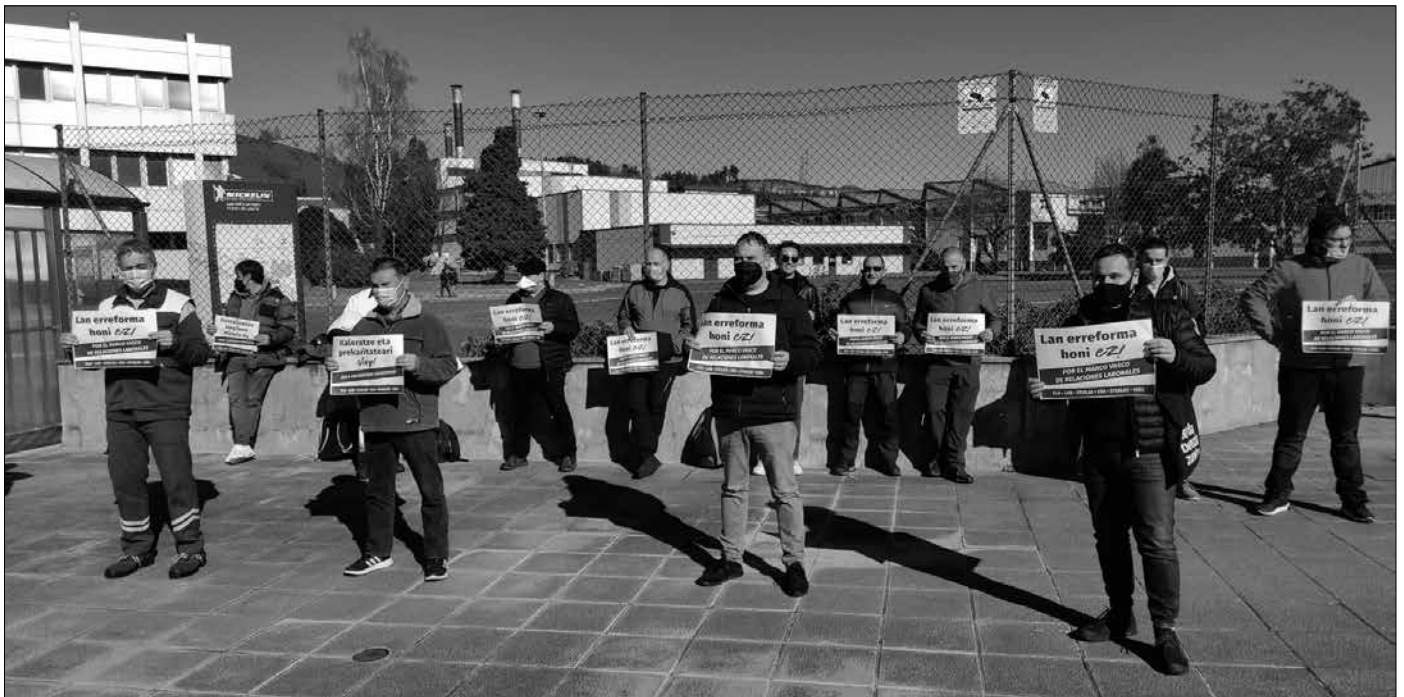
Espainiako Gobernuak lan erreforma onartzeko bezpera, haren aurkako mobilizazio eguna izan zen otsailaren 2a Hego Euskal Herrian. Euskal gehiengo sindikalak deitutako manifestazio eta elkarretaratzeak egin ziren hiriburu eta herrietan. Tartean, Michelinen.