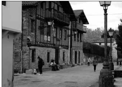
Bilera bat antolatu dute ostiral honetarako. Arratsaldeko 17:00etan, Kaxkapen.

Zubietan talde bat osatzeko asmoa dago eta horren harira, bilera bat antolatu