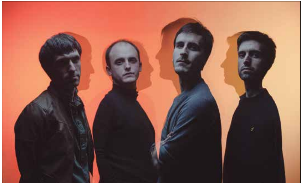
“Badaude kanta batzuk Odolaren Mintzoaren adierazgarriak direnak baina beste batzuk ez”.

Eboluzio baten parte da. Denborarekin esperientzia hartzen zoaz eta gauzak hobetzen ahal den neurrian. Eta abesti berriak ateratzen diren unetik hor nobedadeak badaude. Estiloan jarraipen bat dagoen arren, gure zalea izan denak jakingo du aztertzen badaudela ñabardura asko. Badaude kanta batzuk Odolaren Mintzoaren adierazgarriak direnak baina beste batzuk ez. “Singela” entzunda oso poperoak bilakatu garelako dirudi. Baina kanta hau, “Azkenak” izenekoa ez da diskoaren erakusgarri bat inondik inora ere. Abestietan ere jauzi kualitatibo bat ere bada, bai teknikoki jotzeko orduan. Erritmoetan bizitasun gehixea dago. Odolaren Mintzoa landuago eta helduago bat ikus daiteke. Erlojuz kontra gabiltza zuzenekoa prestatzen. Kostatzen ari zaigu, konposizio batzuk desberdinak baitira, landuagoak eta gehiago exijitzen digu instrumentu jottzaile gisa.