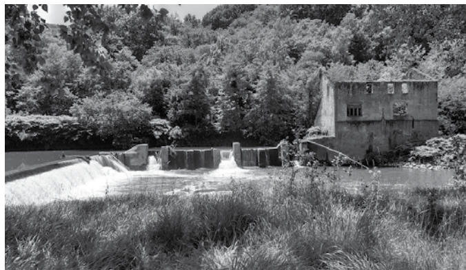
Ostegun honetan egingo da batzarra, hilak 10, Sutegin.

Ibaien ekologian nazioarteko aditua, Artikutzako urtegia hustutzearen ondorioen ikerketaren zuzendaria eta ekologian