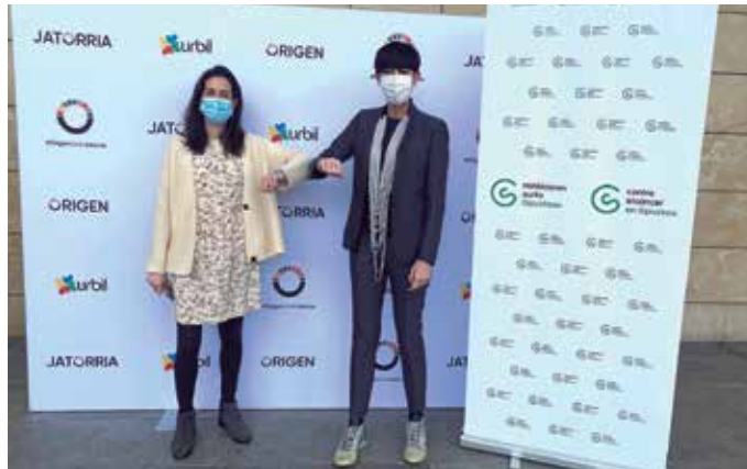
Martxoaren 7ra arte erakusketa bat egongo da zabalik Urbilgo modaren gunean.

Hitzarmen honek elkartei laguntzeko hainbat ekintza biltzen ditu, minbiziaren inguruko prebentzioan, informazioan eta kontzientziazioan eragiteko eta baita gaixotasun hau pairatzen duten pertsonen eta euren familien bizi-kalitatea hobetzeko ere.