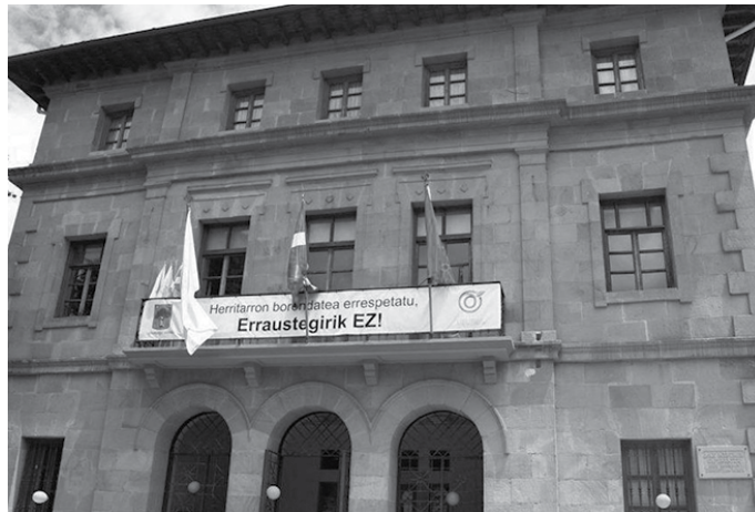
Udaletxean edota telematikoki eska daitezke hobarien inguruko informazioa.

Bizikidetzaren unitateek, kide kopuruaren eta diru-sarreraren arabera, %50eko, %75eko edo %90eko hobariak eskura di-