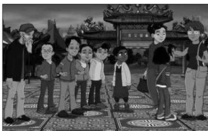
'Nur eta Herensugearen Tenplua' filma, igandean arratsaldeko 17:00etan Sutegin.

Sinopsia: "Nur gurasoekin Txinara bizi zera doa. Lagun berriak ezagutzen dituzten bertan eta haietako baten, Guo Guoren urtebetetzea ospatzeko eguna da gaur. Jolas-parke erraldoi batean jarri dute biltzeko hitzordua. Jolasten ari diren ar-