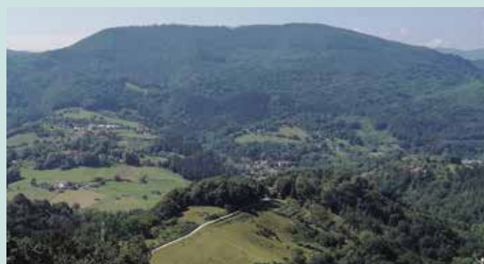
“Parkeak batik bat Zizurkilgo eremuari eragingo lioke”, Udalaren esanetan.

garkia Eusko Jaurlaritzaren Ekonomiaren Garapen, Jasangarritasun eta Ingurumen