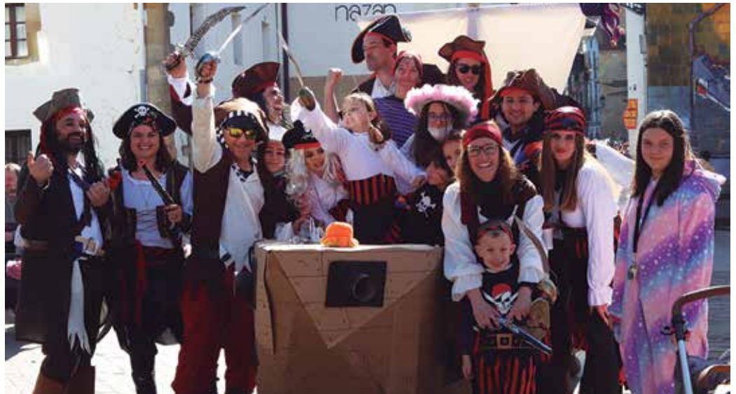
Mozorro eta kolore festa erabatekoa izan zen larunbatean, Inauteri Festan.

Arratsaldean, Burrunbazale txaranga ibili zen herriko kaleetan zehar. Jende ugari jarraitu zuen kalejira, giro ederrean. Frontoian amaitu zuten ibilbidea.