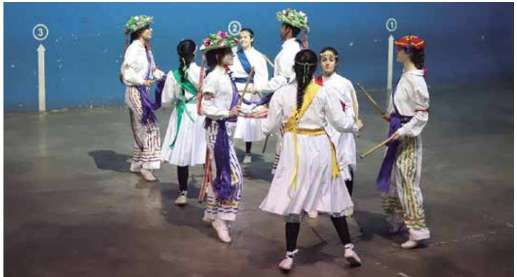
Kiroldegitik abiatu zen ostiraleko kalejira eta frontoian eskaini zuten azken emanaldia.

Kiroldegitik abiatu ziren 19:30ak inguruan eta Artzabalgo plazatik igaro ondoren, Sagardo Plaza bertuan egin zuten bigarren dantzaldia. Frontoian egin zuten azken emanaldia 20:30ak aldera.