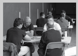
Martxoaren 12an, Aitzagan.