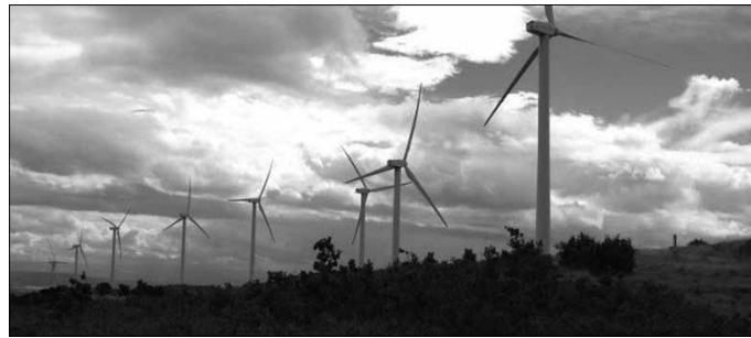
“Azpiegitura hauen ingurumen-inpaktua handia da, parke eolikoetan hiltzen diren hegazti kopuru handiak adierazten duen moduan”.

Energia berriztagarrien azpiegiturek ere, ingurumen eraginak dauzkate, eta parke eolikoek bereziki jasangaitzak dira ikuspegi horretatik. Landa eta natura-eremuetan ezarri nahi dituzten industria-instalazio hauek berekin dakarte ekosistemak desgaturatzea bideak eta beste azpiegiturak zabaltzean. Hauek eraikitzeke behar di-