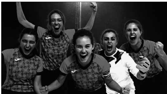
“Aurpegi gogortasunak hotzikara sortzen dit. Hori al da emakumeek indarra erakusteko edo irabazi izana ospatzeko modua? Gizonek bezain maskulinoak izan behar al dugu?”.