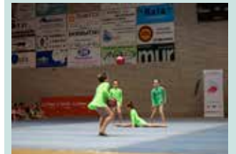
Apirilaren 11tik 13ra eta 19tik 22ra, Gimnastika kanpua egingo da Usurbilen.

Informazio gehiagorako info@tximeleta.eus helbidera idatzi.