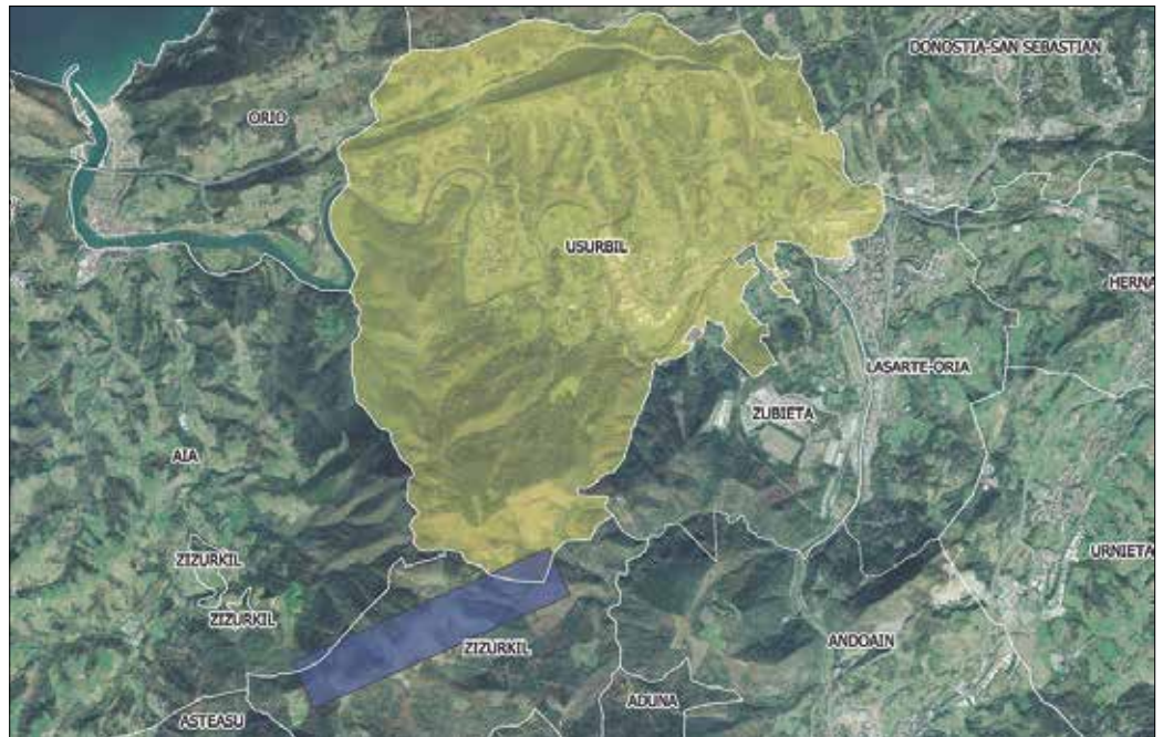
Andatza hegoaldean kokatzen da Ezkeltzu, 508 metroko garaiera duen mendigunea. Urdinez, parke eolikoaren balizko kokagunea.

Aurretiazko administrazio-baimenaren eskaera aldiz, “Green Capital Development XLIV SLU” izeneko enpresak biderratu du. Egoitza Madrilen du. Argindarra sortzen dihardu lanean, “energia berriztagarriak”