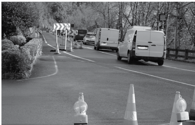
Troia eta Txikiardi arteko babes-horma berritutakoan, bestelako lanak hasiko dituzte Troiako sarrera-irteera inguruan.

Aldundiak Udalari jakinarazi gabe ekin zion Troia-Txikiardi arteko obrari. Errail baten bapateko itxierak beraz, ezustean harrapatu zituen usurbildarrak. Hamabost eguneko kontua izango zela jakin zuen gero Udalak.