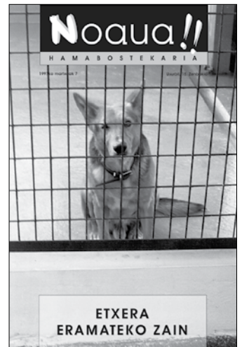
1997ko martxoaren 7ko azala.

Aurtengoan bezala, duela 25 urte ere, Korrika herritik pa- satzekoa zen euskara eta AEK euskalategiei bultzada emateko. Gertaera horri buruzko informa- zioa eskaini zuten, zein ordutan pasatuko zen eta zein taldek parte hartuko zuten. Euskarari bultzada emateko beste egitas- mo bat ere martxan jarri zuten, Zuberoako Eperra ikastolari la- guntza emateko diru-bilketa.