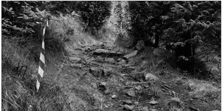
Hilketa kasu bat izan litekeela uste du Ertzaintzak.

Andatza inguruan paseatzen ari zen mendizale baten txakurrak eman zuen gorpuarekin eta honi segika topatu zuen txakurraren jabeak hildakoa. Herritar honek eman zion abisua Ertzaintzari. Hainbat iturriren arabera, hilotzak eskuak lotuak zituen eta baita indarkeria zantzuak ere.