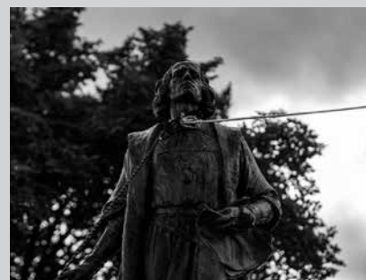
Nafartarrak taldeak antolatu duen hitzaldia Sutegin egingo da.