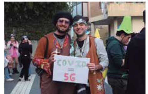
Argazkietan ikus daitekeen moduan, irudimena nagusi izan zen. Larunbat arratsaldean Burrunbazale txaranga ibili zen kalejiran.