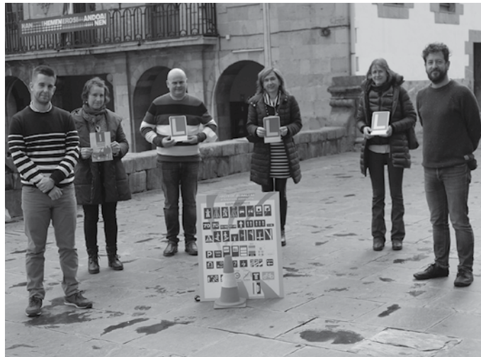
Iaz gidabaimena euskaraz ateratzeko hautua egin zuten herritarren artean 400 euroko 9 sari zozketatu zituzten Buruntzaldeko Udalek.