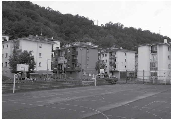
Diru hori “irisgarritasun eta mugikortasun arazoei aurre egiteko” baliatzea proposatu du zinegotzi sozialistak.

Usurbilek 208.334,98 euro jasoko ditu Covid-19 funtsetatik eta beste 6.228,18 euro Estatuko zergen ekarpenetatik. “Pedro Sánchez buru duen gobernuak hitzeman zuen bezala, udalerriei zuzenduko zaizkie zergen bidezko ekarpen horiek, herritarren bizitza hobetzen laguntzeko”.