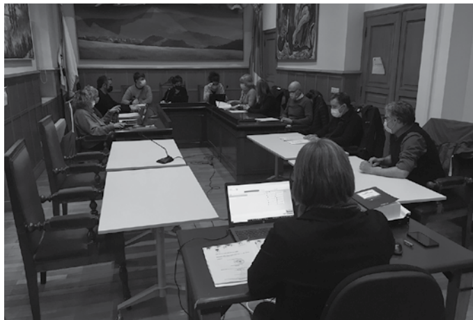
Otsaileko ohiko plenoa aurreko ostegunean egin zen.

EAJ-PNV “Hiru legealdi egin ditugu gai honekin (Hiri Antolamendurako Plan Orokorrarekin), eta ez dugu egoki ikusten”