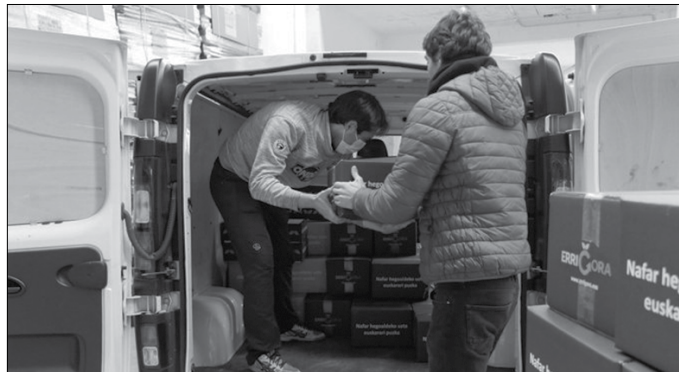
Eskaerak orain egin behar dira. Produktuak maiatzaren 10eko astean iritsiko dira.

Asteotan eskatutakoa jasotzeko 200 bat banaketa gune ditu Errigorak; Usurbilen NOAUA! Kultur Elkartearen egoitza. Eskaerak online egiterakoan, puntu hau hautatzeko aukera duzue. Produktuak berriz, maiatzaren 10etik 13ra jaso