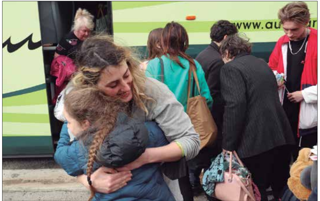
Une hunkigarriak bizi izan ziren iragan astean Osinalden, Aizpurua Autobusak enpresaren egoitzan.

Slava Ukraini zioen Aizpurua lantegiko autobusa izan genuen arretagune nagusi martxoaren 15ean. Osinalde industriagunera heldu zenean, barrura begiratu, eta bidaiariak agur eta txalo artean ikusi ahal izan genituen. Zorritzarrez ez ziren inguru hau ezagutzera etorritako turistak, bonba hots artetik ihesi joan behar izan zuten ama, amona, haur edota gaztetxoak. Gizonetzko gutxi. Denak, sorterria behartuta utzi behar izan dute, bizirik segi ahal izateko, atzera euren etxeetara inoiz bueltatzerik izango ote duten jakin ezinik.