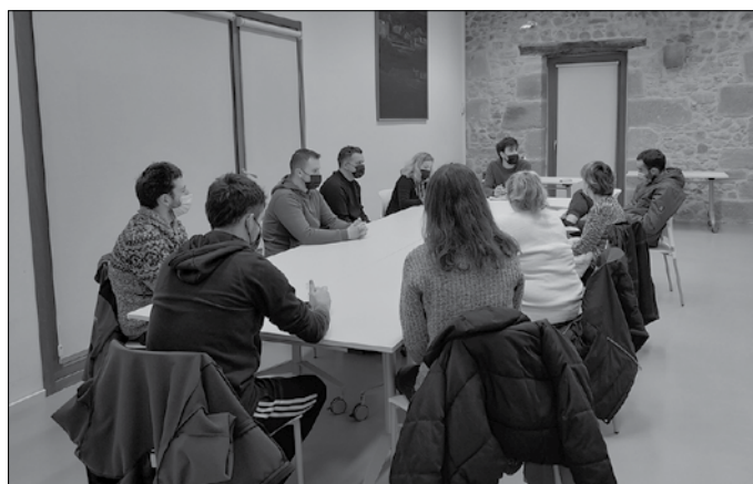
Martxoaren 28an astelehena, arratsaldeko 18:30ean batuko dira Potxoenean.

Jaiak, aurtengoan, ekainaren 29tik uztailaren 3ra ospatuko dira.