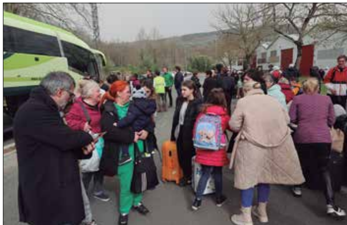
Euskal Herritik ere lagundu daitekeela ohartarazi digute; diru ekarpenak eginez, harreran familiak hartuta...