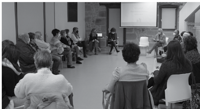
Udal ordezkariak eta herritarrek Potxoenean batu ziren martxoaren 16an.

Usurbilgo zaintza ekosistema berrian komunitateak izan dezakeen zereginaz hausnartzeko bilera irekia deitu zuten herritarrekin martxoaren 16an Potxoenean. Gogoan izan, diagnosis landu ostean, inplementaziorako bide-orrria diseinatzeko hasiak dira. Horretarako lau lan talde osatu asmo dituzte; horietako bat herritarrekin.