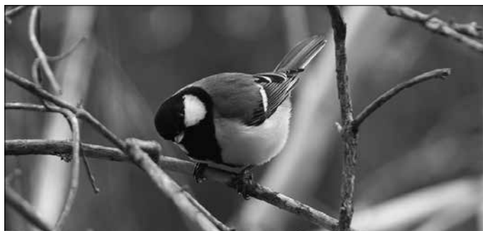
“Aitonak erakutsi zion, inguruan zuen landare eta txori iheskorak ezagutzearen berezitasuna”.