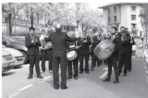
Araiako musika banda (behean, eskubitara) arduratu zen Soinurbil asteburua borobiltzeaz.