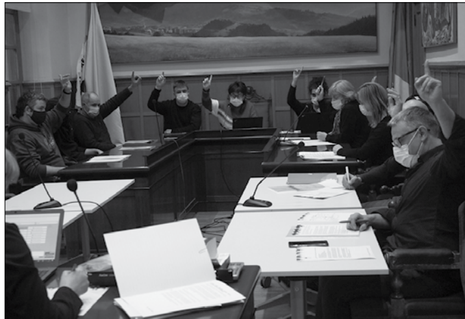
Borrokak berehala eten eta tropa errusiarrak Ukrainatik erabat erretiratzea eskatu du udalbatzak aho batez.

Errusiako Federazioari galdegiten dio “nazioarteko legedia errespetatzeko, armak baztertzeko eta bide diplomatikoetara itzultzeko”. Adierazpen honen bidez iragarri duenez, “Larrialdi Humanitario honi erantzuteko laguntza bat” onartzeko da Udala. Europar Batasunari Ukrainarentzat “beharrezko laguntza finantzarioa eta humanitarioa eskaintzea” eta ahalegin handiagoa egitea eskatzen dio, “kudeaketa diplomatikoen