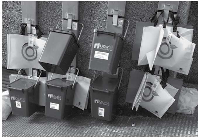
“Datuok Usurbilek gaikako bilketarekiko duen konpromiso irmoa erakusten dute”, Udalaren esanetan.

1 3 urte bete ditu atez ateko bilketak. 13 urteotako gaikako bilketa datu onena izan dela 2021ekoa jakinarazi du Usurbilgo Udalak. Usurbilgo Udalak jakinarazi duenez, “inoizko gaikako bilketa mailarik onena” lortu zen iaz; %87,27koa. 2009an martxan jarritz geroztik (%71koa zen bilketa urte hartan) koxkatxo bat gorantz egiten segi du urtero. Datuok “Usurbilek gaikako bilketarekiko duen konpromiso irmoa erakusten dute”, Udalaren esanetan.