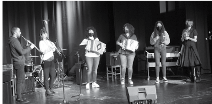
Jende asko batu da Soinurbil zikloaren baitan antolatutako ekitaldietan.