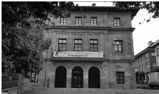
Udal diru-laguntzak eskatzeko epea ixtear da.

■ Informazio gehiago: Martxoaren 18ko Gipuzkoako Aldizkari Ofiziala.