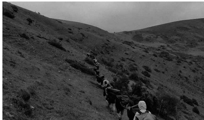
Aurre izen-ematea egiteko galdetegi bat bete beharko dute gurasoek.

Aurre izen-ematea egiteko galdetegi bat bete beharko dute gurasoek. Gehiagotan kanpaldian izan diren haurren gurasoek automatikoki jasoko dute mezua korreo bidez. Hala jaso ez dutenek eta interesa dutenek, ziortzakanpaldia@gmail.com helbidera korreo bat bidali beharko dute galdetegia eskatuz. Ondoren, galdetegia jasoko dute erantzun gisa.