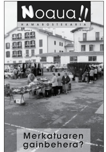
1997ko apirilaren 4ko azala.

Udaletxean, berriz, aho batez onartu zuten NOAUA! beste urtebetez usurbildar guztiei banatzea, eta hala jarraitu du gerora 25 urtetan.