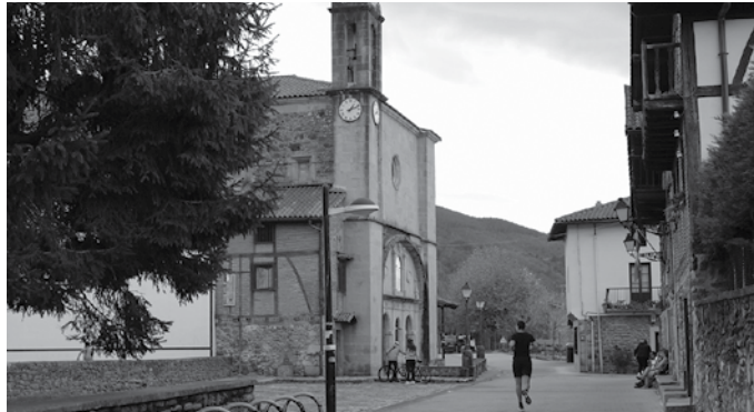
Donostiako Udalarekin batera Herri Batzarraren eraginkortasunari buruzko gogoeta bat egitearen alde agertu zen Usurbilgoa.

Donostiako Udalarekin batera Herri Batzarraren eraginkortasuna gogoeta bat egitearen alde agertu zen. “Balía dezagun aukera hau guk ere etxeko lan horiek egiteko”. Usurbilgo Udaletik laster, alkateak iragarri zuenez, “gogoeta bat abiatu nahi dugu udal barruan auzo ordezkariekin batera, udal eta auzo zein herrien arteko funtzionamendua iraunkortu, egonkortu eta arautzeko”. Helburu argia du Udalak: “auzo