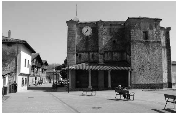
Kasu berezia da Zubietakoa. “Bakarra Gipuzkoan eta Euskal Herrian, bi udalerriren artean berezia dagoen eremua baita”.

Historikoki antolakuntza modu propioa izan dutela gogorarazi zuten Herri Batzarreko kideek. “1376an Zubieta unibertsitatea zen, bere zergak eta guztia kudeatzen zuten”. 600 urte beranduago ere “1976an zergak kobratzen ziren”. Gerora, zubietarren borrokari esker 1996an hauteskunde