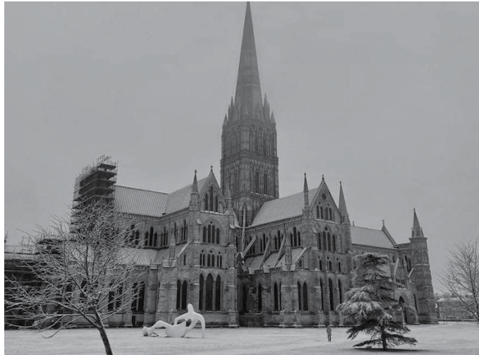
Brexit-a baino lehen han zen bizitzen. Horri esker, “bost urtetarako baimen bat lortu nuen. 2024 hasieran amaituko zait”.

Ez daukat inolako zailtasunik. Brexit-a onartu zutenean jada hemen nongoen bizitzen 2016an. Brexit-aren arau berriak martxan jarri zirenean, dokumentu bat lortu nuen erakusten zuena Brexit-aren prozesua hasi aurretik ere hemen bizi nintzela. Jada hemen nongoenez, modu legal batean ezin naute herrialdetik bota. Dokumentu bat bete behar izan nuen erakusteko 2016a baino lehenagotik nengoela herrialdean. Bost urtetarako baimen bat lortu nuen horrela, eta 2024 hasieran amaituko