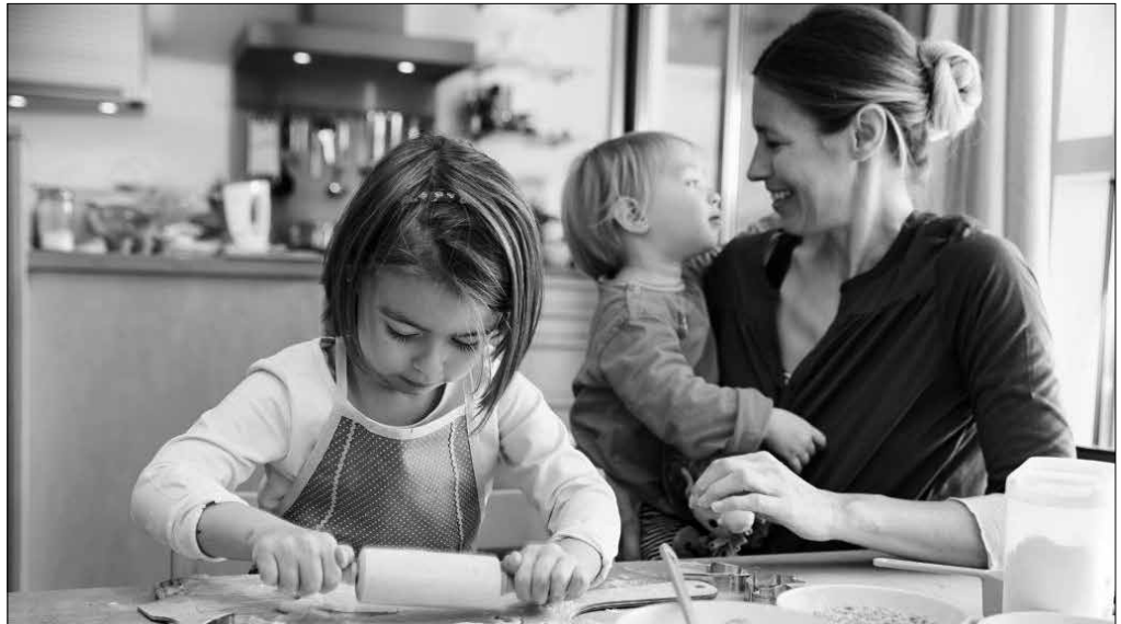
"Umeak zaintzeko eszedentzia bukatzean 'lanera itzuli naiz' esaten dugu, ordura arte etxean umeekin egindakoa lana ez balitz bezala".