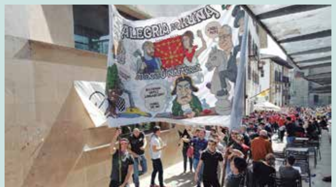
Iruñeko Peña Alegriakoak Usurbilen izan ziren larunbatean.

Martxoaren 26an herrian gertatzeko aukera izan zuenak jai giro betean murgiltzeko aukera izan zuten, Iruñetik etorritako bisitariekin. San Fermin jaietako Peña Alegriako kideak bisitan izan