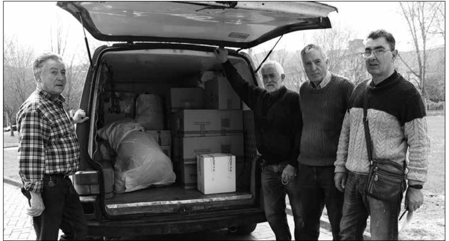
Gure Pakea denetarik oinarritzko gaiak biltzen aritu da azken asteotan Artzabalen duten egoitzan.

Batetik, haurrentzako higiene produktuak, pixohialak besteak beste. Elikagaiak; latak, barra energetikoak, beirazko ontzian egon ez eta galkorrak ez direnak. Azkenik, osasun zerbitzuetarako materiala: hesgailu esterilak, gazak, mantal kirurgiko esterilak, musuko kirurgikoak, arnasketa babesteko musukoak, iraungiak ez dauden sendagaiak.