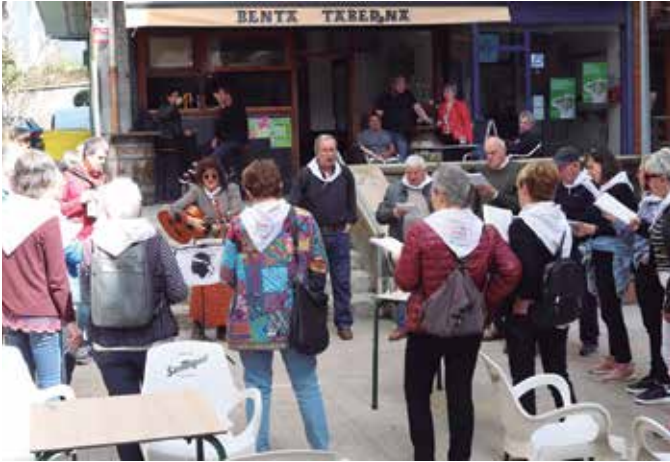
Abeslariak kaleak hartu zituzten eguraldi ezinhobearekin.

Larunbat goizean itzuli zen kantu-jira Usurbilgo kaleetara. Pandemiak gogor jo zuen taldearen egunerokoa eta bi urte beranduago izan bada ere, kaleak hartu zituzten abeslariak eguraldi ezinhobearekin.