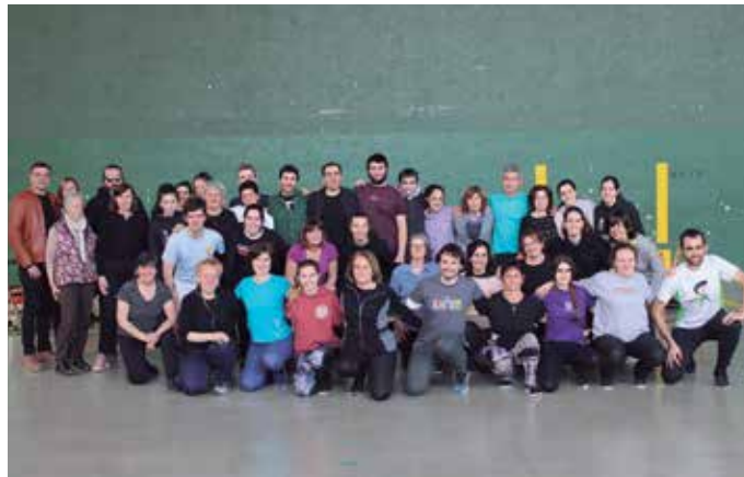
“Dantza erdigunera ekarri dugu”, adierazi diote NOAUA!ri Orbelditik, hamarkada honetako ibilbidearen balantzeaz galdetu ostean.