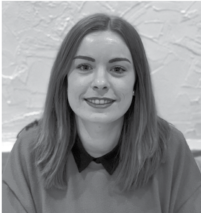
“Agentzia baten bidez etorri nintzen au pair gisa Ingalaterrara”.

2016an izan zen. Sei urte daromatzen hemen. 20 urte nituen orduan, eta lehen aldia nuen atzerrira bakarrik joaten. Ez naiz gogoratzen nola bururatu zitzaidan ideia hau, baina