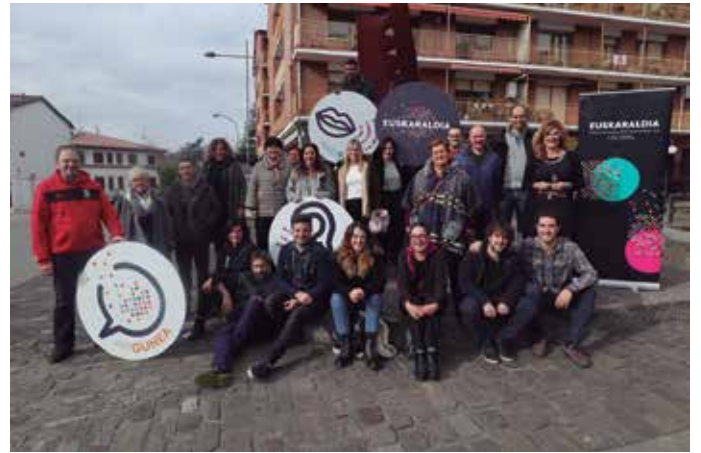
2020an, Usurbilgo hainbat entitatek Euskaraldiarekin bat egin zuteneko irudia.

“Hirugarren edizioa bigarrenaren jarraipen” gisatzat dute antolatzaileek eta aurten ere bi roletan aritzeko aukera izango dute 16 urtetik gorako euskal herritarrek: ahobizi edo belarriprest. Ariketa eraginkorra egite aldera, izen-ematea sinplifikatu dute. Hala, soilik, parte-hartzaile berriek eman beharko dute izena. Alegia,