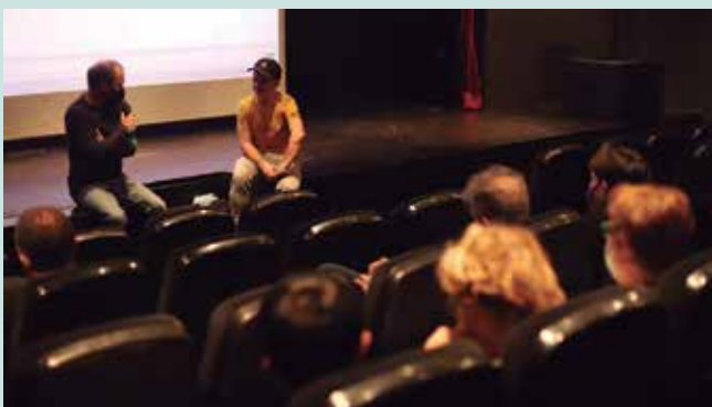
Filmaren zuzendariak amaierako solasaldian hartu zuen parte.