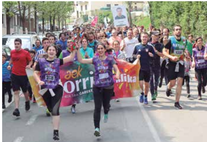
Korrikaren bueltan ekimen ugari iragarri dira.