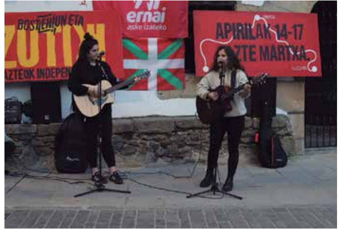
Herriko musikariek girotu zuten Ernaik antolaturiko ekitaldia.

Apirilaren 14tik 17ra Baztanen ospatuko den Gazte Martxa aurkeztu zuten Aitzaga aurrean ostiral arratsaldean. Baztanera joateko autobusak antolatuko dituzte eta nahi duten herritarrek parte hartzeko aukera izango dute.